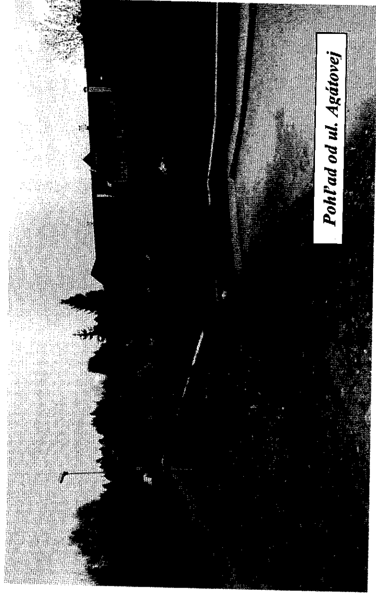
Pohľad od ul. Agátovej