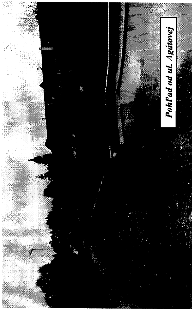
Pohľad od ul. Agátovej