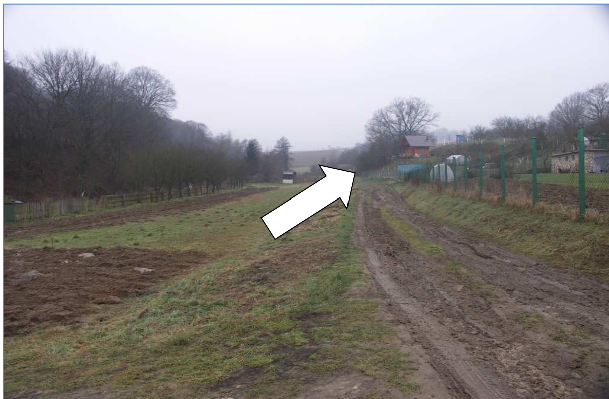
pozemok zarastený stromami za chatou