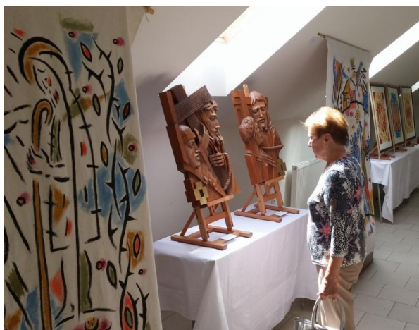
Výstava profesionálnych výtvarníkov z Nemšovej