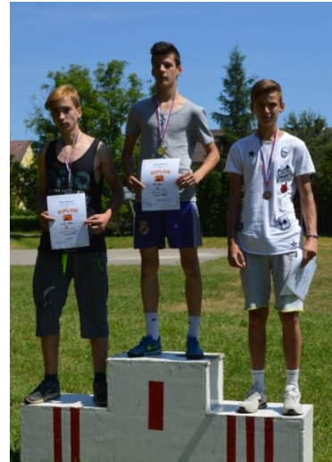
Zo športového dňa detí

Medzinárodný deň detí sa v meste začal oslavovať 28. mája v Ľuborči 4. ročníkom Cesty rozprávkovým lesom . Na trase od Základnej umeleckej školy Nemšová k nemšovskému rybníku a späť bolo pre deti pripravených 10 stanovísk, kde ich čakali rôzne rozprávkové bytosti, ako sú napríklad Bob a Bobek, zbojníci, Snehulienka, Shrek s Fionou či včielka Maja. V areáli ZUŠ Nemšová boli pre deti pripravené i vodné atrakcie a skákacie hrady. Po zábave sa mohli prítomní občerstviť v predajných stánkoch či opieť si pri ohnisku z domu prinesené dobroty. Cestu rozprávkovým lesom absolvovalo približne 220 detí, ktoré sprevádzali ich rodičia a rodinní príbuzní. Vydarený deň zabezpečovalo v spolupráci s mestom Nemšová viac ako 50 detí a dospelých z radov Základnej umeleckej školy a 117. zboru sv. Františka z Assisi Horné Srnie – Nemšová. Oslavy MDD pokračovali 1. júna , kedy mesto Nemšová pripravilo atletickú súťaž pre žiakov základných škôl v Nemšovej . Súťažilo sa v kategóriách: beh, hod kriketkou, vrh guľou a skok do diaľky. Najlepší atléti boli odmenení medailou a pamätným diplomom. Oslavy pomyselne ukončilo 8. júna predstavenie pre najmenších v Kultúrnom centre Nemšová, na ktorom si deti zatancovali a zaspievali so známou dvojicou Smejkom a Tanculienkou.