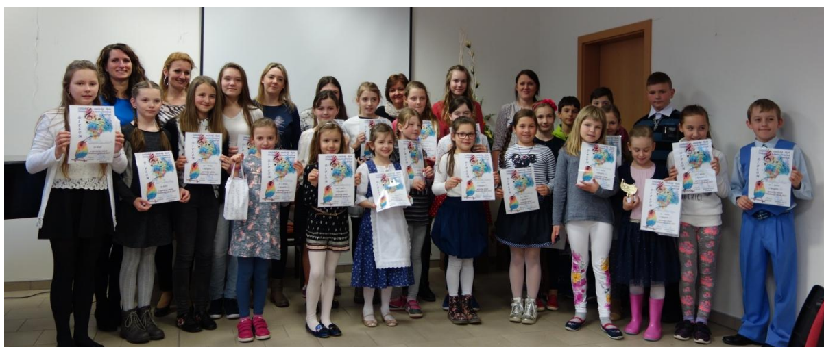
Nemšovský slávik 2017

Máj je pre základnú umeleckú školu charakteristický množstvom podujatí. Úvod patrilo dvom koncertom pre mamičky, ktoré v Nemšovej zorganizovali 14. a 17. mája učitelia hudobného a tanečného odboru. V dňoch 16., 17. a 19. mája sa realizoval DOD pre MŠ a 18. mája DOD pre verejnosť, následne po DOD 23. - 24. mája sa uskutočnili prijímacie skúšky, 25. mája sa