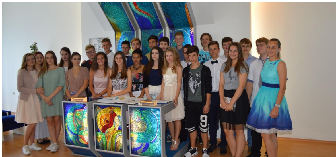
Absolventi ZŠ, Janka Palu 2