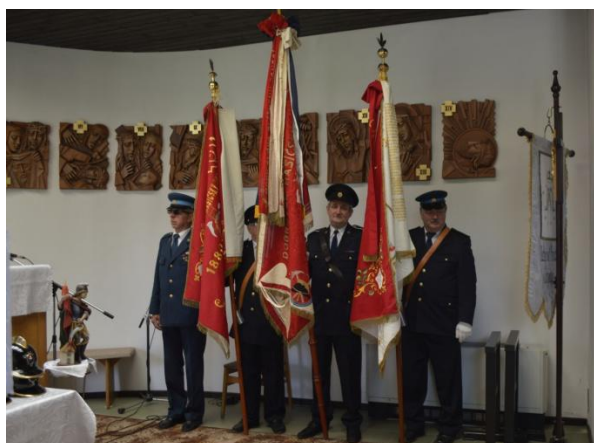
Oslava svätého Floriána v kaplnke Ľuborči

Tradične na Veľkú noc členovia DHZ spolupracujú na strážení božieho hrobu . Stráženie sa začína v piatok večer po slávnostnej omši a až do soboty 10.00 hod ho stráži DHZ Ľuborča, v sobotu od 10.00 do 14.00 DHZ Nemšová a od 14.00 do 18.00 DHZ Kľúčové. O 18.00 hod. sa začínajú pobožnosti zmŕtvychvstania Ježiša Krista, na ktorých konci cca po 20.00 hod. je slávnostný sprievod z kostola po priľahlých komunikáciách a späť do kostola kde hasiči asistujú a zabezpečujú dopravu. Dobrovoľnícke hasičské zbory z Nemšovej, Ľuborče a Kľúčového si spoločne 6. mája uctili slávnostnou svätou omšou v kaplnke v Ľuborči Svätého Floriána, patróna hasičov . Stretnutie sa organizuje každý rok v inej mestskej časti.