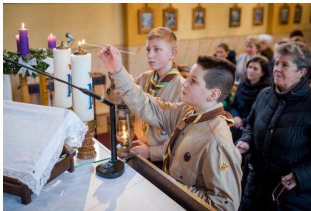
Betlehemske svetlo v kaplnke v Tr. Závade

Každoročne 23. decembra od rána putuje Betlehemske svetlo vo vlakoch po celom Slovensku. Do Trenčianskej Teplej si ho prišli odpáliť aj skautky 117. Zboru Františka z Assisi, priniesli ho včielkam a skautom do Nemšovej a do Horného Srnia. Poobede putovalo svetielko do kostola v Dolnej Súči. Na Štedrý deň ho skauti priniesli do kostolov, na filiálky vo farnosti Nemšová a do mnohých domácností.