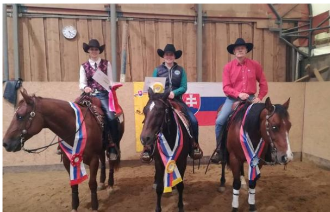
Majstrovstvá Slovenska v reiningu

V dňoch 24. - 25. júna a 5. - 6. augusta sa uskutočnilo medzinárodné westernové preteky – Reining a Cowhorse a dňa 23. – 24. septembra sa na Gazdovstve Uhliská stretli najlepší jazdci na majstrovstvách Slovenska v reiningu. Reining je jedna z najdôležitejších disciplín westernového štýlu jazdenia na koni. Často je popisovaná ako westernová forma drezúry, pretože pre správne vykonanie úlohy je potrebná dokonalá