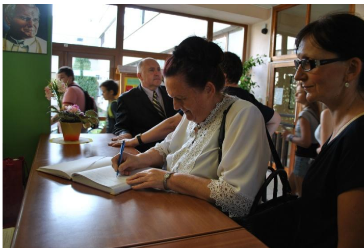
Obrázok 1 Z oslavy 25. výročia založenia školy