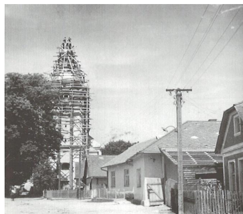
Historická fotografia z opravy kostolnej veže

Svoje 70. výročie oslávila okrem kaplnky v Trenčianskej Závade i veža na farskom Kostole sv. Michala Archanjela. V roku 1915 padla za obeť ničivému požiaru a po opravení v roku 1945 podľahla vojne a bola zostrelená. S jej opravou sa začalo v roku 1947 a odvtedy slúži veriacim v nezmenenej forme.