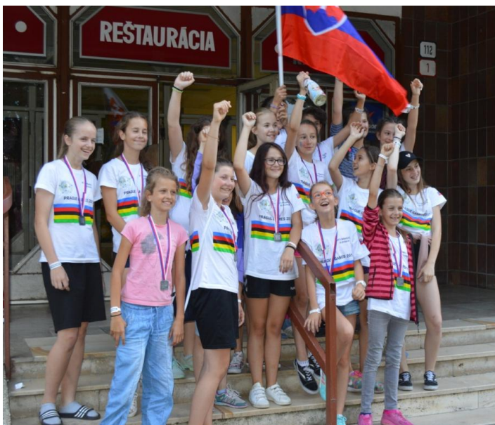
Návrat florbalistiek z Prahy

V kategórii dorasteniek G-16 skončili hráčky Nemšovej v skupine na 3. mieste a v ďalších bojoch porazili Sport Club Klatovy (Česko), ale následne prehrali s tímom Zug zo Švajčiarska.