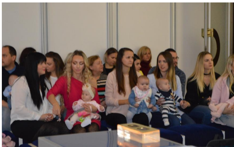
Vítanie detí do života

Zomrelo 73 obyvateľov, 33 žien a 34 mužov. Priemerný dožitý vek bol 71,5. Najstarší obyvateľ sa dožil 91 rokov a najmladší 25. Mestskú časť Nemšová navždy opustilo 51 obyvateľov, m. č. Ľuborča 8, m. č. Kľúčové a v m. č. Tr. Závada nezomrel v tomto roku žiaden občan.