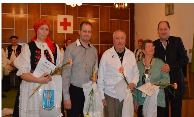
Odovzdávanie plaket dobrovoľným darcom krvi

Na výročnom zhromaždení členov v Kultúrnom stredisku Ľuborča dňa 19.