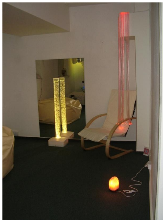
Relaxačná miestnosť SNOEZELEN

V priebehu dňa bola hosťom prezentovaná relaxačná miestnosť SNOEZELEN, ktorá bola dokončená v prvom štvrtroku tohto roka. Prítomní vyjadrili obdiv a uznanie, že zariadenie napreduje míľovými krokmi dopredu, a ocenili, že sa nadviazala spolupráca s úradom práce v Trenčíne.