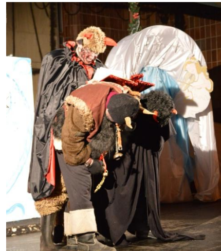
Vítanie sv. Mikuláša