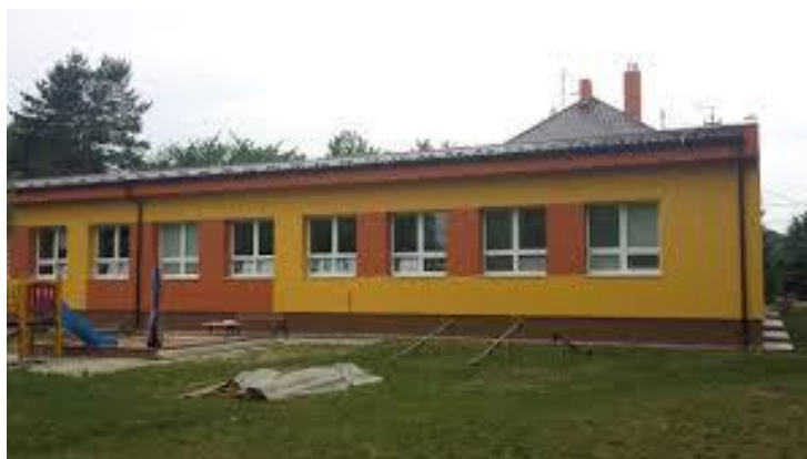
Zrekonštruovaná materská škola v časti Kľúčové

Projektu na zníženie energetickej náročnosti objektu MŠ na Trenčianskej ulici bol schválený nenávratný finančný príspevok z fondov Európskej únie a následne bola so Slovenskou inovačnou a energetickou agentúrou minulý rok podpísaná zmluva o jeho poskytnutí. V októbri minulého roka bola odsúhlasená dokumentácia súťaže verejného obstarávania na dodávateľa stavebných prác Slovenskou inovačnou a energetickou agentúrou. Pre nastávajúce zimné obdobie nastal odklad termínu začatia realizácie na apríl tohto roku. Rekonštrukčné práce začali dňa 3. apríla. Práce pozostávali z výmeny všetkých výplní okenných otvorov a otvorov zasklených stien, zateplenia obvodových stien, stropu najvyššieho podlažia, osvetlenie sa vymenilo za energeticky úspornejšie. K 31. máju boli všetky práce ukončené.