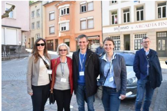
z medzinárodnej konferencie LINC