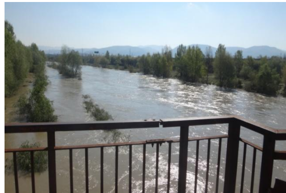
Zdvihnutá hladina Váhu na jar 2017 (pohľad zo železničného mosta)

Počasie vyčíňalo aj 23. júna, kedy počas búrky nevydržala nápor silného vetra veľká lipa na cintoríne v Ľuborči na Ľuborčianskej ulici. V priebehu roka sa na území mesta a v jeho okolí vyskytlo približne 21 búrok.