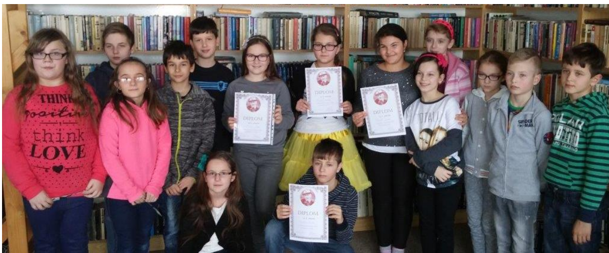
Hviezdoslav v knižnici