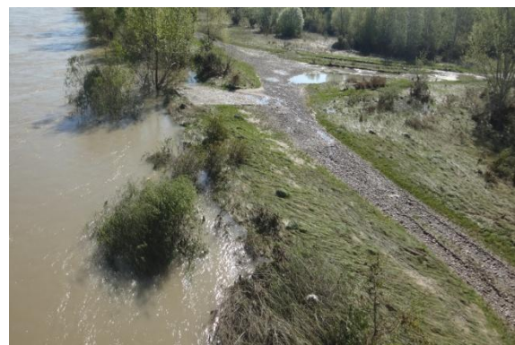
Váh počas klesania vody