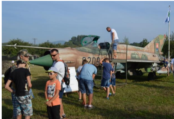
DOD počas nemšovského jarmoku

Základňa pravidelne organizuje dva dni otvorených dverí. Prvý DOD sa konal 2. júna a bol určený pre materské školy. Deti mali možnosť pozrieť si historickú techniku, ukážku strážnych psov a zasúťažili si v hode granátom a v preťahovaní lanom. Najšikovnejšie deti po krátkom nacvičení predviedli vojenský pochod pod velením príslušníčky útvaru a na záver boli odmenené medailou a sladkosťami. Druhý DOD sa pravidelne organizuje v piatok počas nemšovského jarmoku. V tomto roku