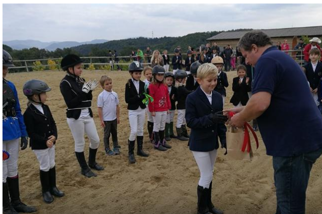
Finále štvorkolovej súťaže Benjamin cup 2017

V priestoroch areálu Gazdovstva Uhliská sa každoročne koná niekoľko súťaží: dňa 6. mája sa konalo prvé kolo Benjamin cupu a 30. septembra jeho finále (preteky pre licencovaných a nelicencovaných jazdcov a kone). Každé kolo sa skladá zo 4 súťaží: 1. Hobby drezúra 2. Parkur kavalety, 3. Parkur krížiky, 4. Parkúr 60 cm (výsledky sú uvedené kapitole Šport).