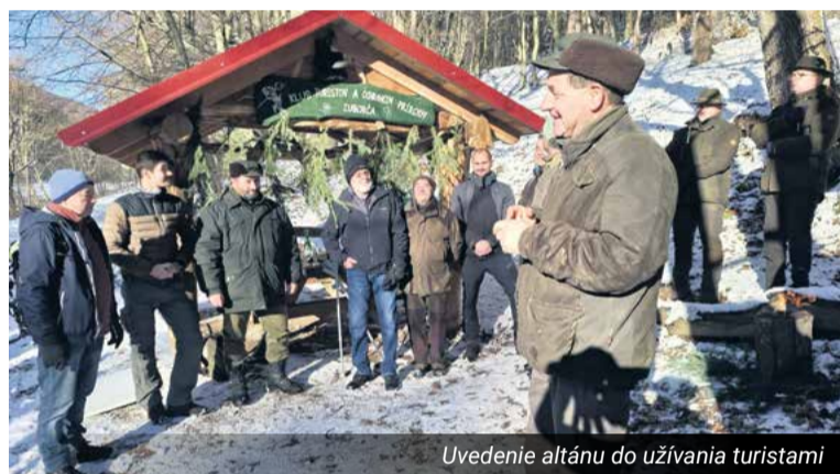
Uvedenie altánu do užívania turistami