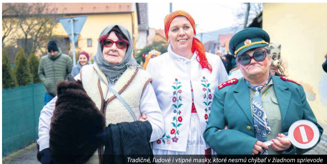
Tradičné, ľudové i vtipné masky, ktoré nesmú chýbať v žiadnom sprievode

Sprievod prechádzal ulicami a domáci vítali ľudí s úsmevom, tancom aj pohostením. Viacerí pred svojimi domov vytiahli stoly, na ktorých nechýbali chlebíčky, šišky, koláče či domáca slanina,