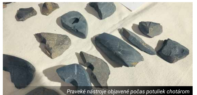
Praveké nástroje objavené počas potuliek chotárom

Mimochodom, v prípade archeologického nálezu, by mal nálezca postupovať v súlade so zákonom - a teda nález riadne oznámiť príslušnému krajskému pamiatkovému úradu. Nálezcovi dokonca patrí aj nálezné - a to dokonca aj do výšky 100% hodnoty ná-