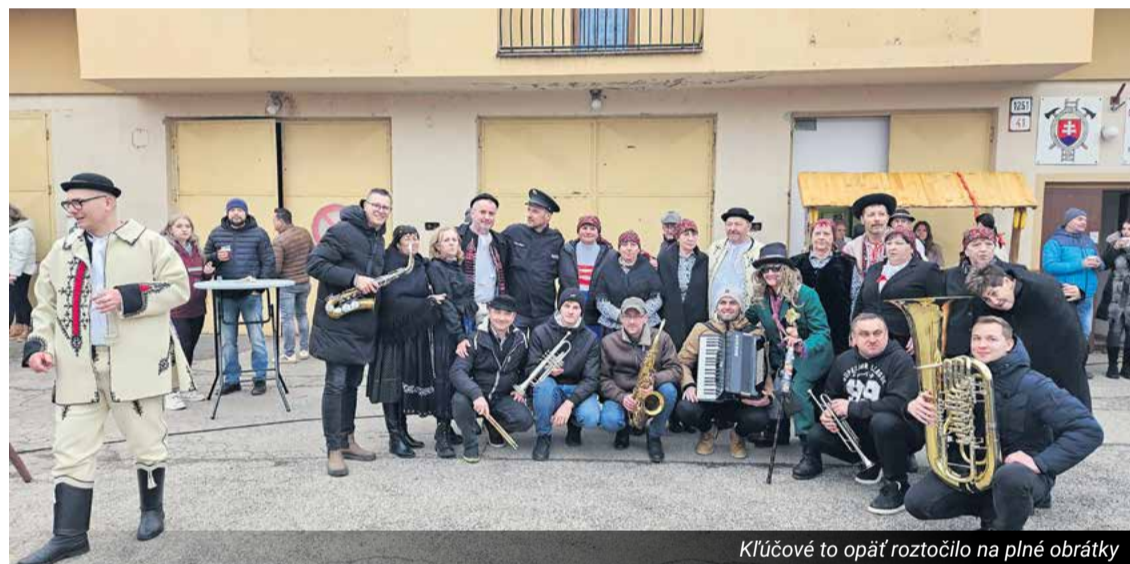
Kľúčové to opäť roztočilo na plné obrátky

a svojou prítomnosťou podporili kultúru v našom meste. Ochrannú ruku nad podujatiami mali vo všetkých mestských častiach členovia DHZ. Mesto Nemšová podporilo podujatia poskytnutím priestorov a VPS poskytlo technickú pomoc.