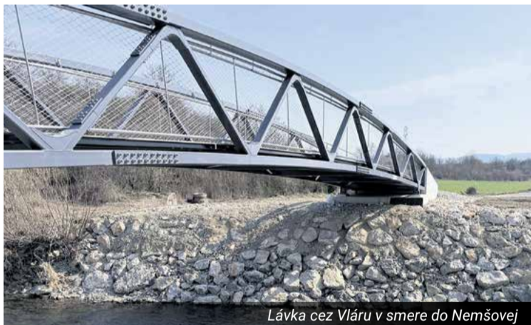
Lávka cez Vláru v smere do Nemšovej

mi úpravami. Po podpísaní zmluvy je už na apríl pripravená realizácia rekonštrukcie vodovodu na ulici Šidlíkové. Tu sa po rekonštrukcii vodovodu bude realizovať aj rekonštrukcia plynovodu, ktorú bude realizovať plynárenská spoločnosť hneď po rekonštrukčných prácach na vode, ktoré sú v réžii mesta. Projekty rekonštrukcie vodovodov sú realizované prostredníctvom ministerstva životného prostredia cez partnerstvo Ilavsko-dubnického regiónu, kde na rekonštrukcie vodovodov najviac čerpá mesto Nemšová a Považská vodárenská spoločnosť.