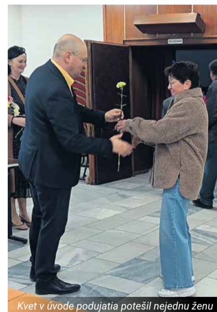
Kvet v úvode podujatia potešil nejednu ženu