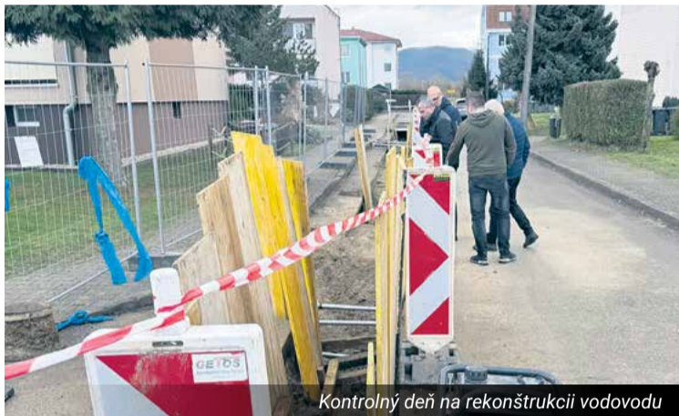
Kontrolný deň na rekonštrukcii vodovodu

V zime bola realizovaná rekonštrukcia vodovodu na ulici Mládežnícka. Samotná stavba je hotová, do pôvodného stavu treba uviesť už len povrch vozovky. Čaká sa, kým stavba ešte sadne, a následne sa môže začať so záverečným-