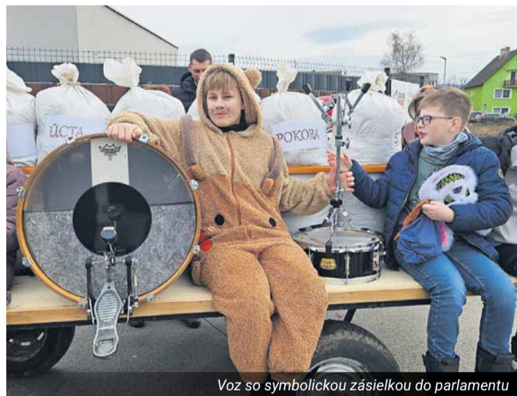
Voz so symbolickou zásielkou do parlamentu

Štvrtý ročník Klúčovských fašiangov priniesol nielen spev, hudbu a dobré jedlo, ale