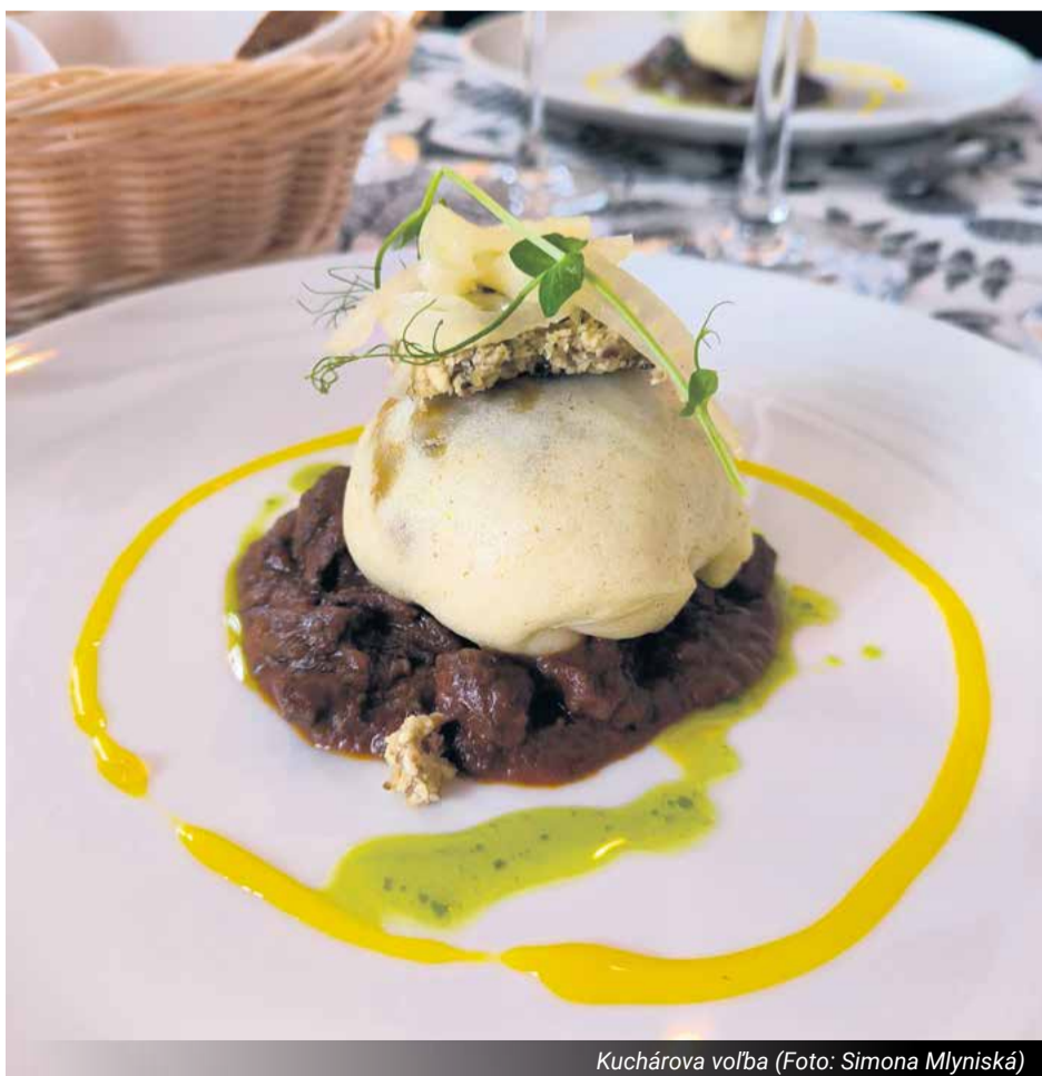
Kuchárova voľba

Koľko reštaurácií bolo do aktuálneho ročníka zapojených?