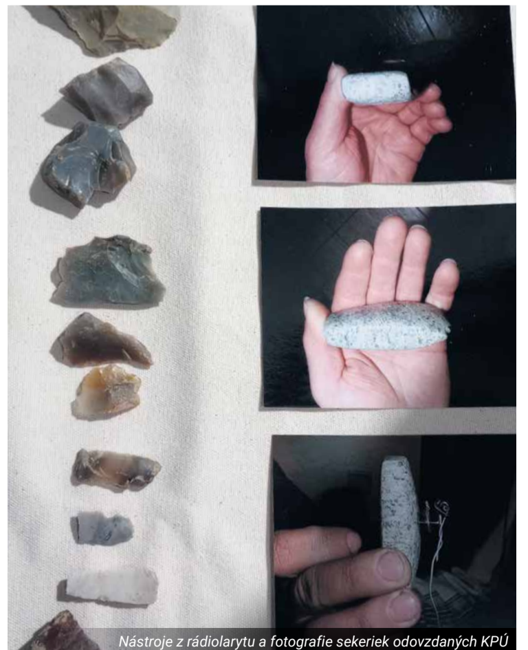
Nástroje z rádiolarytu a fotografie sekeriek odovzdaných KPÚ