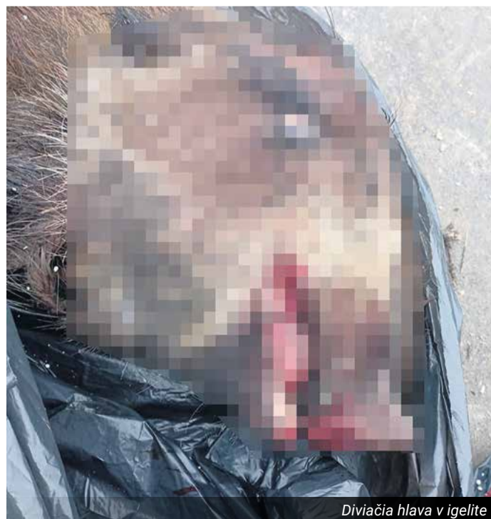
Divičia hlava v igelíte