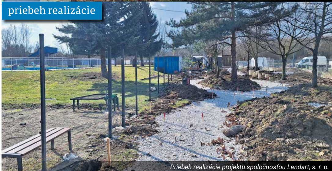
Priebeh realizácie projektu spoločnosťou Landart, s. r. o.