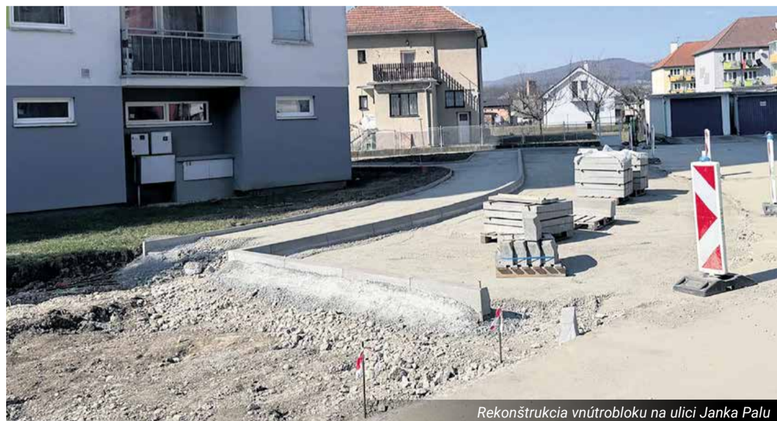
Rekonštrukcia vnútrobloku na ulici Janka Palu

• V tomto roku mesto plánuje uložiť elektrické vedenie do zeme. Ide o konštrukčne najťažší krok, no veľmi dôležitý, pretože musí byť vykonaný ešte pred stavbou kruhových objazdov. Prekládka sa týka distribučných rozvodov NN, HDP optickej chráničky, NN prípojky, verejného osvetlenia a demontáže zariadení.