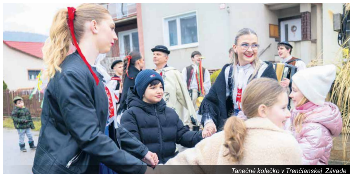
Tanečné kolečko v Trenčianskej Závade