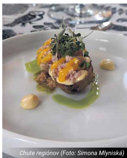
Chute regiónov

— Do festivalu si vyberajú reštaurácie organizátori festivalu, pričom celoročne sledujú, aké služby jednotlivé reštaurácie ponúkajú, aké sú recenzie od klientov či hodnotiteľov. Následne zostavia zoznam reštaurácií a oslovia ich, či sa nechcú zúčastniť tohto prestížneho festivalu. Základným kritériom je top kvalita poskytovaných služieb v oblasti gastronómie. Čiže ne-