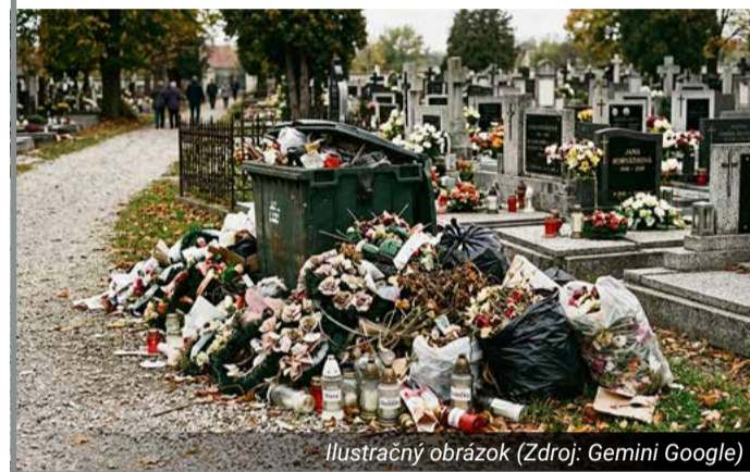
Ilustračný obrázok

Vážení občania, mesto Nemšová by sa chcelo poďakovať všetkým, ktorí sa zapojili do zberu vyhozenej voskovej zmesi a plastových kahancov na našich cintorínoch. Vaša ochota prispieva k čistejšiemu prostrediu, udržiavaniu pietneho miesta a zároveň k recyklácii, ktorá dáva použitým veciam druhú šancu. Vyzbieraných bolo spolu 1 500 kg vosku. Ďakujeme, že myslíte na prírodu nielen počas spomienky na našich zosnulých, ale aj počas celého roka, a do určených kontajnerov budete vosk zbierať i naďalej.