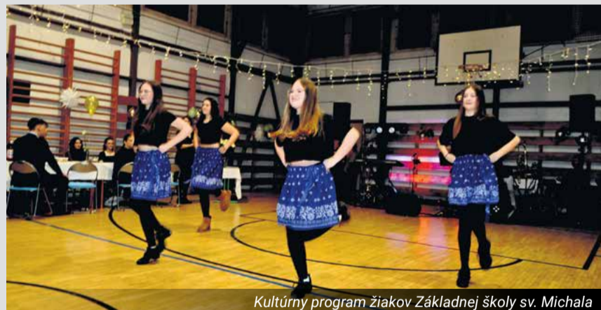
Kultúrny program žiakov Základnej školy sv. Michala