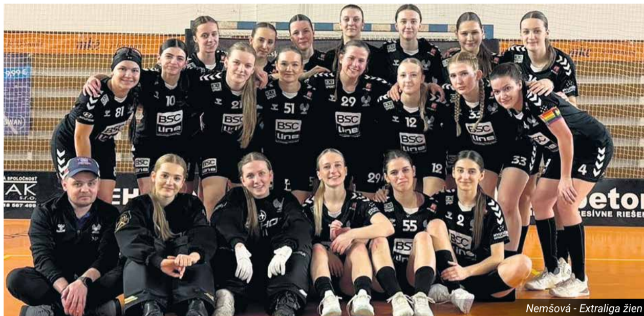
Nemšová - Extraliga žien

Nemšová - Dubnica n. V. 3 : 15 | Nemšová - TN piráti 9 : 10 | Nemšová - Pov. Bystrica 10 : 9 | Nemšová - Tren. Teplice 15 : 6 | Nemšová - TN Piráti 13 : 6 | Nemšová - AS TN Červení 11 : 17 | Nemšová - Pov. Bystrica 16 : 10