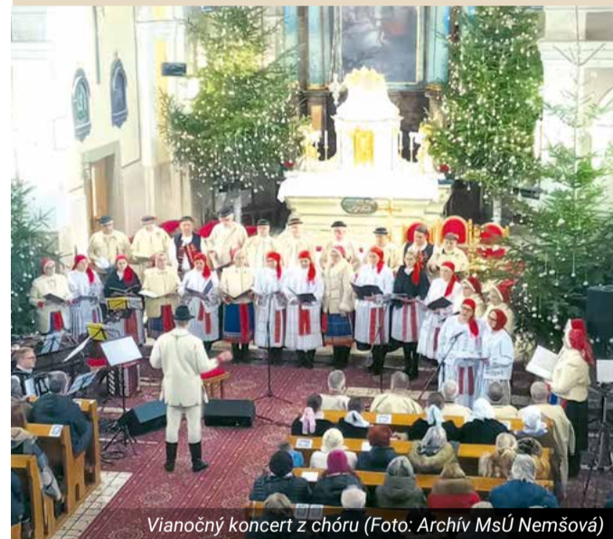
Vianočný koncert z chóru