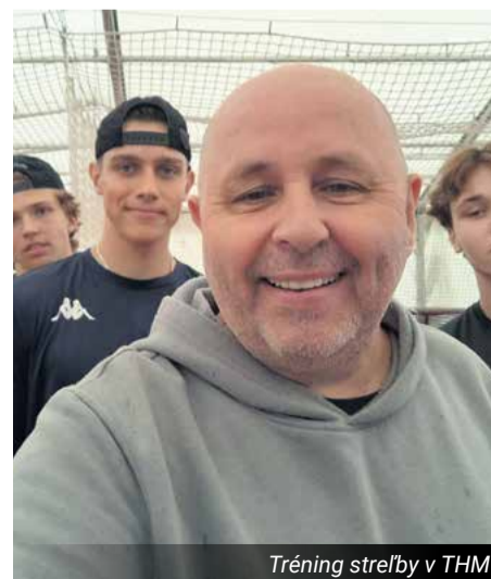
Tréning strelby v THM

• Už bolo spomenuté, že v Nemšovej sa nachádza jedno z troch hokejových centier svojho druhu. Okrem toho máme podobné centrá aj v Bratislave a Piešťanoch. Môžeme povedať, že v Nemšovej sa nachádza akési cen-