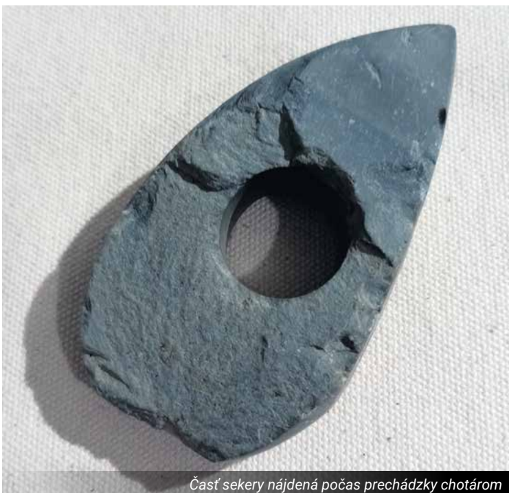
Časť sekery nájdená počas prechádzky chotárom