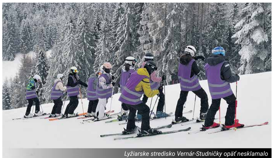
Lyžiarske stredisko Vernár-Studničky opäť nesklamalo

V rámci spolupráce s materskými školami sme vo februári privítali predškolákov , ktorí si prišli pozrieť, ako to u nás vyzerá. Prezreli si triedy, chodby aj školské priestory, kde sa denne učia naši žiaci, a nazreli priamo do vyučovania druhákov a tretiačov. Naši malí hostia však nezostali len divákmi. Aj oni si mohli po prvýkrát sadnúť do lavíc, riešiť škol-