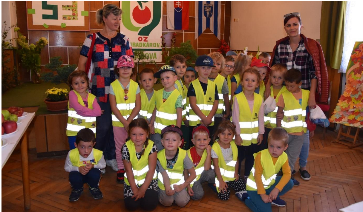
Trieda z elokovaného pracoviska na Kropáčiho ulici na výstave ovocia a zeleniny v Kultúrnom stredisku v Ľuborči

DIVADELNÉ PREDSTAVENIA: Deti absolvovali 5 spoločných divadelných predstavení. V zimnom období predstavenie Emulienka, filmové predstavenie Pat a Mat a na konci januára