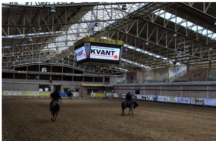
Nová jazdecká hala

prvé preteky vo westernovom jazdení. Podľa majiteľov ide o unikátnu stavbu svojho druhu, ktorá je jediná nielen v širokom okolí, ale možno aj na celom Slovensku. Podľa majiteľa je na Slovensku množstvo hál, ale žiadna prispôbena pre tento druh športu. V strede haly bola ešte v marci nainštalovaná veľká obrazovka v tvare kocky (podobné nájdeme na kvalitných hokejových štadiónoch). Vďaka nej majú počas pretekov