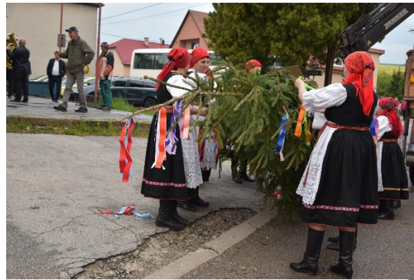
Zdobenie mája v mestskej časti Ľuborča

Nielen sociálne, ale aj v environmentálne cítenie sa pozitívne rozvíja v našej obci. V dňoch 15. až 18. apríla pri príležitosti Dňa Zeme sa uskutočnila výstava v mestskom múzeu pod názvom Separujeme, recyklujeme... dávame odpadu novú šancu . Výstavu pripravila Materská škola na Ul. odbojárov a uskutočnila sa pri príležitosti Dňa Zeme.