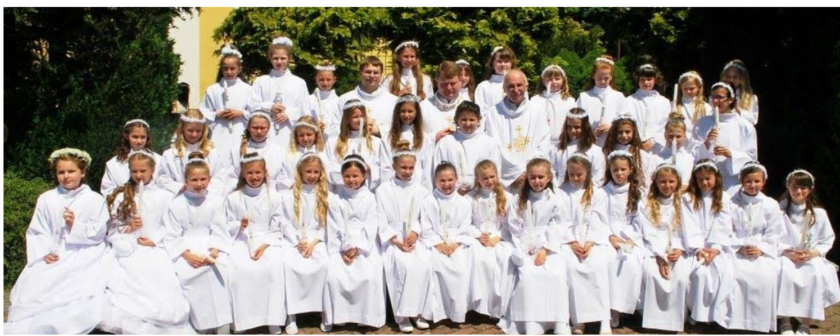
Prvé sväté prijímanie dňa 2. júna 2019

V uplynulom roku mala farnosť 59 krstov, dňa 2. júna 63 detí prvýkrát pristúpilo k svätému prijímaniu a dňa 28. septembra 102 birmovancov prijalo sviatosť birmovania. Počas roka sa uskutočnilo 30 sobášov a 59 pohrebov.