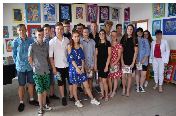
Žiaci deviateho ročníka Základnej školy, Janka Palu