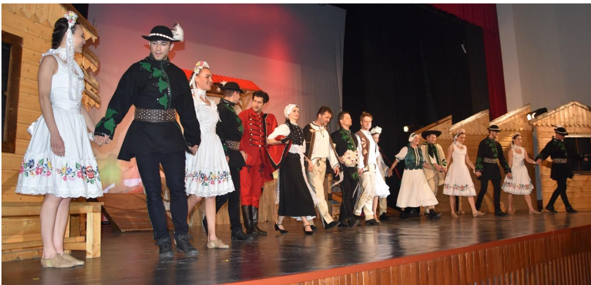
Divadelné vystúpenie Kubo, pocta Jozefovi Krónerovi