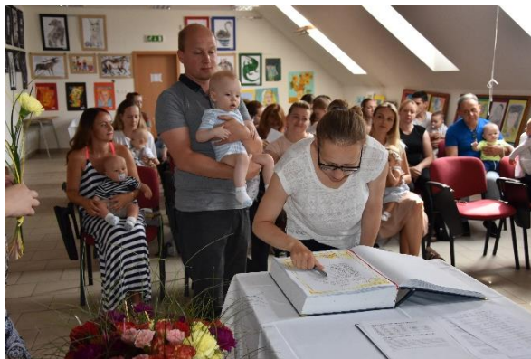
Vítanie detí do života 20. júna 2019 v mestskom múzeu