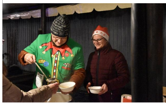
Podávanie primátorskej kapustnice

V kultúrnom programe vystúpili deti základných škôl z Nemšovej a rozprávkovú atmosféru navodila divadelná scéna o príchode Mikuláša pod názvom „ Vianoce nebudú “. Napriek názvu nakoniec Mikuláš prišiel a za asistencie anjela a čerta rozdal darčeky tým najmenším. Bodku za bohatým programom dalo slávnostné rozsvietenie nemšovského vianočného stromčeka.