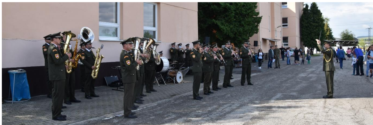
Vojenská hudba OS SR z Bratislavy na DOD 16. augusta

Zásobovacia základňa I. zorganizovala dňa 31. mája DOD pri príležitosti Medzinárodného dňa detí. Prítomní návštevníci mali možnosť vidieť ukážky činnosti príslušníkov OS SR. V areáli základne boli pripravené ukážky ručných zbraní, vojenskej techniky a výstrojného materiálu v OS SR. Deti si vyskúšali výstroj a výzbroj a nazreli do skutočnej vojenskej techniky. Veľký úspech mali služobné psy, ktorých výcvik prezentovala kynologická skupina.