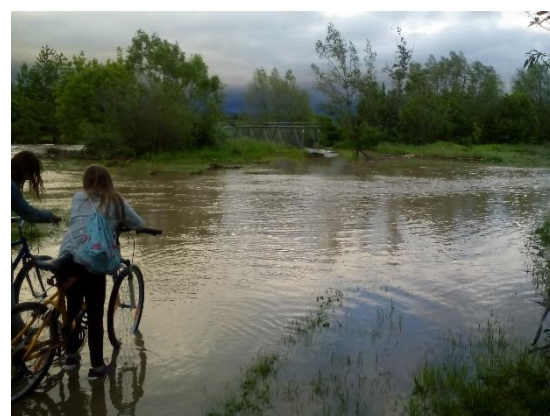
Druhý stupeň povodňovej aktivity dňa 23. mája 2019, hore most v Ľuborči, dole lávka Horné Srnie

Po veľmi chladných jarných mesiacoch prišiel historicky najteplejší jún s priemernou teplotou v Nemšovej 28,3 °C. V celoslovenskom meraní bol rozdiel priemerných teplôt medzi májom a júnom +10 °C. Najvyššia teplota v Nemšovej nameraná 14. júna bola 33,1 °C. V priebehu júna boli na Slovensku zaznamenané dve výrazné vlny horúčav od 10. do 16. júna a od 24. do 27. júna, a to približne platilo aj pre naše obce. Niekoľko meteorologických staníc malo v tohtoročnom júni všetky dni letné, stalo sa to v Hurbanove, v Sliači, v Topoľčanoch a v Žihárči. V histórii meteorologických meraní sa toto na Slovensku ešte nestalo. Rekordy pre mesiac jún boli aj v počte tropických nocí, ktoré sa vyskytli aj v najsevernejších oblastiach. Horúčavy pokračovali aj na začiatku júla. Na 25 staniciach na Slovensku bola zaznamenaná teplota 35 °C, v Nemšovej 33,9 °C. Zvláštnosťou tohtoročného leta bolo to, že začalo byť mimoriadne teplo hneď na začiatku júna a tento stav sa udržal až do prvých dní prázdnin. Letné teploty prevažovali aj počas júla a augusta a ukončené boli 1. septembra, kedy ešte aj v Nemšovej bola nameraná tropická teplota 31,5°C. Dňa 2. septembra nastúpil studený front. V Nemšovej to bol zamračený a daždivý deň s teplotou do 18 °C, čo bol za 24 hodín pokles