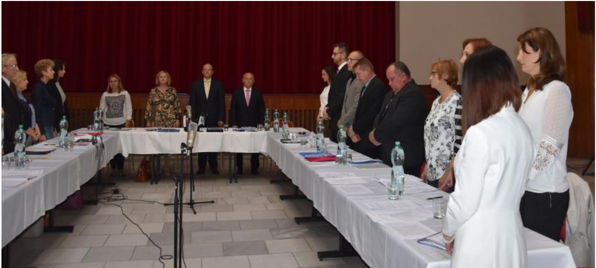
12. mestské zastupiteľstvo po doplňujúcich voľbách 17. 10. 2019