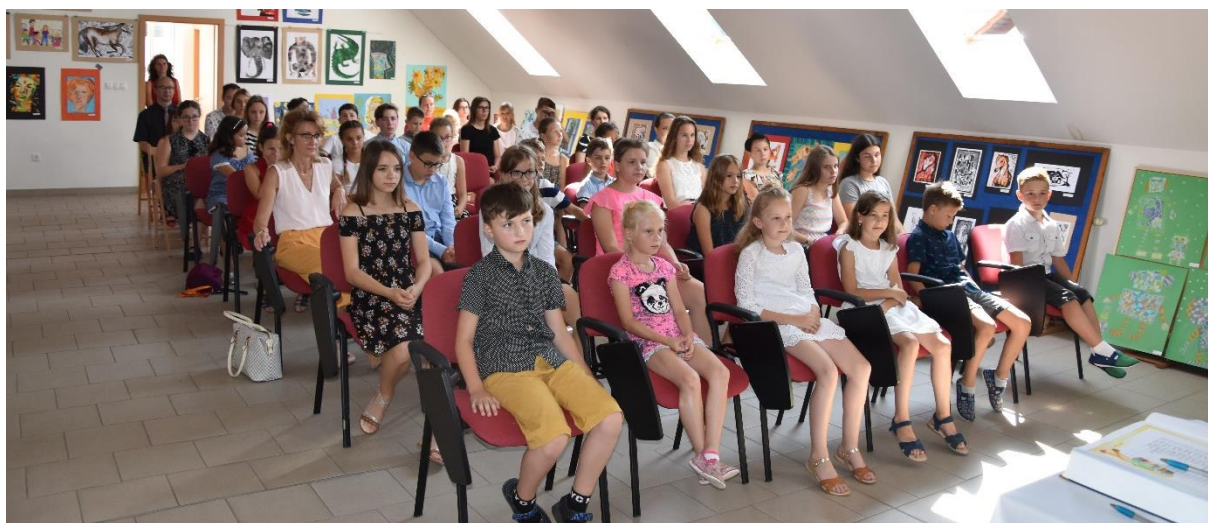
Najlepších žiaci našich škôl