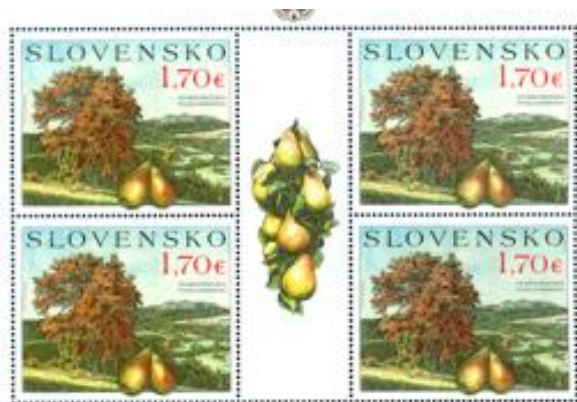
40. výročie vzniku Chránenej krajinskej oblasti Biele Karpaty

Aj CHKO Biele Karpaty v roku 2019 oslavovali. V júli uplynulo štyridsať rokov od jej vyhlásenia. V roku 1979 Ministerstvo kultúry SSR vyhlásilo CHKO Biele Karpaty na výmere 62 808 hektárov. V roku 1989 bola novou vyhláškou výmera upravená na 43 519 ha . Vtedajšia vyhláška opisuje, že účelom ochrany oblasti je zachovanie a zveľaďovania ukážkových častí rázovitej krajiny Bielych Karpát, Myjavskej pahorkatiny, Chvojnickej pahorkatiny a Považského podolia a všetkých ich prírodných foriem. Ochrana prírody, zachovanie krajinného rázu oblasti a dodržiavanie podmienok jej ochrany je povinnosťou všetkých orgánov a organizácií, ktoré pôsobia na tomto území, ako aj občanov, ktorí majú v oblasti bydlisko alebo sa v nej zdržiavajú. V súčasnosti je na území CHKO vyhlásených 45 maloplošných chránených území a 25 území európskeho významu sústavy NATURA 2000 .