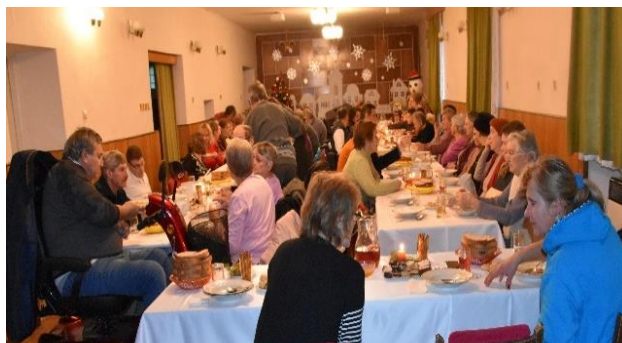
Posedenie pri vianočnej kapustnici 11. decembra