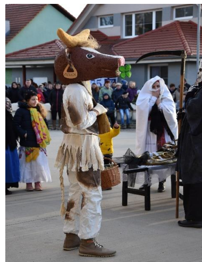
Pochovávanie basy v amfiteátri mestského múzea