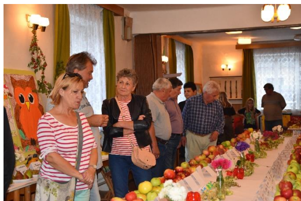
Výstava ovocia a zeleniny, 13. 9. 2019