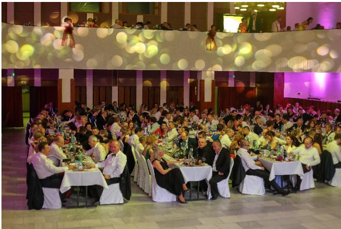
V poradi 24. ročník mestského plesu v Nemšovej