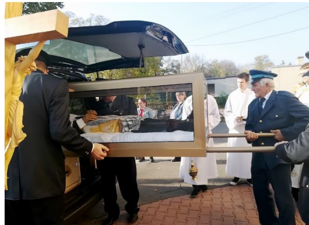
Relikvie sv. Vincenta