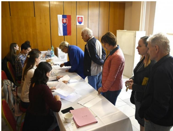
Dopĺňajúce komunálne voľby, volebný okrsk č. 3

Voľby, voľby a ešte raz voľby zamestnali našu samosprávu tento rok naplno. Prvými boli prezidentské voľby, druhými sme si volili poslancov do Európskeho parlamentu a tretie boli druhým pokusom o zvolenie si primátora mesta Nemšová a poslanca mestského zastupiteľstva za mestskú časť Tr. Závada. Počas všetkých volieb bolo v obci zriadených 6 okrskov a 6 volebných miestností. Počas prezidentských volieb bola zmena volebnej miestnosti v mestskej časti Ľuborča. Občania mohli voliť v priestoroch základnej umeleckej školy a nie v kultúrnom stredisku, ako to bolo doteraz.