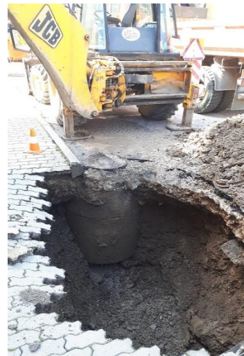
Porucha na vodovodnom potrubí 4. júna 2019 pri letnom kúpalisku

Podľa údajov Svetovej zdravotníckej organizácie až dve miliardy ľudí pijú vodu kontaminovanú fekálnym znečistením. Predpoklady hovoria, že v roku 2025 bude až polovica svetovej populácie žiť v oblastiach zaťažených takzvaným vodným stresom, teda môže mať problém s tým, že nebude mať čo piť. Z tohto hľadiska na Slovensku naše zdroje ešte stále prevyšujú potreby krajiny. Napriek tomu jedným z vážnych problémov v posledných rokoch z hľadiska zabezpečenia dostatočného množstva kvalitnej pitnej vody je pretrvávajúce sucho. Pretrvávajúce suchá môžu mať negatívny vplyv najmä na zdroje s menšou výdatnosťou.