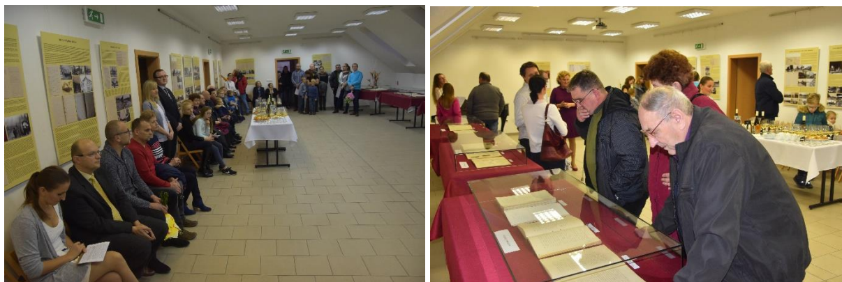
Výstava kroník mesta Nemšová pri príležitosti 30. výročia vzniku mesta Nemšová

Oslavy 30. výročia vzniku mesta Nemšová boli ovplyvnené aktuálnym politickým dianím v meste, a neboli tak veľmi v popredí verejno-spoločenského diania, akoby to bolo možno za normálnej situácie. Dôvodom bolo, že odo dňa 1. januára 2019 nemal mestský úrad prednostku a od konca januára ani primátora, čo uviedlo mesto do špecifickej situácie, v ktorej sa ocitlo prvýkrát od jeho vzniku a muselo sa s ňou vysporiadať. Celý program tradičného nemšovského jarmoku bol venovaný tomuto výročiu, nebol však ničím špecifický, čo by ho odlišovalo od minulých ročníkov. Boli vyhotovené tabule s informáciou o výročí. Jedna z nich bola inštalovaná na mestskom úrade a druhá sprevádzala počas roka rôzne kultúrne akcie. V porovnaní s 20. výročím bolo uctenie štatútu veľmi jemné. Pred desiatimi rokmi bol