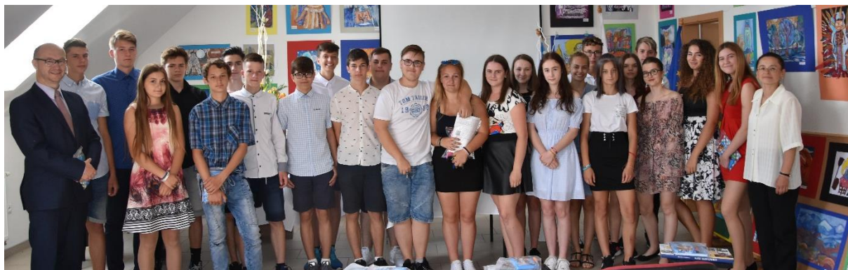
Žiaci deviateho ročníka Základnej školy svätého Michala

28. júna sa žiaci základných škôl rozlúčili s uplynulým školským rokom a odštartovali dva mesiace zaslúženého oddychu.