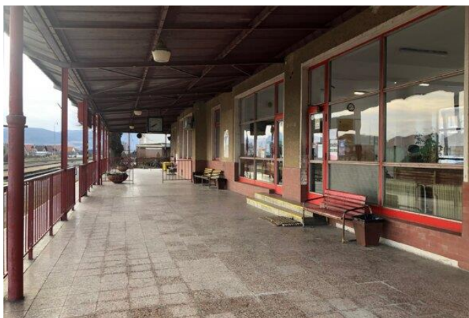
Železničná stanica v Nemšovej

Na stanici v Nemšovej stojí denne desiatka vlakov, ľudia ich využívajú prevažne na cestu do práce alebo do školy na trase Horné Srnie – Nemšová – Trenčianska Teplá. Dvakrát denne tu zastavoval súkromný vlak, ktorý išiel z Nitry do Prahy. Toto vlakové spojenie západného Slovenska s hlavným mestom Českej republiky bolo na konci roka 2019 nahradené autobusmi.