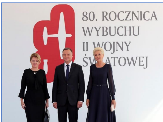
Poľský prezidentský pár Andrzej Duda a jeho manželka Agata pózujú s prezidentkou Slovenskej republiky Zuzanou Čaputovou pred začiatkom spomienkového podujatia v poľskej metropole Varšava.

Stalo sa tak na spomienkovej akcii v poľskom meste Wielun presne o 80 rokov po tom, čo Nemecko zaútočilo, obsadilo Poľsko a svojim konaním rozpútalo najkrvavejší konflikt v moderných dejinách ľudstva. Poľský prezident útok nacistického Nemecka na Poľsko odsúdil a nazval vojnovým zločinom a barbarským činom, no vo svojom prejave dodal, že je presvedčený, že táto spomienková slávnosť vojde do dejín poľsko-nemeckého priateľstva. V prejave poukázal i na novodobý imperializmus a na nedávne tendencie o zmenu hraníc v Európe (Gruzínsko v roku 2008 a Ukrajina v roku 2014). Podľa poľského prezidenta „akákoľvek vojenská agresia sa musí stretnúť s absolútne pevnou, rozhodnou a silnou reakciou. Zatváranie očí nie je receptom na mier, je to jednoduchý spôsob, ako de facto dať súhlas na ďalšie útoky“. Vo Varšave bola prítomná aj prezidentka SR Zuzana Čaputová, podľa ktorej Európa nesmie dovoliť, aby sa vojny a konflikty vrátili na náš kontinent a zlu nesmieme ustúpiť, ale musíme ho prekonať.