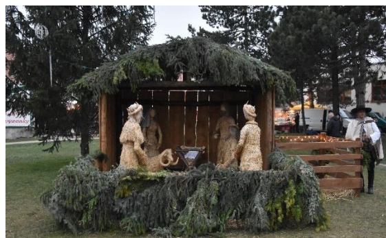
Slamený betlehem pri KC Nemšová so zvieratami