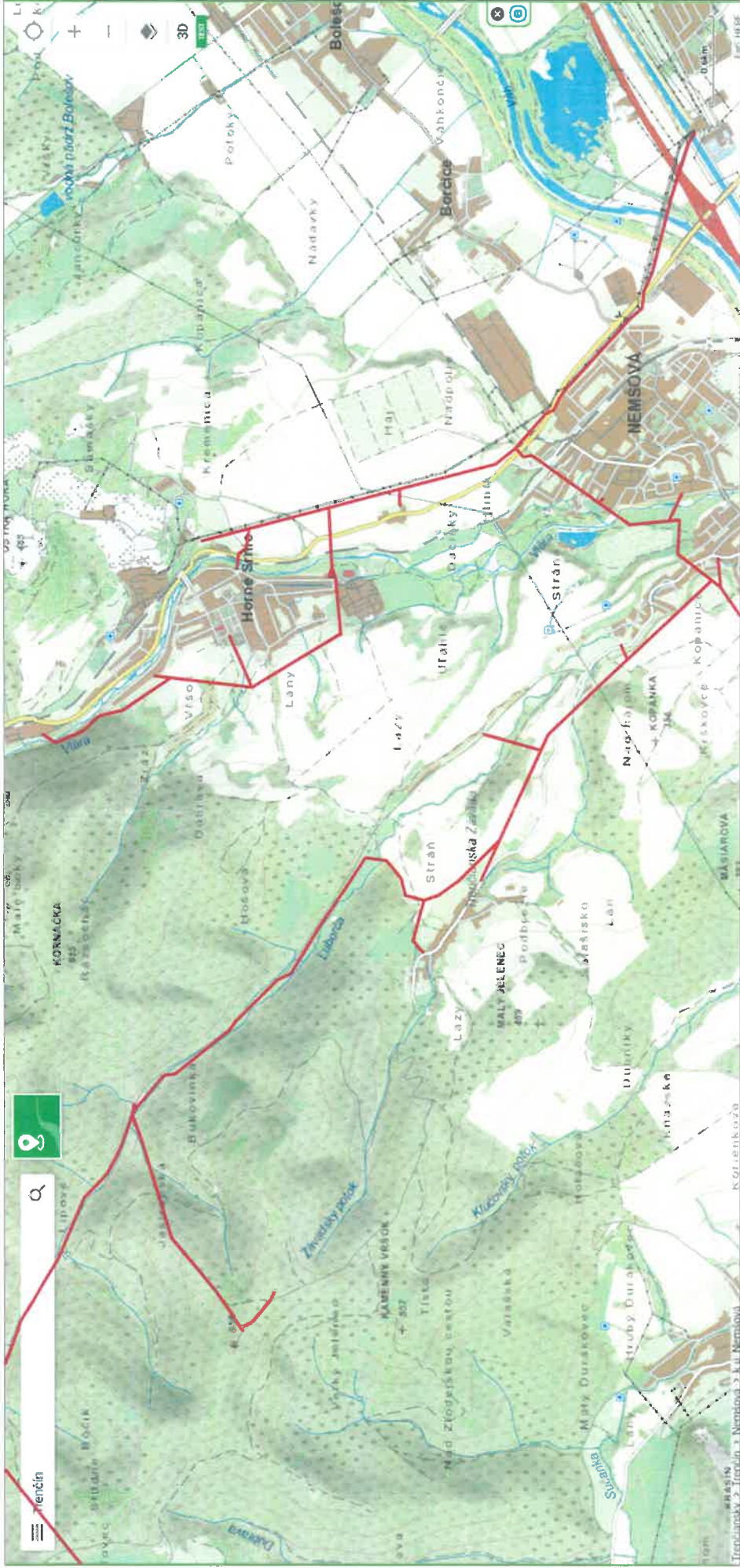
VN 282 Nemšová - Horné Srnie