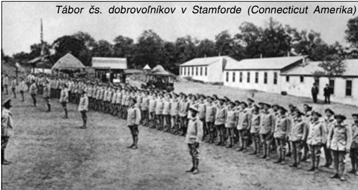
Tábor čs. dobrovoľníkov v Stamforde (Connecticut Amerika)

Zdá sa, že po generácie potláčané národné povedomie a utajovanie, či skresľovanie dejín nášho národa zo strany mocných vykonalo svoje dielo. Stále sa akosi hanbíme za zdravé národné povedomie a osvetu. A tak značná časť novodobých dejín nášho národa i na začiatku 21. storočia je verejnosti neznáma. Koľko toho vieme napríklad o dianí pri obnove našej zvrchovanosti na území Nemšovej? Čo vieme o československých légiách, ktoré bojovali na všetkých frontoch 1. svetovej vojny za obnovenie slovenskej a českej štátnosti? Títo vlastenci sa grupovali z vojnových zajatcov a prebehlikov, teda našich rodákov násilím zverbovaných do vojny za cudzie záujmy. Po