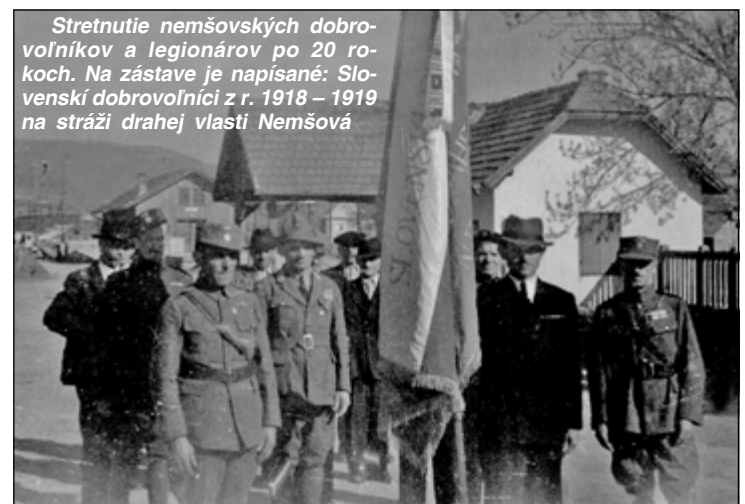
Stretnutie nemšovských dobrovoľníkov a legionárov po 20 rokoch. Na zástave je napísané: Slovenskí dobrovoľníci z r. 1918 - 1919 na stráži drahej vlasti Nemšová