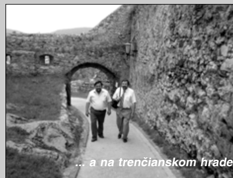
... a na trenčianskom hrade

sa ukázala byť pre nich ešte krajšia a dôstojnejšia ako mohlo postihnúť chladné oko kamery. Oboch milo prevkypila živá viera ľudí, ktorí vybudovali alebo akýmkoľvek spôsobom podporovali toto dielo. Aj keď sme pre krátkosť času, ktorí mali