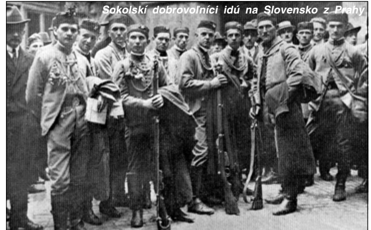
Sokolskí dobrovoľníci idú na Slovensko z Prahy

lenie čs. armády cez stredné Slovensko a spojenie s armádou Poľska, ktoré chcelo anektovať severné Slovensko. Elitná časť vznikajúcej čs. armády „ruské légie“ v počte takmer 60 000 mužov bola zadržávaná na Sibíri. Kritickú situáciu zachránil rýchly presun čs. légii v počte asi 30 000 mužov z Talianska. Spoločnými silami boli potom definitívne vyhnaní maďarskí a poľskí okupanti z územia Slovenska.