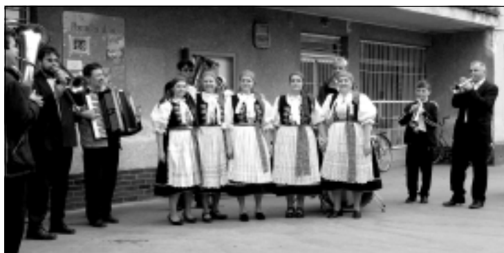
9. - 11.5. v zasadačke KC – Výstava prác ľudovej tvorivosti – Senior Klub, MO Jednoty dôchodcov Slovenska a ZO Únie žien Slovenska