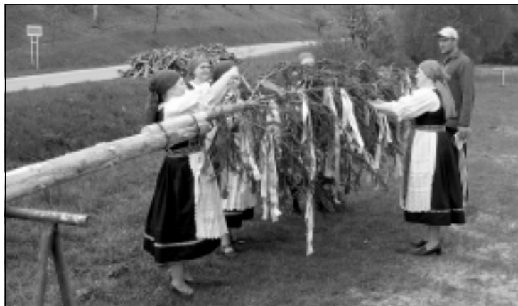
30.4. Stavanie májov