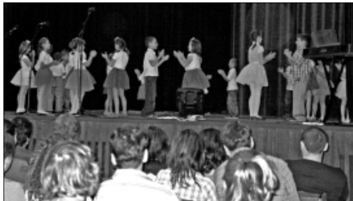
11.5. Oslavy Dňa matiek – KC Nemšová