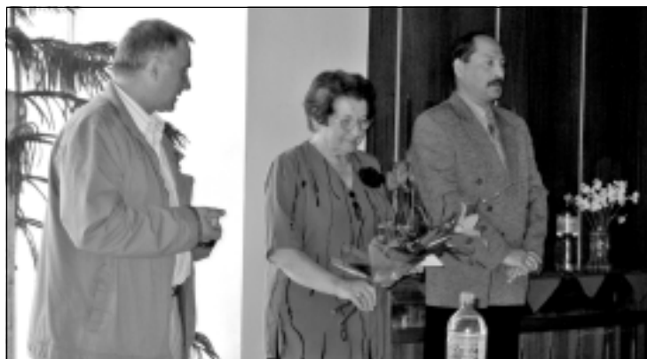
3.5. Slávnostná sv. omša konaná pri príležitosti sviatku sv. Floriána patróna hasičov – Dobrovoľný hasičský zbor Luborča - Kaplnka sv. Antona v Luborči