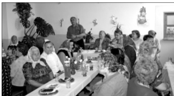
17.5. Hodové posedenie pri hudbe – KS Trenčianska Závada