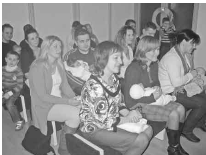
24. november. Víťanie detí do života.