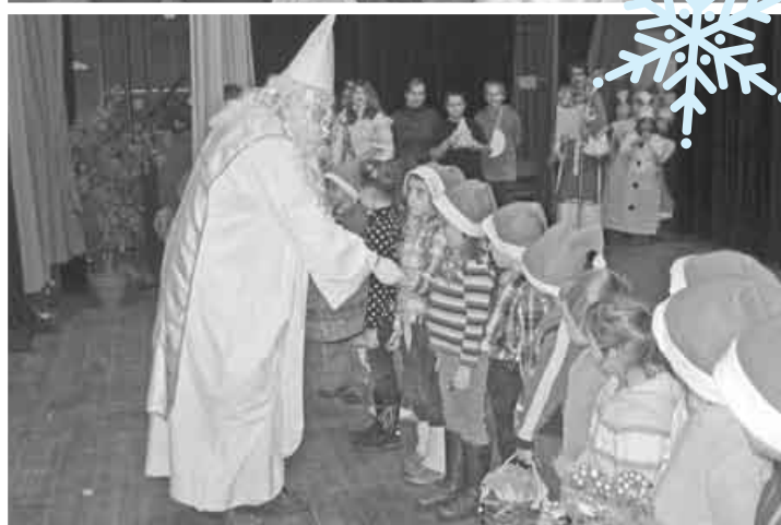
4. december - Slávnostné rozsvietenie vianočného stromčeka a príchod Mikuláša.