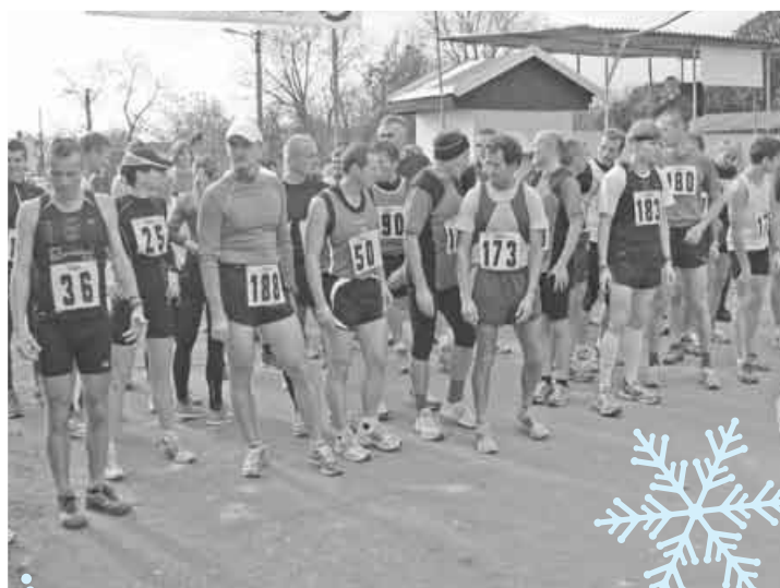
5. november. 43. ročník Beh okolo Ľuborče.