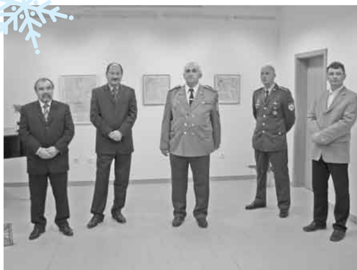
1. december - Výstava Slovensko na mapách v mestskom múzeu (Topografický ústav Banská Bystrica).