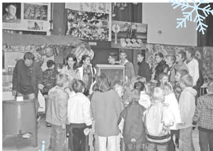
7. - 10. október. 47. ročník oblastnej výstavy Ovocie, zelenina, kvety.