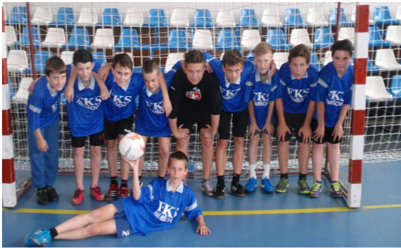
Zo športovej súťaže „Putovný pohár“ so súperom z Hluku.