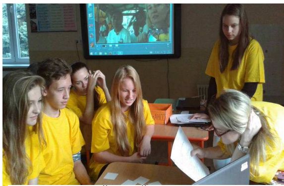
Žiaci ZŠ Nemšová