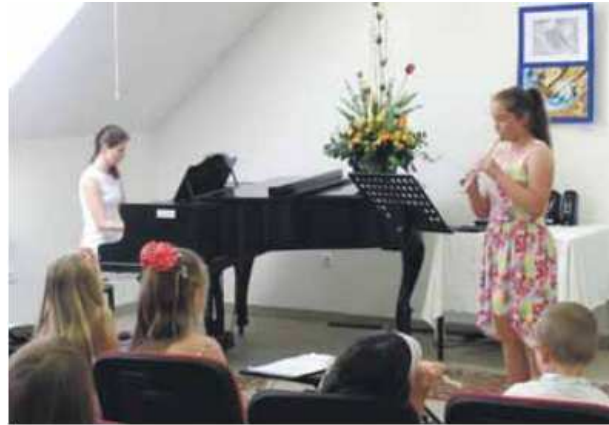
Záverečný koncert v mestskom múzeu

2. júna boli najlepšie výtvarné práce vystavené na vernisáži v Mestskom múzeu v Nemšovej. Výstavu si obyvatelia mohli pozrieť do konca júna. 4. júna sa v mestskom múzeu uskutočnil 13. ročník Dychfestu , internej súťaže v hre na dychových nástrojoch. V hre na zobcovej flaute a ostatných dychových nástrojoch zúčastnili mladší i starší žiaci. Tanečníci z pobočiek ZUŠ sa zúčastnili dňa 6. júna 2. ročníka súťaže Tanečná črievička . Súťaž sa konala v Kultúrnom centre v Nemšovej za prítomnosti divákov, ktorí potleskom odmenili choreografie tanečníkov v štýle ľudového a moderného tanca.