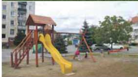
Kombinovaná preliezačka na ihrisku v Tr. Závade, na ihrisku za bytovým domom na Ul. Janka Palu Nemšová

Pre rozvoj športovej činnosti detí a mládeže outdoorový fitness park, ktorý realizovala MAS Vršatec v spolupráci s mestom Nemšová, vybavili novými lavičkami, odpadkovými košmi a novým osvetlením. Pod hrazdovou zostavou z dôvodu bezpečnosti pribudla podkladová guma. Okrem fitness parku boli dovybavené i detské ihriská . Do mestskej časti Trenčianska Závada bola zakúpená kombinovaná preliezačka a za bytovým domom na Ulici Janka Palu obstaralo mesto prehupovačku a pružinovú dvojhodačku. Zásluhou skautov pribudla preliezačka s hojdačkami. Čiastočnej obnovy sa dočkala budova zdravotného strediska (viac v kapitole Zdravotníctvo a sociálna starostlivosť).