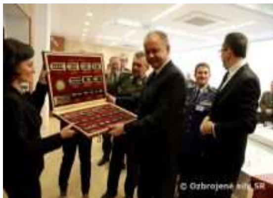
Odovzdávanie daru Andrejovi Kiskovi