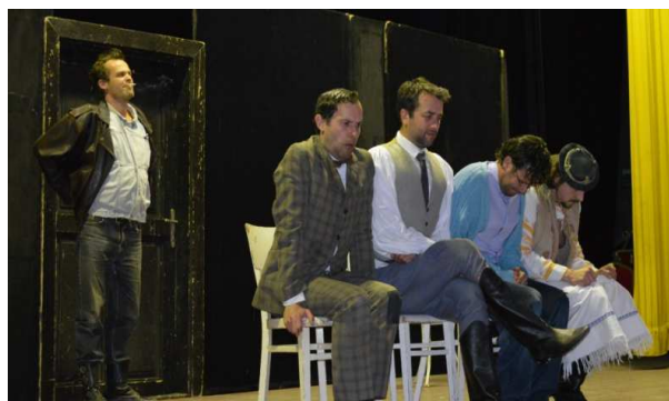
Divadelné predstavenie Na koho to slovo padne