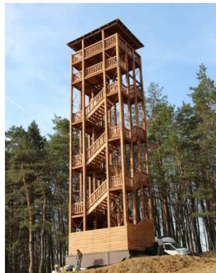
Vyhliadková veža Tr. Závada

Vzhľadom na to, že v Kronike mesta 2014 nebola zmienka o realizácii významného projektu v roku 2014, je potrebné spomenúť ho dodatočne.