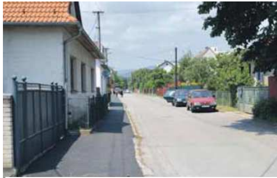
Rekonštrukcia chodníka na Vážskej ulici

Rekonštrukcia miestnych komunikácií a chodníkov. Z vlastných zdrojov bola zrekonštruovaná miestna komunikácia na Mlynskej ulici, Bernolákovej ulici, chodník na Vážskej ulici, na Ulici SNP v časti pri outdoorovom ihrisku. V týchto priestoroch bolo zriadené stojisko pre kontajnery. Zrekonštruovaný bol úsek od železničného priecestia, ktorý umožní bezpečnejší prístup na ústredný cintorín na Moravskej ulici, opravené boli výtlky na miestnych komunikáciách. V poslednom štvrtroku sa zrealizovala oprava krytu chodníka vedľa cesty na Ulici SNP pri areáli outdoorového fitness. Práce vykonala spoločnosť ASFA KDK Dubnica nad Váhom. Okrem chodníkov bola predmetom tohtoročných investičných akcií mesta i kanalizácia v jej niektorých častiach, ktorú mesto realizovalo za pomoci dotácií. Na kanalizáciu mesta Nemšová bola poskytnutá dotácia z Environmentálneho fondu vo výške 90 000 eur, mesto ju spolufinancovalo z vlastných zdrojov vo výške 5 154 eur. Realizovaná bola na Kukučínovej ulici v mestskej časti Ľuborča a úsek na Sládkovičovej ulici v Nemšovej. Práce prebiehali počas horúcich letných dní.