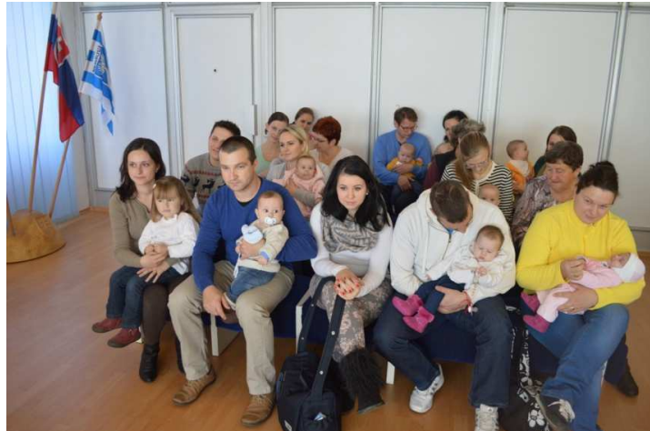
Uvítanie detí do života dňa 24. novembra

a Simona. Z chlapčenských mien bolo najčastejšie meno Matúš, v počte 4, potom mená začínajúce na M ako Martin, Matej, Maximilián, Michal, Matias, Marko, ale i mená ako Dimitar, Dávid, Denis, či Adam. Výrazne viac detí sa narodilo v apríli - 12 a najmenej v januári - len 2 deti.