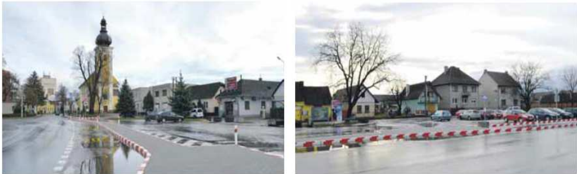
Dopravné značenie na Mierovom námestí

Na Mierovom námestí pribudlo dopravné značenie , ktoré vyvolalo nevôľu u niektorých občanov vzhľadom na to, že sa domnievali, že im čiastočne sťaží prízjazd ku kostolu. Cieľom nového dopravného značenia bolo sprehľadniť chaotickú situáciu, zamedziť parkovaniu nákladných áut a kamiónov. Ocenili to najmä vodiči z iných miest, lebo je prehľadné a bráni