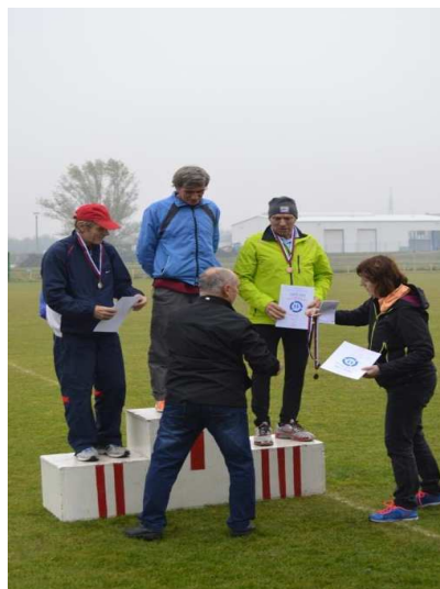
Veteráni "D" roč. 55 - 46 7 500 m