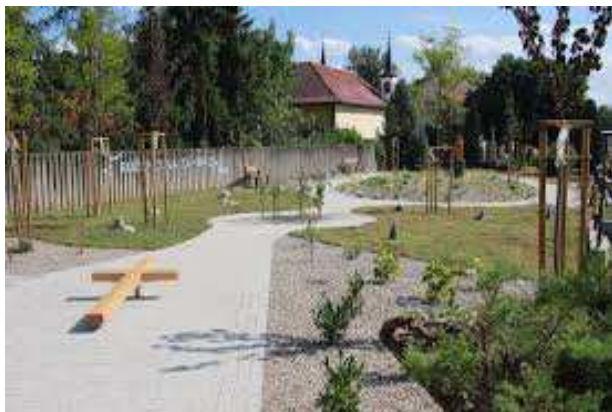
Ružencová záhrada Nemšová časť Kľúčové

Významnou udalosťou pre miestnu farnosť bolo požehnanie kríža na Sobotišti. Prvýkrát bol požehnaný 14. septembra na sviatok Povýšenia sv. kríža pred 46 rokmi roku 1969. Niekoľko dobrovoľníkov a členov miestnej farnosti sa rozhodli kríž po mnohých rokoch obnoviť.