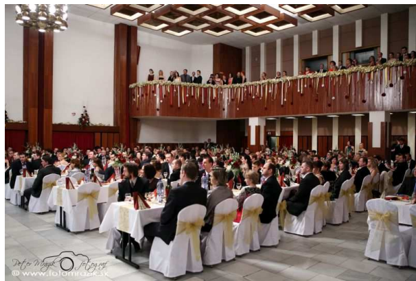
20. ročník mestského plesu