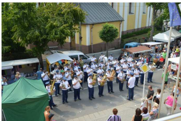
Jubilejný 20. ročník jarmoku v Nemšovej