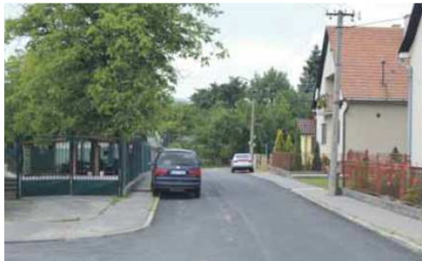
Mlynská ulica, miestna komunikácia

Zdrojom informácií pre zápis do Kroniky mesta Nemšová v tejto kapitole boli podklady vypracované oddelením investičnej výstavby, územného plánovania, stavebného poriadku, pozemných komunikácií pri mestskom úrade.