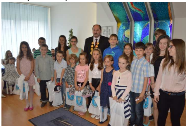
Najlepší žiaci ZŠ, Janka Palu