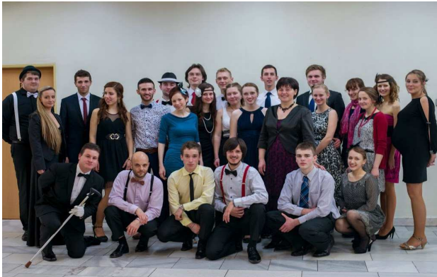
10. ročník skautského plesu

a okolitých obcí, kde majú svojich členov. Na začiatku roka organizovali 10. ročník obľúbeného skautského plesu , kde sa zabávalo takmer 300 hostí v štýle swingu 20-tych rokov.