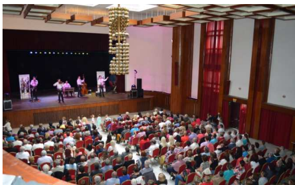
Predstavenie hudobnej skupiny Kolárovcí

14. mája sa v kultúrnom centre predstavili známi slovenskí herci Róbert Jakab, Lukáš Latinák, Marián Miezga, Vladimír Kobielsky a Juraj Kemka v divácky úspešnej divadelnej hre Na koho to slovo padne . 24. mája vystúpila hudobná folková skupina Kolárovcí zo Starej Ľubovne. Obe predstavenia sa tešili vysokej účasti divákov.