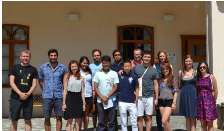
Návšteva zahraničných študentov

programu Erasmus Modus v spolupráci so Slovenskou poľnohospodárskou univerzitou v Nitre zaoberá problémami vedenia miestneho rozvoja v obciach. Aktérmi rozvoja sú podnikatelia, občianske združenia, samospráva, mladí nadšenci a mnohí iní. V auguste prezentovali svoju činnosť počas jarmoku v Nemšovej v zelenom stánku priamo pred mestským úradom. Ponúkali propagačný materiál a podávali rôzne informácie o svojej činnosti.