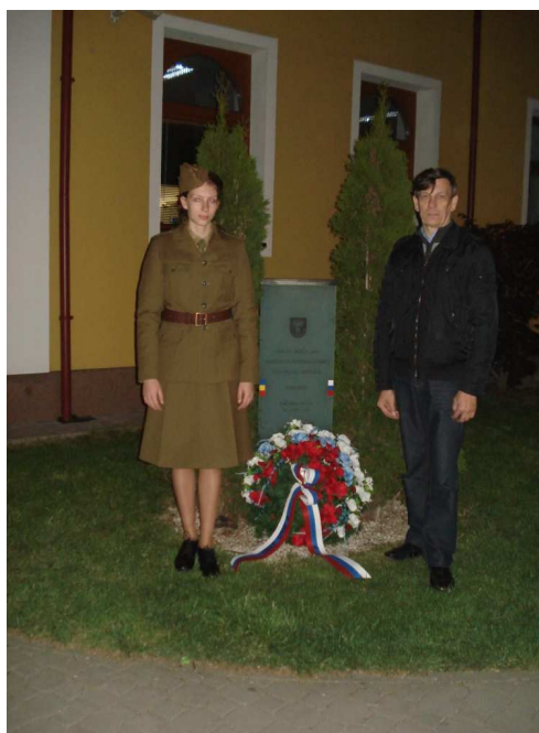
Oslavy 70. výročia oslobodenia mesta

Stavanie májov v Nemšovej a v jej mestských častiach Kľúčové, Ľuborča a Trenčianska Závada bolo 30. apríla . Nieslo sa v znamení 70. výročia oslobodenia , keďže 30. apríla 1945 bola Nemšová, vtedy obec, a príslahlé obce oslobodené rumunskou armádou. Stavanie májov začalo o 18.00 hod. v Trenčianskej Závade a končilo o 19.00 hod. v Nemšovej. Primátor mesta a zástupca primátora položili veniec k Pamätníku osloboditeľov pri budove mestského úradu. Nasledoval lampiónový sprievod, ktorý začal pri amfiteátri mestského múzea, pokračoval po Uliciach SNP, Janka Palu, Sklárskej ulici a späť. Stavanie májov a lampiónový sprievod sprevádzala folklórna skupina Liborčan a dychová hudba Nemšovanka. Oslavy ukončil veľkolepý ohňostroj o 21.00 hodine.