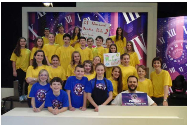
Reprezentovanie v televíznej relácii RTVS Daj si čas

Žiaci tradične vyvíjali veľmi zaujímavé a reprezentatívne aktivity. Celoročne boli zapojení do environmentálnych projektov Recyklohry, Baterky na správnom mieste . Realizoval sa rovnako celoročný tréning siedmakov na zlepšenie vzťahov medzi spolužiakmi.