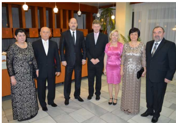
Zprava: zástupca starostu mesta Hluk s manželkou, starosta mesta Hluk s manželkou, primátor mesta Nemšová a zástupca primátora mesta Nemšová s manželkou