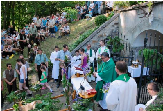
Deň sv. Huberta

práce organizuje kultúrno-športové podujatia pre širokú verejnosť. Cieľom združenia bolo vytvoriť priestor na stretnutia obyvateľov počas podujatí na sv. Huberta i mimo nich v upravenom prírodnom prostredí, v oáze pokoja na zregenerovanie ducha i tela. Predmetom činnosti združenia počas roka je starostlivosť o vytvorenú kaplnku sv. Huberta v lokalite Pod košármi, úržba fragmentu úzkorozchodnej železničky s lokomotívou a dvomi vagónmi zvanými ponvágle, udržiavanie náučného chodníka, organizovanie aktivít na Deň sv. Huberta v mesiaci jún, t. j. v