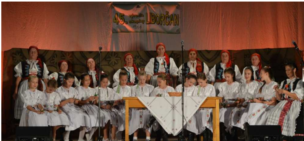
Folklorná skupina Liborčan a detský folklórny súbor Dvorček