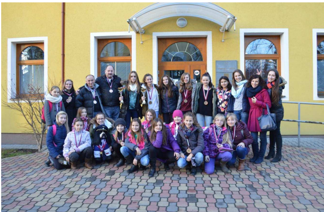
Uvítanie u primátora po získaní víťazstva OX DOG florbal základných škôl

V OX DOG florbal základných škôl sa víťazom krajského kola stali žiačky 8. - 9. tried ZŠ, Janka Palu a v kat. žiačok 5. – 7. tried rovnako ZŠ, Janka Palu. Oba výbery postúpili na celoslovenské kolo do Košíc 9. - 11. decembra 2015.