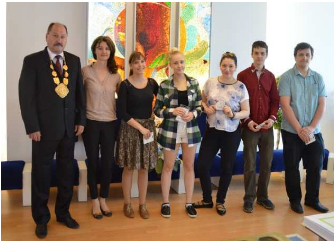
Poslední absolventi strednej odbornej školy v Nemšovej

Malý bol záujem študentov 4. ročníka o vysoké školy. Z deviatich študentov sa na vysokú školu hlásili dvaja na dejiny a teóriu umenia a jeden na štúdium anglického jazyka a literatúry. Všetci boli prijatí.