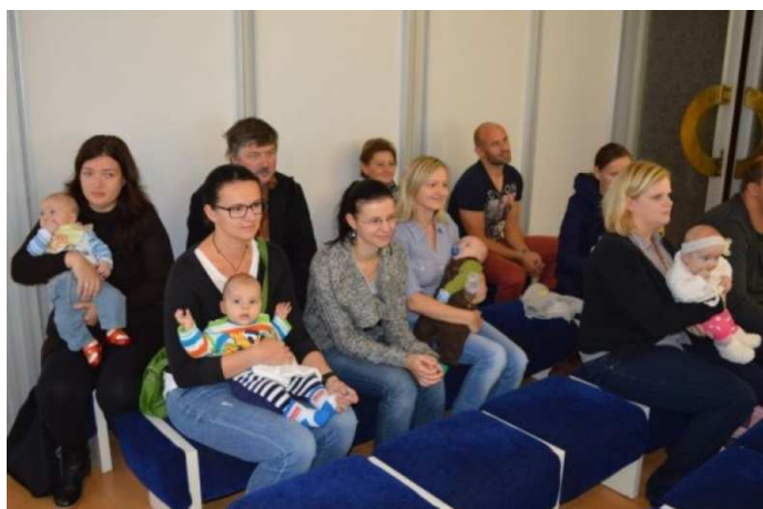
Rodičia s novonarodenými deťmi