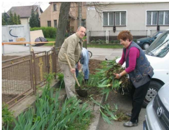
Členovia Slov. červeného kríža pri čistení okolia kostola

mimoriadne úspešná. Pracovníčky mestského úradu upravovali a čistili okolie mestského úradu a prislúchajúceho parkoviska, členovia Slovenského červeného kríža čistili obidva cintoríny v Ľuborči a okolie Závadského potoka, členky občianskeho združenia PEREGRÍN upravovali okolie mestského múzea. Členovia Senior Klubu a Jednoty dôchodcov vyupratovali prostredie okolo svojho klubu a väčšina z nich sa podieľala aj na skrášlení prostredia kostola, pričom esteticky upravili najmä zeleň. Vyhrabali aj priestory bývalého židovského cintorína a časť Mierového námestia smerom k Ľuborčianskemu mostu. Členovia Spoločenstva bývalých urbárikov a lesomajiteľov v Nemšovej vyčistili okolie trafostanice na konci Vážskej ulice. Členovia Základnej organizácie slovenského zväzu záhradkárov vyzametali krajnice od železničného prechodu smerom k Púchovskej ulici. Do prác jarného upratovania sa zapojili aj deti zo základných a materských škôl. Najmenší škôlkari vyzbierali vrecia plné odpadkov na Sobotišti a vyhrabali lístie v okolí svojich škôlok. Žiaci základných škôl vyzbierali naviete konáre v blízkosti rieky Vlára a vyčistili okolie ihriska v Ľuborči.