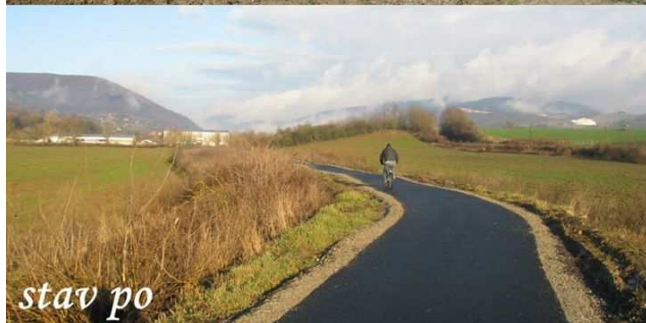
Cyklotrasa Šidlíkové – Vlárška Nemšová II. etapa

z hľadiska bezpečnosti a podpory cestovného ruchu originálna cyklotrasa vedúca z Českej republiky cez Horné Srnie až do Nemšovej. Dĺžka cyklotrasy v meste Nemšová dosiahla až 1,541 km. V rámci terénnych úprav sa na teleso jestvujúcej ochrannej hrádze položil asfaltový koberec vrátane podkladových vrstiev. Základná šírka spevneného povrchu koruny hrádze je 2,50 metra. Ide o obojstrannú cyklotrasu, kde šírka jazdeného pásu je 1,25 metra. Zrealizovaním projektu sa dokončila v máji 2014 II. etapa cyklotrasy v dĺžke 626,56 metra. Prepojenie medzi obcami sa ukázalo ako efektívne riešenie, pretože cyklotrasa sa po dokončení stavebných prác sprístupnila najmä cyklistom, chodcom i korčuliarom, ktorí ju začali naplno využívať. Obľubu našla