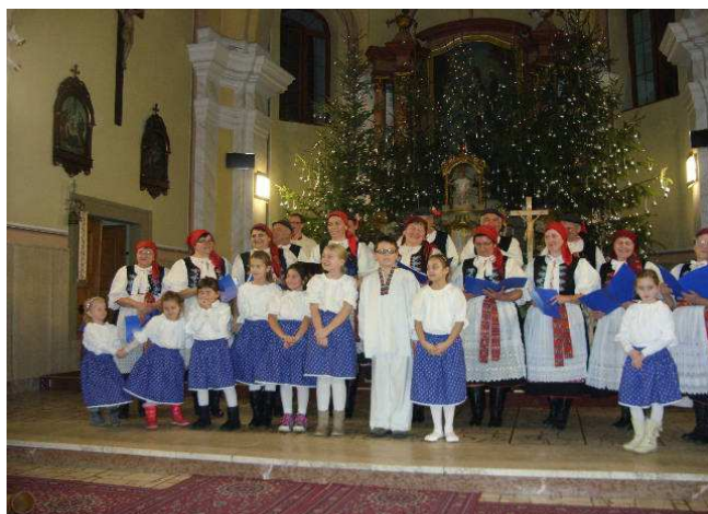
Vianočným programom ukázali svoj talent žiaci ZUŠ Nemšová

Škola poskytovala vzdelávanie pre 300 žiakov v hudobnom odbore (dychové hudobné nástroje, klavír, spev, bicie, husle, gitara, elektrická gitara, akordeón), 215 žiakov navštevovalo tanečný odbor (tanečná príprava, základy baletu, ľudový tanec, jazzový tanec, hip-hop, dance, mažoretky) a 180 žiakov sa pripravovalo vo výtvarnom odbore (kresba, maľba, grafika, modelovanie, keramika a servítková technika). Na vzdelávacom procese sa podieľalo 31 kvalifikovaných pedagogických zamestnancov.