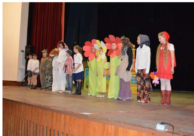
Vystúpenie detí ku Dňu matiek