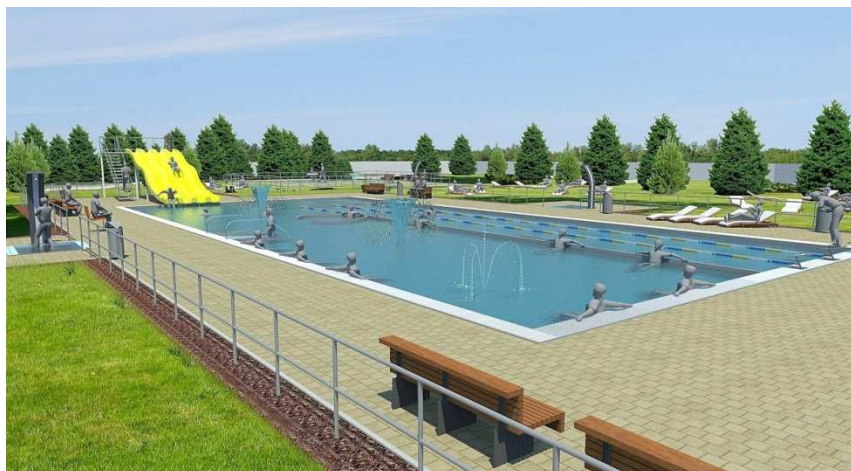
Vizualizácia nového kúpaliska

sezónu. Vynaložené úsilie so začatím rekonštrukcie mestskej plavárne tento rok zlyhalo na financovaní projektu. Zlú situáciu s kúpaliskom sa nepodarilo dlhodobu vyriešiť, počas tohtoročnej letnej sezóny kúpalisko zostalo zatvorené. Začiatkom roka mesto vypísalo verejnú súťaž na dodávateľa stavebných prác. Z 11 oslovených dodávateľských firiem sa do výberového konania prihlásili len dvaja uchádzači, jeden z nich nespĺnil podmienky účasti, preto verejnú súťaž zrušili. Mesto sa obrátilo na banky so žiadosťou o úver na opravu kúpaliska. Projekt na opravu vypracovala firma Hutní projekt Frýdek-Místek a stál takmer desaťtisíc eur. Odhadované náklady na rekonštrukciu vyčíslili na 1,3 milióna eur.