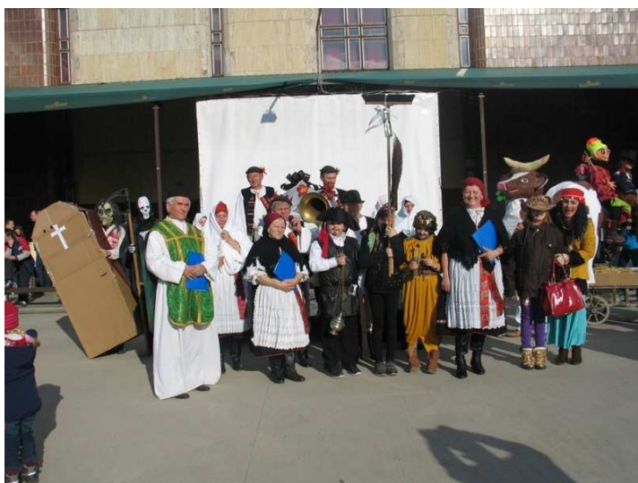
Pochovávanie basy v podaní folklórneho súboru Liborčan

Fašiangové obdobie , od Troch kráľov do Popolcovej stredy, vyvrcholilo v našom meste 1. marcový deň v popoludňajších hodinách. Každoročne sa fašiangová slávnosť v Nemšovej stretáva s veľkým záujmom ľudí. Prekrásne jarne počasie prilákalo do amfiteátra Kultúrneho centra mnoho ľudí. Neodmysliteľnou súčasťou fašiangov v Nemšovej patrí sprievod masiek od budovy Slovenskej sporiteľne až po Mierové námestie. Nechýbala typická fašiangová pochúťka – šišky vyprážené na masť, oškvarkové pagáče či domáce zabíjačkové špeciality,