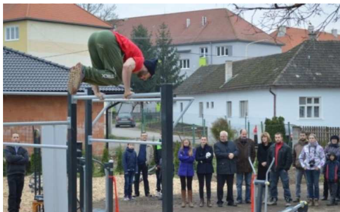
Verejná workoutová šou na otvorení mestského fitness ihriska

Vonkajšie fitness bolo vybudované na Ulici SNP pri parku v rámci projektu MAS Vršatec „Vonkajšie fitness –