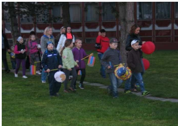
Tradičné stavenie májov spojené s lampiónovým sprievodom

Obyvatelia Nemšovej a okolitých mestských častí privítali 30. apríla mesiac lásky tradičným stavaním májov . V tomto roku sa k pestrým hudobným a tanečným vystúpeniam folklórneho súboru Liborčan a dychovej hudby Nemšovanka pridal lampiónový sprievod a májová veselica. O 20.00 hodine sa rozžiarili lampióny v amfiteátri Mestského múzea a sprievod pokračoval cez Ulicu Janka Palu, po Sklárskej ulici späť k múzeu, kde bodku za postavenými májmi dal pripravený ohňostroj a ľudová veselica.