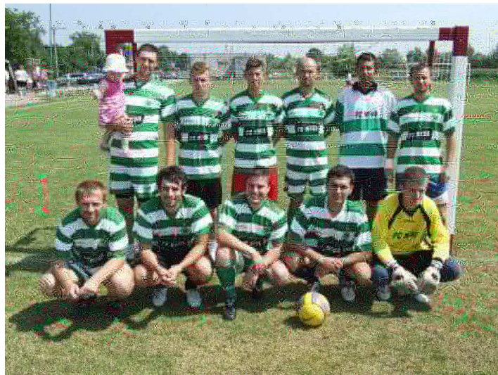
Domáci tím FC NIVA

Opäť aj tento rok sa na ihrisku v Ľuborči uskutočnil 4. ročník letného turnaja v malom futbale pod názvom Niva Cup . Na turnaj sa prihlásilo 20 tímov, o 2 menej ako minulý rok. Ani Nemšová nepostavila na tento turnaj 7 družstiev ako minulý rok. Až do finále to dotiahlo domáce družstvo FC Niva. Domáci narazili vo finálovom zápase na družstvo z Dubnice nad Váhom, ktoré neprekonali. Družstvo Aquatec prišlo a zvíťazilo, aj keď až v penaltovom rozstrele. Bronzové medaily v boji o tretie miesto si odniesol tím Dragon z Trenčína.