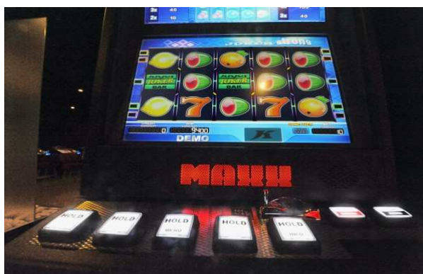
Občania doručili petíciu na zákaz prevádzkovania výherných automatov

Cieľom projektu bolo vybudovanie II. etapy cyklotrasy v meste Nemšová, ktorá plynule nadväzuje na I. etapu cyklotrasy a prepája Nemšovú s Horným Srníom.