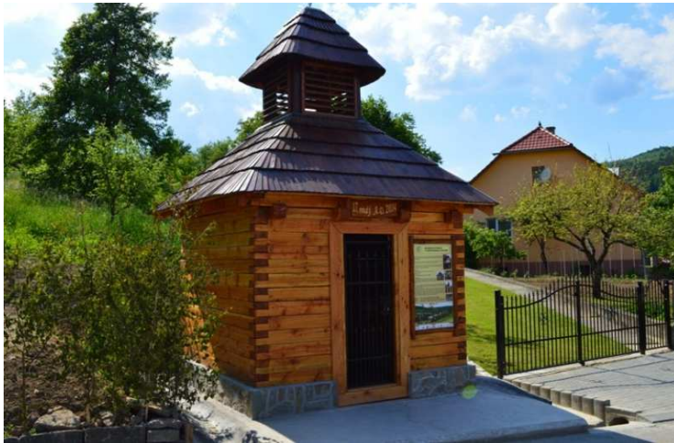
Zrubová zvonica skrášľuje Trenčiansku Závadu