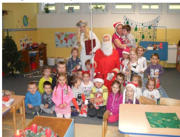
Príchod Mikuláša potešil všetkých škôlkarov

Materská škola získala od 1. 1. 2014 samostatnú právnu subjektivitu, preto bolo potrebné vytvorenie nového pracovného miesta na pozícii ekonóm. Zriaďovateľ i vedenie školy prioritne vytvorili a vybavili kancelárskym nábytkom pracovňu ekonómky a vedúcej školskej jedálne na Ulici Odbojárov. V priebehu roka sa tu vykonali drobné opravy, na prevádzkach Kropáčiho, Ľuborčianskej a Trenčianskej sa vykonala výmena svietidiel. Z rozpočtu školy sa zabezpečilo množstvo didaktického materiálu a hračiek, v štyroch triedach boli namontované interaktívne tabule s príslušenstvom, zakúpil sa nový nábytok. V elokovanej triede na Ulici Kropáčiho sa prostredníctvom sponzorov zabezpečili dva televízory a DVD prehrávač. V triedach na Ľuborčianskej ulici sa z financií zabezpečilo materiálne vybavenie detských umyvárok, zakúpilo sa telovýchovné náradie a športové potreby. Hračky a výtvarný materiál sa zakúpili i do triedy v Klúčovom.