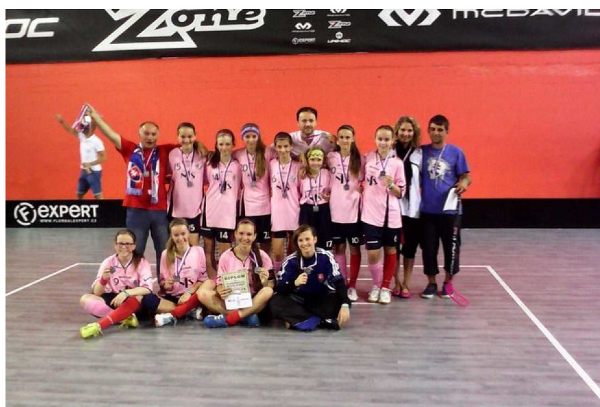
Prague Games 2014

NTS FK – ZŠ Nemšová – Black Angels (Česko) 1:1 (1:1,0:0)