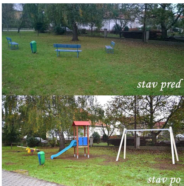
Nové detské ihrisko na Duklianskej ulici v Nemšovej

Na novom ihrisku sa osadila farebná šmýkačka, detské hojdacie prvky, nové lavičky a odpadkový koš. Ihrisko týždeň pred vybudovaním pracovníci VPS Nemšová pokosili, následne orezali stromy, zabetónovali základy detských prvkov a upravili celý priestor. Finančne prispelo mesto sumou 2 900 eur, ktorú poslanci Mestského zastupiteľstva v Nemšovej schválili z rozpočtu mesta. Z verejnej zbierky od občanov putovalo 63 eur