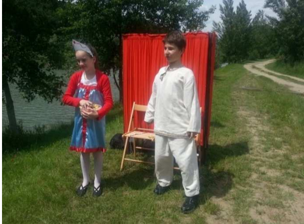
Stanovisko č. 3, ukážka z rozprávky Mrázik