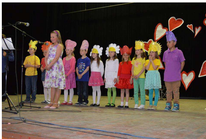
Vystúpenie detí zo Školského klubu pri príležitosti Dňa matiek

Z mimoškolských aktivít sa uskutočnilo množstvo podujatí, ktoré sa každoročne opakujú. V septembri sa konal v spolupráci s mestom Nemšová tradičný turnaj základných škôl o „Pohár sv. Michala“ vo vybíjanej dievčat a minifutbale chlapcov. Počas vianočného obdobia si žiaci pripravili Vianočnú akadémiu a zorganizovali IV. ročník „Vianočných tradícií“, kde sa predstavili svojimi výrobkami. Koniec školského roka zakončili prípravou na letný tábor, ktorý sa uskutočňuje v čase letných prázdnin.