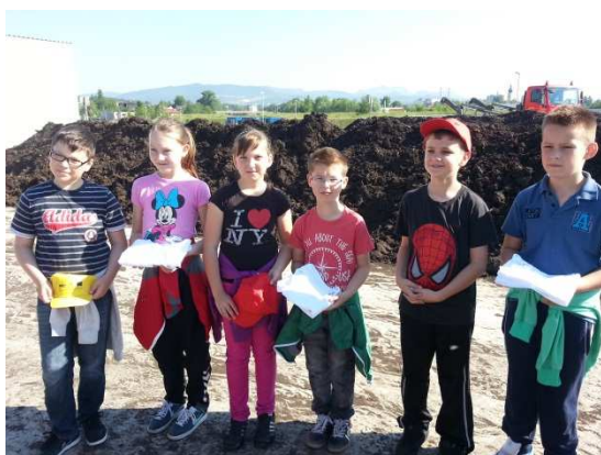
Poučná exkurzia o zhodnocovaní odpadov pre žiakov v rámci propagácie kompostárne

O projekte kompostárne sa dozvedeli i žiaci Spojenej katolíckej školy a Základnej školy na Ulici Janka Palu v dňoch 24. a 25. apríla 2014 . Prednášky o systéme zberu biologických odpadov a kompostovaní v Nemšovej viedol