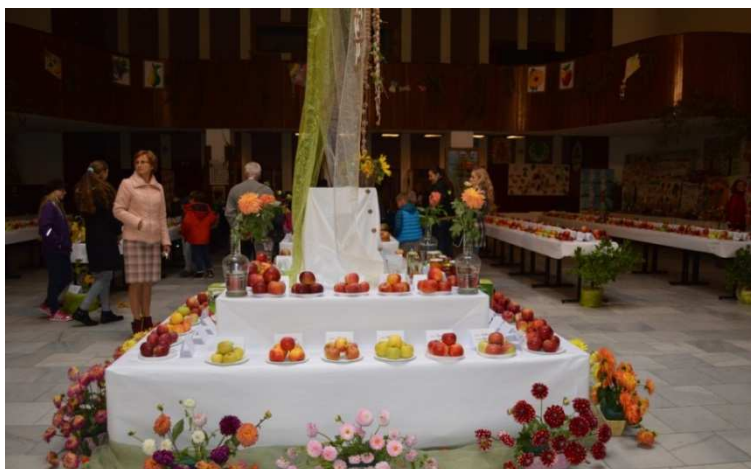
48. ročník oblastnej výstavy Ovocie, zelenina a kvety