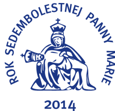
Logo nesie rozmer utrpenia Panny Márie ako jednej zo siedmich bolestí

Rok 2014 katolícka cirkev venovala Panne Márii. Dôvodom vyhlásenia tematického jubilejného Roka Sedembolestnej Panny Márie bolo 450. výročie od prvého zázraku na príhovor Panny Márie v Šaštíne a 50. výročie potvrdenia Sedembolestnej Panny Márie za Patrónku Slovenska. Vrcholom jubilejného roka bolo slávnostné zverenie Slovenska pod ochranu Sedembolestnej Panny Márie dňa 15. septembra 2014 v Šaštínskej bazilike. Základný cieľ mariánskeho roka bolo bližšie primknutie sa k Ježišovi podľa vzoru Panny Márie. Rok Sedembolestnej Panny Márie trval od 1. januára do 31. decembra 2014. Symbolom, prostredníctvom ktorého vyjadrujú slovenskí veriaci úctu Sedembolestnej Panne Márii sa stala Šaštínska pieta pochádzajúca z roku 1564. V Kostole svätého Michala sa počas trvania Roka Sedembolestnej Panny Márie nachádzalo logo postavy sediacej Matky s mŕtvym Kristom v lone, ktoré zachytávalo rozmer utrpenia Panny Márie.