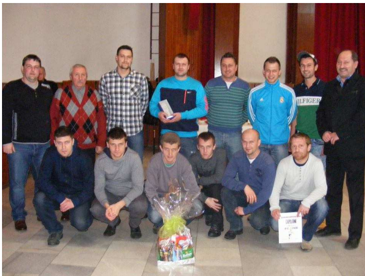
Vítaz súťaže – tím FC NIVA

Slávnostné vyhodnotenie 21. ročníka a ocenenie víťazných tímov sa uskutočnilo 5. januára 2015 o 19. hodine v Kultúrnom centre v Nemšovej.