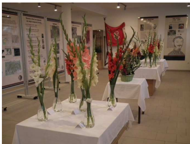
Ukážka rôznych odrôd gladiol, ktoré potešili svojou krásou

V júli, v auguste a v septembri sa uskutočnili v Nemšovej a v Hornej Súči dve výstavy, ktorých súčasťou boli odborné prednášky „ Nové trendy v pestovaní a šľachtení gladiol “. Obe výstavy boli otvorené pre širokú verejnosť a mnohé ušľachtilé odrody z Kanady a Čiech bezplatne putovali desiatkam obyvateľov Centier sociálnych služieb a ich pracovníkom v Nemšovej, Dolnej Súči, Slávnici, Skalke nad Váhom a potešili oči i dušu tým, ktorým zdravie už tak neslúži. Projekt Kvety pre zdravie bol výnimočný. Základ projektu tvorili kvety, ktoré vyčarili úsmev ľuďom s podlomeným zdravím, ale zanechali jedinečný zážitok z krásy i tým zdravým. Stovky gladiol sa rozдали a skrášlili verejné priestranstvá, interiéry kostolov a kaplniek v Nemšovej, Trenčianskej Závade, Ľuborči a v Bolešove.