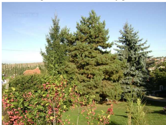
Jeseň 2014 bola najteplejšia od roku 1931

Tohtoročné leto bolo veľmi odlišné od leta 2013. Práve atmosferické zrážky a búrky určovali charakter tohto leta. Veľa oblačnosti a búrok malo vplyv aj na teplotné podmienky. Najviac sa tento vplyv prejavil na hodnotách dennej teploty, ktorá bola v lete 2014 podstatne nižšia ako v lete 2013. Kým v minuloročnom lete dosahovala denná teplota viac ako 35 °C, v lete 2014 to boli ojedinelé prípady. Málo slnka, nestabilný charakter počasia a časté búrky zanechali v ľuďoch pocit, že mali menej príležitostí na pobyt v prírode a niekedy museli svoje dovolenkové plány vplyvom počasia upravovať.