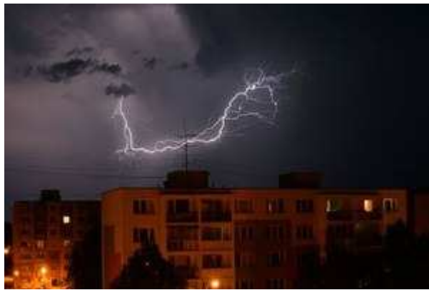
Jedna z nočných búrok v júli 2014

Tohtoročný júl sa zapísal na Slovensku ako búrkový. Búrky v lete nie sú ničím výnimočným, ale zaujímavosťou je, že na celom území Slovenska sme v júli zaznamenali až 29 dní s búrkou. V minulom roku sa vyskytlo búrkových dní 19. Premenlivejší charakter júla bol výsledkom kombinácie veľmi teplého a vlhkého vzduchu, vďaka ktorému vznikali intenzívne lejaky. Takto sa prejavila výnimočnosť tohto leta. Aj v minulosti sa objavili daždivé letá, tie však boli omnoho chladnejšie. Leto sa skončilo na Slovensku o 2 °C teplejšie ako je dlhodobý priemer počasia v 20. storočí.