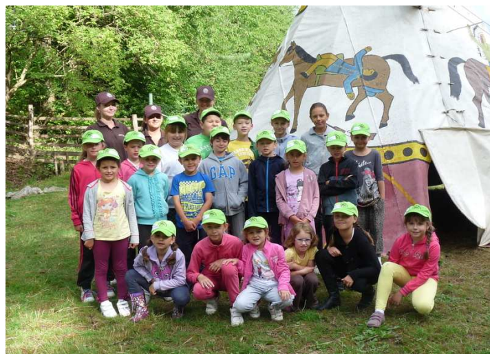
Letný jazdecký „Tábor v sedle“, júl 2014

Okrem denného tábora sa počas leta uskutočnilo na Gazdovstve Uhliská v Trenčianskej Závade viacero zaujímavých podujatí. V júni a v júli odštartoval 1. ročník Medzinárodných West-