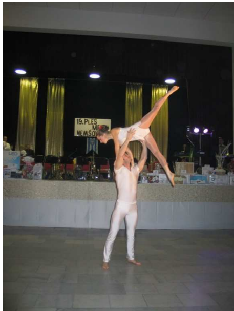
Vystúpenie akrobatickej skupiny Vertigo

Na začiatku kalendárneho roka medzi kultúrnymi aktivitami najviac rezonuje mestský ples. Ani v tomto roku nebolo tomu inak. Záujem o toto podujatie bol naozaj veľký, z roka na rok rastie jeho popularita. Plesová sezóna sa otvorila aj v našom meste 25. januára 2014 , keď krátko pred 19. hodinou začali prichádzať hostia 19. Mestského plesu . Ples mesta nie je