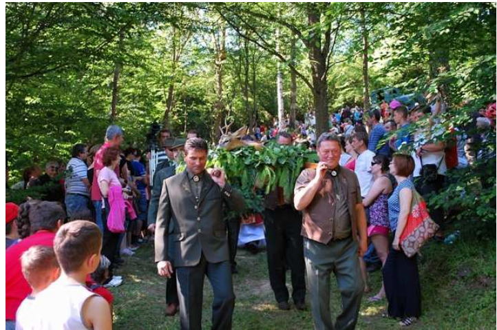
Slávnostná svätá omša sa niesla v duchu svätohubertských tradícií

Kultúrne centrum v Nemšovej 8. júna zaplnilo približne 500 hostí, ktorí prišli osláviť prvé narodeniny Šláger rádia . Medzi účinkujúcimi interpretmi nechýbala aj skupina Galactic z Nemšovej. Ľudové piesne v podaní viacerých hudobných skupín sa ozývali až do 18. hodiny popoludní a boli súčasťou programového vysielania Šláger rádia.