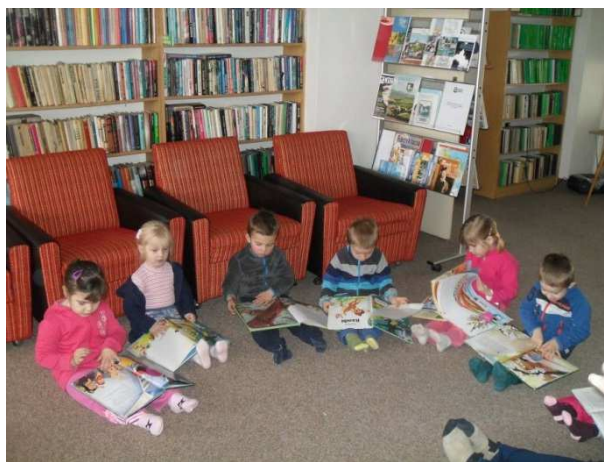
V rámci edukačných aktivít deti navštívili Mestskú knižnicu