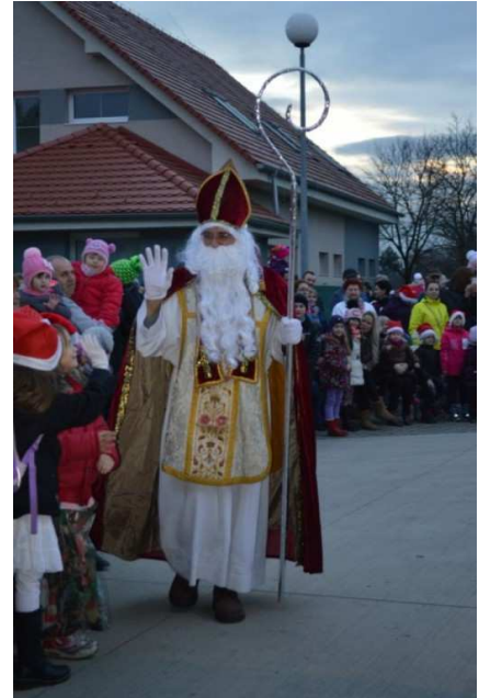
Nemšovský Mikuláš 2014