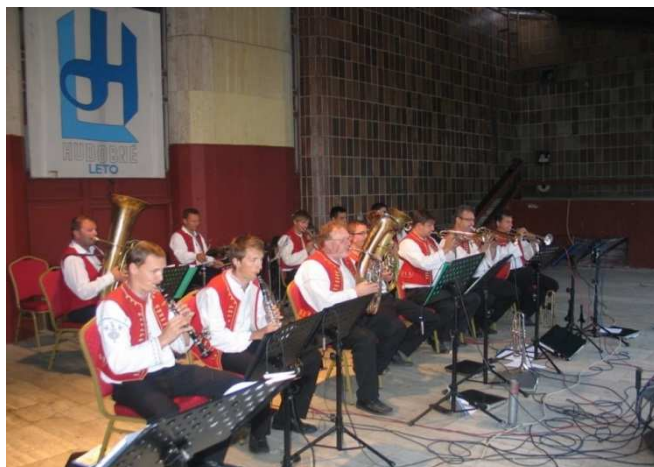
Počas Hudobného leta sa predstavilo 9 dychových telies

Dychová hudba Nemšovanka vystúpila v úvode ročníka, potom nasledovali Dychové hudby Nedanovčianka, Bodo-vanka, Mladík, Bučkovanka, Trenčian-ska 12, Nemšovský garážový orchester, Váhovanka a Dychová hudba Dúbra-vanka z Českej republiky zakončila sériu letných koncertov. Vďaka deviatim kva-litným hudobným telesám strávili mi-lovníci ľudovej hudby príjemné chvíle. Tradične známe aj menej známe melódie piesní majú každý rok svojich stálych priaznivcov.