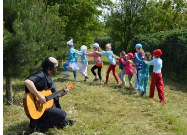
Súťaž o pečiatku s rôznymi rozprávkovými bytosťami

Luborecká dolina sa v sobotu 7. júna 2014 už po siedmykrát zaplnila milovníkmi prírody vďaka sviatku svätého Huberta , ktorý sa slávi pri príležitosti júna - mesiaca poľovníctva. Nielen lesníci, poľovníci, ale aj turisti a ľudia zo širokého okolia prišli stráviť horúci júnový deň k Studničke pod Košármami, kde bol pripravený rôznorodý program pre deti i dospelých. Slávnostná svätá omša spojená so svätohubertskými tradíciami sa začala o 15.00 hodine posvätením masívneho dreveného kríža, ktorý osadili pri tejto príležitosti členovia občianskeho združenia Hubert. Po jej skončení bol pripravený guláš a občerstvenie. V programe nechýbal skautský tábor, vlastnoručné razeň príležitostnej mince, streľba zo vzduchovky na terč, maľovanie na tvár, z ľudových remesiel boli pripravené ukážky výroby hrnčiekov na hrnčiarskom kruhu, či výroba príležitostných pohľadníc s pečiatkou. Najviac zaujali domácich i zahraničných návštevníkov ukážky sokoliarskych dravcov.