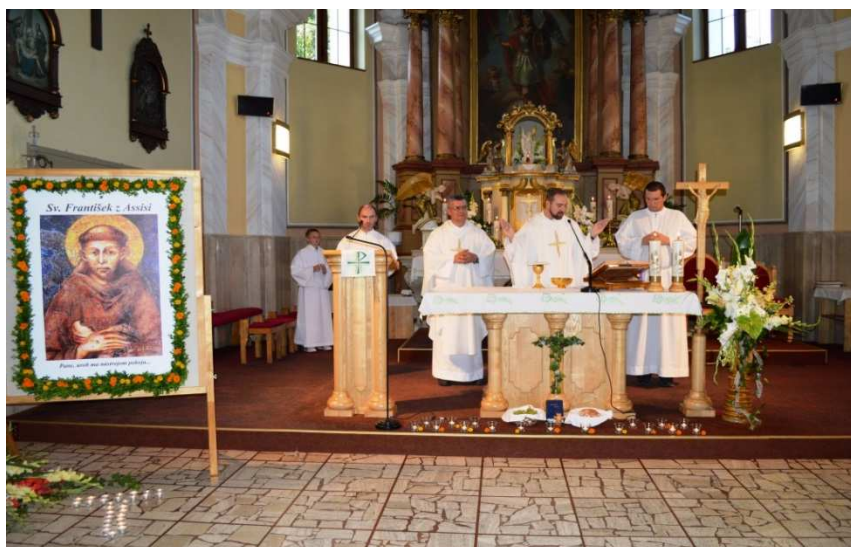
Slávnosť zloženia sľubov žiadateľov do Františkánskeho svetského rádu.