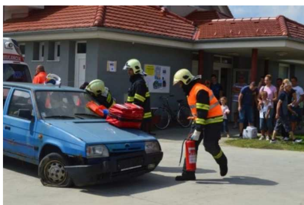
Ukážka náročnej práce Hasičského záchranného zboru

Mesto Nemšová usporiadalo pre občanov 23. augusta 2014 jednodňový autobusový zájazd na zámky južnej Moravy . Návšteva Valtického a Lednického zámku očarila 46 účastníkov výletu. Po prehliadke zámkov program pokračoval v Aquaparku Moravia – najväčšom aquaparku v strednej Európe. Tí, ktorí nevyužili možnosť kúpania sa, užili si oddych v krásnom