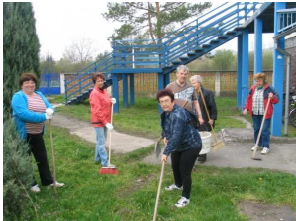
Členky Senior klubu pri prácach jarného upratovania

V dňoch 4. – 5. apríla 2014 sa v meste konali práce jarného upratovania . Na výzvu „ Za čisté mesto “ zareagovali aktívne všetky kluby, zväzy a spoločenstvá pôsobiace v Nemšovej. Okrem občanov a podnikateľov mesta sa do prác zapojili aj pracovníci Mestského úradu a členovia jednotlivých organizácií mesta. Akcia, ktorá sa konala pod záštitou primátora, bola