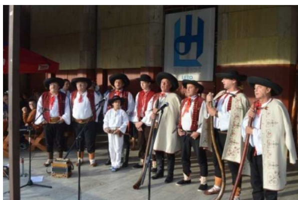
Vystúpenie Folklornej skupiny Trombitáši Javorník Lúky