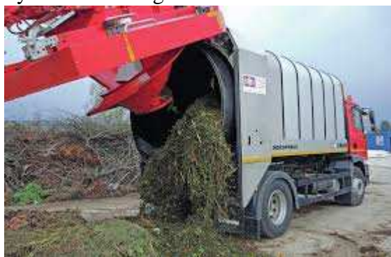
Bioodpad z kosenia dovezený do kompostárne

Ako sme informovali v minulom ročníku Kroniky mesta Nemšová, v našom meste bolo vybudované Regionálne centrum zhodnocovania biologicky rozložiteľného materiálu za