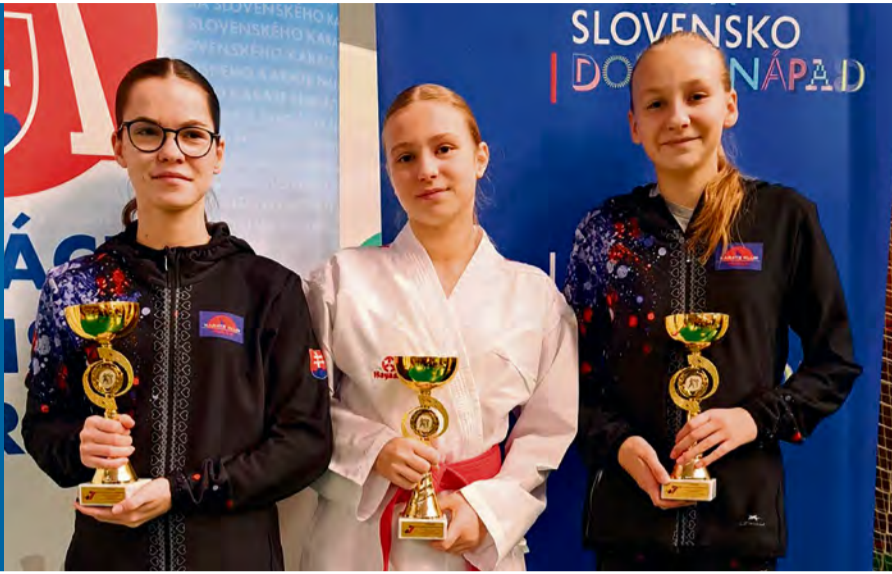
Vítazky Slovenského pohára

DVE MAJSTERKY SLOVENSKEJ REPUBLIKY, TRI VÍTAZKY SLOVENSKEHO POHÁRA A 9. Miesto ZO SÉRIE SVETOVÉHO POHÁRA MLÁDEŽE