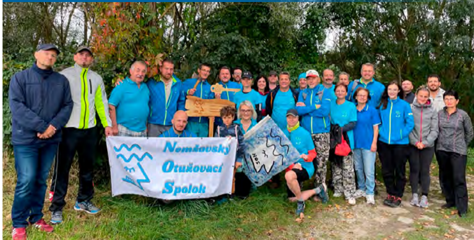
Otváranie otužileckej sezóny

Nemšovský otužilecký spolok (NOS) dňa 8. októbra o 10:00 hodine slávnostne otvoril novú otužileckú sezónu. Zatiaľ, čo sa mnohí tešili ešte z teplej jesene, otužilci sa už nevedeli dočkať vytúženej zimy. A tak zobrali plavky a dobrú náladu, a zavolali nás.