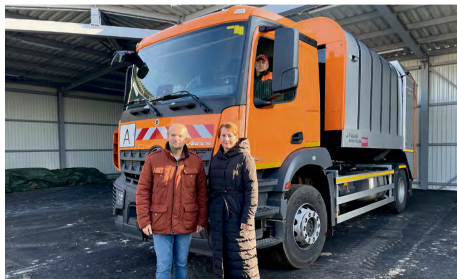
Nové vozidlo na triedený odpad