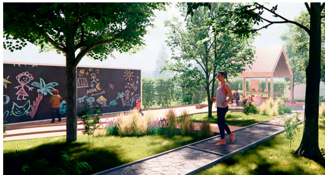
Vizualizácia oddychovej zóny v blízkosti kúpaliska v Nemšovej

► VÝZVA: INTERREG SK-CZ/2023/2_Kultúra - INTERREG SK-CZ/2023/2_Kultúra (cezhraničná spolupráca)