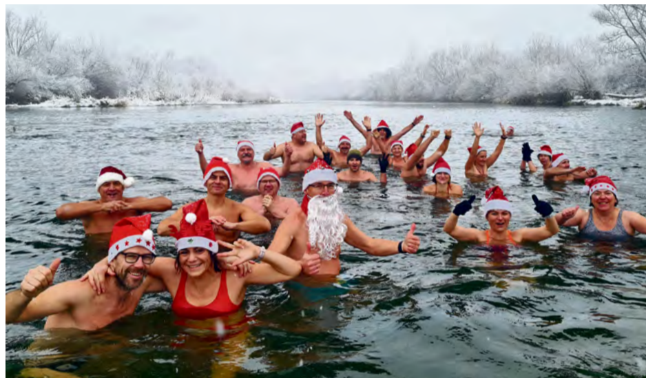
Mikulášske otužovanie (teplota vody 3-4 stupne)