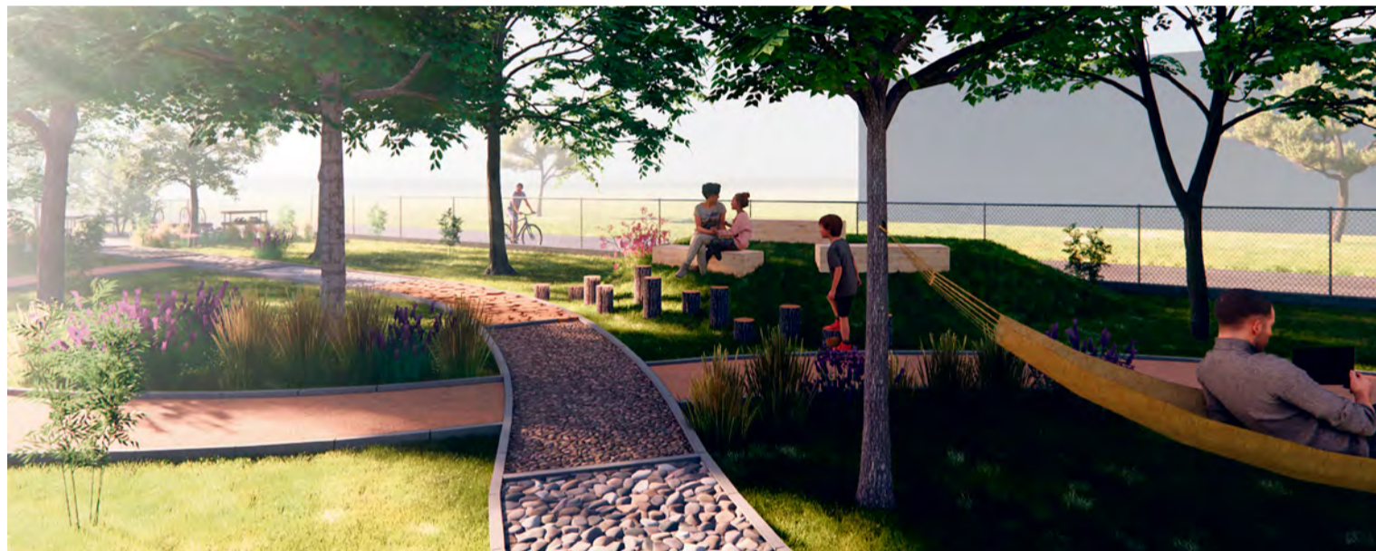
Senzorický chodník v oddychovej zóne

mesto Nemšová nielen zo strany rieky Vlára. Tieto senzory monitorujú zmeny hladiny vody a pri náraste hladiny ihneď automaticky informujú príslušné orgány obce, vedenie aj samotných občanov, a to nielen v danej obci, ale aj v obciach ďalších. Táto komunikácia prebieha prostredníctvom siete LoRaWAN do mobilných aplikácií, e-mailov či SMS správ, čo umožňuje rýchlu reakciu na potenciálnu hrozbu. Informácie budú dostupné aj na spoločnom webe.