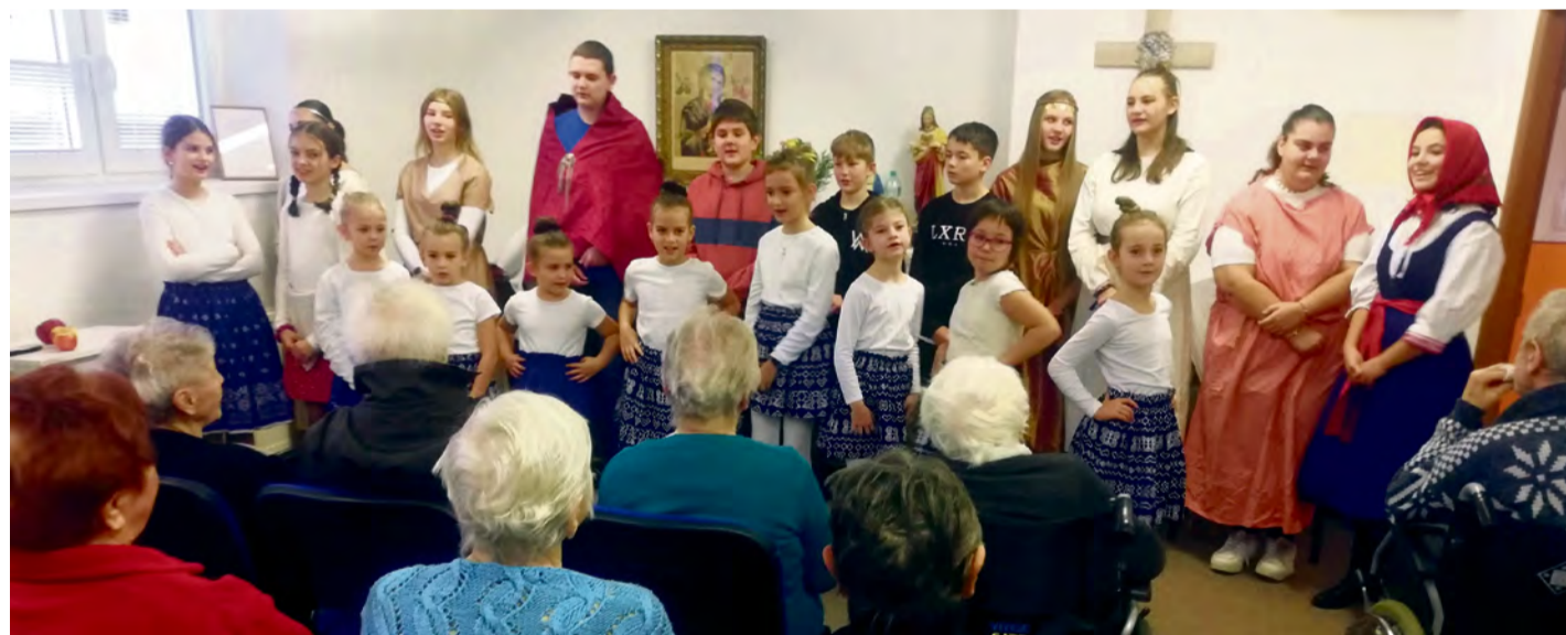
Návšteva CSS