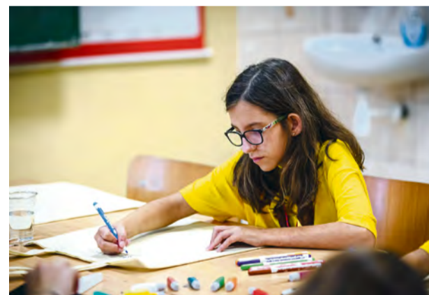
Účastníčka na workshope v čajovni