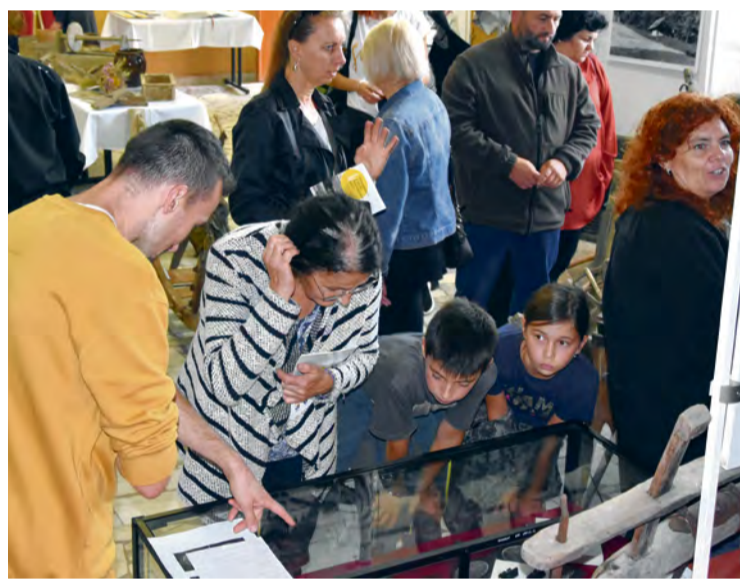
Návštevnosť počas víkendu bola nadpriemerná

li. Prítomní si mohli z výstavy odniesť okrem zážitku aj niečo hmotné, 28-stranovú brožúrku s historickými faktami o obci. Táto bola vytlačená v náklade 250 kusov.