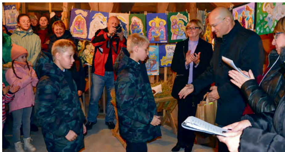
Žiaci pri odovzdávaní ceny za najlepší Betlehem