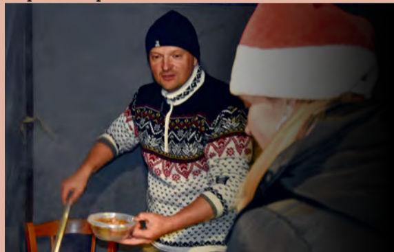
Podávanie primátorskej kapustnice

pozrieť príbeh o zlých a dobrých skutkoch, ktorý rozosmial a mnohých malých aj rozplakal. Príchod Mikuláša rozžiari očka mnohých detí, ktoré spolu s ním slávnostne rozsvietili vianočný stromček.