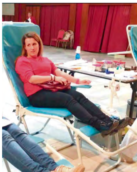
Darkyňa na odbere krvi v októbri v KC Nemšová

Pripravila: Miroslava Bachratá