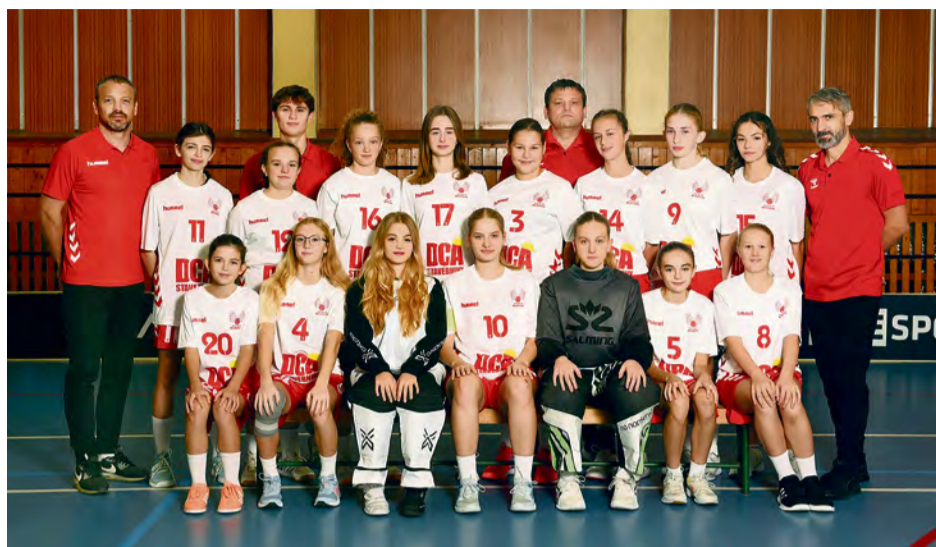
Staršie žiačky NTS Nemšová, sezóna 2023-2024