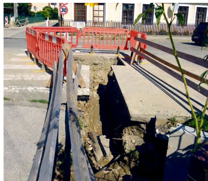
Rekonštrukcia plynovodu v mestskej časti Ľuborča

Autor: Miroslava Bachratá