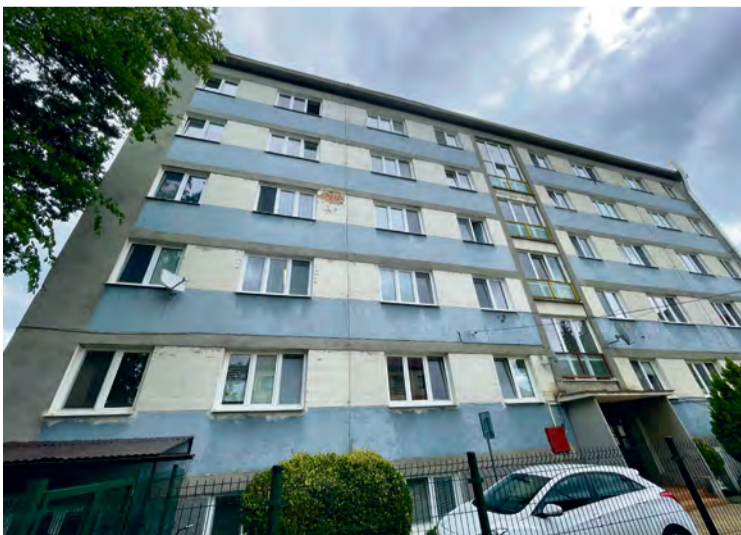
Súčasný stav vonkajšej fasády CSS

na inštalácii nových svietidiel využívajúcich LED technológiu, inštalácia fotovoltických systémov za účelom výroby elektrickej energie pre vlastnú spotrebu budovy o výkone 18,2 kWp a batériových systémov, ktoré zabezpečia ukladanie energie v prípade prebytku výroby z fotovoltických systémov a spotreby energie, výmena výťahu.