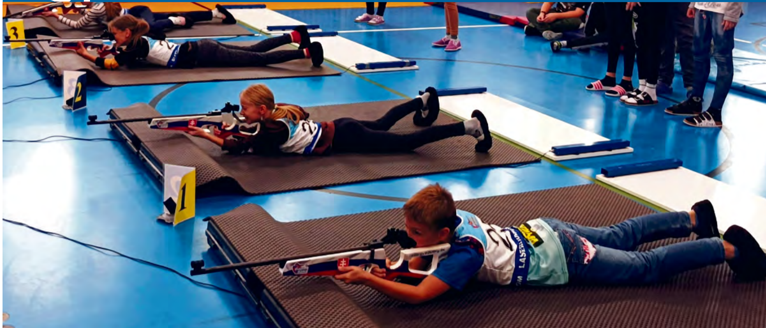
Simulovaná strelba na terč z laserových pušiek