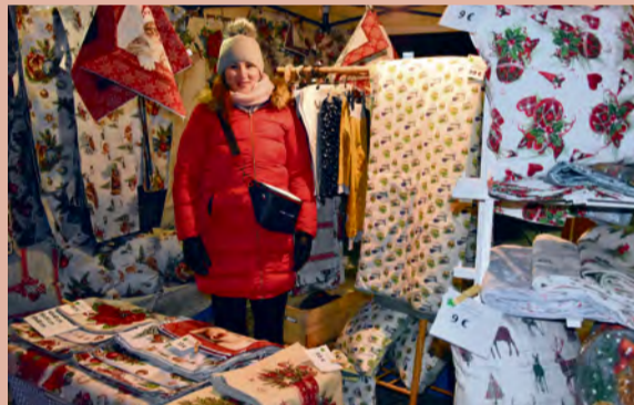
Trhy plné vianočného tovaru

decembra mohli obyvatelia nášho mesta využiť príležitosť nadýchať sa vianočnej atmosféry aj priamo v Nemšovej. V amfiteátri mestského múzea na nich od 15.00 hodiny čakalo 16 stánkov. Na svoje si prišli nadšenci ručných prác, detskej tvorby v podobe výrobkov detí našich škôl, a labužníci si mohli