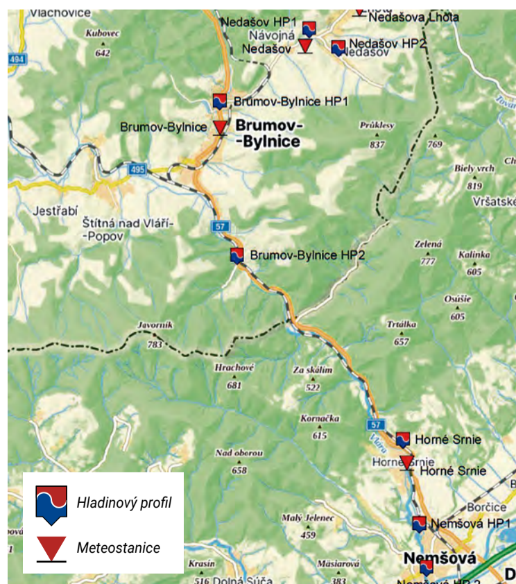
Cezhraničný projekt bude prínosom pre mnohé obce

Autor: Peter Králik