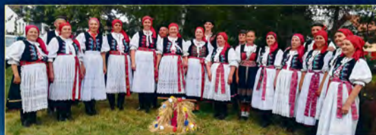
Folklórna skupina Liborčan z Luborče