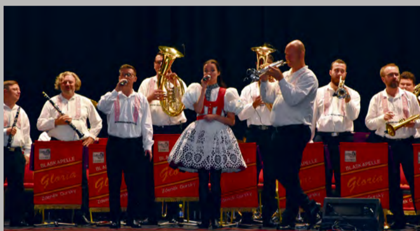
Vystúpenie skupiny Gloria