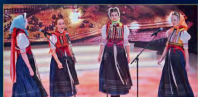
Dievčenská spevácka skupina Vinok zo Šarišského Jastrabia