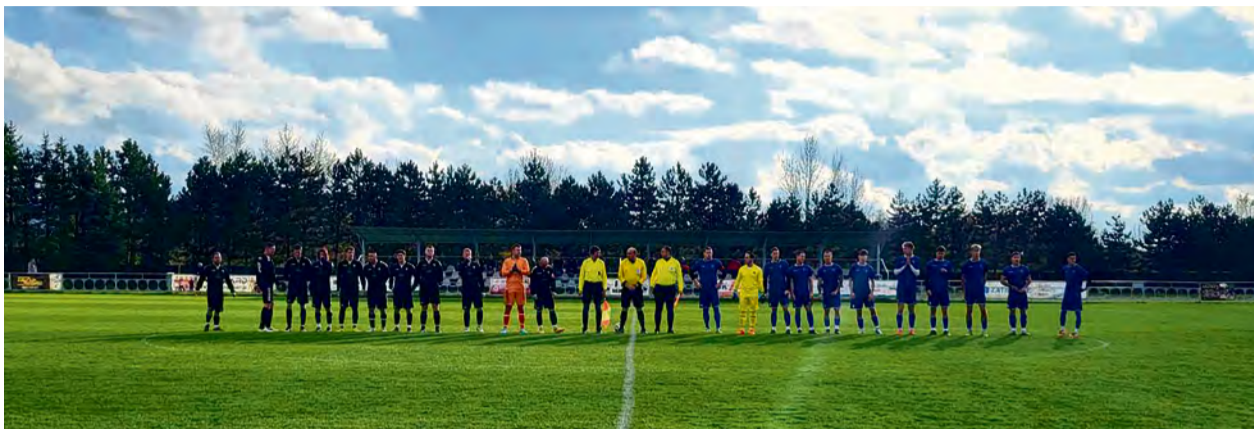
Hráči Nemšovej a Luborče zdravia tribúny pred zápasom 15. kola

Všetky tri mužské futbalové tímy z nášho mesta sa aj v sezóne 2023/24 stretávajú v rovnakej lige. Najvyššia oblasťná súťaž, 7. liga HUMMEL ObfZ Trenčín, ponúkla vo svojej jesennej časti trojicu derby zápasov. Zápas medzi mužstvami Nemšovej, Luborče a Klúčového sú okorené zaujímavými súbojmi blízkych priateľov, bývalých spoluhráčov a v neposlednom rade chalanov, ktorí bývajú v iných častiach mesta, ako v tých, ktorých dres na zápasoch obliekajú. Vo vzájomných vyrovnaných zápasoch túto polsezónu najlepšie obstála Nemšová, ktorá využila na 100 % výhodu domáceho prostredia. Hoci Luborča ani v jednom z derby zápasov neinkasovala gól z hry, bude mať na jar čo svojim súperom vracať, keďže ani v jednom zo stretnutí na ihriskách súperov nestrelila gól a nezaznamenala bodový zisk.