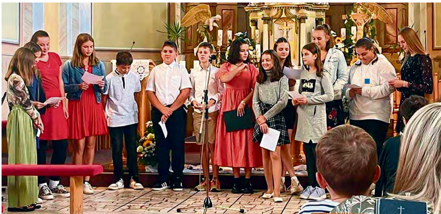
Akadémia sv. Michala

AKADÉMIA K SV. MICHALOVI Patróna našej základnej školy, ale aj mesta Nemšová - sv. Michala, považuje cirkevná tradícia za najvyššieho spomedzi všetkých anjelov.