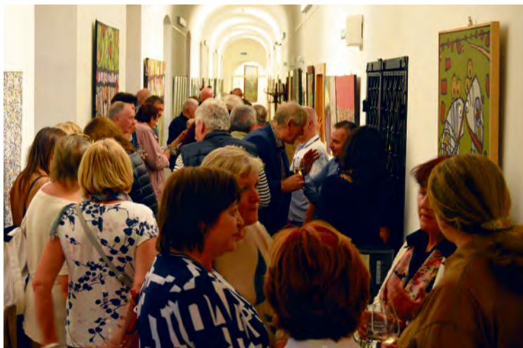
Chodba dubnického kaštieľa bola plná návštevníkov