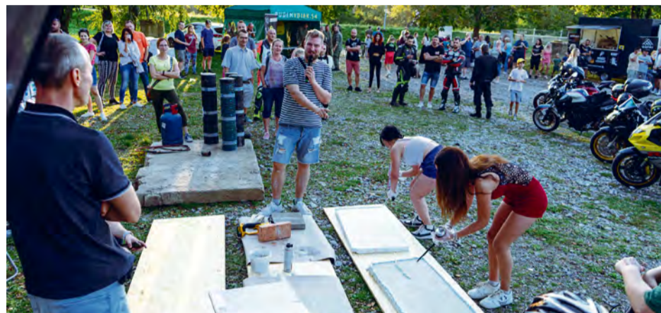
Aktivity využiteľné v živote

Rodinky s deťmi sa mohli zapojiť do rozličných workshopov, napríklad stavanie domov zo zvyškov polystyrénu, fúrikovanie piesku, dokonca i maľovanie na keramický privesok. Počas programu prebiehala aj súťaž v čoraz populárnejšom Cornhole. Cieľom tejto hry je hodiť vrečko naplnené kukuricou tak, aby prešlo die-