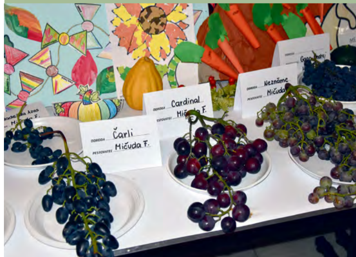
Odrody hrozna F. Mičudu na výstave ovocia a zeleniny

► Nie je problémom zozbierať výpestky na výstavu, ale za pár rokov bude možno problém, že ju nebude mať kto robiť. OZ prídomových záhradkárov by uvítalo nových členov, ktorí by pokračovali v tomto ušľachtilem poslaní.