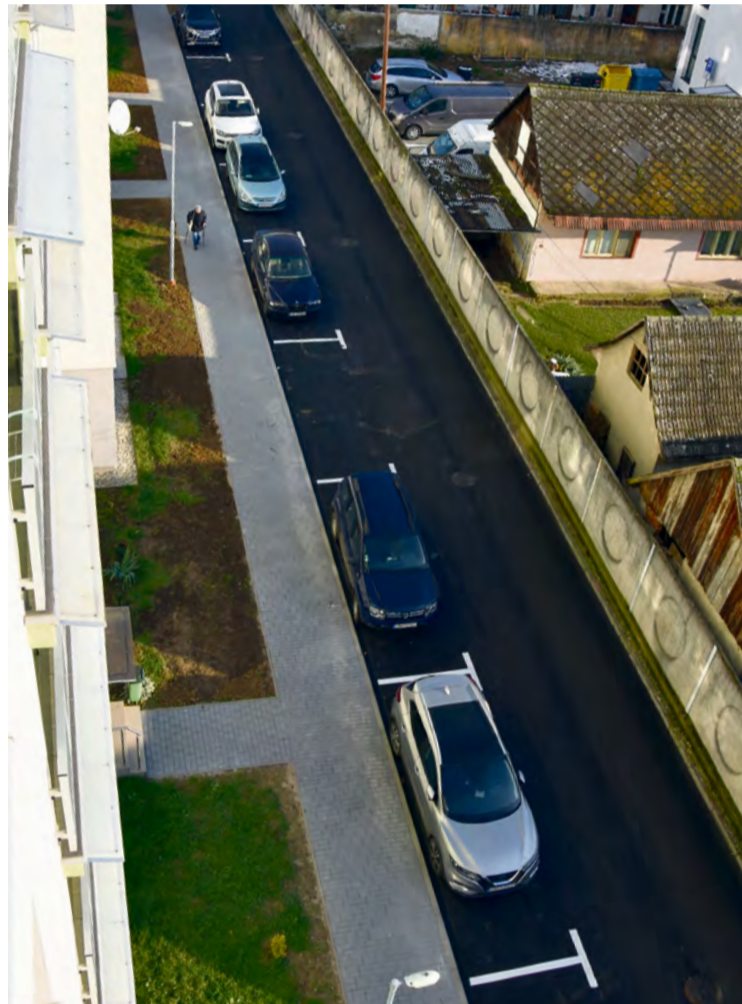
Pribudlo 42 nových parkovacích miest

Komplikovaná situácia na ulici J. Palu súběžná za tržnicou, a to nielen pre smetiarske auto, je dnes minulosťou. Na ulici dlhodobo pretrvával neúnosný stav s parkovaním vozidiel, ako aj so samotným prejazdom automobilov touto ulicou. Často sme mohli vidieť „smetiarske auto“, ako sa snaží ulicou prejsť, pričom jedným kolesom prechádzalo po chodníku a vyhýbalo