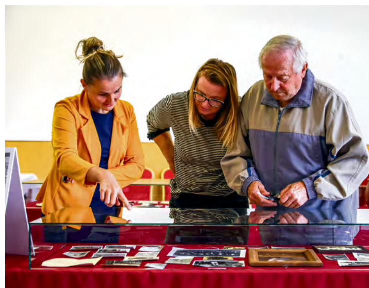
Autorka výstavy počas komentovanej prehládky