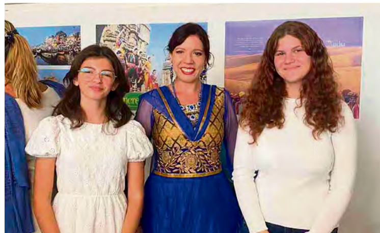
Žiačky počas ocenenia na indickom veľvyslanectve

• Chlapci 5. a 6. ročníka sa zúčastnili futbalovej súťaže