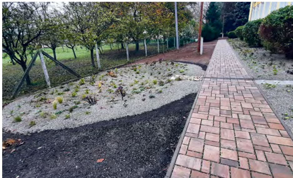
Úprava okolia a zrekonštruovaná prístupová cesta medzi školami