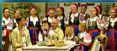
Folklórna skupina Dolina z Omšenia

Kde: Kostol sv. Michala Archanjela v Nemšovej