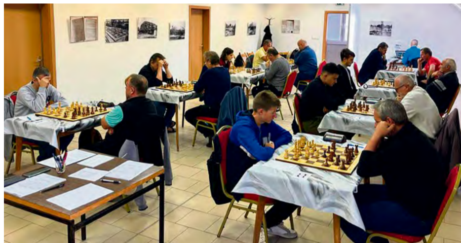
Jeden z pravidelných šachových turnajov v Mestskom múzeu Nemšová

1. kolo Nemšová/H.Srnie – Dubnica D 8 : 0 | 2. kolo Chynorany – Nemšová/H.Srnie 5,5 : 2,5 | 3. kolo Nemšová/H.Srnie – Lehota pod Vtáčnikom 7 : 1 | 4. kolo Nemšová/H.Srnie – Včielka Púchov 6 : 2 Priebežné 2. miesto v 3.B2 lige