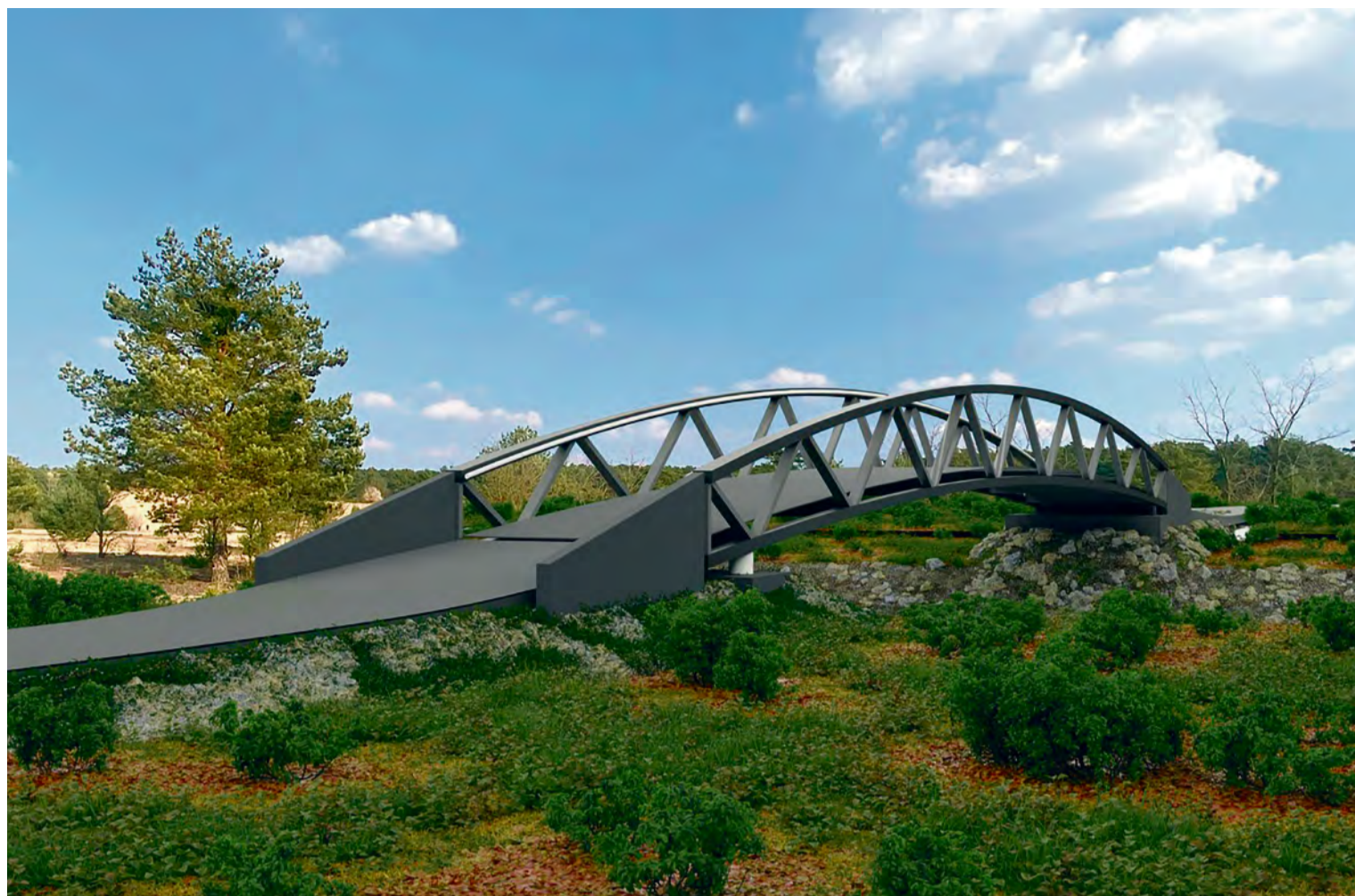
Vizualizácia budúceho cyklomostu cez rieku Vlára medzi Nemšovou a Horným Srníom

► Základným prvkom tejto koncepcie sú snímače vodnej hladiny umiestnené v obciach na hornom toku rieky Vlára a takisto pri sútoku riek Váhu a Vlára, kedy bude možné predikovať možné ohrozenie pre