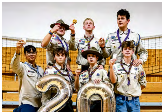
Rangeri 117-teho zboru

Celý názov nášho zboru je 117. zbor sv. Františka z Assisi, Horné Srnie - Nemšová - Dolná Súča. Vodcovia vybrali za patróna zboru sv. Františka z Assisi, lebo je známym svojou láskou k prírode a všetkému živému. A keďže