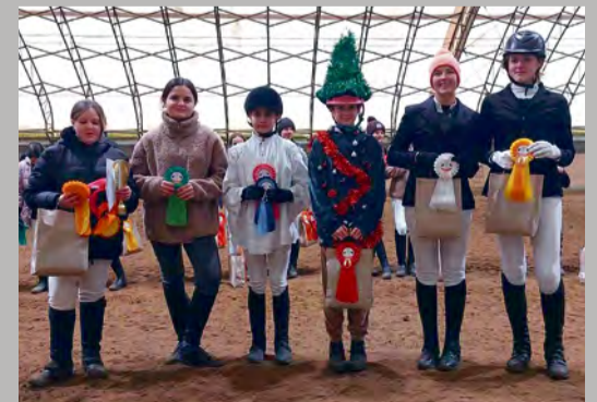
Víťazky v súťaži Benjamín Cup