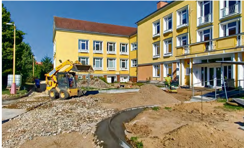
Stavebné práce na projekte počas leta

■ Z poskytnutého nenávratného finančného príspevku bolo v rámci projektu zakúpené aj záhradné náradie za účelom starostlivosti o zeleň a to – plotostrih 2 ks, vysávač listia 1 ks, fukár listia 2 ks, krovínorez 2 ks, vyvetvovacia píla 1 ks, benzínová kosačka 1 ks, bubnová kosačka 1 ks, univerzálne rozmetadlo 1 ks, prívesný fúrik nosnosť 300 kg 1 ks, hospodársky fúrik 210 l dvojkolesový 1 ks, záhradnícke nožnice teleskopické 1