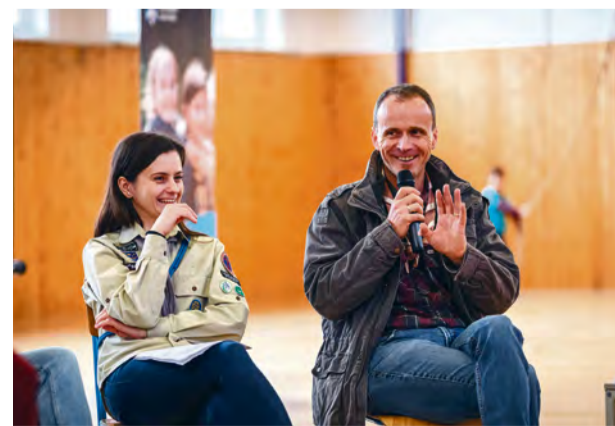
Diskusia s vodcami a osobnosťami zboru