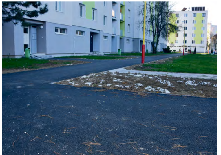
Obnovili sa chodníky pre obyvateľov bytových domov

Obnovu chodníkov, rekonštrukciu a rozšírenie cesty, vybudovanie pozdĺžnych parkovacích plôch pred bytovým domom ako aj vybudovanie nových parkovacích miest v tesnom okolí bytového domu. Celkovo vznik-