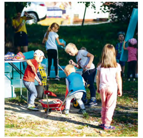
Aj deti sa zapojili do rozličných aktivít

ké. Mnoho ľudí nás odrádzalo, aby sme vôbec niečo v Nemšovej organizovali, vraj istotne nikto nepríde. Naše krédo je však "Neskúsiš - nevieš", a keďže podobné akcie organizujeme už niekoľko rokov v Novej Dubnici, šli sme do toho. A výsledok? Nemšovania boli úplne skvelí! Prišlo veľa dospelých a koopec detí - naša budúcnosť. Vymýšľali, maľovali, jednoducho nás zase inšpirovali k tomu, aby sme akciu, ak Pán Boh dá, znovu zopakovali. Ďakujeme mestu Nemšová za spoluprácu a všemožnú pomoc. Tešíme sa opäť na všetkých na jeseň 2024."