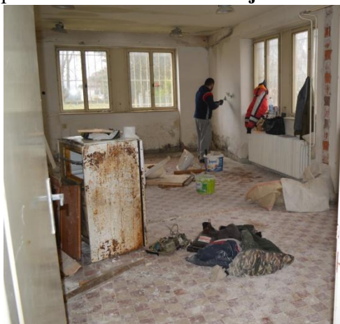
Priestory bývalej pracovne pred rekonštrukciou

Pomoci v podobe rekonštrukcie bývalej pracovne pri MŠ v Ľuborči v celkovej výške nákladov 20 460 eur sa dočkala v tomto roku aj ZUŠ Nemšová . Za účelom rozšírenia priestorov ZUŠ Nemšová sa počas letných prázdnin vynovili nevyužívané priestory bývalej pracovne na Ľuborčianskej ulici . Práce vykonávali aktivační pracovníci, opravila sa strecha,