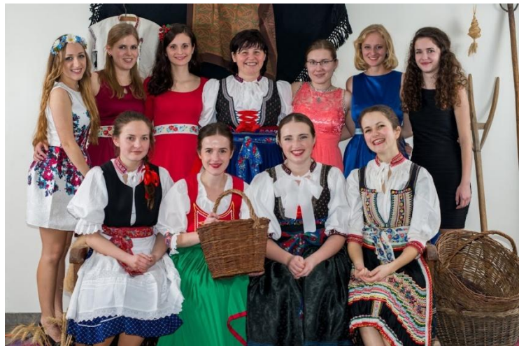
Skautský ples, 6. február

Skauti pôsobia v meste Nemšová 13 rokov. V jesennom čísle časopisu Skaut vyšiel článok spolu s fotografiami o ich aktivitách. Spolupracujú s miestnymi organizáciami ako MAS Vršatec, ZUŠ Nemšová, OZ Hubert Ľuborča a mestom Nemšová. Organizujú akcie pre verejnosť, Betlehenské svetlo, Deň narcisov, ekoaktivity, skautský tábor, rozprávkový les a pod.