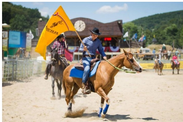
Prvé rodeo 2. – 3. júla 2016

Medzi každoročné aktivity organizované Ranchom 13 patrí Galavečer SAWRR (Slovenská Asociácia Western Ridingu a Rodea), ktorý sa uskutočnil 13. februára v Kultúrnom centre v Nemšovej, rančová zabíjačka 5. marca a husacie hody 11. novembra . V dňoch 19. – 20. marca sa uskutočnil na ranči verejný tréning , na ktorom si návštevníci mohli pozrieť jazdcov, ako sa pripravujú na sezónu. Okrem tréningu mali k dispozícii detské ihrisko, vozenie sa na koni, špeciality v bufete a v nedeľu tradičný nedeľný obed.