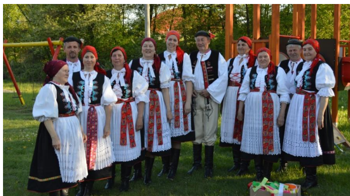
Stavanie mája v Trenčianskej Závade