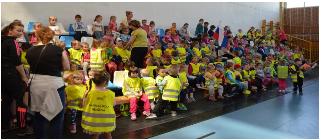
Z 5. ročníka florbalového turnaja o putovný pohár materskej školy

V športovej hale v Nemšovej sa 23. mája uskutočnil 5. ročník florbalového turnaja o putovný pohár materskej školy . Škôlkarske tímy hráčov z elokovaných prevádzok predviedli nevídané výkony. Tanculienky - cheerleader z tanečného krúžku so svojou choreografiou roztlieskali fancluby, diváci povzbudzovali, ako len vládali, a hostia, ktorí sa na turnaji zúčastnili po prvýkrát, sa neprestávali diviť. Takí malí a toľko športového nadšenia! Tohtoročným víťazom sa stal tím detí z triedy na Ulici Ľuborčianskej.