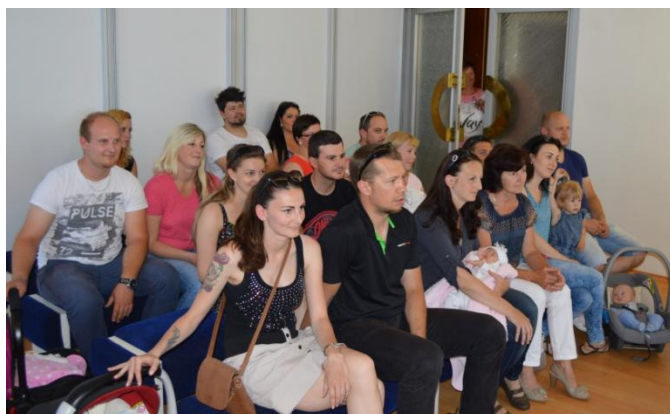
Vítanie detí do života