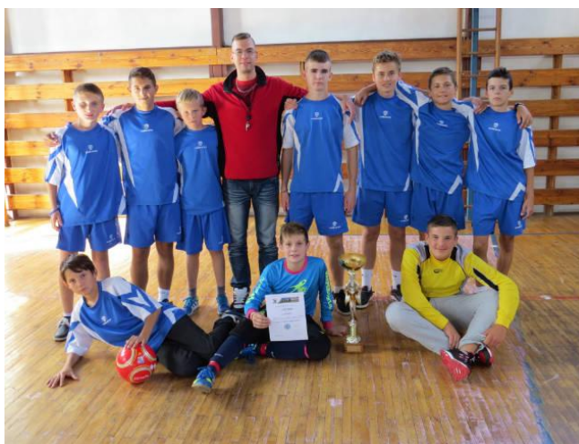
Obvodný turnaj o putovný pohár sv. Michala