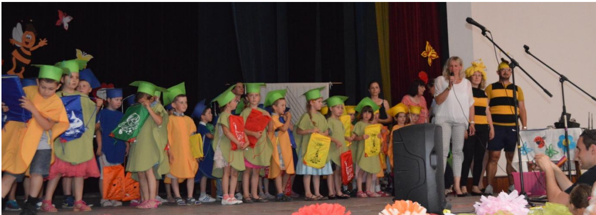
Slávnostný galaprogram detí materskej školy v šk. roku 2015/2016

Okrem tradičných udalostí spojených so sviatkami počas školského roka sa uskutočnilo niekoľko divadelných predstavení a hudobno-výchovných koncertov . Hneď v úvode školského roka 23. septembra divadelné predstavenie „Neboj sa“, 20. novembra divadelné predstavenie „Ako psíček a mačička drhli dlážku“, 5. novembra hudobno-výchovný koncert „Simsalabim“, 7. decembra koncert MIA v Kultúrnom stredisku Ľuborča, 4. februára divadlo „Ako dedko s babkou dobre nažívali“, 18. marca „Tik-tak“ a 21. júna divadelné predstavenie „Klauniáda“. Každá elokovaná trieda realizovala rôzne popoludnia s rodičmi . Dňa 24. septembra pri príležitosti Dňa mlieka tvorili zdravé mliečne nápoje, 1. a 14. októbra oslavovali Deň Jablka tvorivým popoludním a ochutnávkou bylinkových čajov, 6. a 28. októbra absolvovali tekvicovú slávnosť, tvorivé dielne zamerané na výrobu svetlonosov z tekvic, šarkanov, 19. novembra podujatie zamerané na zdravý životný štýl, 16. decembra tvorivé dielničky, výrobu vianočných ozdôb, svietnikov a pohľadníc, 21. decembra zdobenie medovníčkov s rodičmi, 11. - 12. mája besiedky pri príležitosti Dňa matiek, 16. mája jarné upratovanie s rodičmi a 15. júna Turecký deň.