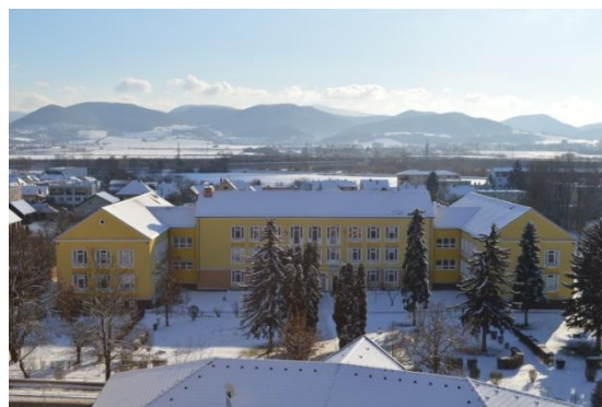
Zima v Nemšovej dňa 21. januára 2016

Podľa porovnania odchýlky od teplotného normálu bol február najteplejším mesiacom s priemerom teploty 4,8\text{ }^{\circ}\text{C} . V jeho druhej polovici bolo zaznamenané najvyššie denné maximum namerané na Slovensku vo februári od roku 1951 , a to 20,3\text{ }^{\circ}\text{C} v Bratislave. V Nemšovej bol priemer 6,1\text{ }^{\circ}\text{C} s najvyššie nameranou teplotou 11,6\text{ }^{\circ}\text{C} dňa 22. februára.