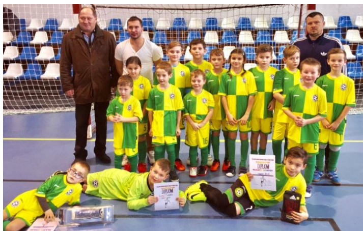
FK mladší žiaci