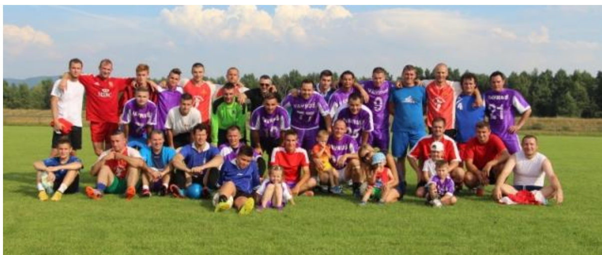
Futbalový zápas Vavrušovci a Ostatní

Kľúčovské hody v dňoch 29. júla až 1. augusta pri kaštieli v Kľúčovom poskytli širokej verejnosti bohatý kultúrny program, ktorý začal v piatok letnou open-air párty pri kaštieli s DJ Gonosom & Lacym a pokračoval v sobotu vystúpením hudobnej skupiny Galactic. Sobotné popoludnie bolo určené aj pre najmenších, kedy sa uskutočnil 6. ročník detských hodov pod názvom KPúčikovo . Súčasťou programu boli netradičné olympijské hry, vozenie sa na koni, disko, maľovanie na tvár či cukrová vata. O 15.00 hod. vystúpila so svojim detským