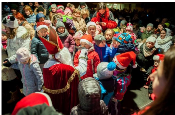
Amfiteáter mestského múzea-Mikuláš

Slávnostná atmosféra Vianoc roku 2016 zavládla v Nemšovej spolu s novou výzdobou na vianočnom stromčeku a novým vianočným osvetlením v uliciach mesta. Vedľa vianočného stromčeka bol umiestnený betlehem z prírodných materiálov a dvaja svietiaci anjeli v životnej