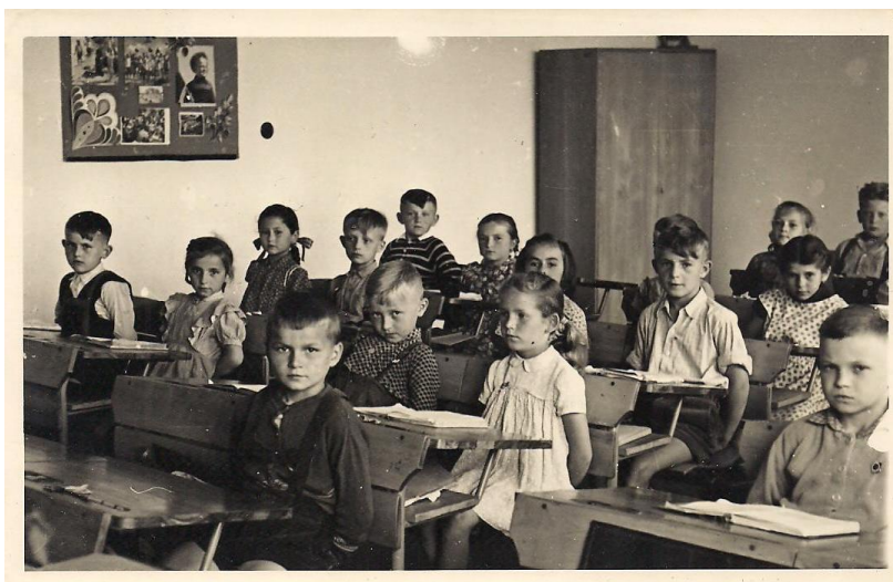
Druhá trieda, rok 1957

V školskom roku 1956/1957 dňa 15. septembra 1956 slávnostne otvorili modernú 14-triednu budovu základnej školy. Pri prehliadke školy verejnosť veľmi pozitívne hodnotila architektonické riešenie a vybavenie školy. V suteréne sa nachádzali šatne pre žiakov a kotolňa na tuhé palivo, na dvoch podlažiach voňali novotou priestrané učebne aj učebne na odborné vyučovanie, kabinety s novými učebnými