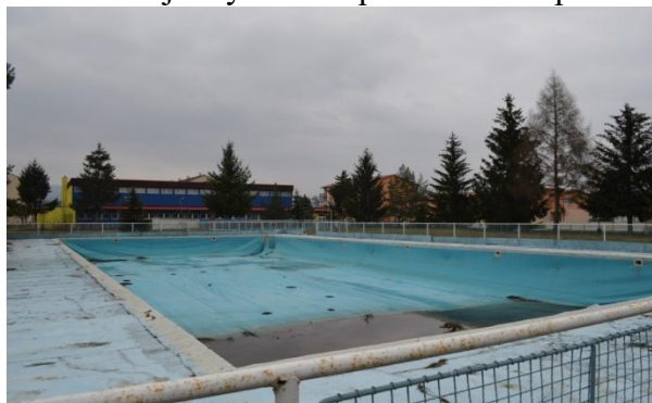
Letné kúpalisko pred rekonštrukciou

Najväčšou investíciou roka bola dlho očakávaná rekonštrukcia letného kúpaliska v Nemšovej. Výzva na predkladanie ponúk na opravu areálu vonkajšieho kúpaliska bola