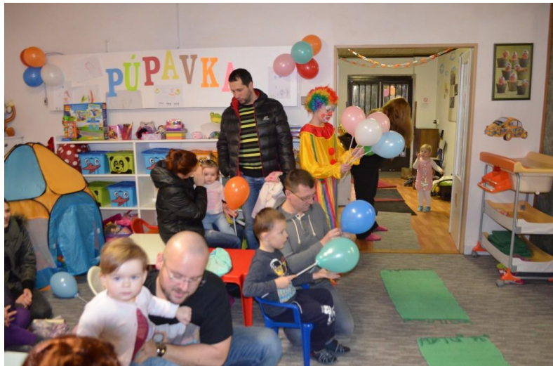
Otvorenie materského centra

Rodičom a ich deťom ponúkajú detskú herňu plnú hračiek a malé interiérové ihrisko, každú stredu v dopoludňajších hodinách mamičkám s deťmi cvičenie na fitloptách a Happy Baby a vo večerných hodinách jogu pre dospelých. Podľa ročného obdobia a rôznych sviatkov organizovali tvorivé dielničky pre rodičov s deťmi (Veľká noc, Deň matiek a výroba svetlonosov). Podľa ročného obdobia bolo zamerané aj fotenie detí v materskom centre, o ktoré bol vždy veľký záujem. Počas roka trikrát zorganizovali bazárik, kde mohli mamičky predat' alebo kúpiť oblečenie pre deti a dospelých, hračky a pomôcky pre najmenších. Na každom bazáriku sa vyzbieralo aj množstvo oblečenia a vecí na darovanie. Ponúkali aj rôzne prednášky, školenia, hry pre deti, opekačky a pod.