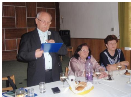
Posedenie členov ZO ÚŽS v Nemšovej