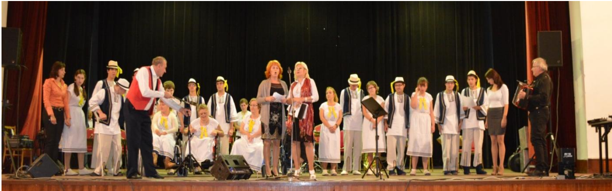
Kultúrny program na posedení MO Jednoty dôchodcov a Senior klubu