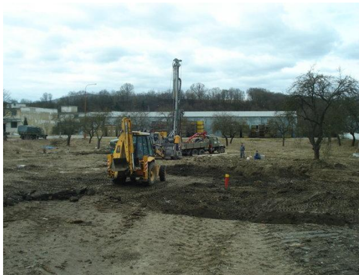
Sanačné práce na vojenskej základni v Nemšovej

Vojenská základňa v Nemšovej sa po dvadsiatich piatich rokoch zbavila pozostatkov po sovietskej armáde, ktoré tu zostali v podobe značnej environmentálnej záťaže. Podľa geologickej správy, ktorú si dalo vypracovať ministerstvo obrany, bola v časti kasární silne znečistená pôda ropnými látkami. Do životného prostredia sa dostali v dôsledku nevhodného uskladnenia a manipulácie. Sanačné práce sa robili na základe zistení prieskumných vrtov, ktoré odhalili kontamináciu spodných vôd v hĺbke desiatich metrov. Sanáciu tejto lokality dlhodobo nikto neriešil,