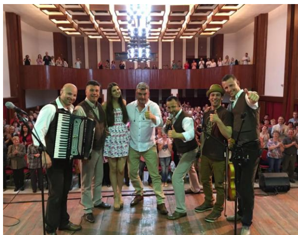
Hudobná skupina Kandráčovci

V Nemšovej po prvýkrát 24. mája vo veľkej sále kultúrneho centra vystúpila hudobná skupina Kandráčovci . Piesňami Včielka a Dva duby zožali veľký potlesk a prítomní odchádzali naplnení bohatým kultúrnym zážitkom. Na predstavenie sa predalo približne 280 vstupeniek.