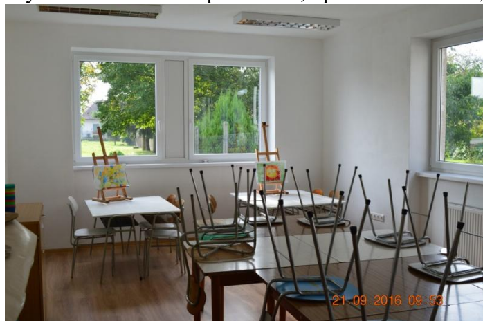
Priestory bývalej pracovne po rekonštrukcii