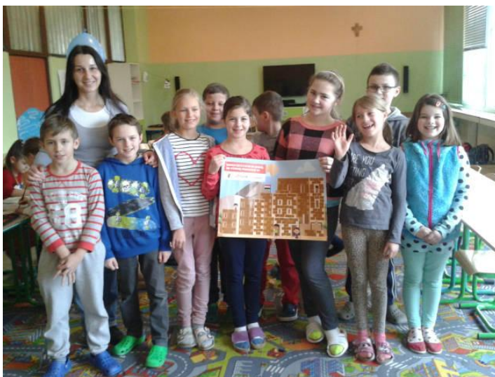
Žiaci 4. ročníka a fiktívne príbytky pre deti