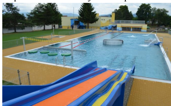
Letné kúpalisko po rekonštrukcii

vyhlásená 19. novembra 2015 a uchádzači mohli poslať súťažné podklady do 10. decembra 2015. Z 10-tich spoločností, ktoré v stanovenom termíne zareagovali, poslali cenovú ponuku dve. Vyhodnotenie súťaže sa realizovalo v dvoch kolách, nakoniec najnižšiu cenovú ponuku predložila spoločnosť Prestav Trenčín, s.r.o. vo výške 1 031 266 €. Zmluva so spoločnosťou Prestav Trenčín, s. r. o. bola podpísaná 7. marca .