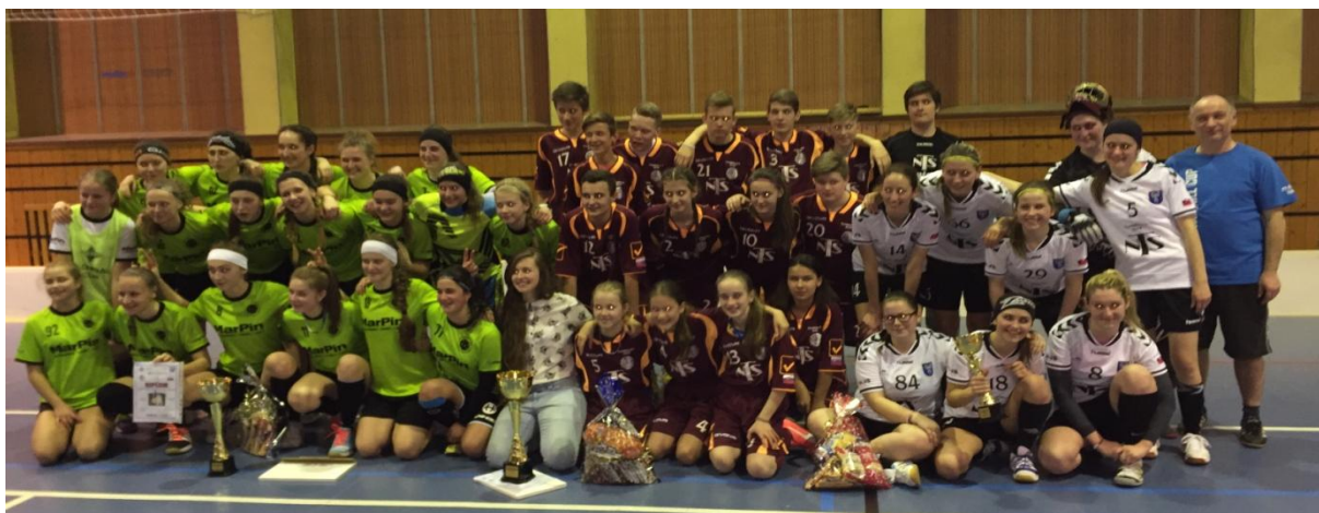
Veľkonočný turnaj vo florbale

Nominácia junioriek SR na prípravný zápas v Českej Rokytnici: