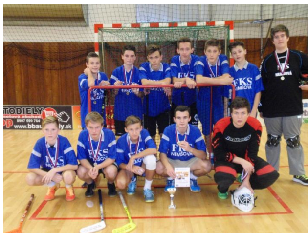
OXDOG florbal cup

Najviac sa darilo žiačkam vo florbale. V celoslovenskej súťaži OXDOG florbal cup vybojovali v dvoch kategóriách tretie miesta a v jednej kategórii druhé miesto. Škola sa zúčastnila medziškolskej súťaže cezpoľného behu údolím Váhu organizovanej v Bolešove a cezpoľného behu na okresnom kole na Ostrove v Trenčíne, kde získala 5. miesto. Do Behu pre zdravé srdce sa zapojili žiaci 1. a 2. ročníka. V krajskom kole stolného tenisu vyhrali chlapci 4. miesto a dievčatá 2. miesto. Futbalového turnaja O pohár sv. Michala sa zúčastnilo 10 žiakov a umiestnili sa na 2. mieste. Dievčatá vo