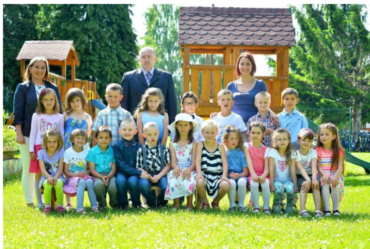
Deti Materskej školy sv. Gabriela

Predškolskú prípravu v MŠ sv. Gabriela absolvovalo 23 detí. Do 1. ročníka základnej školy pre školský rok 2016/2017 odišlo z Materskej školy sv. Gabriela 22 detí. Jednému dieťaťu bola odložená povinná školská dochádzka o jeden školský rok na žiadosť zákonného zástupcu a na odporúčenie pedagogicko-psychologickej poradne. Deň otvorených dverí pre deti predškolského veku a ich rodičov sa uskutočnil 26. novembra 2015, kedy si mohli pozrieť triedy 1. stupňa ZŠ sv. Michala.