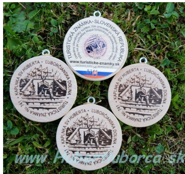
Turistická známka s vyobrazením Kaplnky sv. Huberta