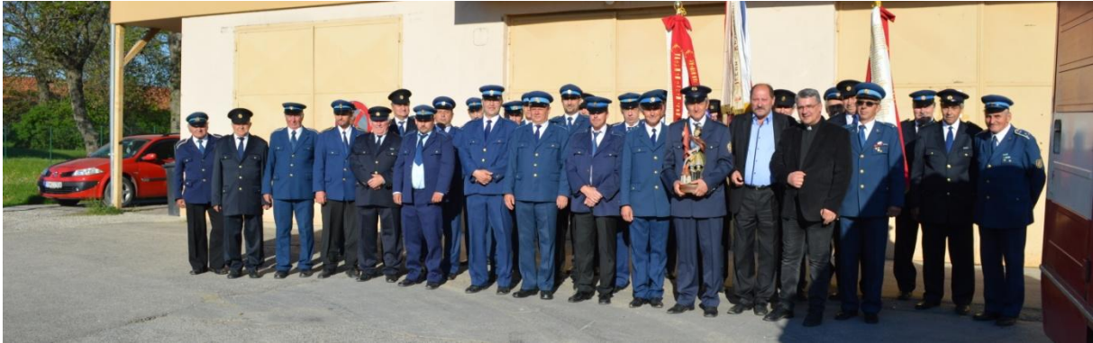
Dobrovoľný hasičský zbor Kľúčové na oslavách sv. Floriána