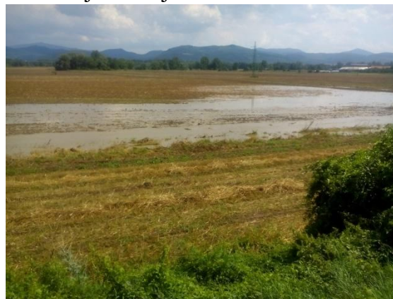
Polia v Nemšovej po dažďoch 29. júla

Medzi teplotne silne nadnormálne mesiace roku 2016 boli zaradené aj jún ( +2,6\text{ }^{\circ}\text{C} ), júl ( +2,1\text{ }^{\circ}\text{C} ) a september ( +2,4\text{ }^{\circ}\text{C} ). Podľa Slovenského hydrometeorologického ústavu rok 2016 mal o 2