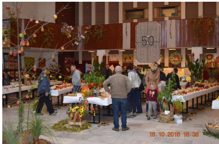
50. ročník výstavy ovocia, zeleniny a kvetov