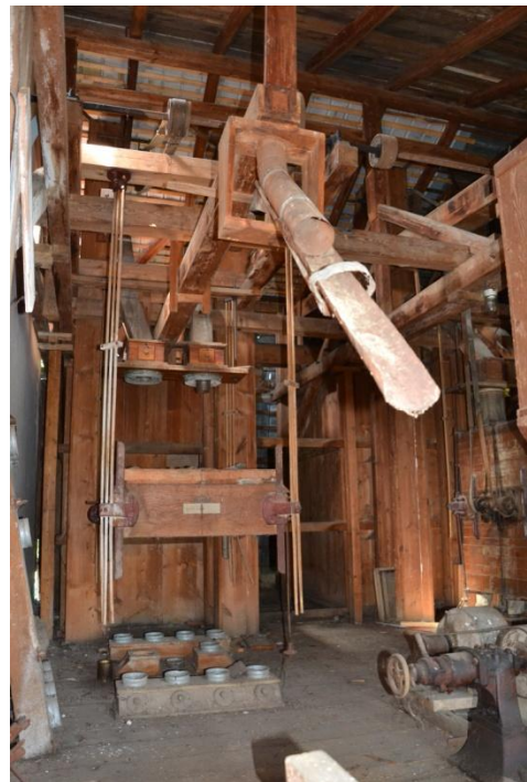
Interiér Králikovho mlynu

Záujem zapojiť sa do vyhlásenej výzvy na predkladanie žiadostí o poskytnutie nenávratného finančného príspevku malo mesto aj v rámci operačného programu cezhraničnej spolupráce INTERREG V-A Slovenská republika - Česká republika o zachovanie kultúrneho dedičstva s projektom „ Králikov mlyn v Nemšovej “. Ide o projekt obnovy budovy pôvodného mlyna, ktorý má zachovalú technológiu. Na budove by sa opravila strecha a obvodové múry a pristavila by sa vstupná časť so sociálnym zázemím. Prízemie mlyna by sa premenilo na stálu expozíciu mlynárstva v Nemšovej a propagáciu tradičných regionálnych výrobkov. Partnerom projektu na českej strane je mesto Brumov-Bylnica. V tomto roku prebiehala aj príprava na podanie žiadosti o poskytnutie príspevku, no z dôvodu úpravy povinných príloh k žiadosti o poskytnutie NFP bol Ministerstvom pôdohospodárstva predĺžený termín na predkladanie žiadostí do 31. októbra 2016 . Na Ministerstvo pôdohospodárstva a rozvoja vidieka SR predložilo mesto k tomuto dátumu projekt „ História pre budúcnosť “, ktorého súčasťou je obnova Králikovho mlyna v Nemšovej a mesto Brumov-Bylnice by investovalo finančné prostriedky do obnovy hradu.