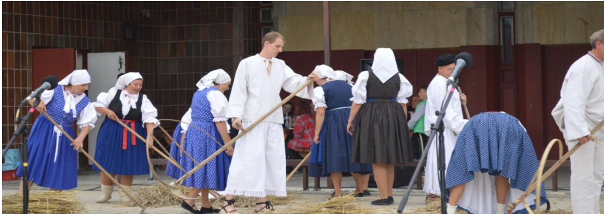
Folklorňny skupina Libočan