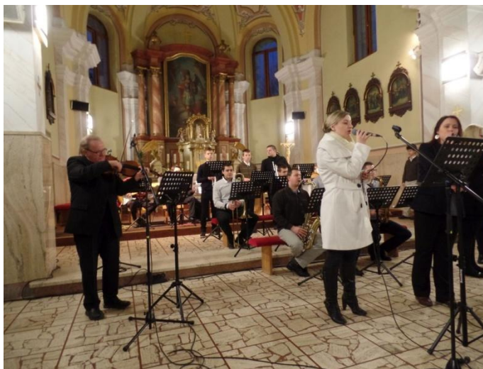
Vianočný koncert ZUŠ Nemšová 18.12.2015

K 15. septembru 2015 mala ZUŠ Nemšová 795 žiakov, z toho v hudobnom odbore 296, v tanečnom odbore 259, vo výtvarnom odbore 240. Počet novoprijatých žiakov bol 169, z toho v hudobnom odbore 58, v tanečnom odbore 54, vo výtvarnom odbore 57. Počet žiakov študujúcich v Nemšovej a v pobočkách bol: Nemšová 264 žiakov, Dolná Súča 110, Trenčianska Turná 86, Horná Súča 70, Drietoma 66, Melčice-Lieskové 58, Soblahov 48, Horné Srnie 46, Skalka nad Váhom 24 a Trenčianske Stankovce 23.