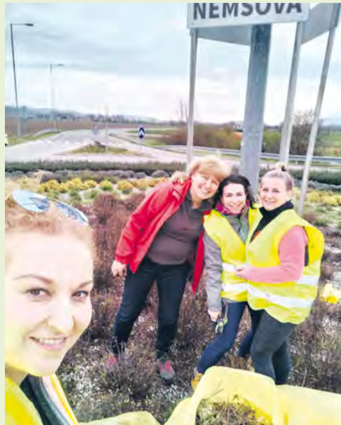
Pracovníčky mestského úradu pri čistení kruhového objazdu

Už v predchádzajúcom čísle ste sa mohli dočítať o iniciatíve obyvateľov zapojených do jarného upratovania. Zapojiť sa mohli všetci obyvatelia Nemšovej. Tí, ktorí to nestihli v marci, mali možnosť zapojiť sa ešte v apríli a dať pomyselnú bodku za tohtoročným veľkým jarným upratovaním, vďaka ktorému sa naše mesto zbavilo odpadu.