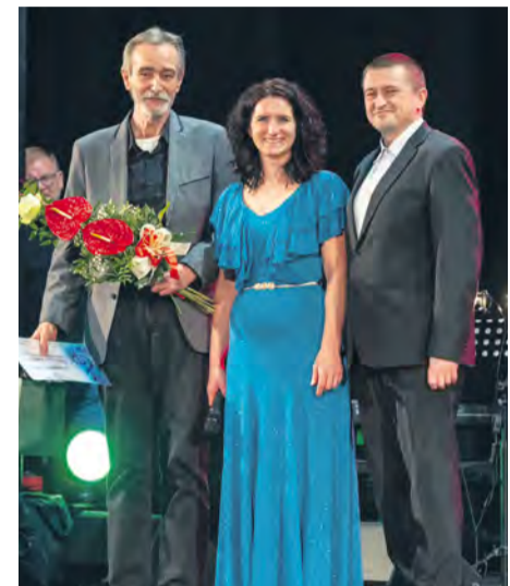
Oslava 25. výročia ZUŠ

Autor: Viera Muntágová