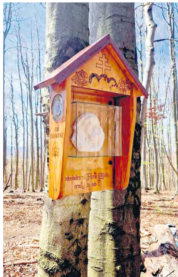
Zrekonštruovaná kaplnka na Javorníku