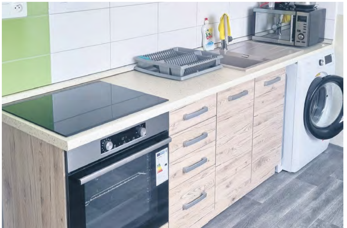
Nová kuchynská linka s vybavením pre klientov CSS

Prebehla aj čiastočná rekonštrukcia druhého nadzemného podlažia s ďalšími 15 lôžkami ZOS, vytvorila sa tu aj nová izolačná miestnosť pre klientov s infekčným zdravotným problémom. Obe poschodia disponujú úplne novým nábytkom, pre klientov ZOS elektrickými polohovateľnými posteľami. Na oboch