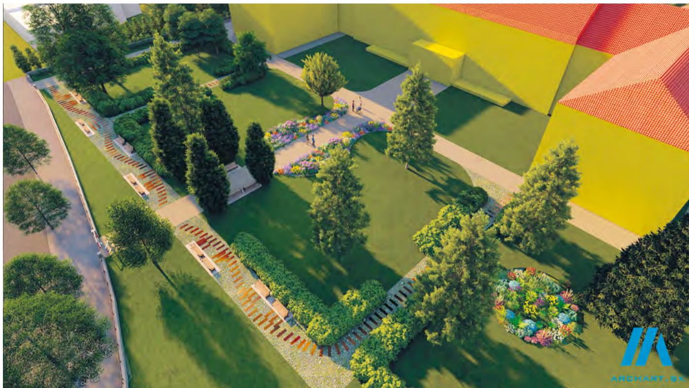
Vizualizácia budúceho stavu po ukončení projektu

sa realizácia projektu dňa 26. 05. 2023 stala skutočnosťou, kedy sme v tento deň odovzdali stavenisko zhotoviteľovi – spoločnosti VION, a.s. Zlaté Moravce. Ukončenie realizácie projektu je naplánované na december 2023.