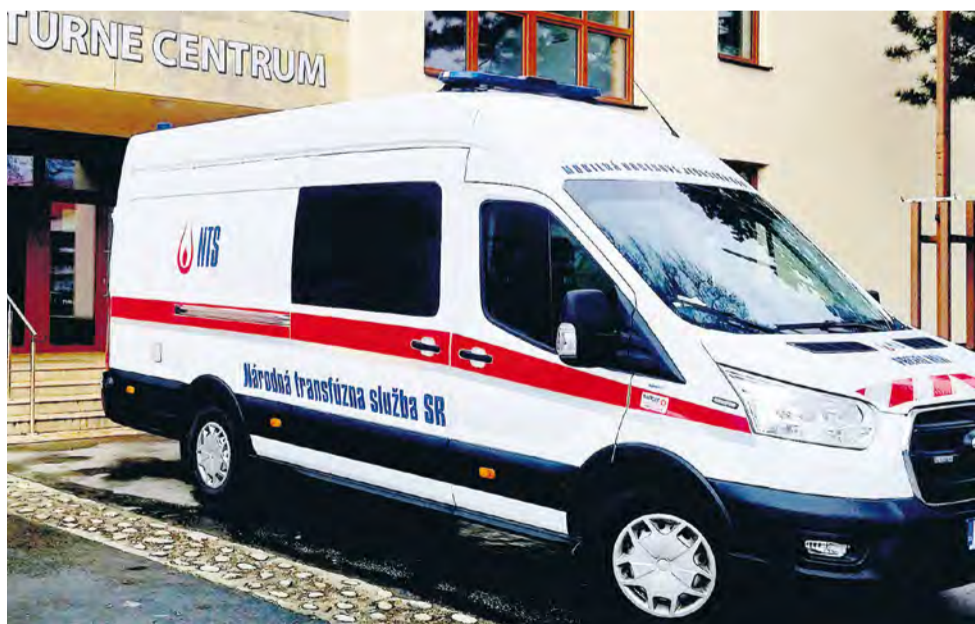
Vozidlo Národnej transfúznej služby SR počas darovania krvi