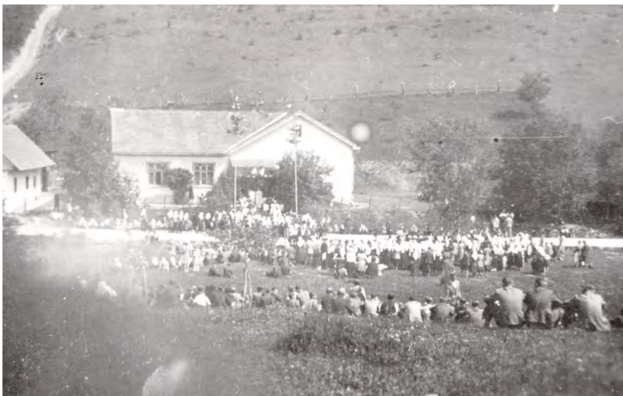
Slávnostná sv. omša pred školou v Trenčianskej Závade v roku 1946

Možno ste si už v predchádzajúcom čísle spojili článok o pôvode názvu tejto dnes najmenej mestskej časti s informáciou, že práve ona tento rok oslavuje 530. výročie svojej najstaršej písomnej zmienky. Je mnoho tém, o ktorých sa za toto obdobie dá rozprávať, či písať. Dnes som si vybrala tému, ktorá je jednou z tých mladších, ale o to významnejších. Kaplnka Panny Márie Fatimskej. Neutíchajúce, pravidelne bijúce "Srdce" pre obyvateľov mestskej časti i širokého okolia. V máji sa tu konala tradičná púť, ktorá prilákala stovky veriacich a príspevok prináša i niekoľko zaujímavostí, o ktorých ste možno nevedeli.