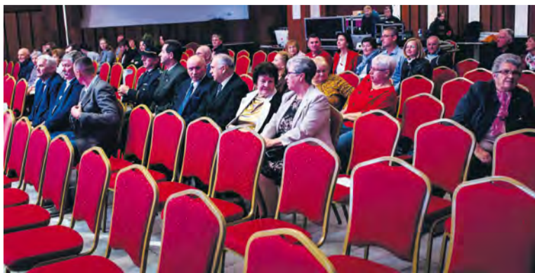
Ilustračná fotografia

Čoraz častejšie sa stretávame s tým, že nezaujem ľudí ohrozuje kultúru.