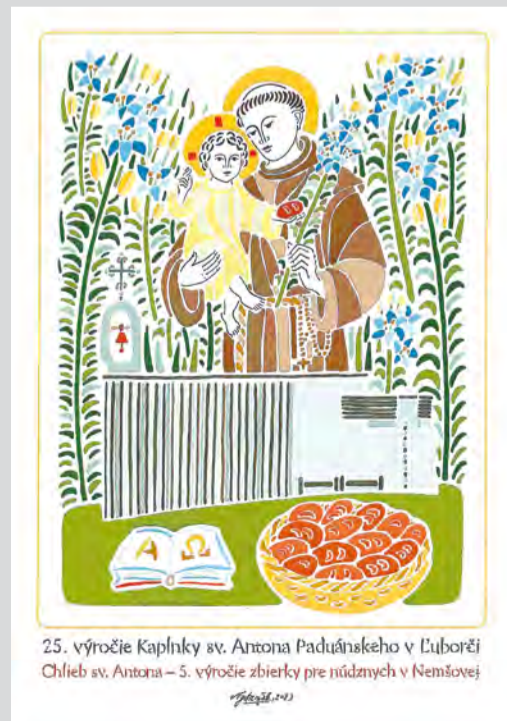
25. výročie Kaplnky sv. Antona Paduánskeho v Ľuborči Chlieb sv. Antona – 5. výročie zbierky pre núdzných v Nemšovej

Autori: Bernard Brisuda, Marcela Prekopová