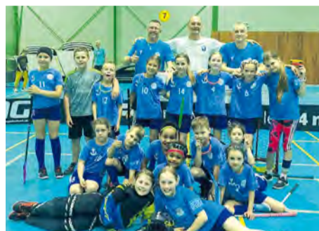
Mladšia prípravka na Majstrovstvách Slovenska