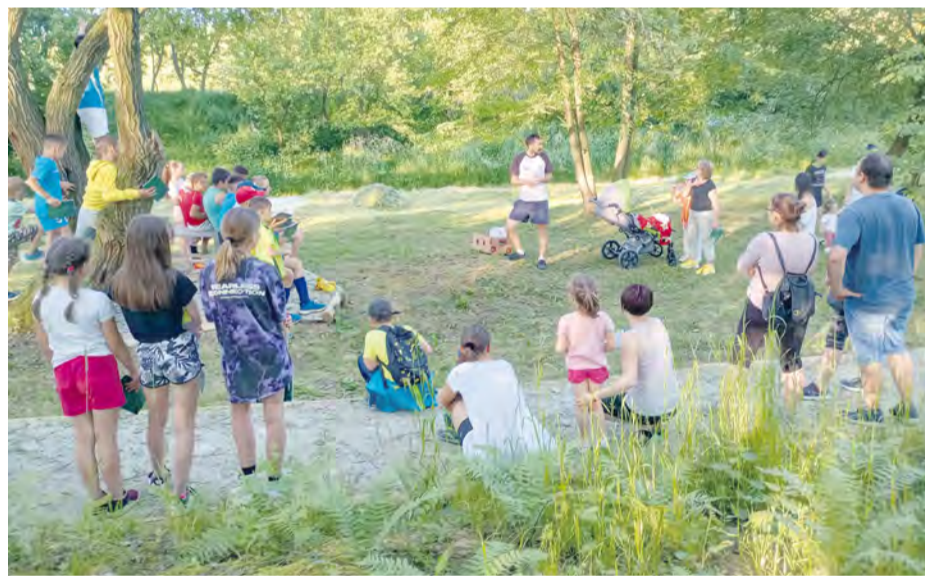
Podvečerná prednáška o stromoch a chrobáčkoch pod vrbou