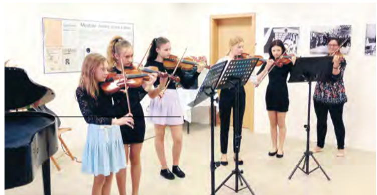
Hudobné vystúpenie na Deň matiek v Mestskom múzeu

Umelecké výtvary prezentovali všetci žiaci výtvarného odboru na vernisáži a následne sa zbalili a odišli zdokonaľovať svoje zručnosti do príjemného prostredia chaty Trubárka, kde sa priučili novým technikám a tešili sa z práce v prírode.