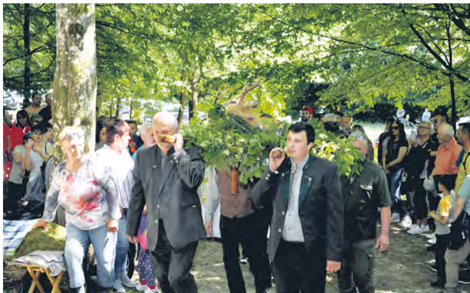
Sprievod s obetnými darmi

kých tradícií, poľovnícke signály, vábenie zveri i ukážka poľovníckych psov a sokoliarskych dravcov.