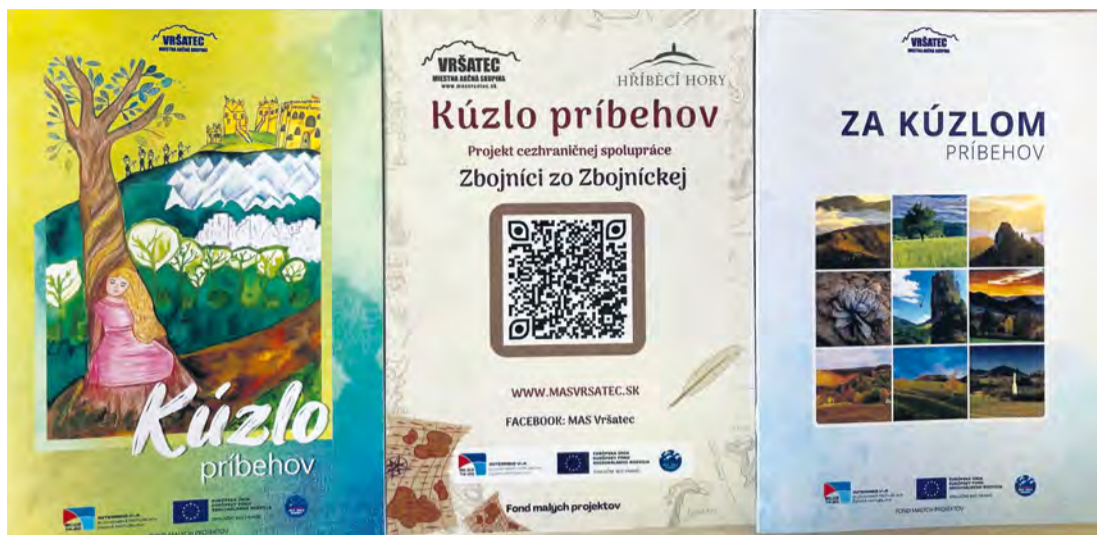
Publikácia s príbehmi

Na jar tohto roku bol ukončený projekt cezhraničnej spolupráce s českou MAS Hříběcí hory a našou MAS. Výstupom projektu s názvom „Kúzlo príbehov“ je nielen publikácia s príbehmi, ktoré majú svoje korene na území MAS Vršatec, ale aj QR kódy s prerozprávanými povestami.