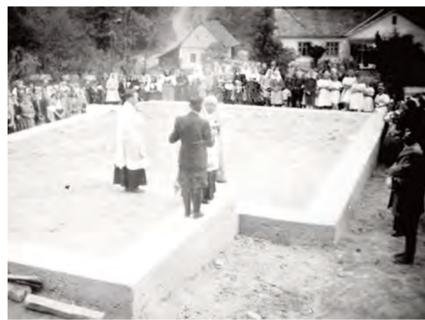
Posviacka základného kameňa kaplnky v roku 1947