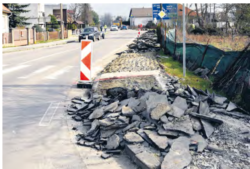
Ulica Púchovská počas rekonštrukcie