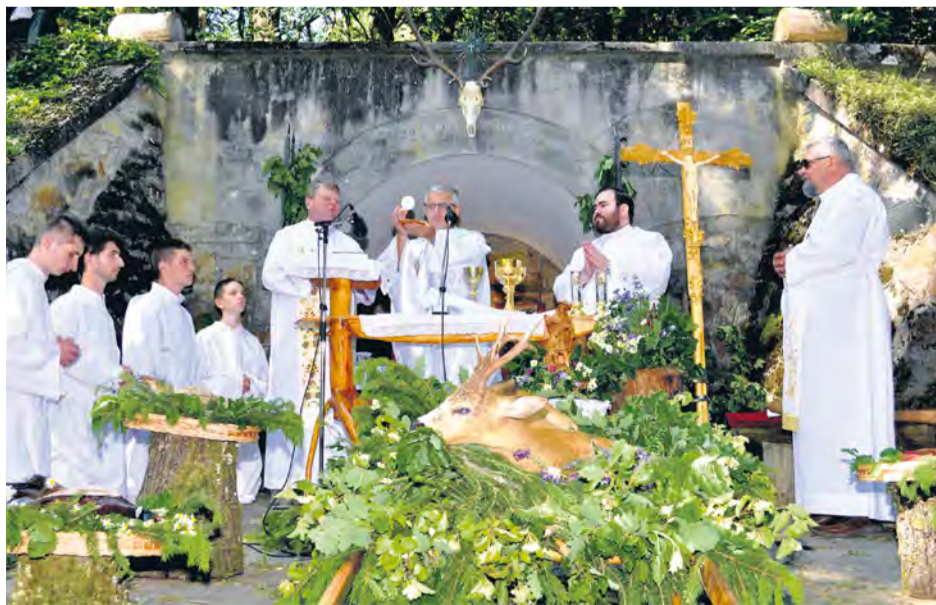
Slávnostná svätá omša na Deň sv. Huberta

Prišiel deň "D" a priestor sa naplnil približne tisícovou návštevníkov a veriacich. Slávnostná sv. omša začala o 15. 00 hod. tradičným sprievodom poľovníckych obetných darov (srnec, bažant, sojka, lesné plody - hríby, ryby, poľovnícka lesnica, tesák, klobúk a fajka) a skautským darom bola skautská rovnošata. Sprievodu sa okrem poľovníkov zúčastnili aj skauti, včelári, sokolári. Hudobne ich doprevádzali lesníci, organ a dychová hudba pod vedením