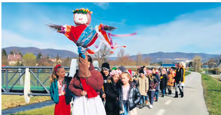
Žiaci základnej školy nesú Morenu k brehu rieky Vlára