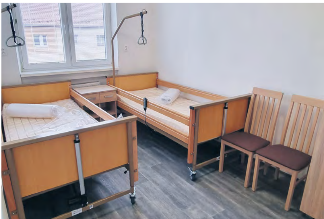
Ukážka novej ubytovacej jednotky