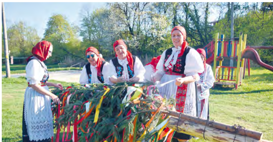
Stávanie mája v mestskej časti Trenčianska Závada