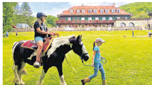
Vodenie na koni v areáli poľovníckeho zámokku Antonstál

Autor: Miroslava Bachratá