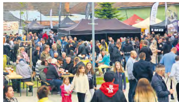
O pívny festival v Nemšovej bol veľký záujem

Áno, je to naozaj tak, Sládkovú Nemšovú sme otvorili sezónu 2023. Máme na pláne približne 12 akcií tohto alebo podobného typu. Tá najbližšia už 16. a 17. júna v bratislavskej Petržalke na "We Love Music" festivale. Pre všetky najaktuálnejšie informácie stačí navštíviť náš web www.sladkov.sk .