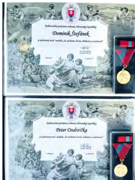
Ocenenie získané za záchranu života, hrdinstvo a statočnosť

Za rozhovor ďakujem našim hasičom a prajem všetkým hasičom ideálne žiadne výjazdy a keď už budú privolaní na pomoc, tak nech je to vždy zásah so šťastným koncom.