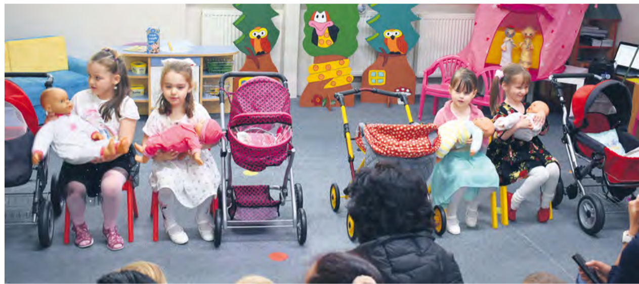
Besiedka ku Dňu matiek

Autor: Miroslava Dubovská