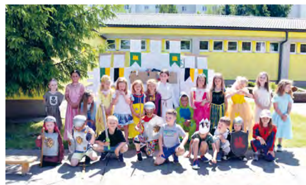
Hradné slávnosti na MDD

Krásne slnečné počasie umožnilo oslavy realizovať na školských dvoroch. Tie sa zmenili na hrady s množstvom zábavných hier, tancov a nechýbalo ani hradné hodovanie. Každá prevádzka pripravila pre deti originálny Deň detí. 2. júna sme oslavy dňa detí ukončili koncertom Hanička a Murko .