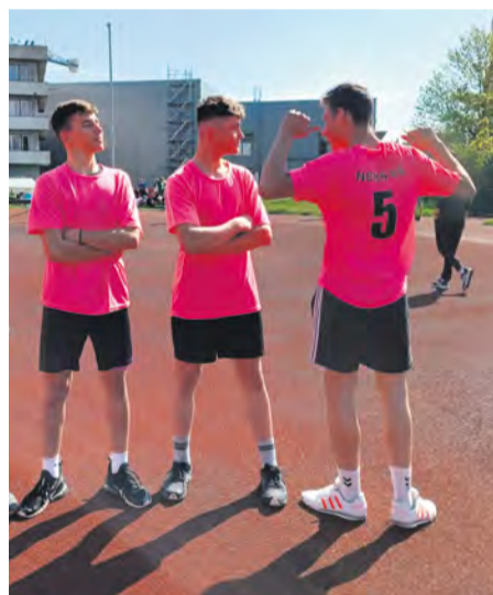
Atléti zo ZŠ Nemšová