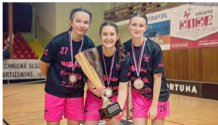
Hráčky s trofejou za druhé miesto