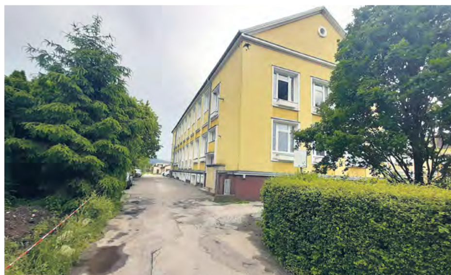
Jedno z najproblémovnejších miest. Počas dažďov sú priestory zaliate vodou, čo komplikuje pohyb najmä deťom navštevujúcich školy.