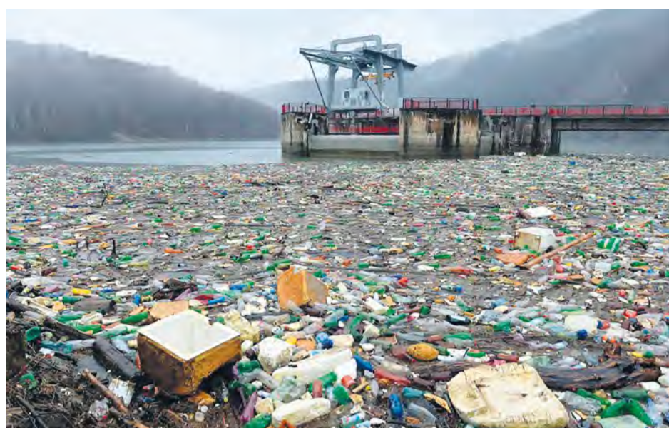
Čistenie vodnej nádrže Ružín od naplaveného odpadu

■ Do žltých nádob na plasty patria napríklad nie zálohované PET fľaše. Tie zálohované vraciame naspäť do obchodu. Plasty, ktoré vyhadzujete, by nemali byť hrubo znečistené napríklad od farbív, lakov alebo zeminy. Na rozdiel od papiera, masťota plastom nevadí. Pri recyklácii sa ešte vymývajú/prepierajú. Horšie je to, ak zistíte, že vec, ktorú chcete vyhodiť, je zložená z viacerých materiálov,