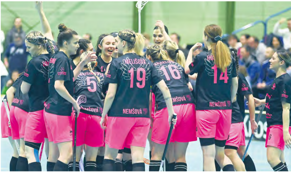
Hráčky Nemšovej po víťaznom zápase