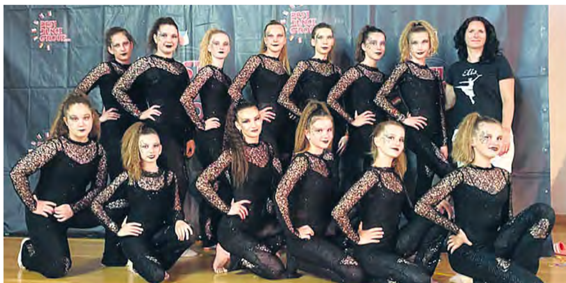
Tanečná skupina ELIS v Chorvátsku