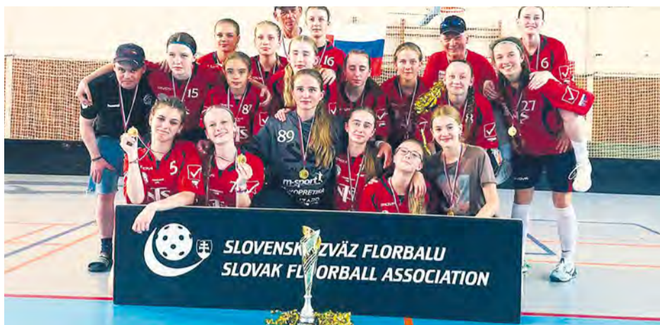
Majstrovstvá Slovenska dorasteniek, 1. miesto