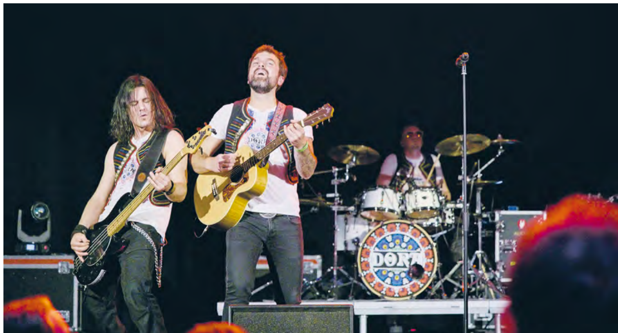
Sprievodný program Sládkovej Nemšovej, vystúpenie hudobnej skupiny Dora

Spracovala: Miroslava Bachratá, Bernard Brisuda