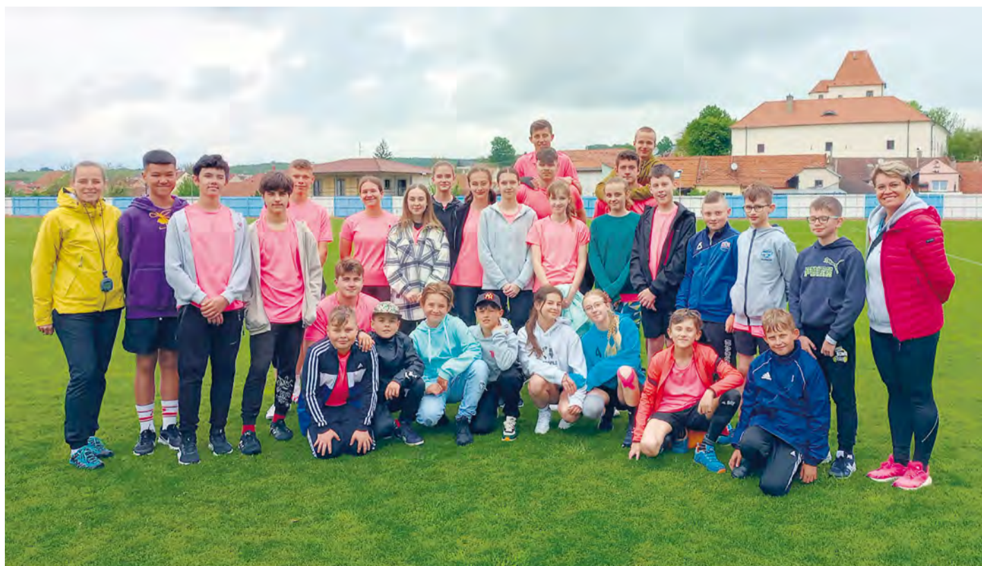
Stretnutie s partnerskou školou v Hluku