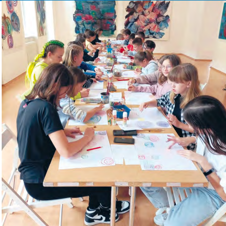
Piataci v trencianskej galérii