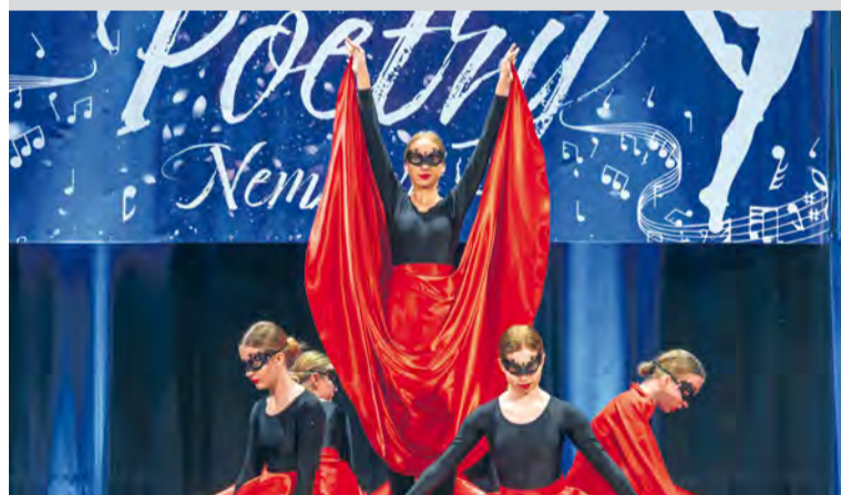
Jedna z prezentovaných choreografií ZUŠ Nemšová

Autor: Viera Muntágová