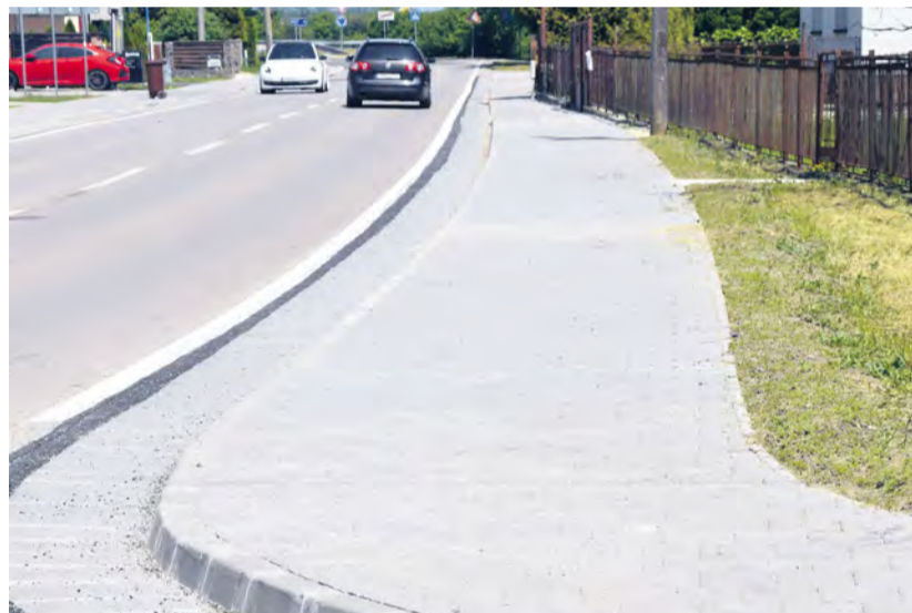
Ulica Púchovská po rekonštrukcii