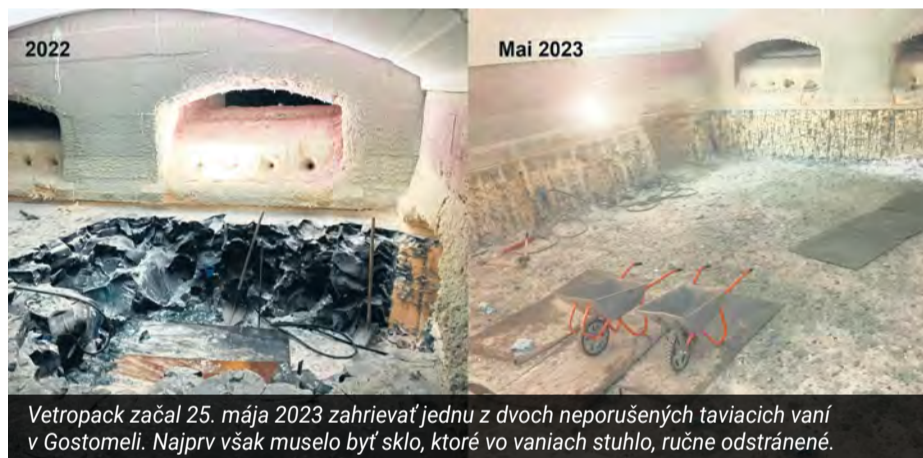
Vetropack začal 25. mája 2023 zahrievať jednu z dvoch neporušených taviacich vaní v Gostomeli. Najprv však muselo byť sklo, ktoré vo vaniach stuhlo, ručne odstránené.

Spracovala: Miroslava Bachratá