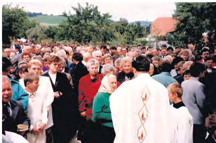
Hlavný celebrant a veriaci počas slávnostného vysvätenia kaplnky v Ľuborči 14. 6. 1998