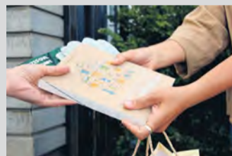
Z odovzdávania hlavnej ceny

Správnou tajničkou zasielajte do 20. júla na nemsovsky.spravodajca@gmail.com alebo cez aplikáciu mesta Nemšová prostredníctvom domény "Napište nám". Traja z vás vás získajú skvelý letný darček.