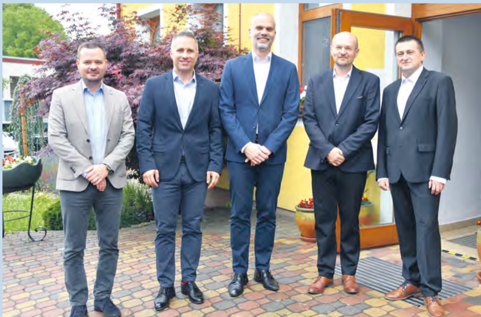
Uvítanie Ministra obrany a štátneho tajomníka pri mestskom úrade

Prioritnou témou stretnutia bola problémová situácia na križovatke cesty prvej triedy E57