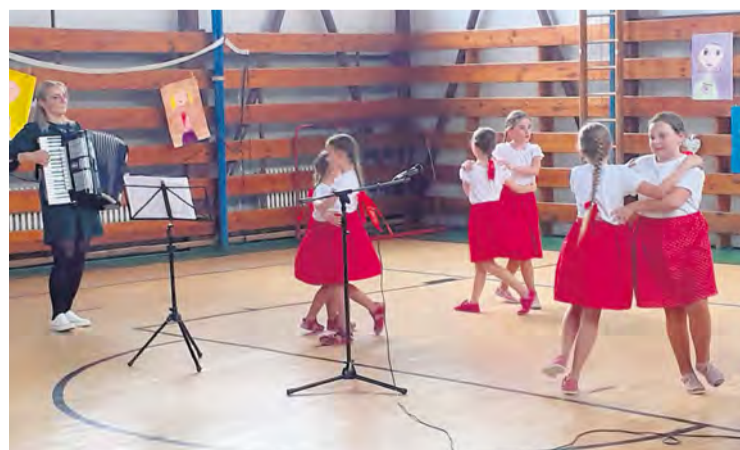
Vystúpenie ku Dňu matiek - KSS