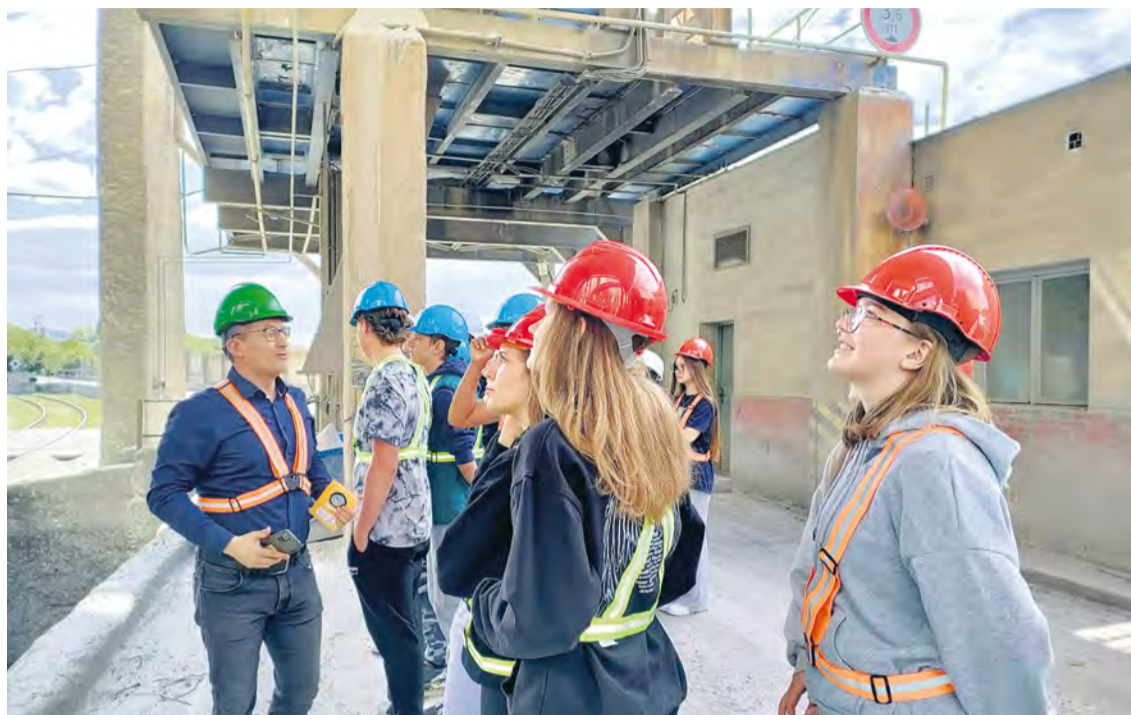
Z exkurzie v cementárni - Horné Srnie

AI V POSLEDNOM ŠTVRŤROKU, NA PRAHU LETNÝCH PRÁZDNIŇ, SI PRIPOMÍNAME ZAUJÍMAVÉ A OBOHACUJÚCE AKTIVITY KATOLÍCKEJ SPOJENEJ ŠKOLY.