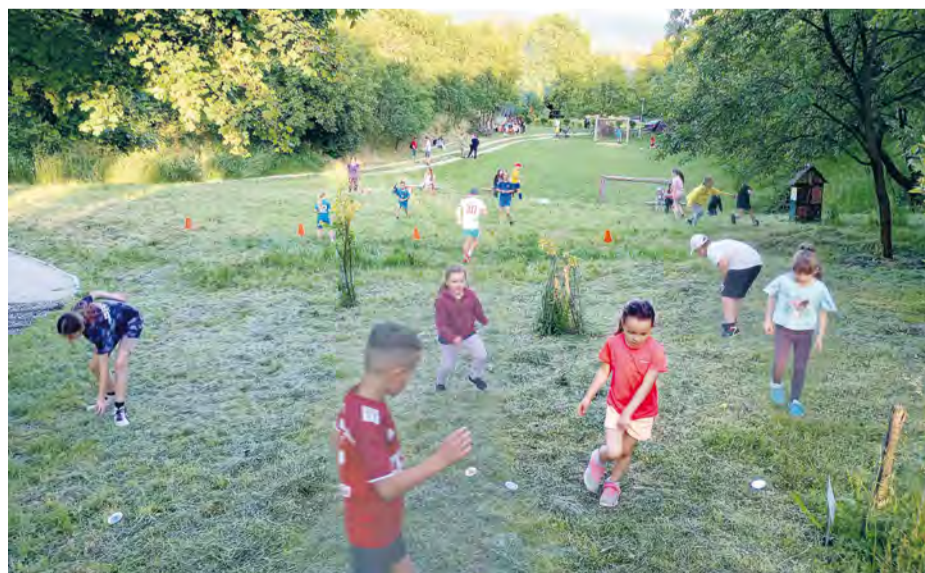
Hra Lov chrobákov v Parku Jozefa Lacu v podvečer MDD