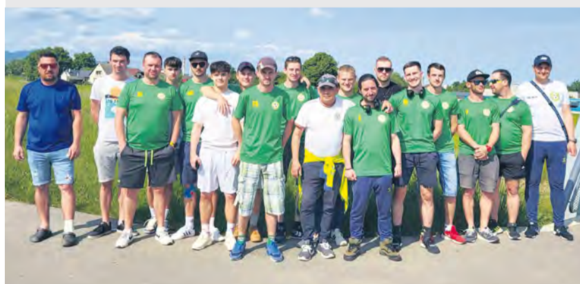
Hráči a vedúci mužstva TJ Luborča prišli na zápas do Nemšovej po vlastných nohách

■ V minulom roku absolvoval prvé preteky práve v Nemšovej, keď v Pohári ZZK v jeho vekovej kategórii obsadil 3. miesto. Zúčastnil sa pretekov v Šuranoch, Kolárovo, Nových Zámkoch i Majstrovstiev Slovenska v Karate v Žiline.