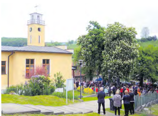
Púť v Trenčianskej Závade, máj 2023

Už takmer trištvrte storočia sa konajú pravidelné púte do mestskej časti Tr. Závada. Inak tomu nebolo ani v tomto roku a veriaci sa opäť stretli počas druhej májovej nedele, kedy sa okrem iného slávil aj Deň Matiek. Sviatok mala tak patrónka miestnej kaplnky hneď dvojnásobný.