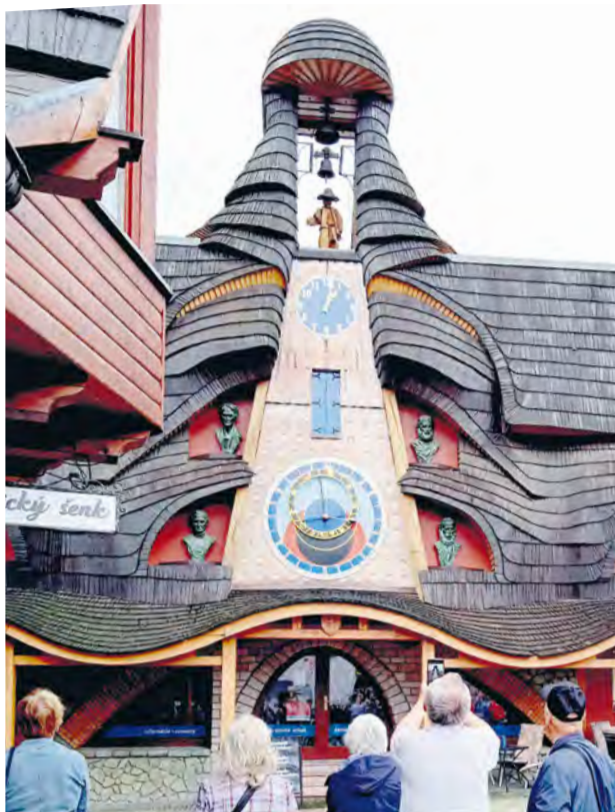
Členovia združenia pri Orloji v Starej Bystrici