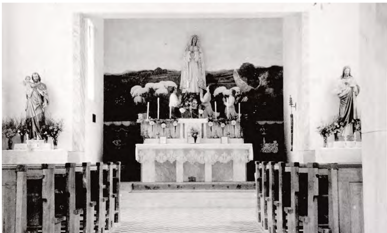
Interier Kaplnky v roku 1949