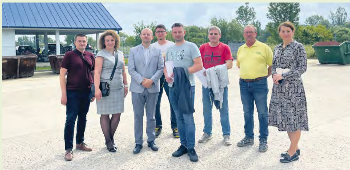
Z odovzdania staveniska zhotoviteľom

► Projekt rieši rekonštrukciu asfaltových, spevnených plôch, oplotenia, existujúceho areálového osvetlenia a vybudovanie nových objektov SO-01 Prístrešok pre skladovanie s administratívnym vstavkom, ktorý bude dispozične rozdelený na tri časti: administratívnu časť so šatňou a hygienickým zázemím pre zamestnancov, časť pre skladovanie horľavých odpadov a časť určenú pre skladovanie nehorľavých odpadov a SO-02 Prístrešok pre skladovanie vriec. V rámci projektu bude zároveň dodané aj špeciálne vozidlo na zber a zvoz bioodpadu s rotačným lisovaním a záchytnou vaňou, nadstavba s objemom 16m 3 na podvozku nákladného automobilu. Ďalej bude dodaný aj skladový kontajner so záchytnou vaňou a automobilová prenosná váha.