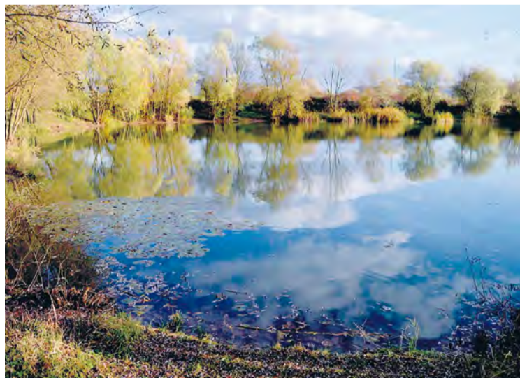
Jazero v Luborči v súčasnosti slúži hlavne ako rybársky revír