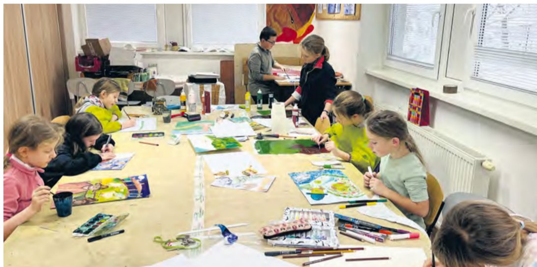
Žiaci výtvarného odboru pri tvorbe ilustrácií