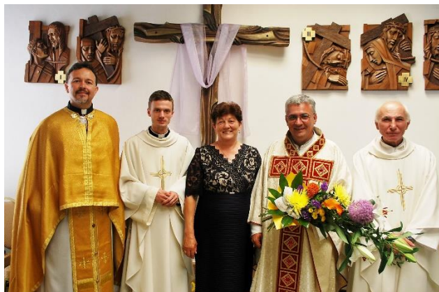
Hodová slávnosť v Ľuborči 17.06. 2018