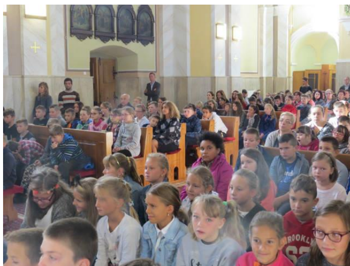
Začiatok školského roka v Kostole sv. Michala

Slávnostné otvorenie školského roka sa uskutočnilo 4. septembra v miestnom farskom kostole. Organizačnými zložkami školy boli Základná škola sv. Michala, Stredná škola sv. Rafaela, a Materská škola sv. Gabriela. V škole sa nachádza ŠKD a CVC. Na KŠŠ pracovalo spolu 49 zamestnancov. Prepočítaný počet zamestnancov je 46,3, z toho 40,3 kvalifikovaných (24,7 na ZŠ sv. Michala, 1 odborný zamestnanec, 5 MŠ sv. Gabriela, 0 SOŠ sv. Rafaela, 0,2 CVC, 1 ŠKD, 7,6 nepedagogických zamestnancov a 1 projektový zamestnanec ITMS, EŠIF). Pedagogickí zamestnanci si rozširovali svoju kvalifikáciu. V tomto roku ukončil 1 vysokoškolské vzdelanie, u 5 prebiehalo adaptačné, 1 ukončil kvalifikačné vzdelanie, 1 prípravné, 1 atestačné a 1 rozširujúce s predmetom geografia.