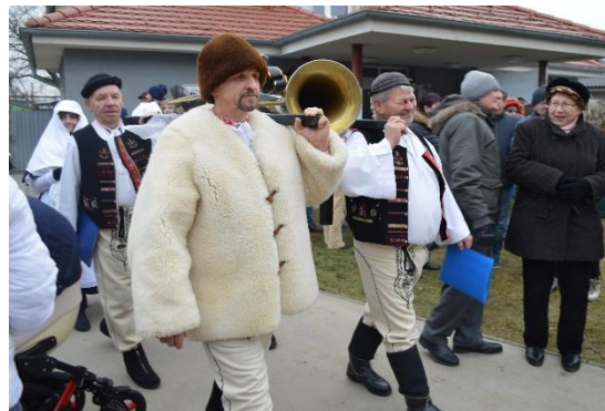
Vľavo: detský fašiangový karneval, vpravo: fašiangový sprievod, pochovávanie basy v amfiteátri mestského múzea