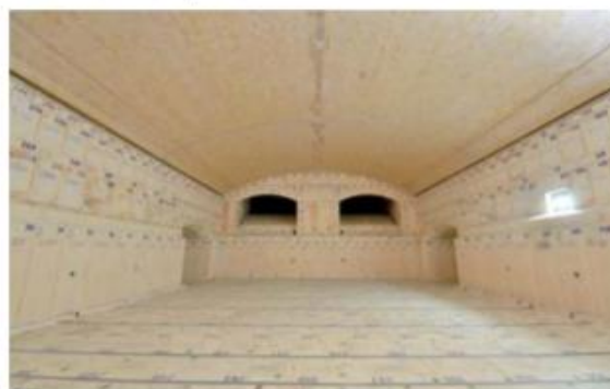
Nová taviaca pec vo Vetropacku