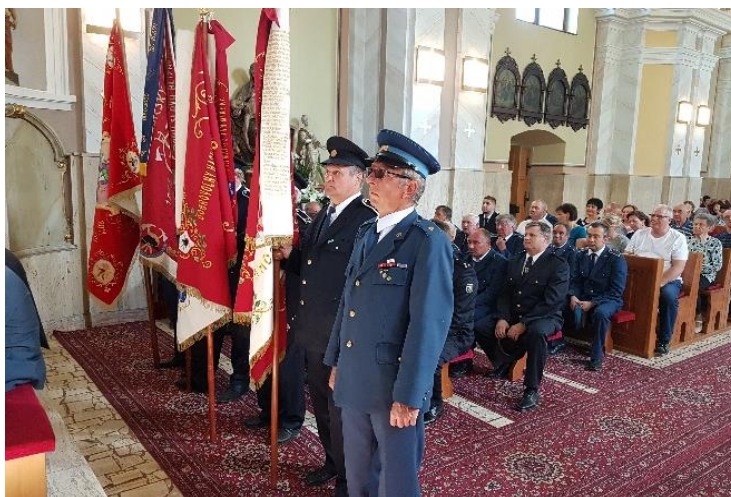
DHZ na svätej omši 05. 05. 2018

Ministerstvo vnútra odovzdalo DHZ na Slovensku v tomto roku 115 protipovodňových vozíkov a jeden poputoval aj do Nemšovej. V piatok 19. októbra odovzdala ministerka vnútra Denisa Saková do správy mesta Nemšová protipovodňový zásahový vozík. Ten bude slúžiť členom Dobrovoľného hasičského zboru v Nemšovej v prípade vzniku mimoriadnych udalostí. Vozík pozostáva z čerpadla, výbavy a jeho hodnota je 12-tisíc eur.