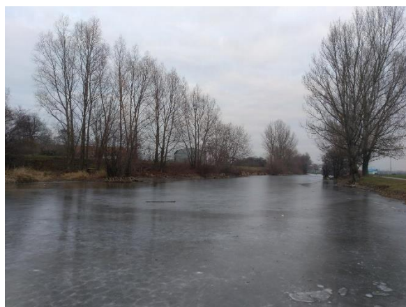
Vľavo: Klúčovská vážina na prelome októbra a novembra 2018, vpravo: Klúčovská vážina 19. 12. 2018