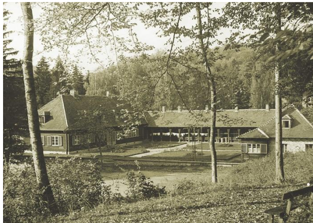
Významné lesnícke miesto - poľovnícky zámok Antonstál v minulosti a dnes