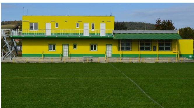
Vľavo: vyasfaltovanie výtlkov v Ľuborči, vpravo: rekonštrukcia kabín na TJ Ľuborča