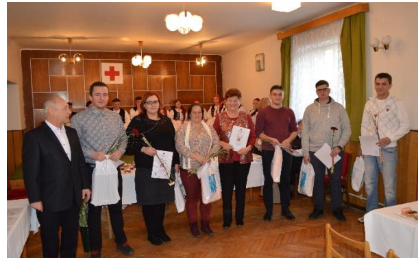
Vľavo: výročná schôdza JDS a senior klubu, vpravo: oceňovanie bezpríspevkových darov krvi