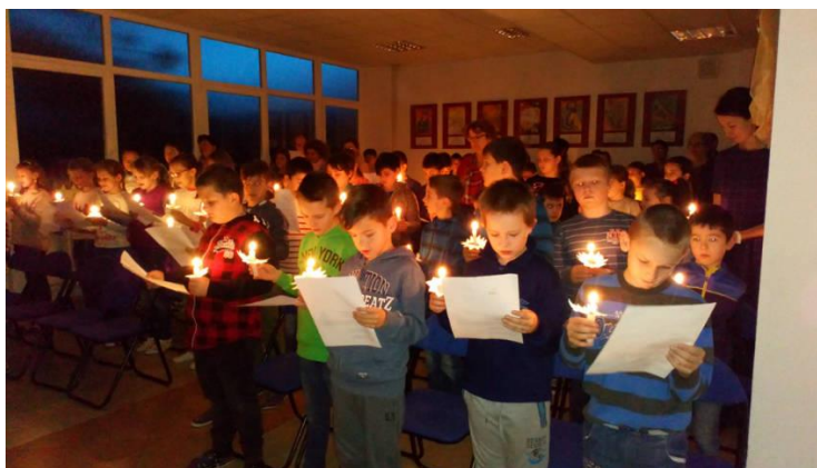
Rorátna sv. omša

Katolícka spojená škola prišla s ponukou rôznych tradičných aktivít a v tomto školskom roku pribudla i jedna nová duchovná celoročná aktivita. Niesla názov Nasledujeme hviezdy slovenského neba . Na každý mesiac školského roka si vybrali jednu hviezdu, svätú osobu, ktorá sa svojím životom viaže k Slovensku. Spoznávali ju a nasledovali. Každé ráno sa