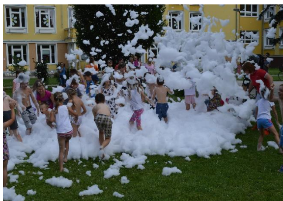
Penová párty počas 2. ročníka Dňa pre rodinu

V nedeľu 3. júna sa konal 5. ročník Cesty rozprávkovým lesom. Podujatie organizované mestom Nemšová, ZUS Nemšová v spolupráci s dobrovoľníkmi zo 117. zboru sv. Františka z Assisi prebiehalo od priestorov ZUŠ Nemšová po rybník v Ľuborči. Presne 8 stanovísk s rozprávkovými bytosťami sprijemnilo nedeľné popoludnie rodičom a ich deťom. V piatom ročníku navštívilo podujatie približne 230 detí.