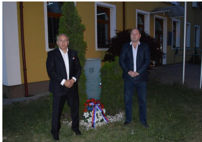
Vľavo: stavenie májov pri Mestskom múzeu v Nemšovej