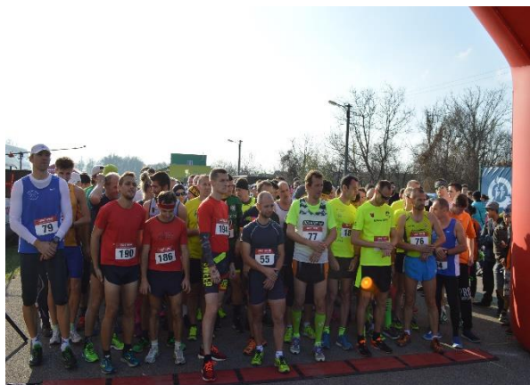
Beh okolo Luborče

Na štartovaciu čiaru sa 10. novembra postavilo celkovo 307 súťažiacich v 17 kategóriách. Hlavná kategória bola dotovaná finančnými odmenami v celkovej hodnote 525 eur. Okrem tradičnej priateľskej atmosféry bol jubilejný 50. ročník obohatený o nové technológie z atletického sveta, a to profesionálnou čipovou časomierou, vďaka ktorej bola hlavná kategória meraná čipmi s GPS lokátorom. Prítomní diváci boli vďaka tomu informovaní o aktuálnej situácii na trati. Beh organizovalo mesto Nemšová, TJ Družstevník a Champion Club.