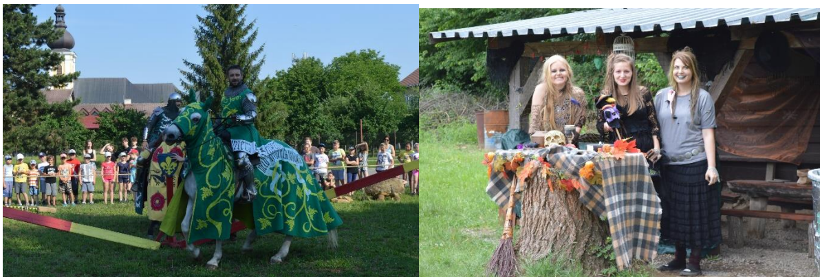
Vľavo: rytierske zápasy počas Atletického dňa, vpravo: 5. ročník rozprávkového lesa

Pri príležitosti Dňa detí sa v meste realizovalo niekoľko podujatí, pre malých aj väčších. V piatok dňa 1. júna o 12.00 hod. sa uskutočnilo otvorenie sezóny letného kúpaliska.