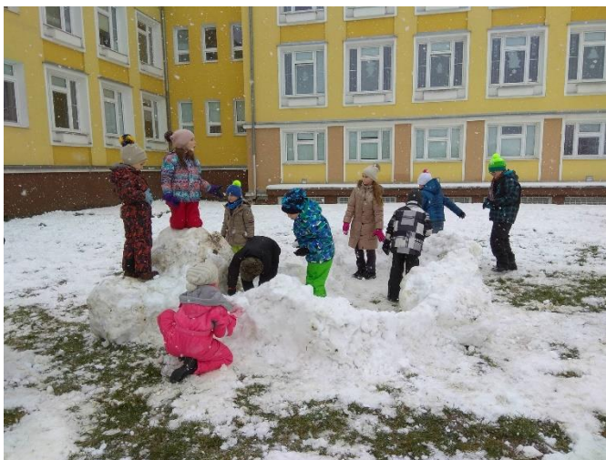
Stavanie snehuliakov detí zo ZŠ, Janka Palu, 24.01.2018

V plusových teplotách bolo v úvode roka územie celej strednej i západnej Európy. Inak tomu nebolo ani na Slovensku, keď v Hurbanove namerali v januári priemerné teploty vzduchu 3,4 °C. V Nemšovej boli priemerné teploty v prvých dvoch týždňoch 5,3 °C, a najteplejšie dni boli 6. a 7. januára až 9,7 °C (v Hurbanove to bolo 14,7 °C). V druhej polovici mesiaca sa mierne ochladilo, no nešlo o výrazné a dlhodobé ochladenie. Dva dni v mesiaci môžeme považovať za ľadové, kedy teplota počas celého dňa nevystúpila ani na 0 °C. Teplota sa v dňoch 14. - 15. januára pohybovala od -4,1 °C do -1,7 °C. Nasledujúce dni boli už len mrazové, počas ktorých sa teplota pohybovala okolo +/- 0 °C. Najnižšia teplota nameraná v Nemšovej v januári bola 22. januára -6,6 °C , ale ten istý deň vystúpili teploty i mierne nad 0 °C.