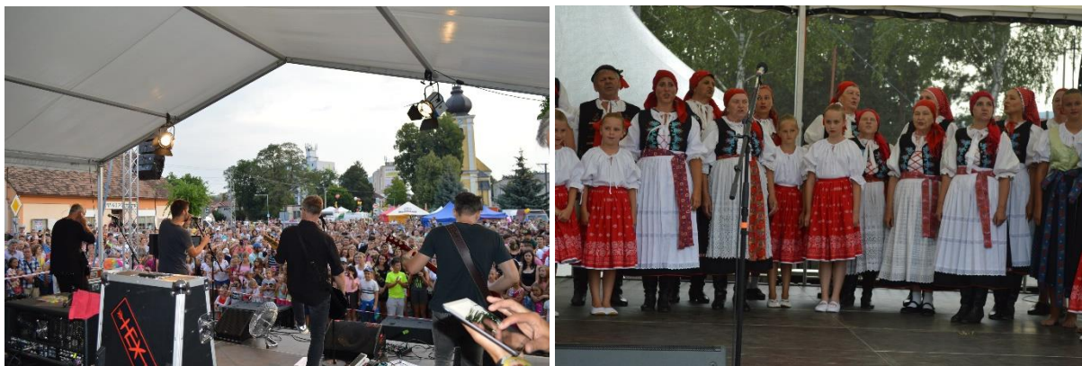
Vľavo: koncert skupiny HEX, vpravo: vystúpenie skupiny Liborčan