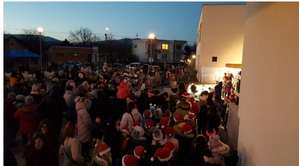
Vľavo: mikulášske trhy v Nemšovej, vpravo: sprievodný program v amfiteátri mestského múzea, víťanie Mikuláša

Vianočné obdobie sa otvorilo rozsvietením vianočného stromčeka na Mierovom námestí dňa 5. decembra. Rozsvietenie bolo spojené s príchodom Mikuláša. Podujatie bolo sprevádzané čoraz populárnejšími a kvalitnejšími mikulášskymi trhmi, ktoré sú jediné, ktoré sa tu u nás v predvianočnom čase konajú. Návštevníci sa mohli potešiť kúpou tradičných vianočných dekorácií, remeselných výrobkov a občerstvením typickým pre mrazivé zimné dni. Výťažok z predaja vareného vína či čaju s rumom poputoval na podporu činnosti OZ Peregrín, Spolku kresťanskej lásky a OZ Čistá duša.