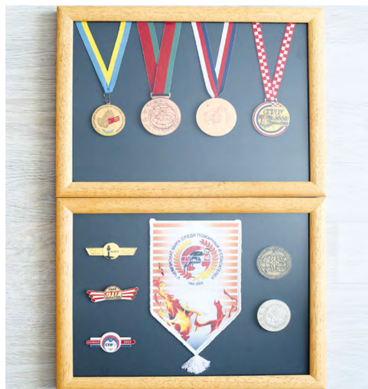
Zbierka najcennejších ocenení v rámci reprezentovania SR na medzinárodných súťažiach. 4 medaily za požiarneho útoku. Zľava doprava - svetový rekord, majstr. sveta, majstr. Európy, Olympiáda CTIF.

POUČIL SOM SA Z CHÝB, KTORÉ NASTALI A KAŽDÝ ROK MI DÁVAL INÉ MOŽNOSTI. TAM SOM POCOHOPIĽ, ŽE KEĎ JE MOŽNOSŤ, TREBA JU VYUŽIŤ.