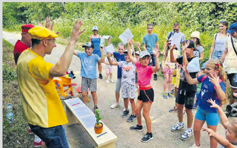
Pat a Mat s deťmi riešia úlohy.