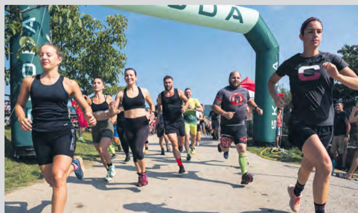
Za štartovacou čiarou.

Výsledky zo súťaže si môžete pozrieť na https:// my.raceresult. com/243552/