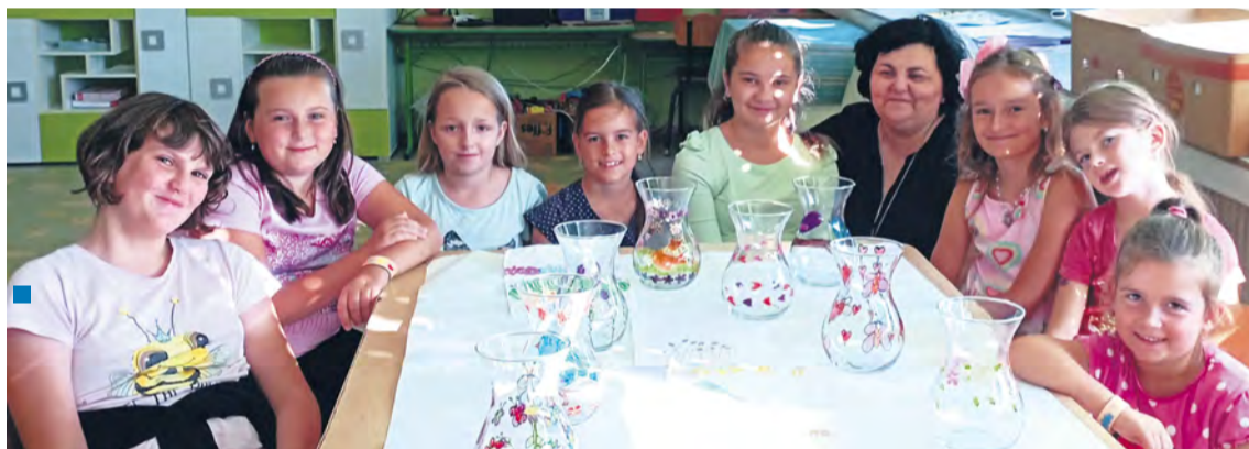
Z netradičného výtvarného tábora.