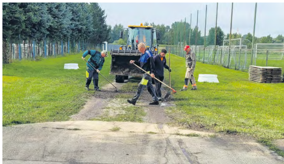
Úpravy na zelených plochách pred spustením jarmoku.