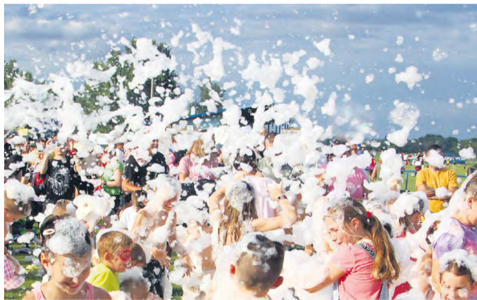
Desiatky detí si užili penovú šou.