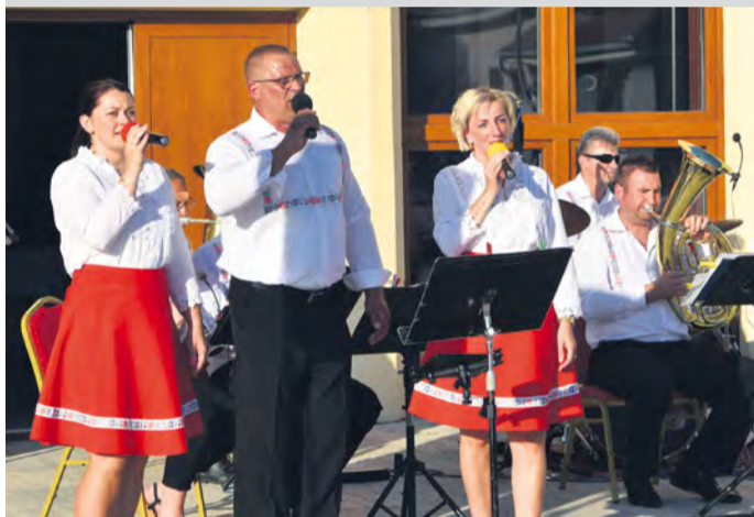
Vystúpenie DH Chabovienka.