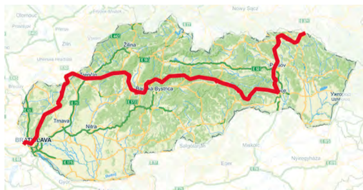
Trasu dlhú 770 km zdolali za 20 dní.

Na cestu sme sa vydali 9. júna. Vlakom a autobusmi sme sa presunuli k Duklianskemu priesmyku a naše prvé kroky po červenej značke viedli daždivým počasím. Obloha sa ale zakrátko vyjasnila a počas celej cesty nám už pršalo len 3-krát. Váha