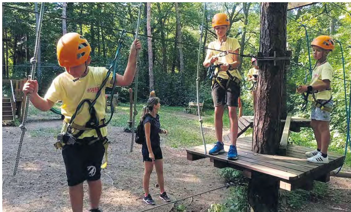
Di z tábora Športovček na návšteve Tarzanie.

ŠKOLA ZORGANOVALA POČAS LETNÝCH PRÁZDNIIN TRI DENNÉ TÁBORY - ŠPORTOVČEK, VÝTVARNÝ A TÁBOR SOVIČKA PRE ŽIAKOV SO ŠPECIÁLNYMI VÝCHOVNO - VZDELÁVACÍMI POTREBAMI. V NOVOM ŠKOLSKOM ROKU PRIPRAVILA PESTRÝ BALÍK ZÁUJMOVÝCH ÚTVAROV.