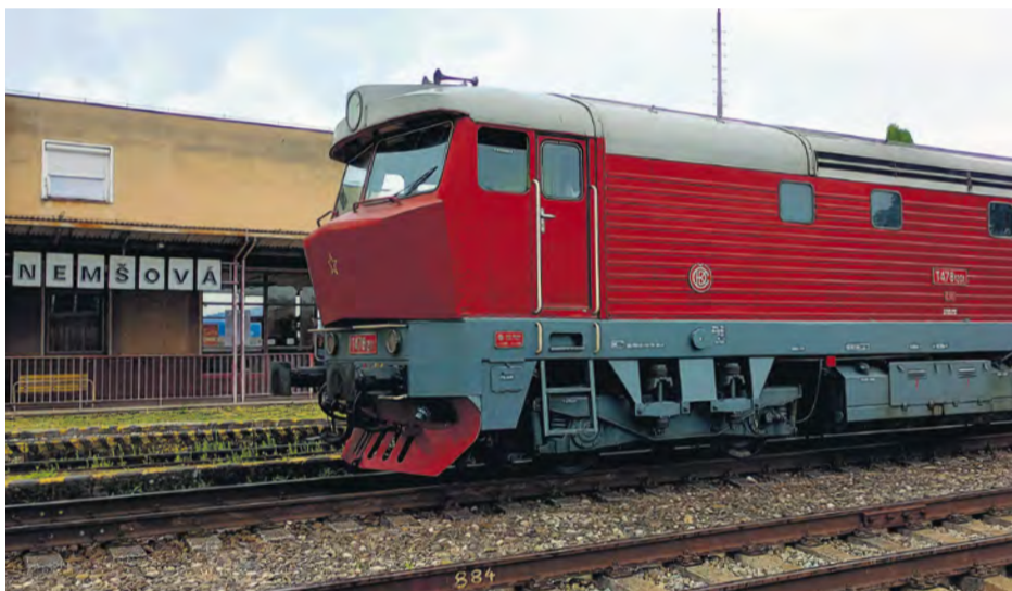
Historický vlak stál v Nemšovej tri hodiny, kým si cestujúci prezerali skláraň