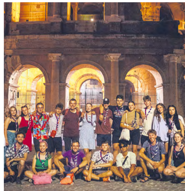
Skautská výprava pred rímskym Koloseom.

■ Viac o dobrodružstve na Kľúčovských babetách, o našich skautov a zážitkoch na Ceste hrdinov SNP sa dozviete na stranách 24-25 .