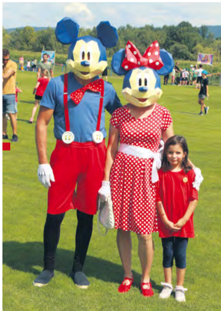
Deti potešili rozprávkové postavičky.

■ Začiatok hodov odštartovalo letné kino vo štvrtok 27. júla, ktoré sa konalo na futbalovom ihrisku v Klúčovom. Film sledovali návštevníci uprostred ihriska na stoličkách či na vlastných dekách „pod holým nebom“.