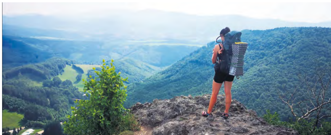
Jeden z mnohých krásnych výhľadov na potulkách Slovenskom.