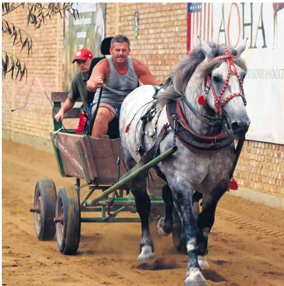
O krásne ťažné kone nebola na Ranči 13 núdza