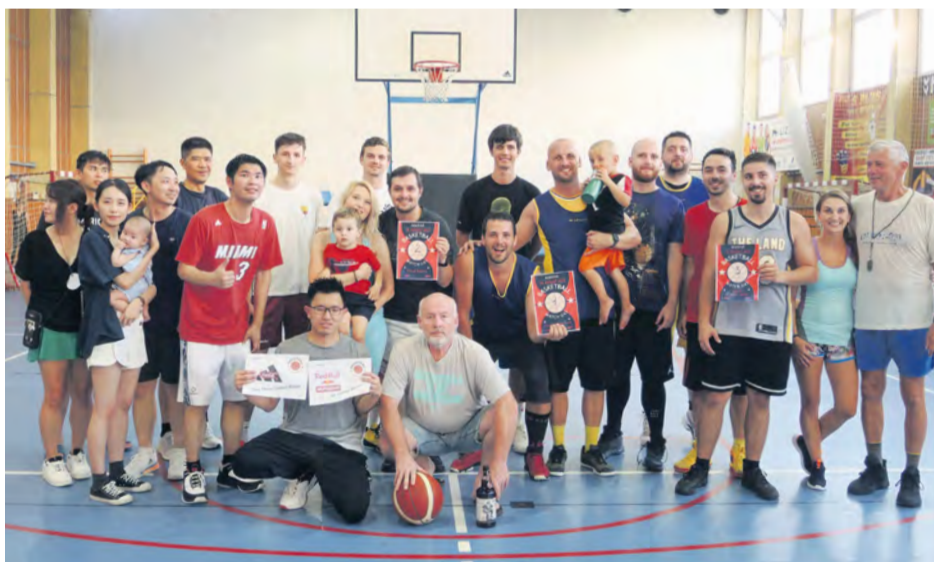
Účastníci basketbalového turnaja v mestskej športovej hale.