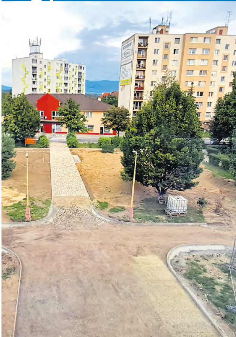
Priebeh prác na Vodozádržných opatreniach počas leta 2023.