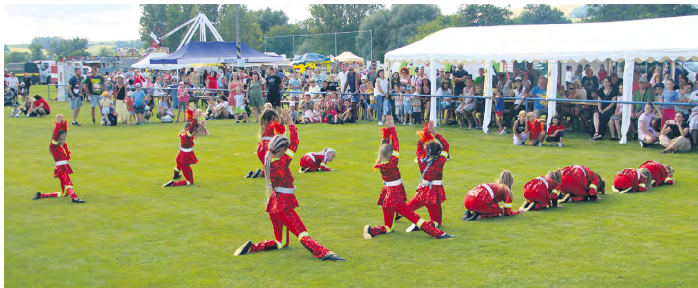
Choreografiu malých tanečníkov obdivovali malí i veľkí.

■ V areáli sa nachádzali aj stánky s rozličným tovarom či občerstvením. Vstupné bolo na dobrovoľnej báze, avšak každý prispievateľ mal nárok na jeden tombolový lístok, ktorý získal hneď pri vstupe na futbalové ihrisko. Vyhlásenie tomboly o zaujímavé ceny bolo súčasťou programu a šancu vyhrať mali všetci rovnakú. Pozornosť detí a dospelých prilákalo odstavené hasičské auto, kamióny či sanitka. Tá bola počas udalosti otvorená pracovníkmi, ktorí návštevníkom robili prehliadku interiéru, oboznámili ich s základmi poskytovania prvej pomoci a odpovedali na otázky z medicínskeho prostredia. Tanečná škola Choreofactory Nová Dubnica sa postarala o vydarené tanečné vystúpenia rôznych vekových kategórií a roztlieskali návštevníkov v celom areáli.