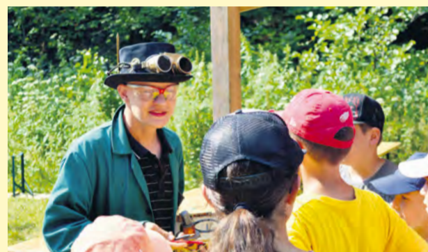
Deti spoločne s cestovateľom v čase.