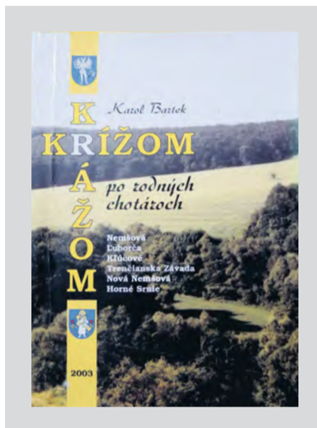
Krížom krájom po rodných chotároch. (2003)

Autor: Miroslava Bachratá