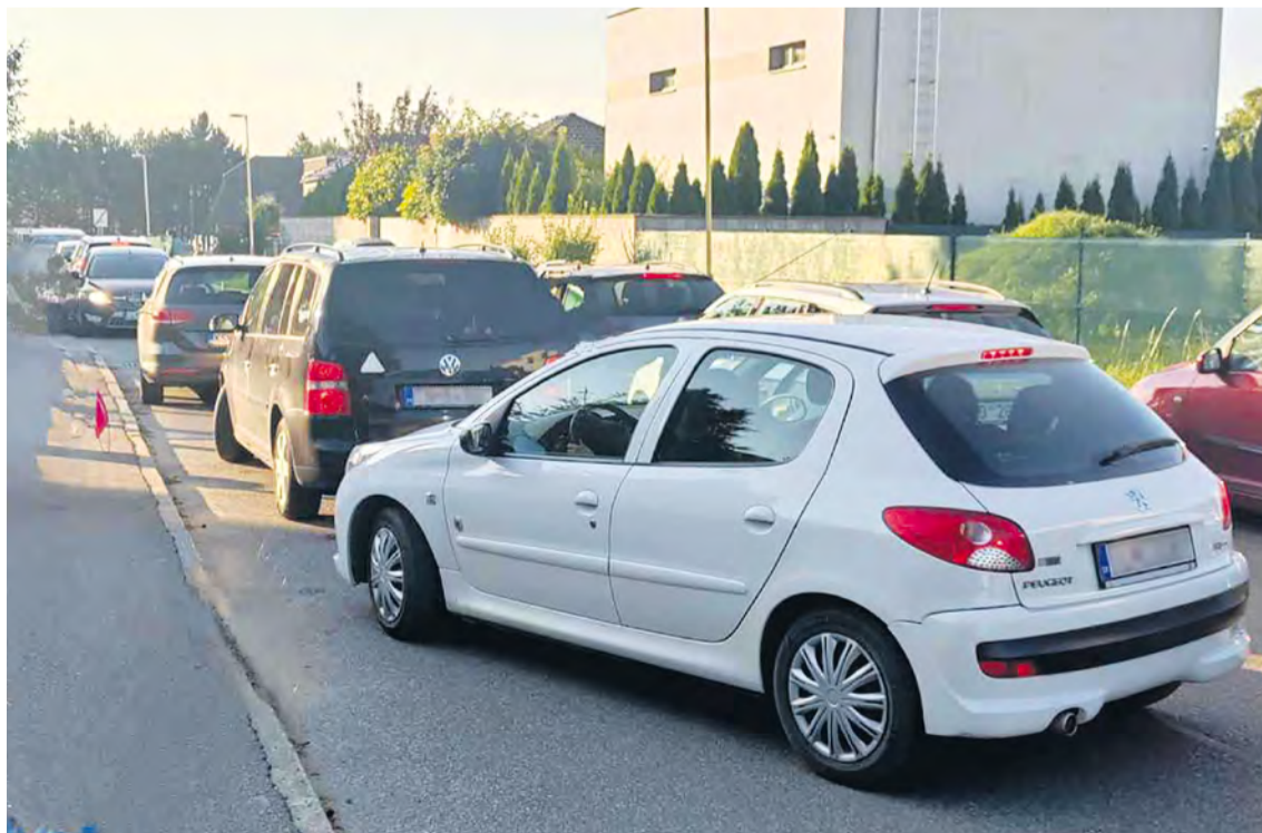
Kritická situácia s parkovaním pred miestnou školou.

Pripravila: Miroslava Bachratá