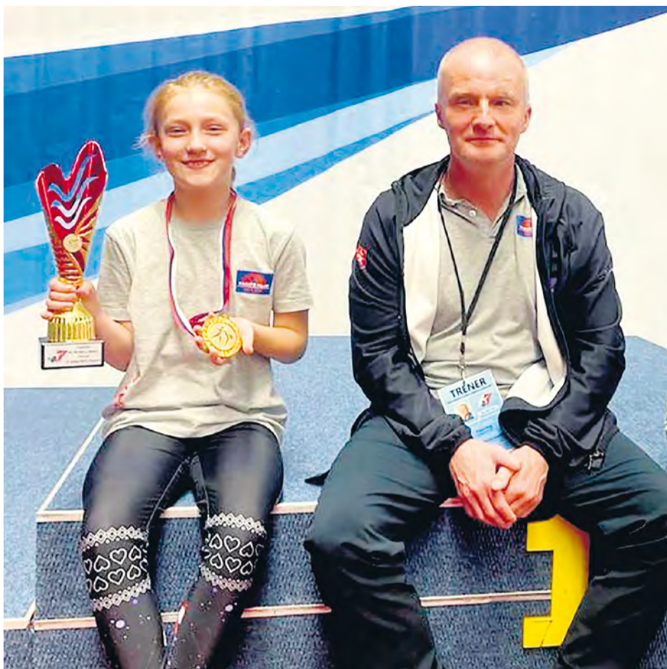
Ema s trénerom.