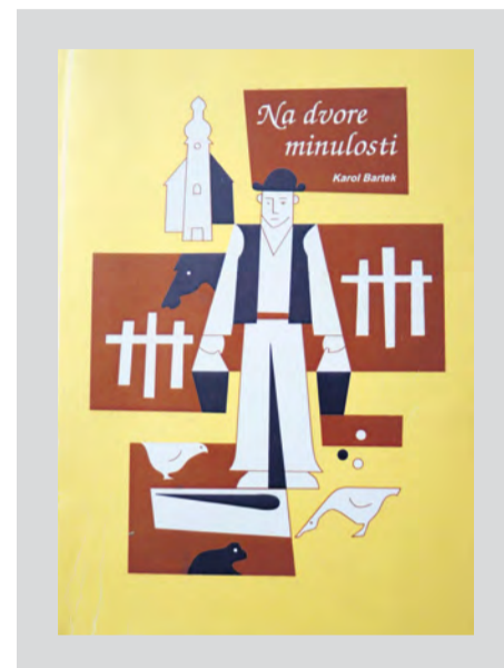
Na dvore minulosti. (2006)