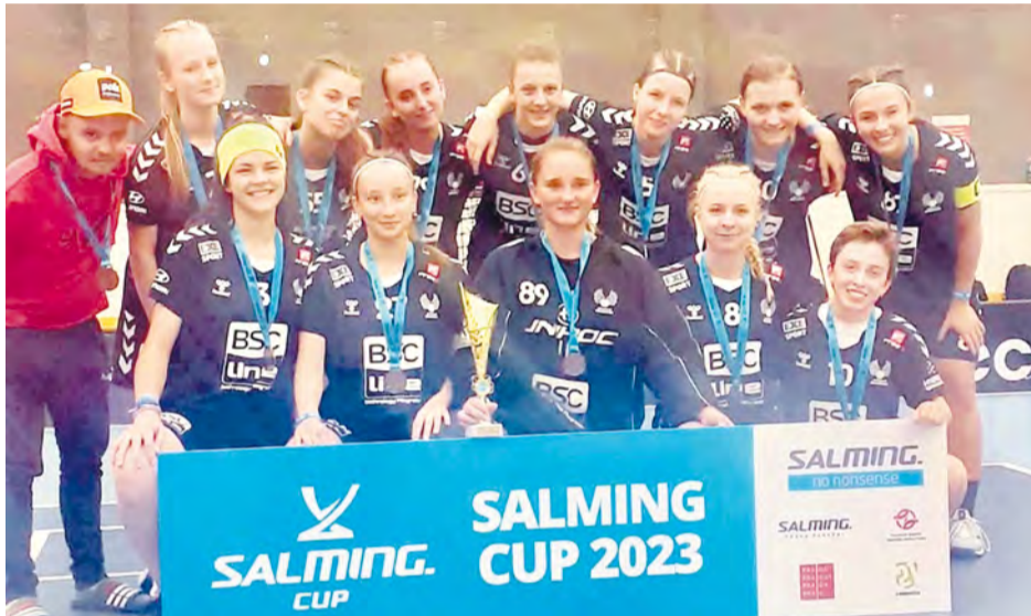
Florbal Salming Cup 2023

1. kolo Partizánske - Nemšová 1 : 5 2. kolo Kysucké NM - Nemšová 5 : 4 (sn)