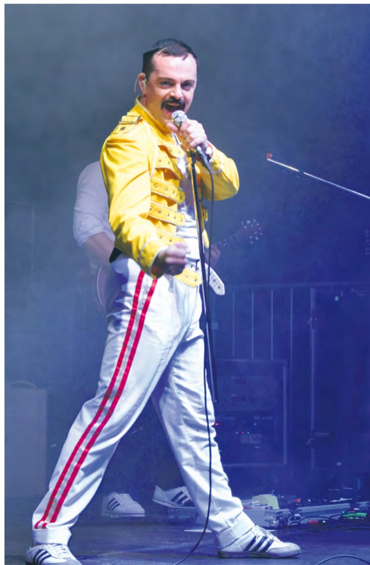
Queenshow - hudobno-divadelné vystúpenie.

Autor: Miroslava Dubovská