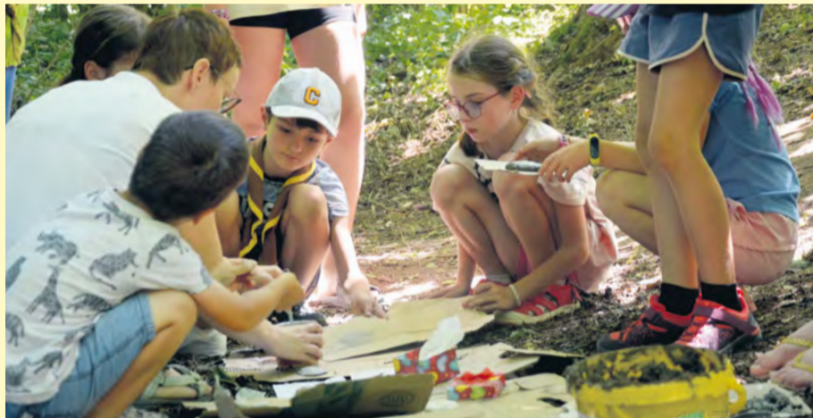
Skauti si užili tvorivé aktivity priamo v prírode.

Vrcholom skautského roka je, ako inak, letný skautský tábor, ktorý sa uskutočnil v 2 turnusoch. Pre starších skautov a skautky od 3. - 11. júla, mladšie víťatá a včielky od 11. - 17. júla. Po dlhšej dobe opäť táborili v Bolešove pri Gilianke. Skauti a skautky sa preniesli do mafiánskeho gangu, kde spoločnými silami museli poraziť bossa mafie. Víťatá a včielky sa naopak stali baníkmi v období Zlatej horúčky a získali odborníka geológ. Veľká vďaka patrí mladým rangerom a roverom, ktorí popri svojim povinnostiam venovali prípravu tábora naozaj veľa času. Deti tak strávili nezabudnuteľné 2 týždne v prírode, počas ktorých zabudli na mobily, budovali priateľstvá na celý život a užívali si prírodné okamihy.