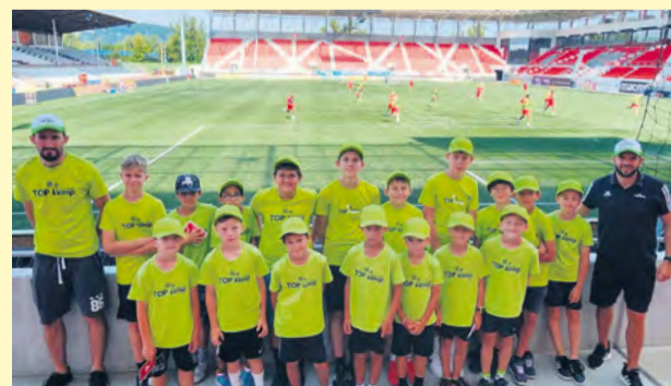
Účastníci premiérového futbalového kempu v Nemšovej.

Autor: Dáška Uherková / Foto: Archív organizácií