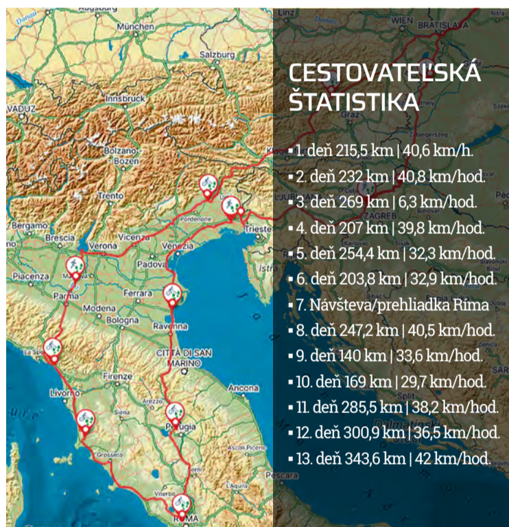
Trasa, ktorú absolvovali na babetách za 13 dní.

Autor: Miroslava Bachratá