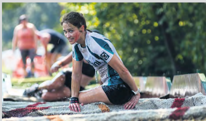
Posledná prekážka pred cieľom - 8 kontajnerov plných vody.

Slnko, kopec a ďalších 30 prekážok absolvovalo na 7 km alebo 14 km trati spolu 344 pretekárov. Dňa 19. augusta sa stretli v mestskej časti Tr. Závada, aby spolu prekonal najťažší pretek na Považí, ktorý oslávil už svoj 9. ročník. Zúčastneným pretekárom sa rozdalo spolu 70 cien a na charitatívne účely sa vyzbieralo približne 3 000 eur. Organizátori sú vďační, hrdí a nabíjajú elánom. Pri jubilejnom 10. ročníku budúci rok majú ambíciu naplniť kapacitu 500 účastníkov. Príďte si zmerať sily aj vy a podporte dobrú vec.