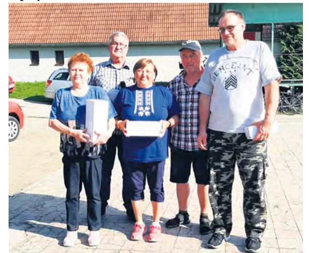
Ocenení hráči zo športového podujatia SZTP Horné Srnie.