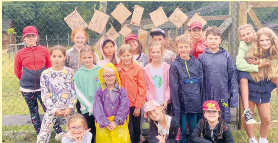
Jedno zo šiestich táborových stretnutí na Gazdovstve Uhliská.