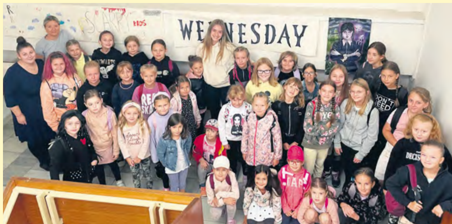
Tábor Wednesday mal medzi dievčatami veľký úspech.

Nezisková organizácia Robme radosť si pre deti pripravila štyri týždne plné zábavy. Na tábore Vitajte v džungli hľadali deti stratený poklad a zároveň mali možnosť dozvedieť sa toho veľa nového o zvieratkách. Pre deti bolo pripravených veľa súťaží, hier, ale aj kreatívne oddychovky. Najväčší úspech mala čokoládová fontána a odmeny, ktoré si deti vysúťažili v tímoch. Okrem hľadania pokladu sa mohli dievčatá prihlásiť aj na tábor Wednesday, o ktorý bol veľký záujem. Celý program bol prispôbený rovnomennému seriálu, dievčatá si vyrábali tajné denníčky, kľúčenky na telefóny, náramky priateľstva, tiež veľa tancovali, súťažili a zabávali sa.