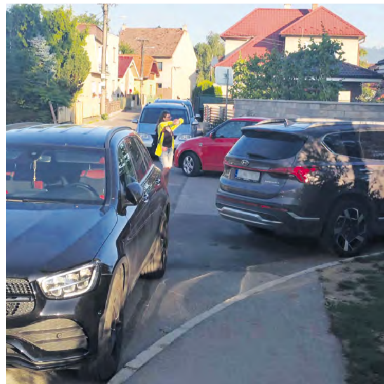
Autá stojace takmer až po Mierové námestie.