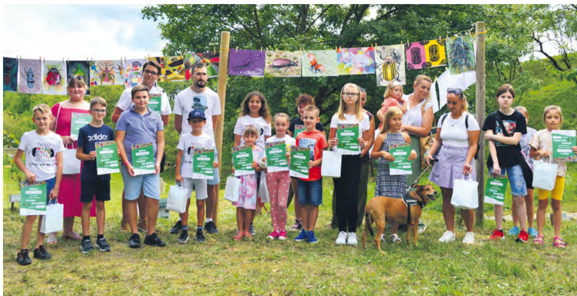
Niektorí z výhercov výtvarnej súťaže.