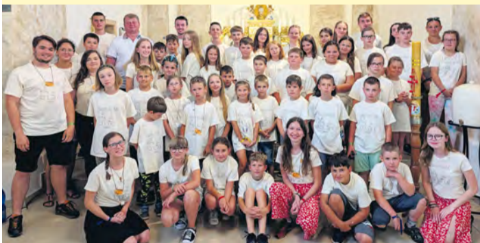
Účastníci farského tábora.

Farský tábor organizovaný farnosťou Nemšová bol pre deti týždňom plným nezabudnuteľných dobrodružstiev. V modernom Pastoračnom centre sv. Vendelína v obci Zubák sa stretlo 56 nadšených účastníkov, ktorí spolu zažili nezabudnuteľné chvíle. Na začiatku tábora si deti najskôr v skupinkách vytvorili názov, vlajku, pokrik a následne sa spoznali. Deti so svojimi skupinkami čakal bohatý program, ktorého súčasťou bola hra Safari, Pokladovka, celodenná túra na rozhladňu v Dohňanoch, ranné i večerné modlitby a v neposlednom rade sväté omše. Nechýbala ani nočná skúška odvahy, kde mali deti možnosť poraziť v útrobach tmavého lesa svoj strach. V predposledný deň pripravilo každé dieťa inému dieťaťu papierovú korunu, ktorú mu odovzdalo pri záverečnej scénke. Večer patril diskotéke, na ktorej nechýbalo chutné občerstvenie, balóny, konfety ani diskotekové svetlá. Tento tábor otvoril deťom dvere do sveta viery, priateľstva a nezabudnuteľných zážitkov.