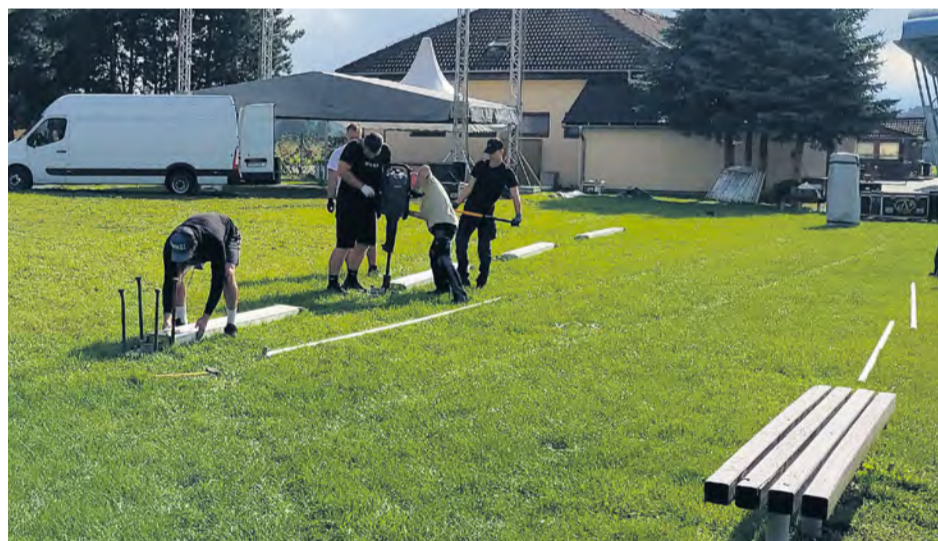
Inštalácia technických prvkov v hudobnej zóne.