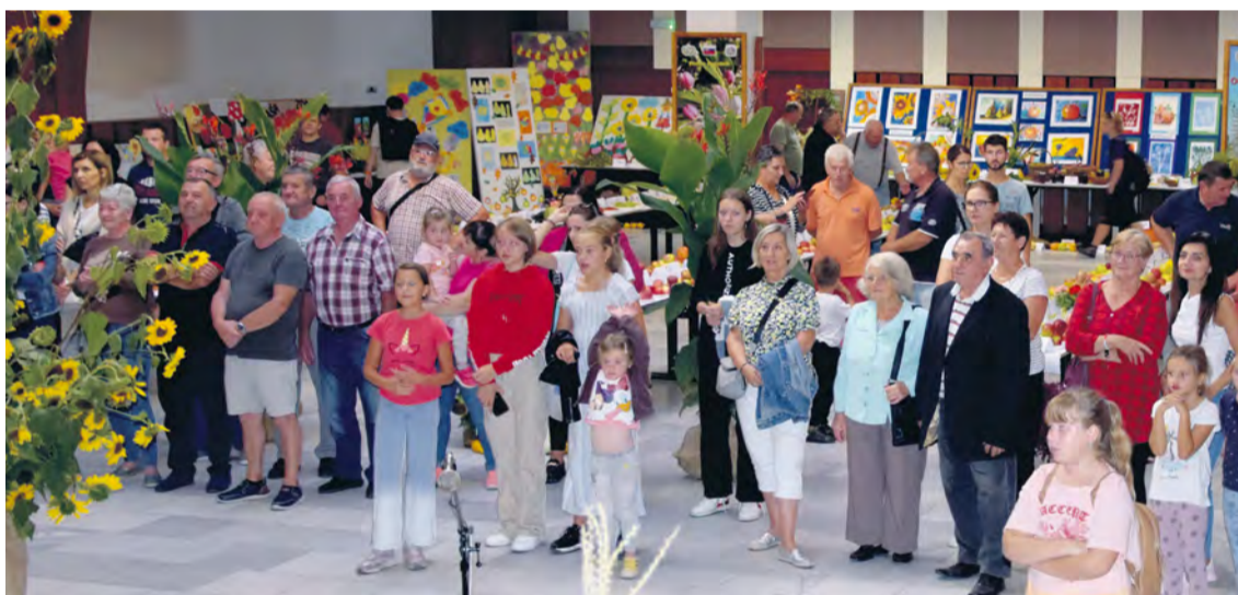
Návštevníci pri otvorení 55. ročníka výstavy.