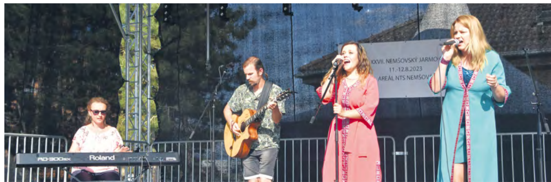
Vystúpenie miestnej skupiny Bosá Rosa.