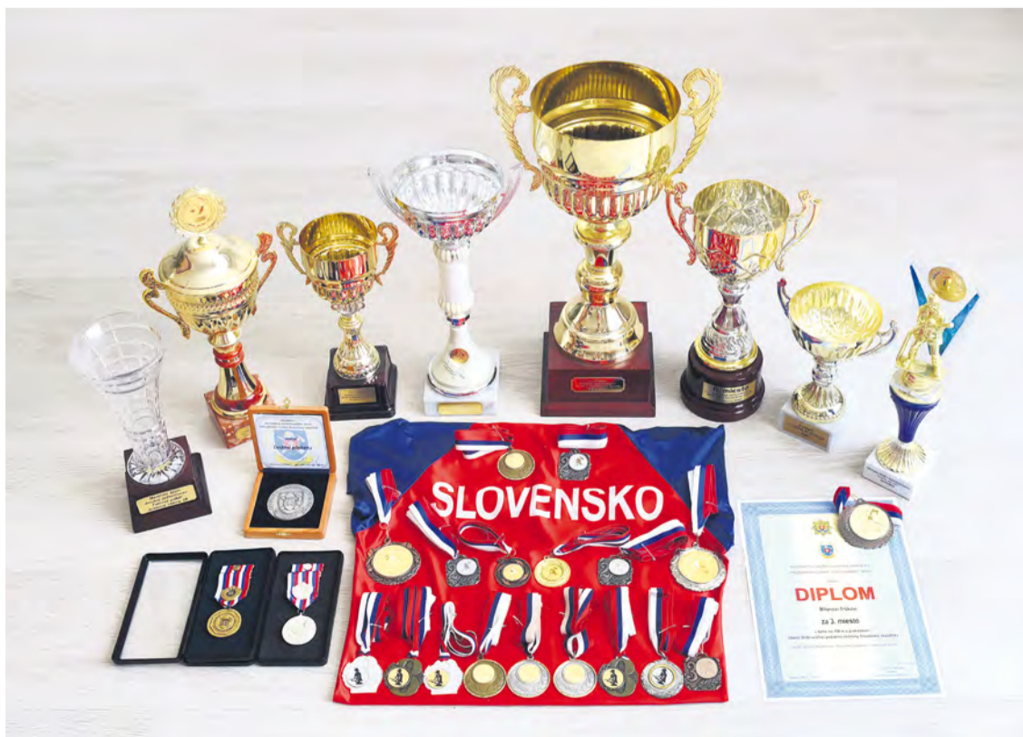
Zbierka najcennejších ocenení v rámci súťaží na Slovensku.