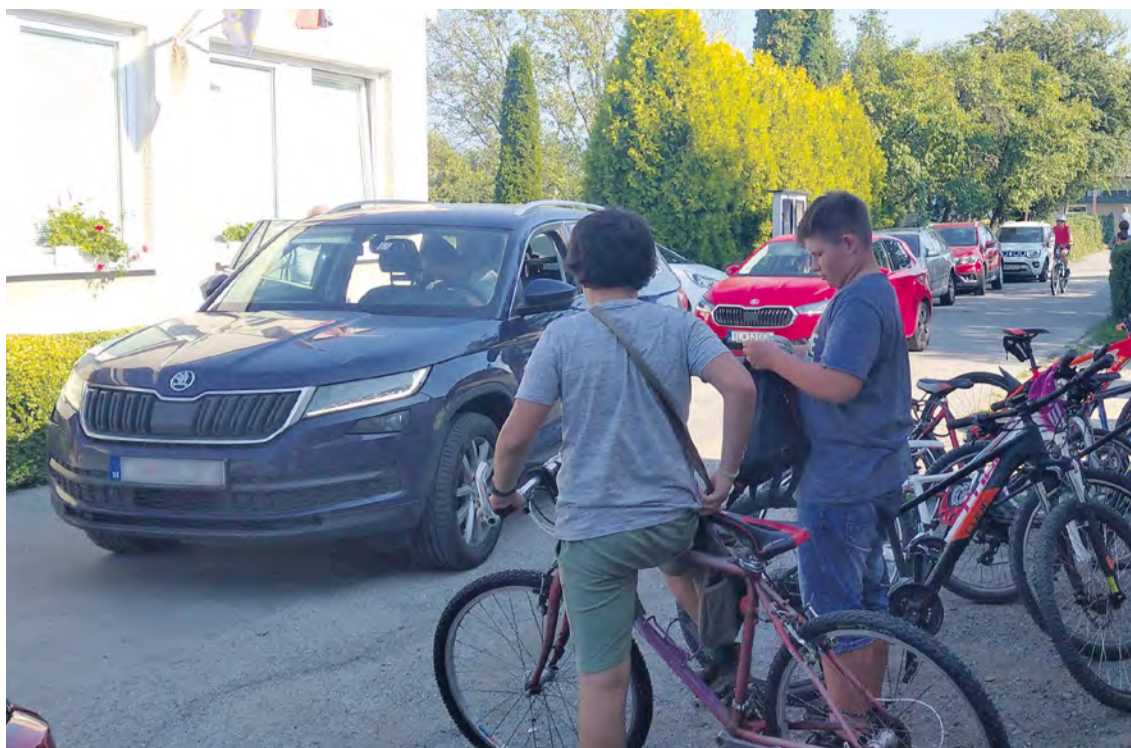
Situácia pri materskej škole.

Na Ul. Janka Palu sa v súčasnosti robia vodozádržné opatrenia a preto začíname uvažovať nad tým, že by sme využili zadnú parkovaciu plochu v škole a v budúcnosti ju z Ul. mládežnícka sprístupnili pre rodičov, ktorí vozia svoje deti do školy. Parkovisko by nebolo prejazdné smerom z alebo na Ul. Janka Palu okolo školy (ako je to dovolené dnes pre zamestnancov školy). Nechceme si predsa nechať zničiť nový areál a znížiť bezpečnosť detí. Rodič by mohol opustiť priestor ďalej len po Mládežníckej ulici. Zlepšila by sa tak situácia na Ul. Janka Palu. Tu má mesto a naďalej aj bude mať zamestnanca, ktorý napomáha bezpečnosti premávky. Reguláciou dopravy na prechode pre chodcov sa zvyšuje bezpečnosť detí a rodičov prichádzajúcich do školy pešo alebo od zastávky autobusu.