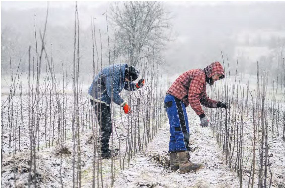
Práca v ovocnej a okrasnej škôlke je náročnou celoročnou záležitosťou

Reportáže na tému starostlivosti o stromy sme do Farmárskej revue pripravovali už