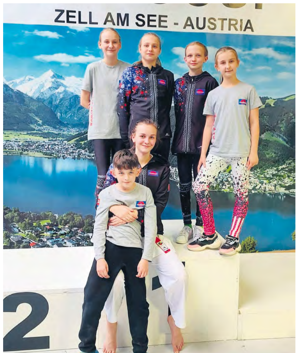
Na súťaži v Zell am See, Rakúsko.

Autor: Andrea Chrastinová