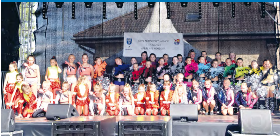
Tanečníčky na nemšovskom jarmoku.