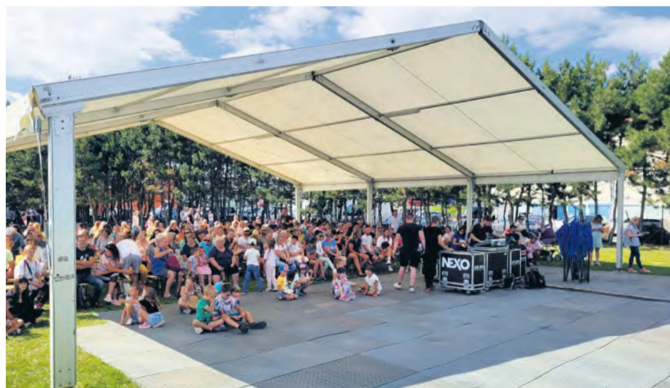
Novinkou bola tanečná plocha pod pódium.