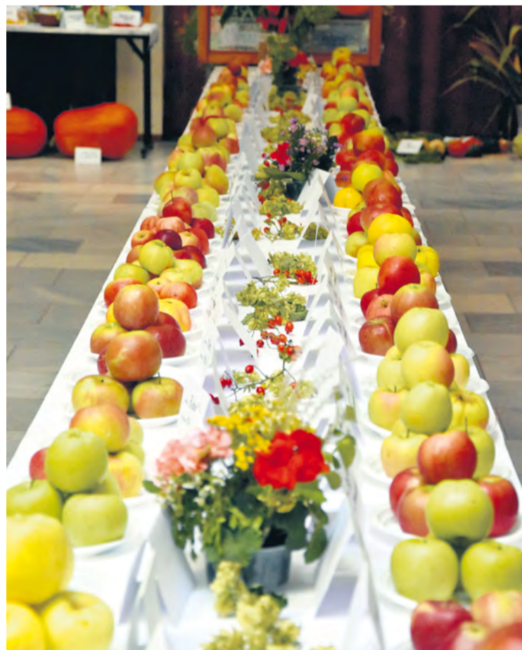
Úroda jabĺk v roku 2023

Najdôležitejšou činnosťou v jeseni je samozrejme zber úrody. Je potrebné si vychutnať plody svojej celoročnej práce. Pozitívnu činnosťou, ktorá sa deje, je tiež zhromažďovanie kompostu, ktorý slúži ako výživa pre stromy. Taktiež sa plánuje ovocná záhrada a sady, kde a čo budeme v jeseni sadiť. Výsadba v jeseni má oproti jari navrch, keďže je viac vlhky a strom dokáže lepšie koreniť. Keď príde v jari teplo a sucho, stromy sú už z časti zakorenené a lepšie odrastajú ako tie, ktoré boli nasadené až v jari. Chcel by som tiež upozorniť na častú chybu, ktorej sa ľudia v jeseni dopúšťajú a tým je orezávanie stromov. Rezné rany sa do zimy nestihnú zahojiť a strom sa veľmi vystavuje rizikám infekcie.