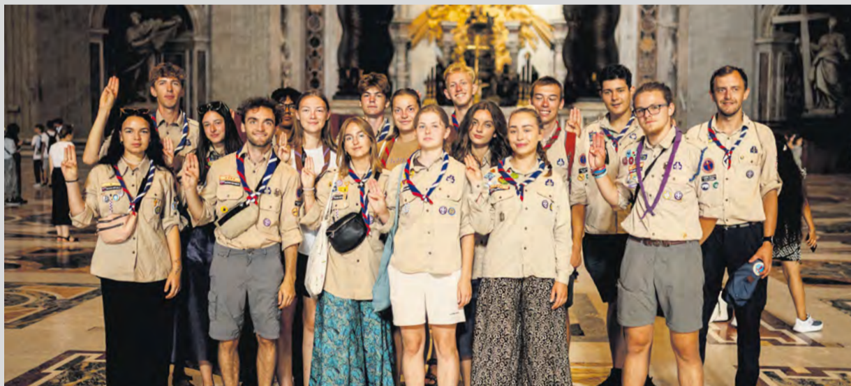
Atmosféra svetoznámeho chrámu sv. Petra vo Vatikáne bola očarujúca.

Naša púť začala v stredovekom Assisi, kde sme navštívili krásnu baziliku sv. Františka a Kláry, zabľúdili v uličkách Perugia alebo nás roztancovali sestričky, u ktorých sme bývali. Nevynechali sme ani kostolík s názvom Porciunkula, ktorý sv. František opravil. Z Assisi sme dva dni putovali do Gubbio (50 km). Slniečko nám prialo a každý deň nás sprevádzali teploty 35 a viac stupňov. Vyčerpaní, ale posilnení na duchu sme prišli do Gubbio. Toto mesto je známe vlkom, ktorého sv. František skrotil a vyslobodil tak ľudí zo strachu z tohto vlka. Ak ste náhodou fanúšikom seriálu Don Matte, tak určite odpovíme navštíviť Gubbio, pretože sa práve tu natáčal.