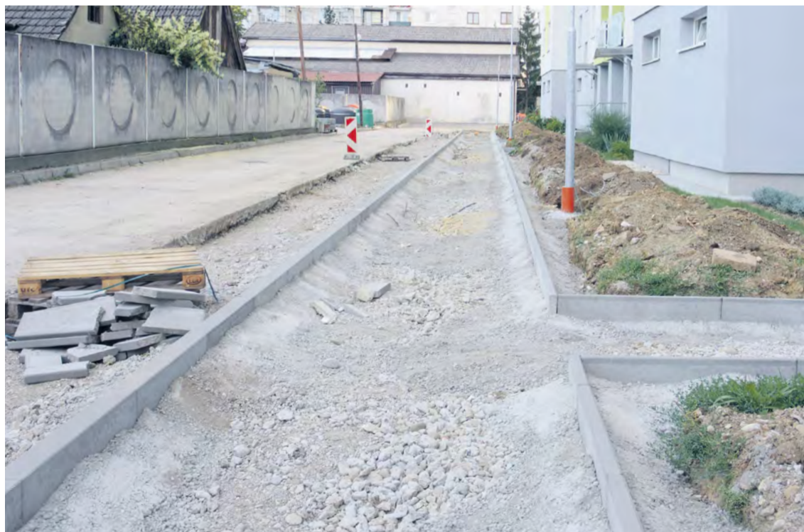
Rekonštrukcia cesty Súbežná Janka Palu za Tržnicou

Vedenie mesta nemá teraz tendenciu zaviesť zo dňa na deň parkovacia politiku a zakázať, kde sa nesmie parkovať a vyberať parkovné. No do budúca sa tomu nevyhne žiadne mesto na Slovensku vzhľadom na rastúci počet automobilov na jednej strane a rastúce náklady na údržbu ciest a parkovísk na strane druhej. Každá minca má dve strany. Jedna strana mince je definovaná a je jasná, mám dodržiavať predpisy, nemám parkovať na tráve, nemám parkovať na chodníku. Druhá strana mince je zložitejšia, kde mám teda parkovať? Áno, ak mám rodinný dom, tak na svojom pozemku. Horšie je, ak žijem v bytovom dome.