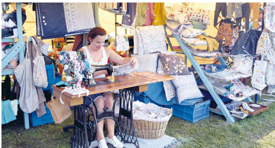
Na trhoch dominovali ručné a domáce výrobky.

Sobotné koncerty začali v ľudovej atmosfére vystúpením Folklórnej skupiny Liborčan a Kysuckou Heligónkou. Staršie ročníky potešila svojím repertoárom známa slovenská speváčka Marcela Laiferová. Ďalej vystúpila s vlastnou tvorbou nemšovská rocková kapela Petrichor, ktorá rozohnila davu, v čom pokračovala aj topoľčianska skupina Gipsy Čáve. Po zotmení prišiel ďalší bonbónik jarmoku, skupina Ba-