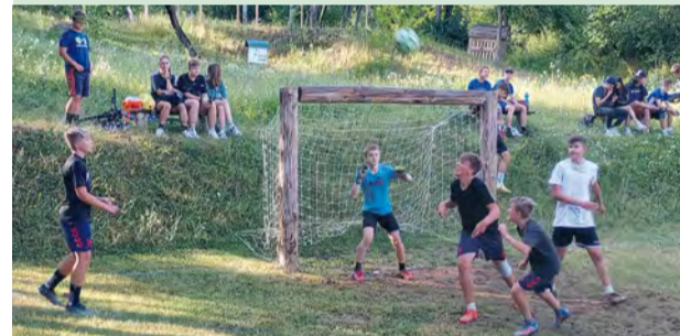
Aj 11. ročník turnaj priniesol zaujímavý futbal a radosť z hry