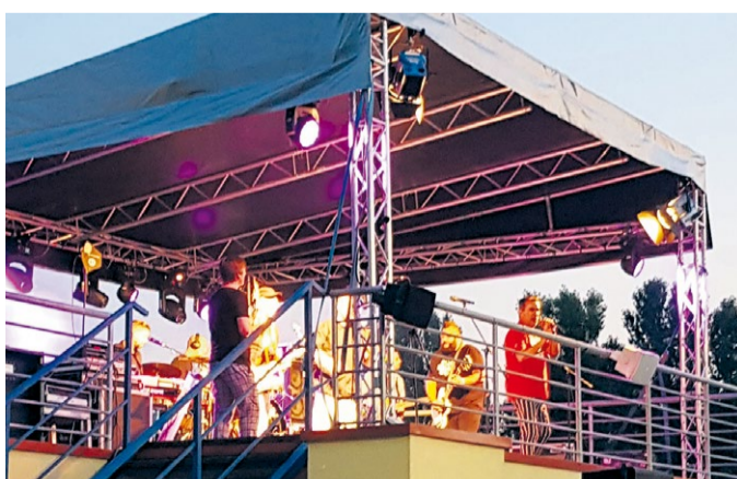
Hudobná skupina Polemic