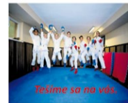
Tešíme sa na vás.