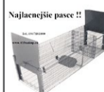
Najlaejšie pasce !!