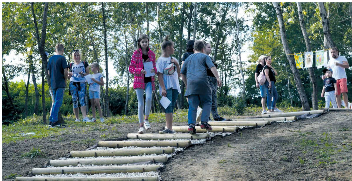
Vernisáž detských prác v parku Jozefa Lacu

V sobotu 4. septembra sa v Luborči konala originálna výstava detských prác. Do výtvarnej súťaže s názvom Lacove chrobáky sa zapojilo celkom šesť základných škôl a jedna Základná umelecká škola z Nemšovej a blízkeho okolia.