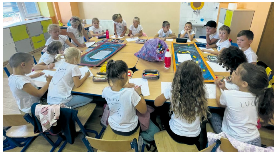
Spoznávali sme súhvezdia

V druhej polovici leta sme sa opäť tešili na našich školákov, ktorých rodičia prejavili záujem a prihlásili ich do letnej školy . Tohtoročná letná škola sa konala