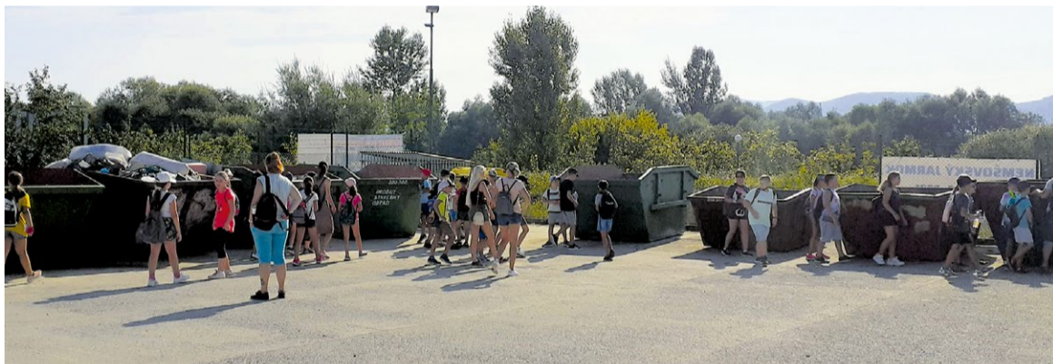
Žiaci na zbernom dvore odpadov

Malí environmentalisti sa zoznámili s prevádzkou zberného dvora, kde ich zaujal lis na lisovanie triedených zložiek komunálneho odpadu, zapojili sa do diskusie o triedení, vedeli odpovedať, čo sa môže priniesť na zberný dvor. V kompostárni sa zaujímali o všetky stroje a položili množstvo otázok, aj humorných, ktoré sa týkali okrem