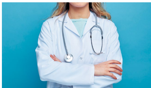
ilustračná fotografia

Ako všetci iste dobre vieme, v našom meste pociťujeme akútny nedostatok všeobecných lekárov pre dospelých. Následky tohto stavu sú zrejme a zároveň logické.