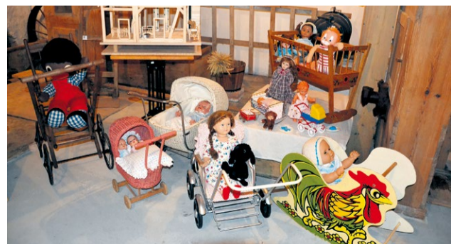
Hračky z minulosti

Niekoľko sto návštevníkov obdivovalo unikátne exponáty, najmä z 50-tych rokov minulého storočia. Tí skôr narodení sa tešili, pripomenúc si jedno z najkrajších