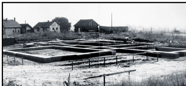
Cintorín Moravská, október 1982

kuchár vtedajšej majiteľky veľkostatku. Uprostred stál drevený kríž, na ktorom bola pribitá podoba Ježiša Krista. Pri tomto kríži sa usporadúvali náboženské pobožnosti. Podľa zápisu kríž nemal fundáciu, starala sa oň obec. V súčasnosti je na cintoríne v Klúčovom 223 hrobov, v ktorých sa nachádza 413 zosnulých. Najstaršie zachované hrobové miesto je v súčasnosti z roku 1914.