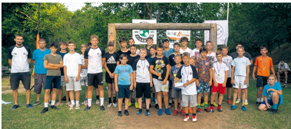
Junior Cigáň Cup

V termíne od 2. do 13. júla sa v Luborči uskutočnil už deviaty ročník letnej mládežníckej futbalovej miniligy Junior Cigáň Cup.