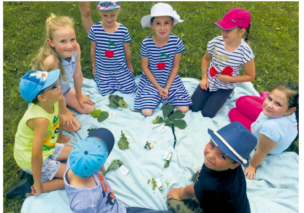
Hravé učenie v letnom tábore

v dňoch 16. – 20. augusta 2021 a zúčastnilo sa jej až 82 žiakov prvého stupňa. Téma letnej školy – Kým budem, až vyrastiem – sa niesla celým týždňom, počas ktorého deti spoznávali rôzne tradičné aj netradičné povolania. Cieľom bolo prostredníctvom didaktických hier a zážitkovým učením utvrdzovať nadobudnuté učivo. Deťom sme sa snažili počas jednotlivých dní priblížiť rôzne povolania, ktoré sme doplnili zaujímavými exkurziami a socializačnými aktivitami. Prvý deň sme navštívili Regionálne centrum zhodnocovania BRO (kompostáren) a Zberný dvor v Nemšovej , kde si deti vypočuli dôležité informácie o triedení odpadu a spracovaní biologického odpadu, z ktorého vzniká kompost použiteľný v našich záhradách. Na záver dňa si deti vyrobili tričká. Lektori z organizácie Mladý podnikavec deťom priblížili svet financií hrovou formou. Plnili rôzne úlohy, pri ktorých využívali tímovú spoluprácu a finančnú gramotnosť. Tretí deň našej letnej školy sme navštívili kontaktnú ZOO v Lubine , kde sa deti na chvíľu premenili na malých chovateľov. Vyskúšali si nakrmiť ovečky, srnku, ale aj lamu. Štvrtok si deti užili v spoločnosti dobrovoľných hasičov z Bolesova . Naši malí budúci hasiči mali neskutočné množstvo otázok, na ktoré im tí súčasní veľkí hasiči ochotne odpovedali. Okrem toho si deti zmerali sily v detských šta-