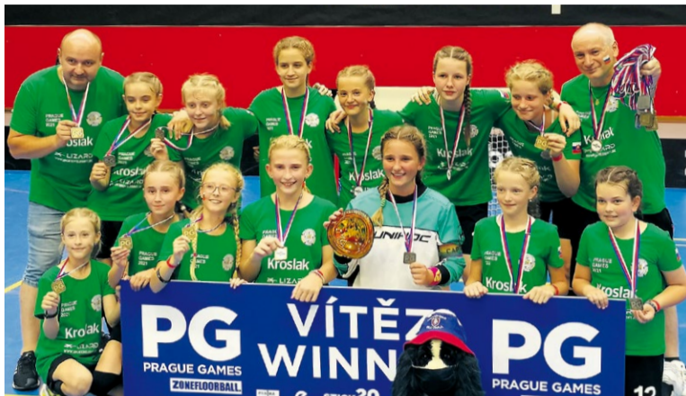
Florbal PG žiačky U12