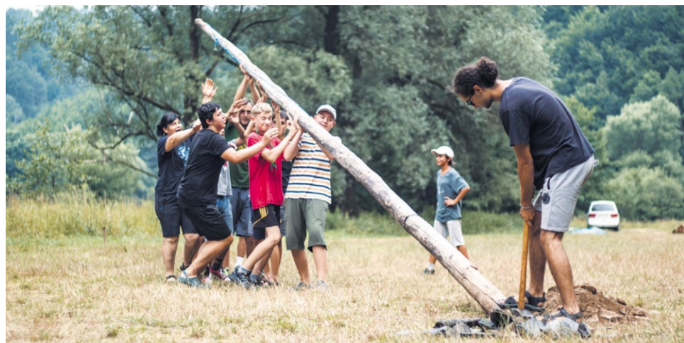
Uprostred táborového námestia sa stavia stožiar pre štátnu vlajku

kuchyne. Spoza jedálenského pultu nám kývajú dve skvelé ženy, ktoré si uprostred leta vzali na dva týždne dovolenku, aby až do úplného vyčerpania (no vždy s úsmevom na perách) pripravovali pre nás jedlá, ktorým sa nevyrovná ani najlepšia reštaurácia v okolí. V skautskom tábore akoby sa vždy na dva týždne zastavil čas. Človek ujde od reality všedných dní a žije akýsi pohodovejší a príjemnejší čas. Samozrejme, toto všetko by nemalo zmysel, ak by sme túto radosť a naše lepšie ja potom neprinášali späť medzi naše rodiny či priateľov. To, čo nás naučí skautský tábor musí mať pre nás presah aj do reálneho