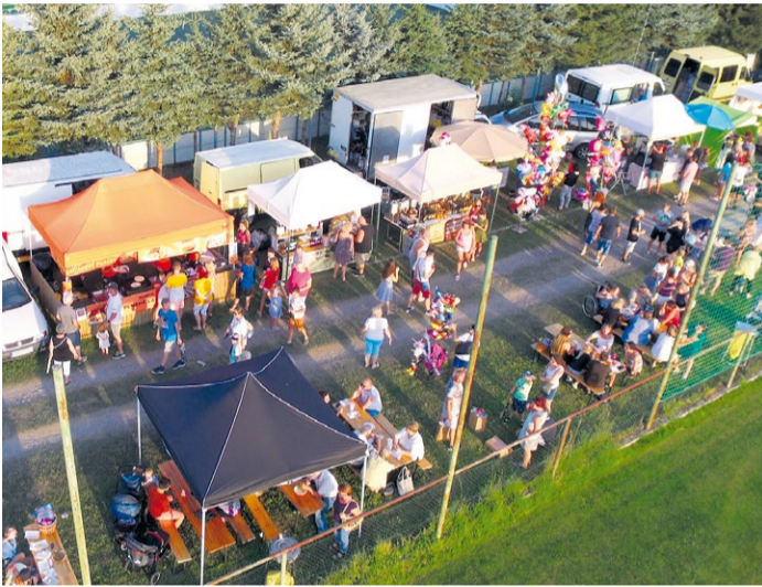
Stánky s občerstvením

nať jedinečnú atmosféru pri vzniku originálneho umeleckého diela. Neodmysliteľnou súčasťou jarmoku bývajú kolotoče a nebolo to inak ani v Nemšovej. Na húsenkovej dráhe, lodi, retiazkovom kolotoči si zašantili nielen deti, ale i dospelí. O úspechu celého podujatia svedčí i odozva, ktorá sa šírila nielen verbálne, ale i prostredníctvom internetu. Citujem správu účinkujúcej kapely Mafia Corner: „Nemšová, to bola bomba. Ďakujeme za takúto početnú účasť a hlavne za Mega žúr a Energiu, ktorú ste doniesli. Ste proste bombovní.“ Dlho