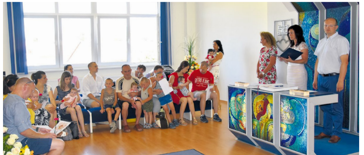
Noví občania nášho mesta