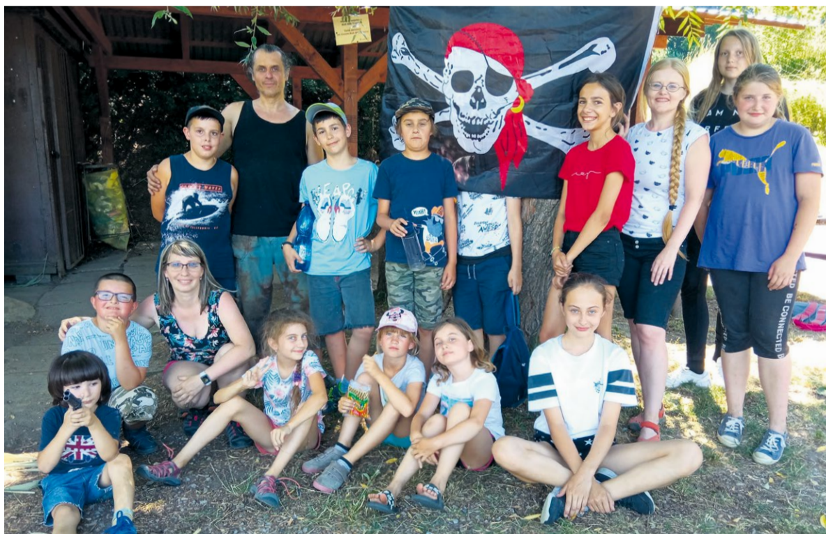
Žiaci výtvarného odboru na ceste za pirátskym pokladom