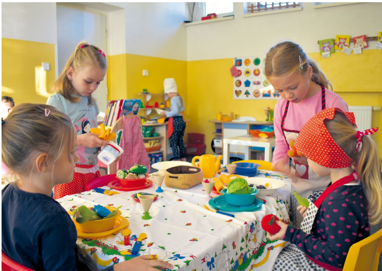
Námetová hra na domácnosť