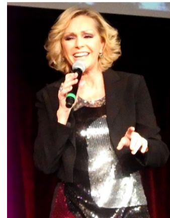
Helena Vondráčková ilustračná fotografia