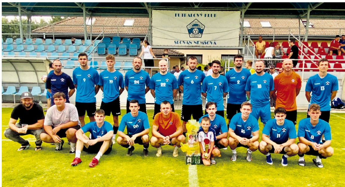
Memoriál P. Kenderu 1. FKS Nemšová