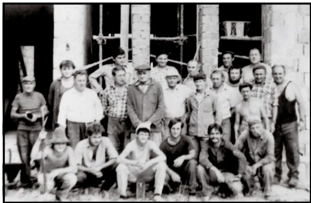
Brigádni na stavbe cintorína

Sviatok zosnulých sa blíži a my si pripomenieme príbuzných, ktorí už nie sú medzi nami. Nasledujúci článok sa venuje miestam, kde sa pochovávali zosnulí v minulosti a kde sa pochovávajú dnes. Na našich cintorínoch je pochovaných priemerne 50 občanov ročne. Spolu sa na nich nachádza 1 928 hrobových miest a v nich 3 498 zosnulých.