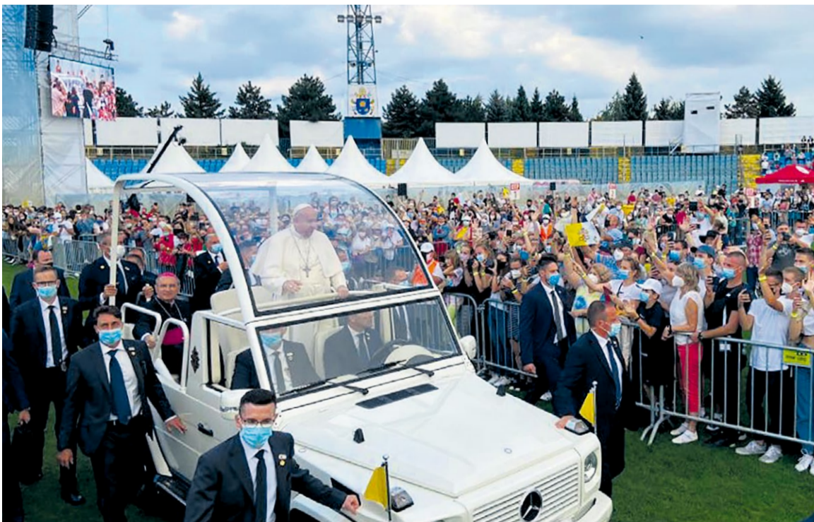
Z návštevy pápeža