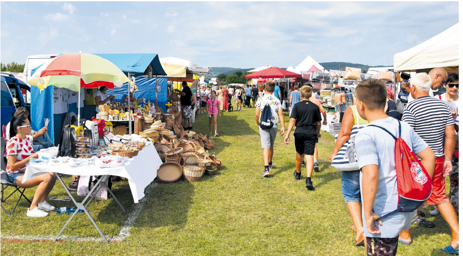
Jarmočná atmosféra prilákala malých i veľkých