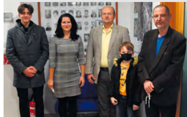
Víťazi súťaže znelka pre Nemšovu