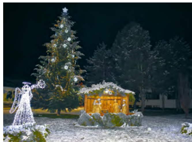
Vianočnú výzdobu tvorí bohatá kolekcia