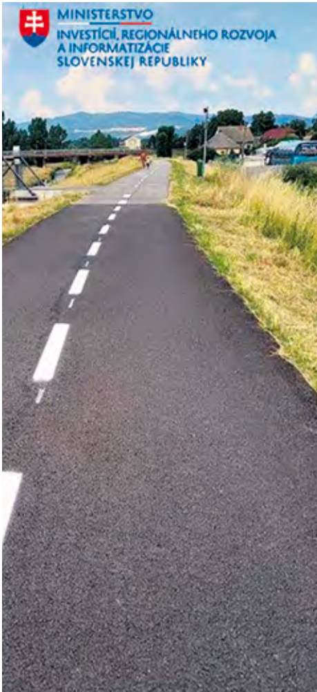
Cyklochodník, Rybárska (LIDL)