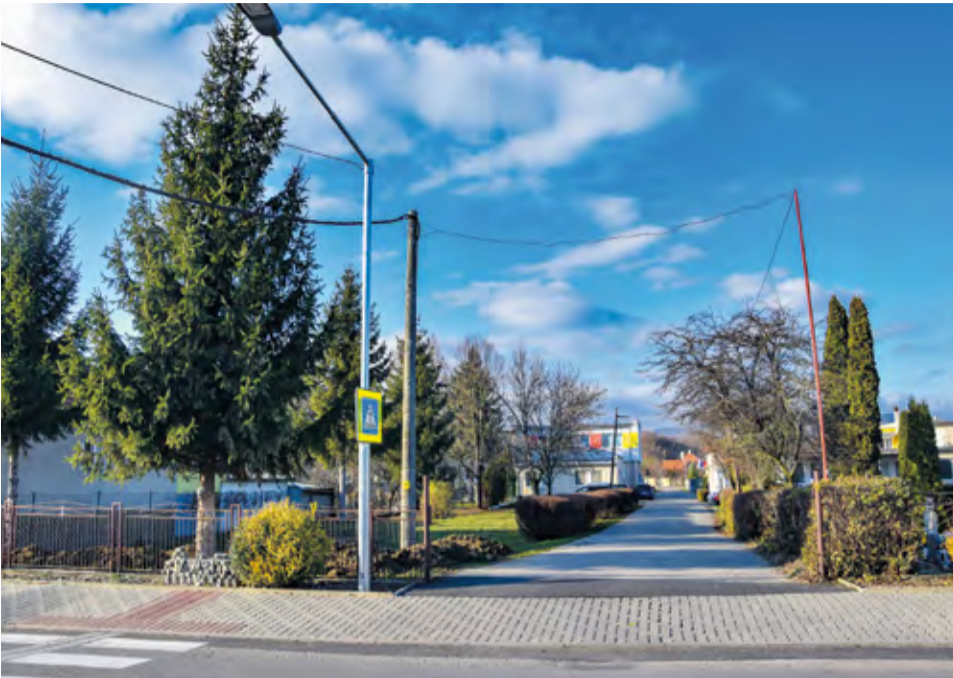
Priechod pre chodcov v Luborči