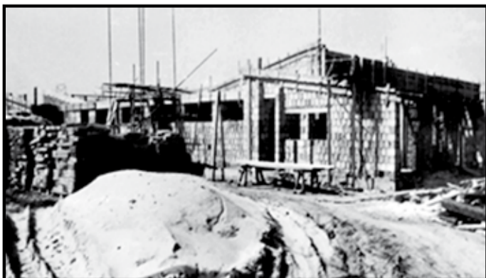
Výstavba domu smútku 23. máj 1983