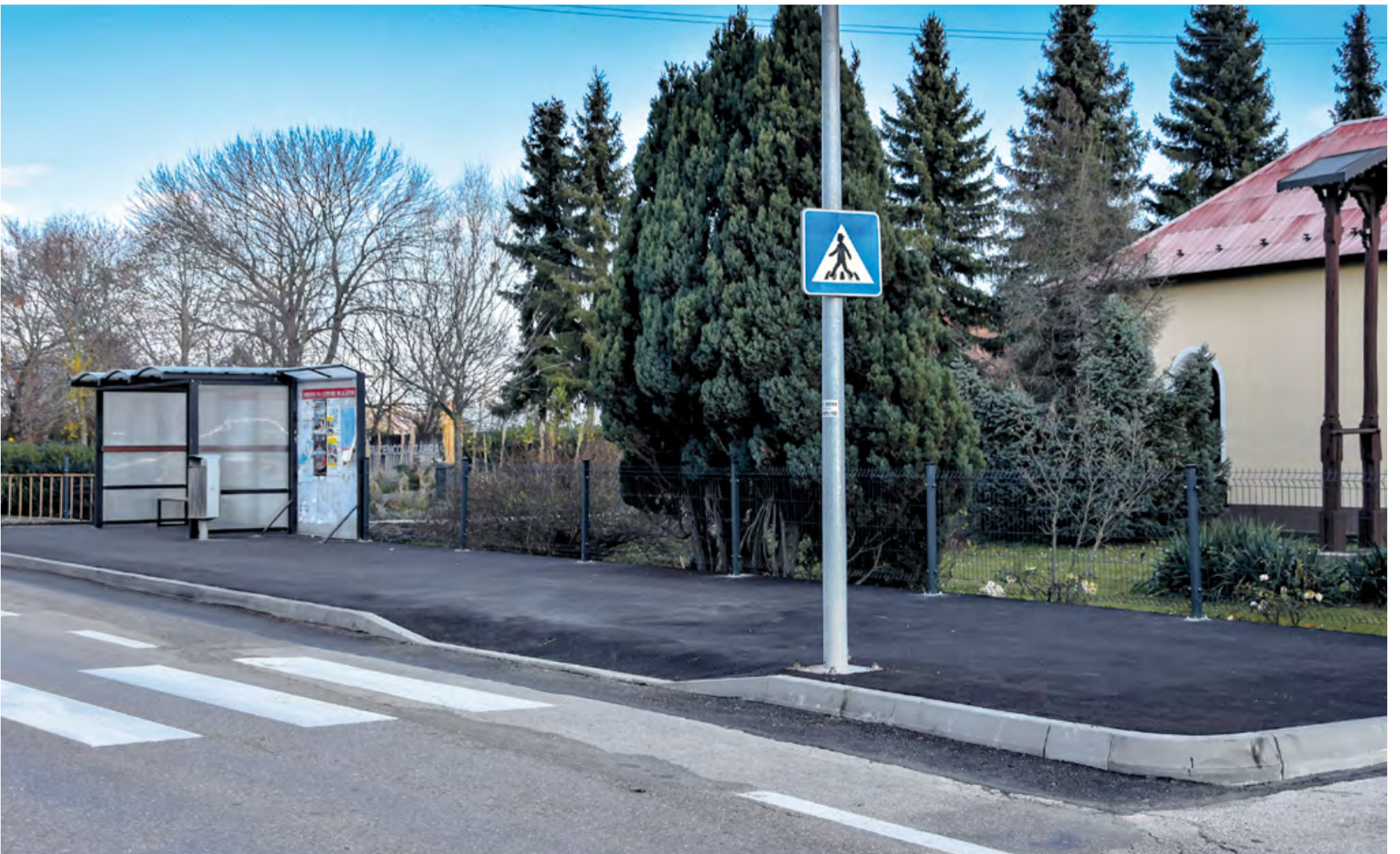
Zrekonštruovaná autobusová zastávka v Klúčovom

Trochu zložitejšia bola obnova tenisových kurtov NTS. Na začiatku bol nápad dvoch nadšených tenistiek, ktoré mali záujem prevádzkovať v Nemšovej tenisovú školu – letné kempy – a keďže mali chuť pracovať, mesto sa s nimi dohodlo na obnove areálu a zo strany mesta bol poskytnutý materiál. Okolie tenisových kurtov a odstránenie náletových drevín zabezpečili pracovníci VPS.