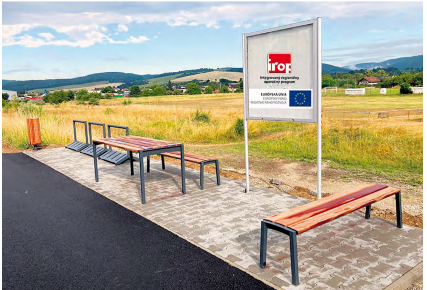
Odpočívadlo na cyklochodníku, Rybárska (LIDL)

napojenie na cyklotrasu Trenčín – Nemšová. Realizátorom projektu bola firma STRABAG, s. r. o. Počas realizácie nastali vážne problémy, popasovať sme sa však museli s nevyhovujúcim podložením na dvoch úsekoch cyklochodníka.