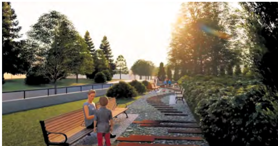
Ukážka z vizualizácie vodozadržných opatrení

projektom, pokiaľ ide o budovanie cyklochodníkov v rámci mesta. Hlavnou úlohou projektu je zabezpečiť bezpečný priechod cyklistov medzi mestskými časťami, a to popri frekventovanej ceste II. triedy. Projektu dnes už bráni iba počasie a uzávera cesty II. triedy z dôvodu zimnej údržby. Samotnej realizácii predchádzalo v rokoch 2019/2020 vysporiadanie pozemkov, získanie NFP a obstaranie zhotoviteľa. V súčasnosti prebieha ešte činnosť spojená s prekládkou telekomunikačnej siete. Predpokladaný termín realizácie je rok 2022. Realizačná firma: DOSA Slovakia, s. r. o., Bytča. Zmluvná cena diela: 282 924,00 €. Na realizáciu diela bol schválený nenávratný finančný príspevok zo štrukturálnych fondov Európskej únie a štátneho rozpočtu vo výške 252 534,72 €.