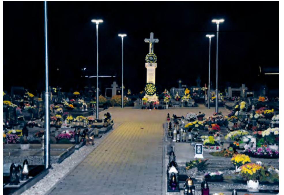
Obnovená ústredná plocha cintorína v Luborči