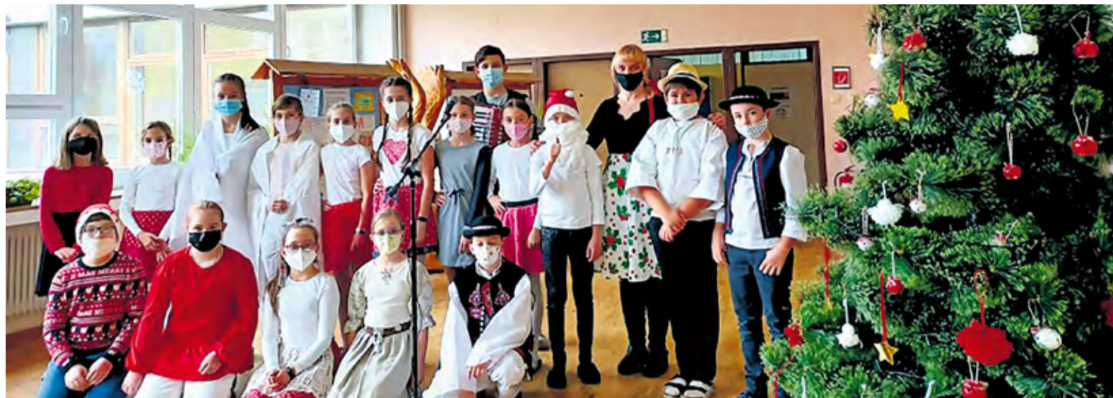
Ludové zvyky a tradície od Ondreja do Vianoc

V našej škole prežívame adventné obdobie a aj krátkymi zamysleniami pred vyučovaním sa pripravujeme na príchod Ježiška. Ale treba spomenúť, že aj v predadventnom období škola dýchala životom a zapájame sa do rôznych aktivít a súťaží.