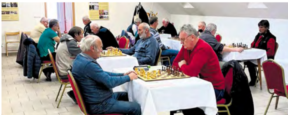
Šachový zápas v Mestskom múzeu Nemšová