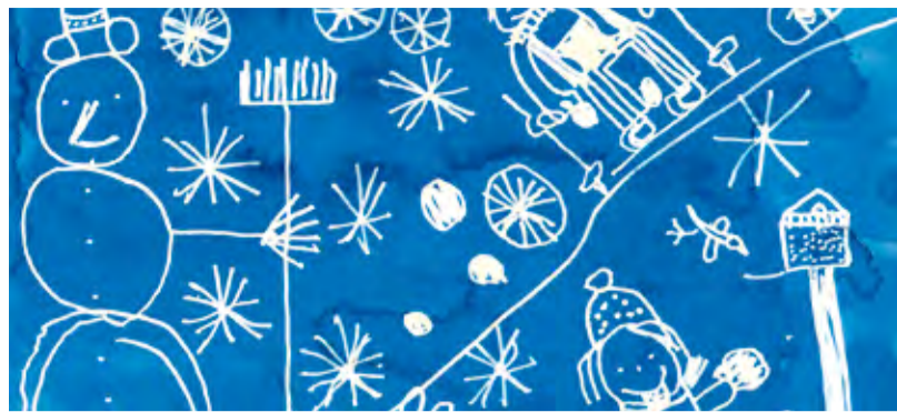
Benjamínko, 6 rokov