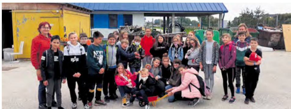
Žiaci na Zbernom dvore odpadov