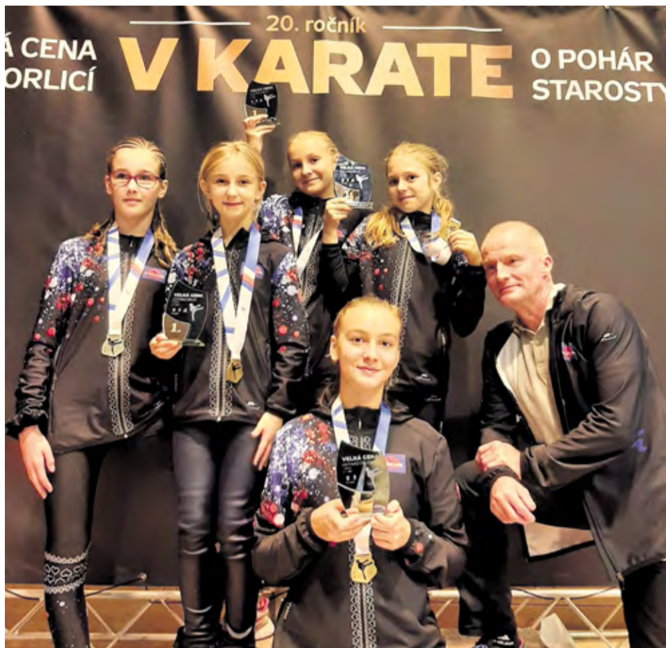
KK Mugen Team, Ústí nad Orlicí