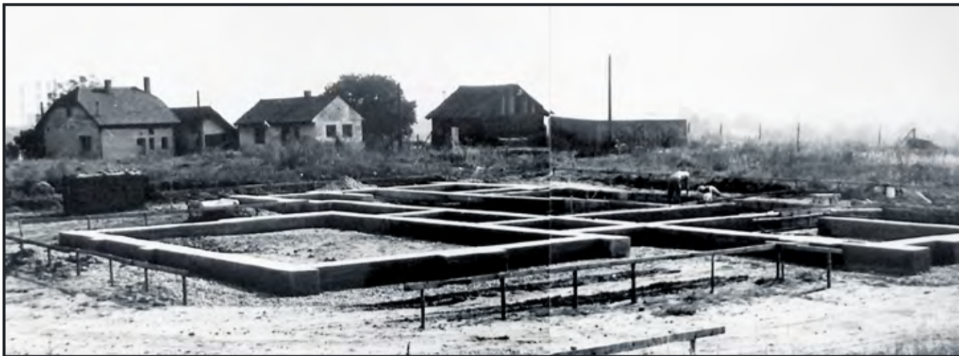
Základy domu smútku v roku 1982

Presne 40 rokov uplynulo od začatia výstavby hlavného cintorína v meste Nemšová a 35 rokov od ukončenia prác na tejto stavbe. K výstavbe cintorína sa pristúpilo za účelom vyriešenia priestorových nedostatkov pre pochovávanie pre tri obce - Horné Srnie, Skalku Nad Váhom a vlastnú obec, obec Nemšová, čo predstavovalo 10 500 obyvateľov.