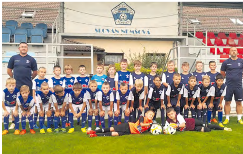
Futbalové prípravky U9 a U11