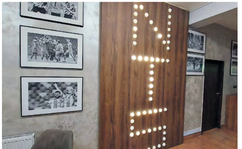
V priestoroch NTS prebieha rekonštrukcia