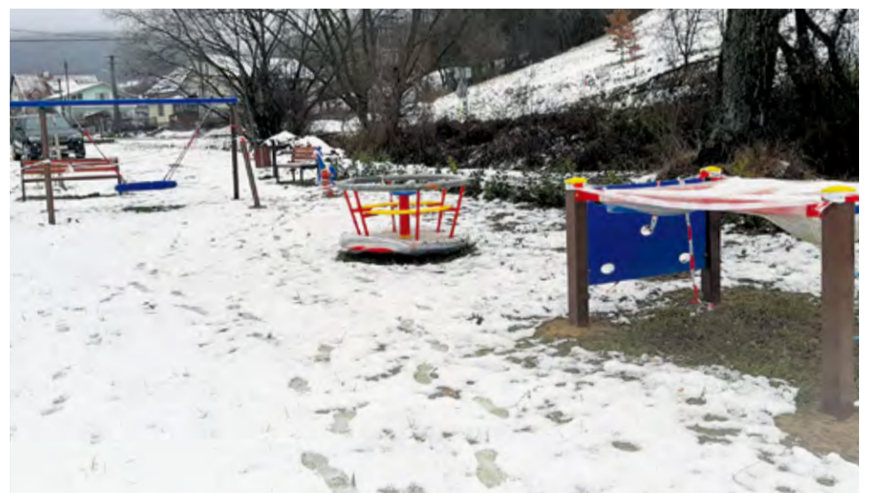
Detiské ihrisko - Oáza pohybu, oddychu a priateľstva, Trenčianska Závada