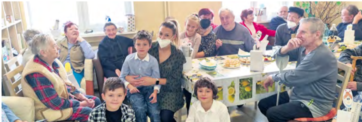
Deti rozžiarili srdcia starších

Nadišiel výnimočný deň, keď sa po dlhom čase opäť otvorili dvere nášho zariadenia pre milé detské tváre, ktoré navštívili našich klientov, aby im urobili radosť.