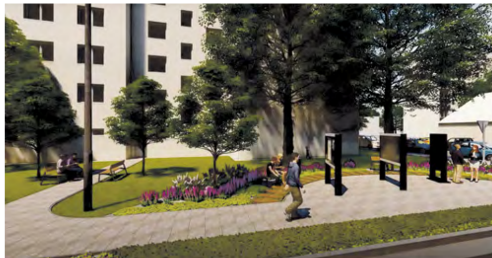
Ukážka z vizualizácie zrekonštruovanej Ulice Janka Palu

Projekt výstavby Cyklochodníka v úseku Ľuborča – Klúčové je skutočne kľúčovým