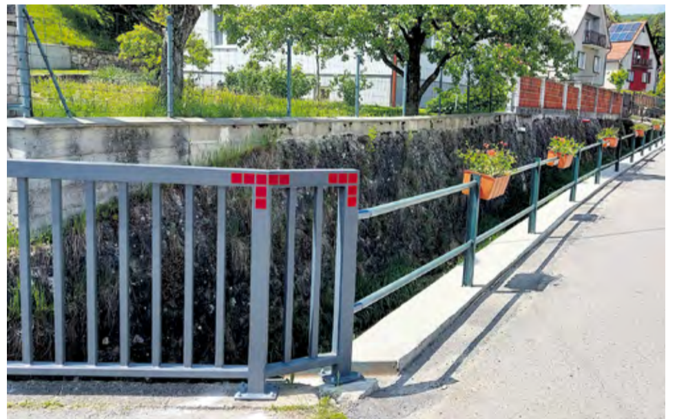
Nové zábradlie v Trenčianskej Závade