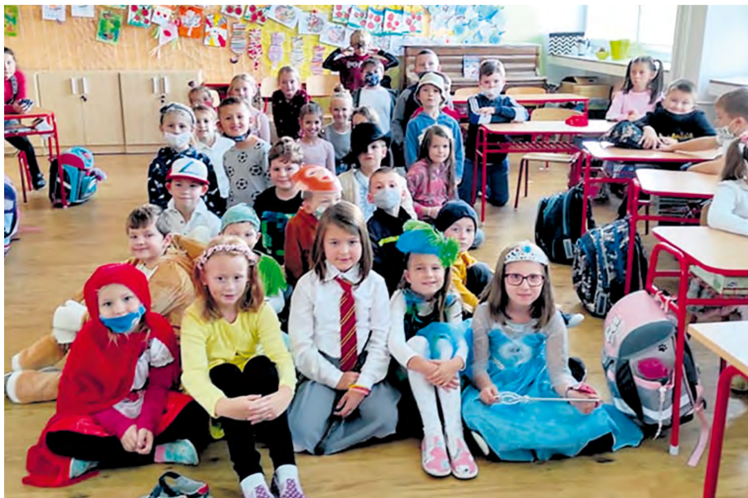
Rozprávková atmosféra počas Medzinárodného dňa školských knižníc