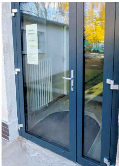
Zdravotné stredisko, Ul. Odbojárrov, Nemšová

V súčasnosti prebieha realizácia poslednej vrstvy asfaltového krytu, ktorú mesto na prvý pokus neprebralo. Celková cena diela: predpokladané náklady 28 005,96 € (vlastné zdroje). Realizátor: PEMAL, s. r. o.