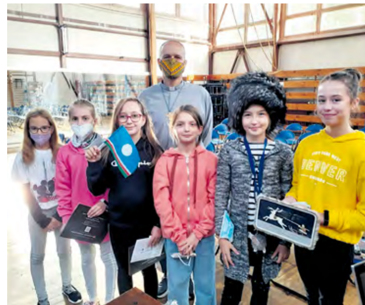
Tehlička na pomoc rozvojovým krajinám