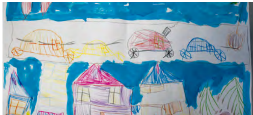
Vikinka, 5 rokov