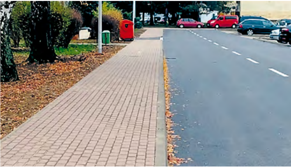
Rekonštrukcia chodníka, cesty, Ul. Odbojárov, Nemšová