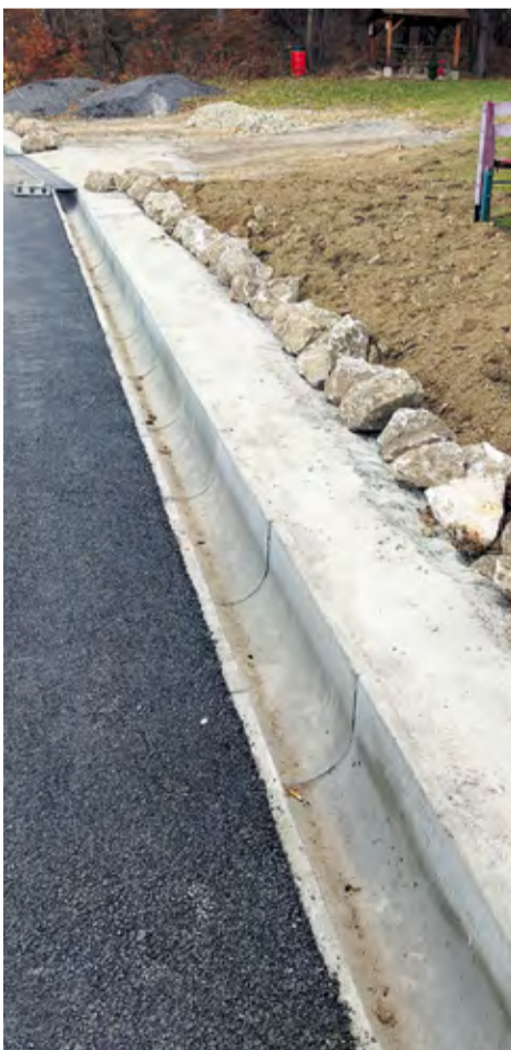
Realizácia odvodňovacieho žľabu, Trenč. Závada

Cyklochodník bol vybudovaný za účelom bezpečného presunu chodcov, ako aj cyklistov medzi jednotlivými mestskými časťami, presunu do práce, ako aj