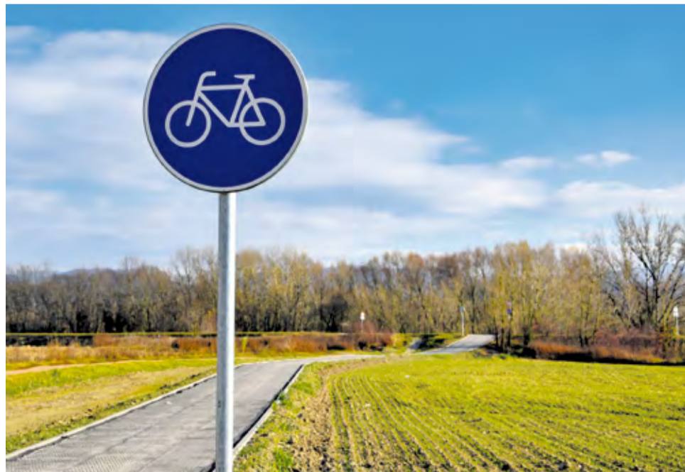
Zjazd z cyklochodníka, Klúčové