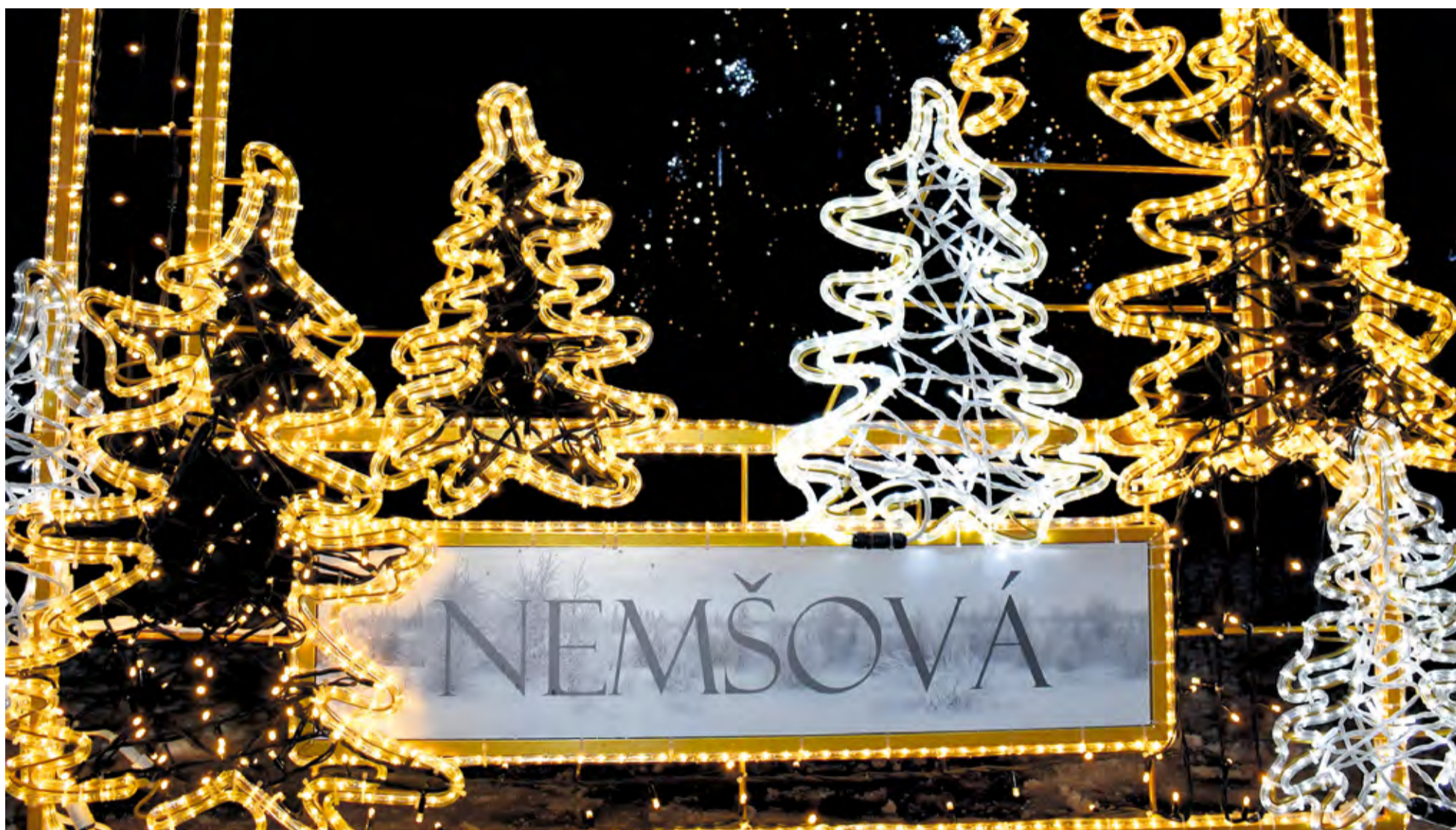
Vianočná atmosféra nášho mesta