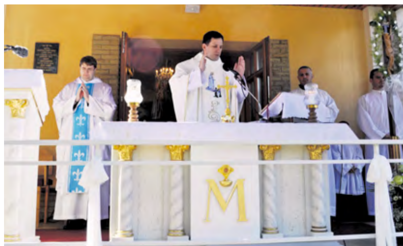
Nový obetný stôl a ambona počas Fatimskej slávnosti v Trenčianskej Závade