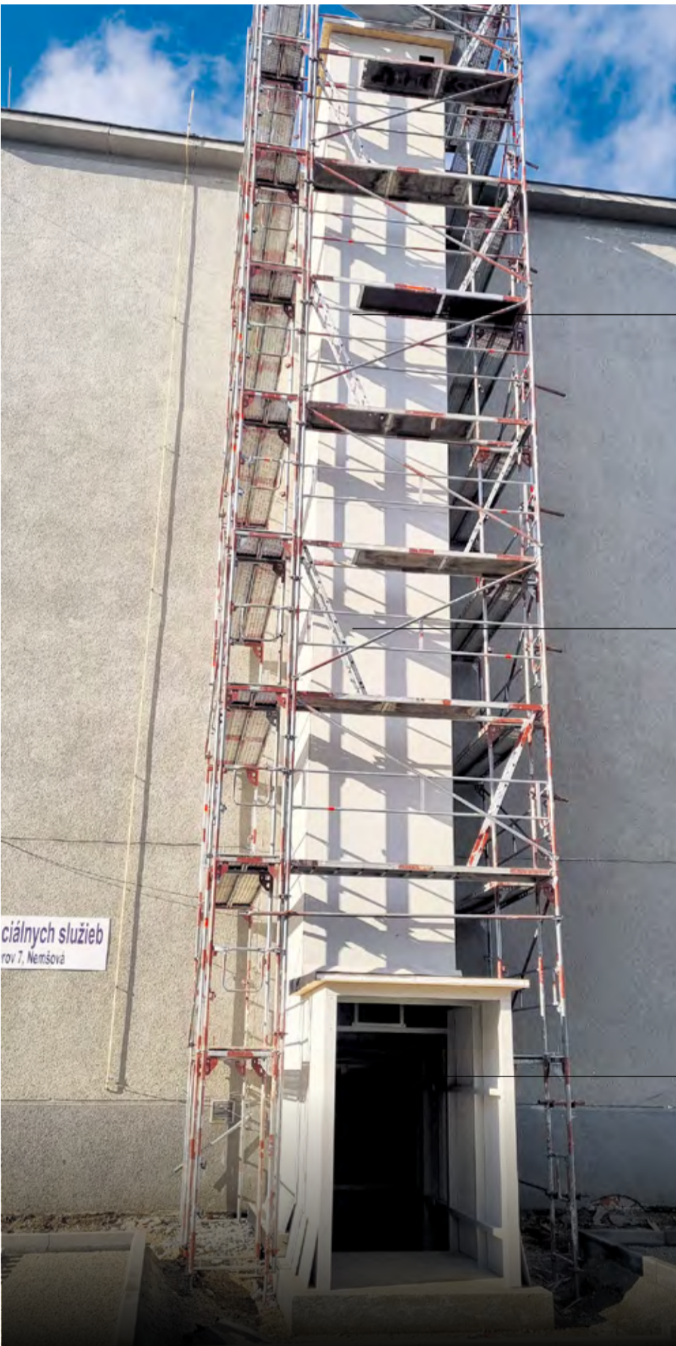
Centrum sociálnych služieb, Ul. Odbojárov, Nemšová

Výstavba lôžkového výťahu pre Centrum sociálnych služieb je krokom do budúcnosti a možným ďalším rozvojom samotného centra. Už dnes sa v centre nachádza značné množstvo imobilných klientov, ktorí potrebujú častý a urgentný prevoz do zdravotníckych zariadení, čo je z poschodí technicky náročné. Bohužiaľ, kapacita súčasného centra už nepostačuje súčasnému dopytu po miestach, a tak mesto plánuje jeho rozšírenie zo súčasných dvoch poschodí na tri. Zmluvná cena diela: 122 880,00 € z toho NFP: 30 000,00 € Realizátor: LIFT SERVIS Levice, s. r. o.