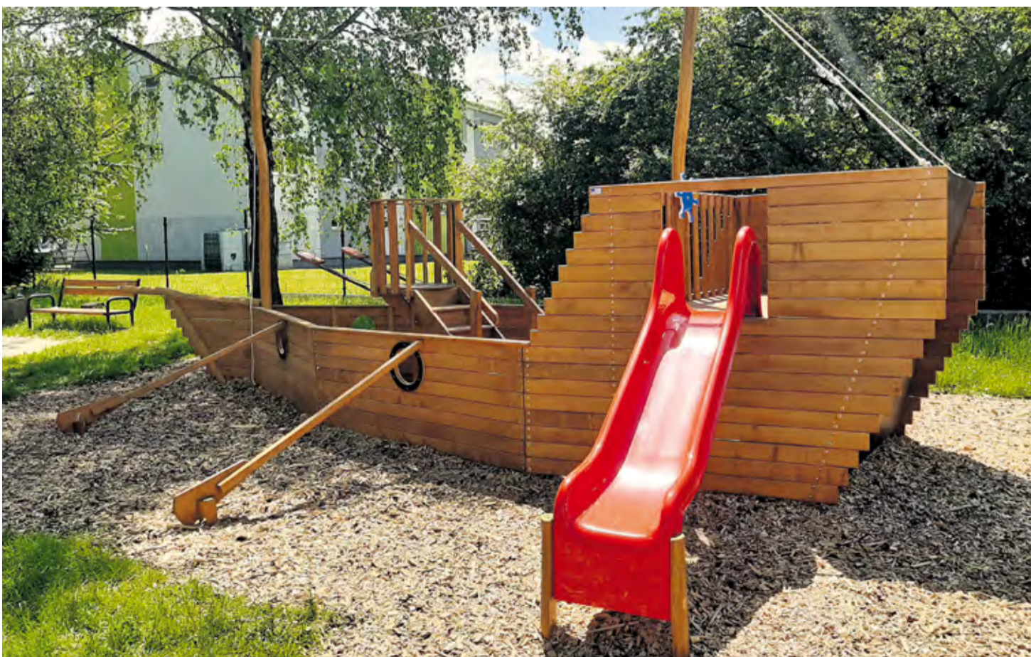
Obnovené ihrisko v areáli MŠ na Ľuborčianskej ulici

Rozšírenie prevádzky Materskej školy na Ľuborčianskej ulici prinieslo mestu 23 nových miest pre našich najmenších. Stavebná akcia okrem rozšírenia celkovej kapacity materskej školy zabezpečila aj bezbariérový prístup a oplotenie časti areálu. Priestory kuchyne boli vybavené novou technikou. Zároveň tiež bola do materskej školy v rámci realizácie projektu dodaná nová výpočtová technika, pribudli edukačné pomôcky, zmodernizované detské ihrisko. Celková cena projektu: 350 549,89 €, z toho NFP: 328 320,98 €. Realizátor stavebných prác: YF Slovakia, s. r. o., v hodnote 317 005,64 €.