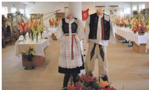
Výstava Klubu Gladiola Martin na prizemí múzea strana č. 4