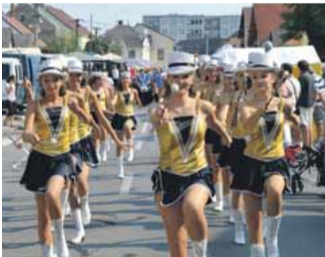
Dubnické mažoretky v uliciach mesta