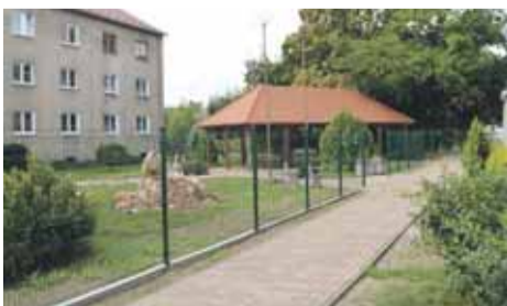
Oplatenie areálu CSS

V mesiaci júl sa urobilo oplatenie areálu Centra sociálnych služieb mesta Nemšová. Práce zrealizovala spoločnosť Domart, s.r.o. Trenčín. Celkové náklady sú vo výške 6 067,08 € s DPH a boli hrazené z vlastných zdrojov mesta.