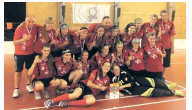
Florbal Prague Games 2015 strana č. 8