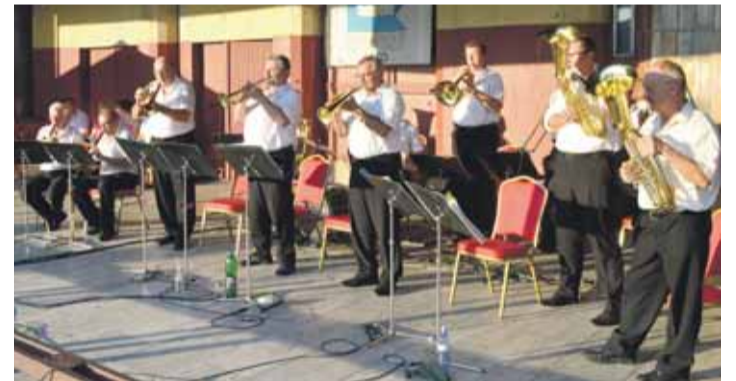
Vystúpenie DH Bodovanka