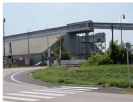
Chodník na cintorín na Moravskej ulici.

Rekonštrukciu prešli aj úseky chodníka na Ulíci SNP, a to v časti popri outdoorovom ihrisku a ďalej úsek od Železničného priecestia, ktorý teraz umožní bezpečnejší prístup na ústredný cintorín na Moravskej ulici.