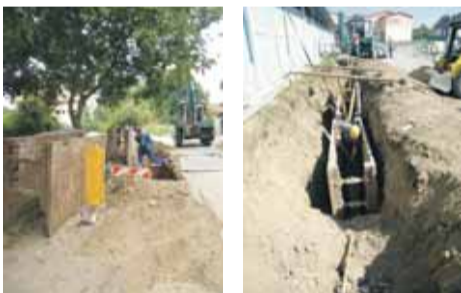
Práce na Sládkovičovej ulici v Nemšovej a na Kukučínovej ulici, mestská časť Luborča

Ani počas horúcich letných dní sa v našom meste nezastavil čulý pracovný ruch. Aj v tomto období sa pokračovalo v prácach na kanalizácii mesta na Kukučínovej a Sládkovičovej ulici, na ktoré nám bola poskytnutá dotácia z Environmentálneho fondu na rok 2015 vo výške 90 000,- € a ktoré mesto spolufinancuje aj z vlastných zdrojov vo výške 5 154,- €.