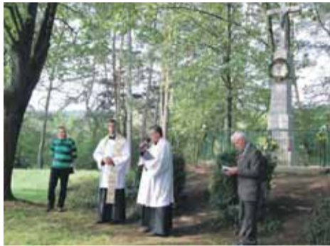
Posvätenie kríža pod Sobotišťom