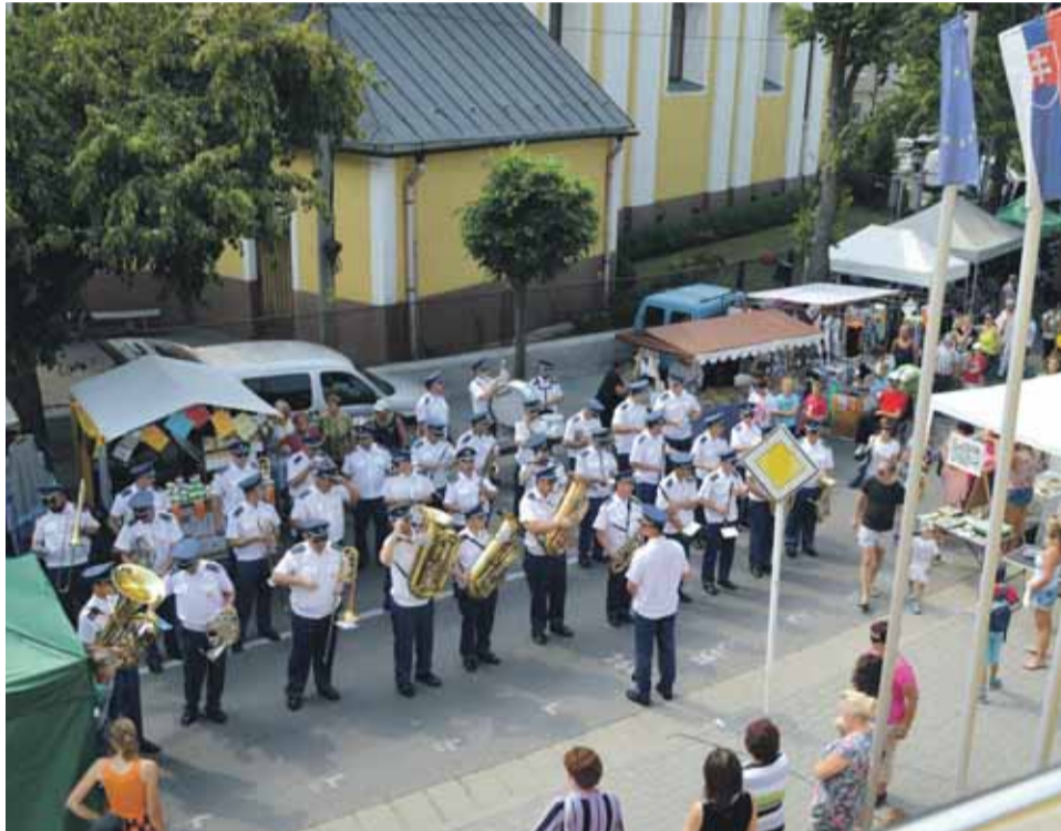
Vystúpenie vojenskej posádkovej hudby z Banskej Bystrice