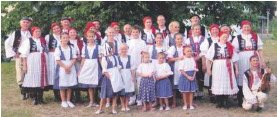
Folklórny súbor Liborčan a Detský folklórny súbor Dvorček