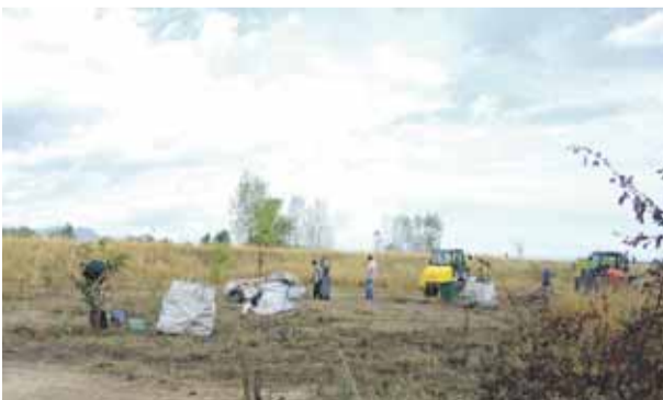
Upratovanie čiernej skládky v Kľúčovom