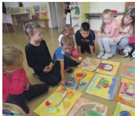
Výtvarné práce na záhradkársku výstavu