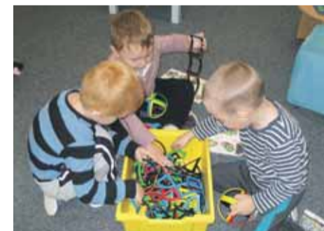
Spoločnou hrou k rozvíjaniu tvorivosti