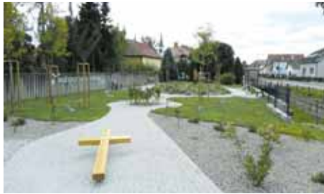
Kríž symbolicky smeruje k soche P. Márie Kráľovnej