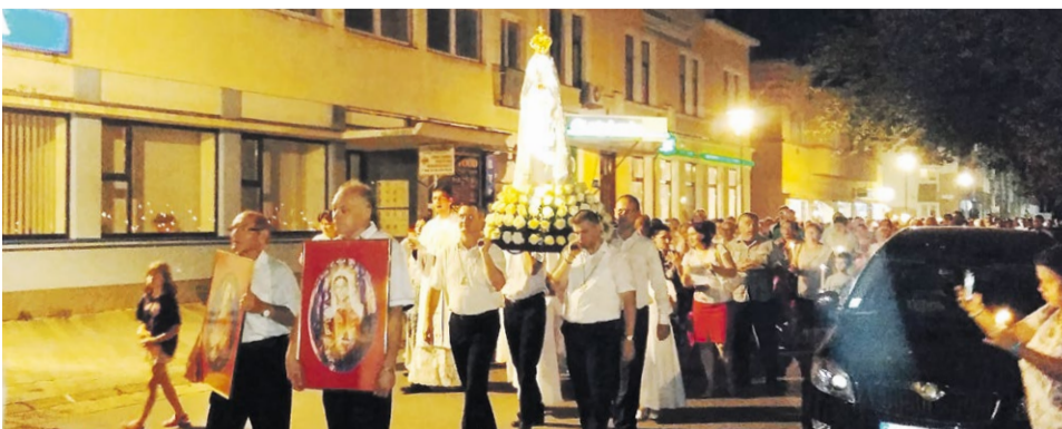
Sviečková procesia ulicami mesta Nové Zámky