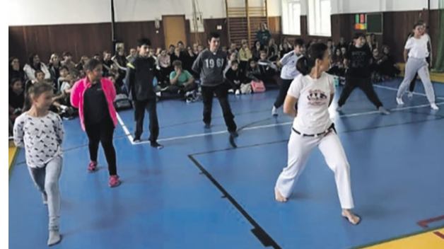
Ukážka brazílskeho bojového umenia Capoeira

Na piatok 20. 09. sme sa všetci veľmi tešili, pretože sme vymenili deň strávený v školských laviciach za deň plný pohybovej aktivity. Žiaci totiž absolvovali Cvičenia v prírode . Podľa jednotlivých ročníkov plnili aktivity dané Štátnym vzdelávacím programom. Všetko prebiehalo najmä hrovou formou. Povedali sme si niečo o turistických značkách, ktoré mohli deti sledovať aj počas presunu terénom, zahráli sme si rôzne hry v prírode, pripomenuli sme si, že prírodu a naše životné prostredie je potrebné chrániť. Prijemným spštením pre žiakov prvého stupňa bol každoročný Beh pre zdravé srdce . Naši najmenší sa naučili, že aj o svoje srdiečko sa musia starať, aj keď len pravidelnou športovou aktivitou, ktorá napomáha k jeho zdravému a bezproblémovému fungovaniu.