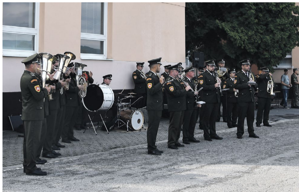
Vojenská hudba z Bratislavy potešila uši návštevníkov