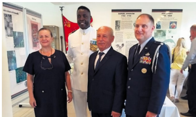
Predstavitelia mesta s hosťami pietnej akcie v Mestskom múzeu