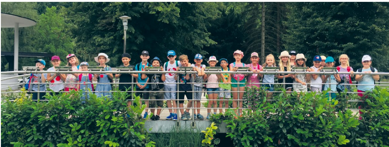
Deti počas denného tábora navštívili aj kúpeľné mesto Trenčianske Teplice.