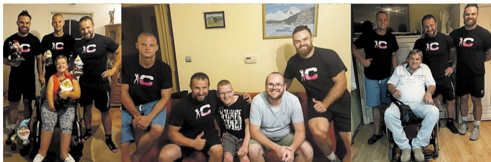
Najťažší pretek na Považí Champion Race má aj charitatívny význam.