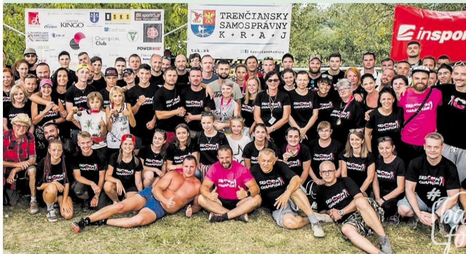
Champion Race sa mohol uskutočniť vďaka odhodlaným dobrovoľníkom

Partneri: Trenčiansky samosprávny kraj, Gazdovstvo Uhliská, Slovokolex & Cube Bikes, inSPORT-line, PATKA, s.r.o, Paintball klub Dolná Súča, Spoločnosť Kováč, OBIM s.r.o, ATV Rescue System, Dobrovoľný hasičský zbor Pruské, DHZ Bohunice, Sport Timing Slovakia s.r.o, Aone Nutrition Slovakia, Comextrans, BWSS, Auto-centrum, autorizovaný servis a predaj značky ŠKODA, Baka foto, MAS Vršatec, DHZ Ilava, DURCI design.