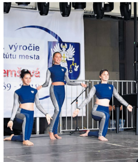
TS Elis predviedli svoju choreografiu