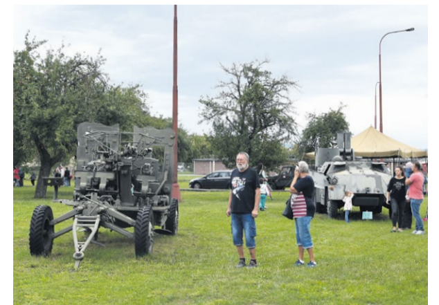
Areál vojenskej základne v Nemšovej s expozíciou vojenskej techniky

Nemšovský jarmok nemôže byť bez Dňa otvorených dverí vo vojenskom útvere v Nemšovej a opačne to tiež nejde. Tradične sa začal už 16. ročník DOD vo vojenskej základni v Nemšovej výstrelom z kanóna tanku.