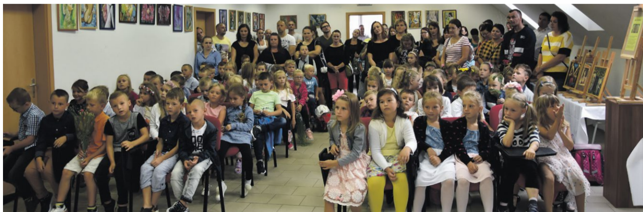
Slávnostné otvorenie školského roka pre prváčikov sa konalo v priestoroch Mestského múzea