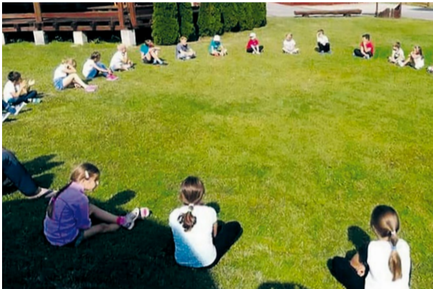
Žiaci zažili týždeň oddychu a radosti v rekreačnom zariadení v Podkylave

Život v Katolíckej spojenej škole v Nemšovej neustal ani po ukončení školského roka. Hneď na začiatku prázdnin sa pedagógovia zúčastnili duchovných cvičení, ktoré sa konali v malebnom prostredí Čičmian. Ďalší týždeň patril našim školákovi, ktorí absolvovali týždenný prímestský tábor a určite nezabudnú na množstvo túlavých dobrodružstiev. Nasledujúci týždeň mali žiaci možnosť zažiť čas oddychu a radosti v pobytovom tábore Farmárik, v rekreačnom zariadení v Podkylave, kde si okrem turistiky, športu a zábavy mohli vyskúšať varenie lekváru, výrobu ovocného muštu, či starostlivosť o domáce a hospodárske zvieratá.