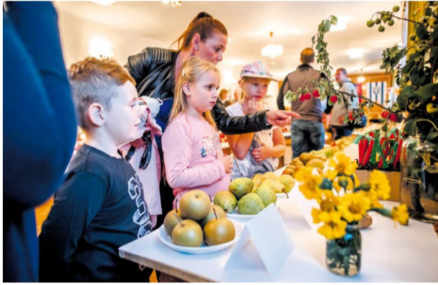
Výstava každoročne priláka malých i veľkých

Jeseň je najlepší čas na prechádzky, relax, pohodu. Keď začne zo stromov padať prvé ohnivé lístie a vetvičky kríkov pospájajú pavučinkové nite babieho leta, nadíde čas aj na pochvalu všetkým usilovným záhradkárom, pestovateľom, ovocinárom na ukážku ich celoročného snaženia.