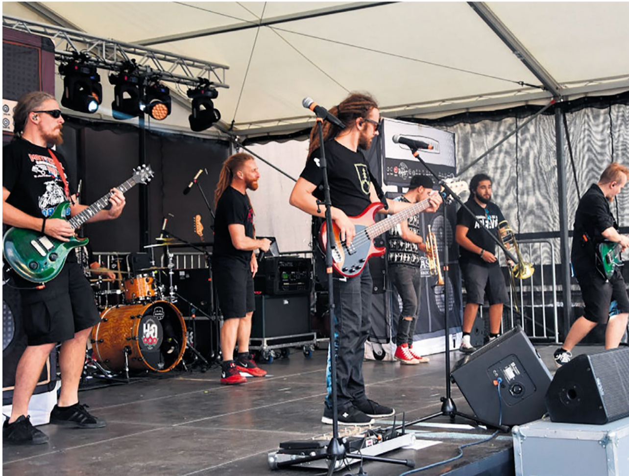
Svoje netradičné a veselé piesne zaspievala počas Nemšovského jarmoku skupina Helenine oči

Priaznivci folklóru, ľudovej či modernej hudby, dobrého jedla a fanúšikovia všetkého, čo súvisí s pravým jarmokom sa stretli na 24. ročníku Nemšovského jarmoku.