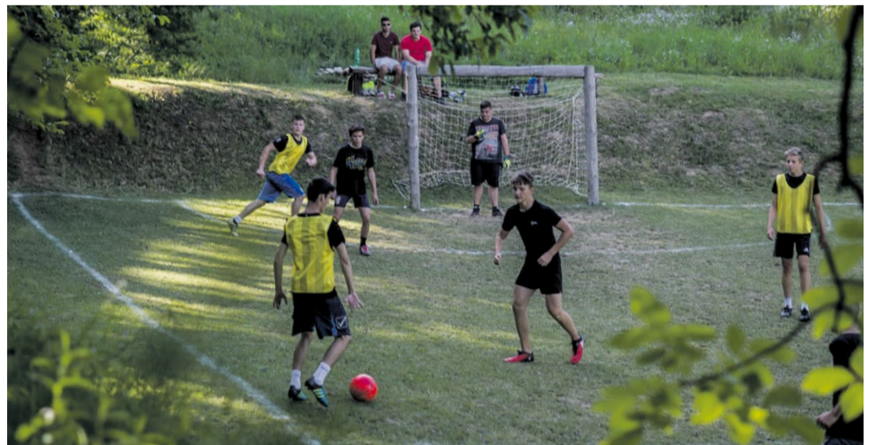
Tradičný mládežnícky turnaj má za sebou už siedmy ročník

1. Napajedla (61:9) 12b | 2. Whoopie (17:26) 4b | 3. Predators (18:61) 2b