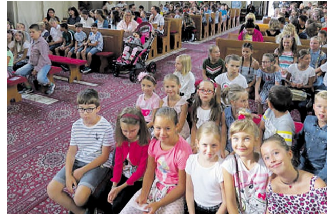
Začiatok školského roka našej školy

CVC ako súčasť Katolíckej spojenej školy je výchovno-vzdelávacím mimoškolským zariadením, kde môžu žiaci aktívne tráviť svoj voľný čas. Aj v tomto školskom roku 2019/2020 sme pre žiakov pripravili pestrú ponu-