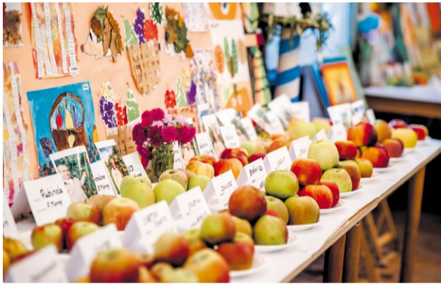
Výstavu tvorili najmä bohaté odrody jablák