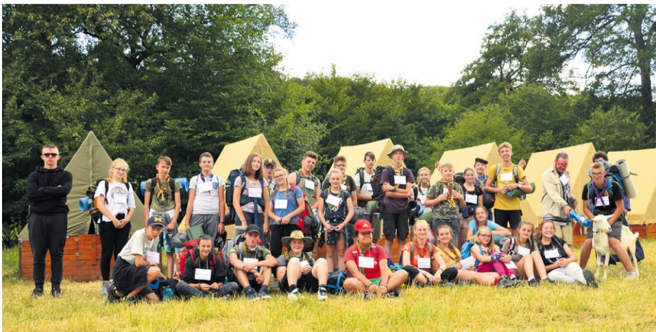
Spoločná foto rangerov a rangeriek pred začiatkom tradičnej bojovky

Program rangerov a roverov bol tento rok voľnejší a bol viac zameraný na ich osobný rast. K programu samozrejme patrili rôzne netradičné hry, skautská prax v podobe zakladania ohňa, varenia v prírode a ďalšie. Popri tom riešili vlastné projekty, ktorých súčasťou bola napríklad úloha postaviť táborové fitness ale aj vybudovať ohradu pre kozu Etelu. Pred koncom tábora čakala prítomných táborníkov aj tradičná bojovka – akčná hra v teréne.