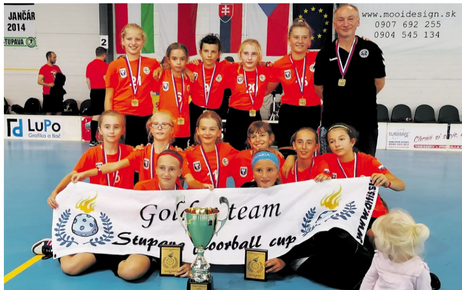
Dievčatá získali zlato na Stupava Cupe