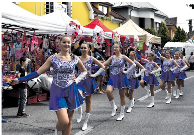
Mažoretky z Novej Dubnice spestrili bohatý program jarmoku