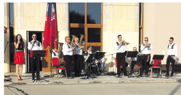
Dychová hudba Nemšovanka