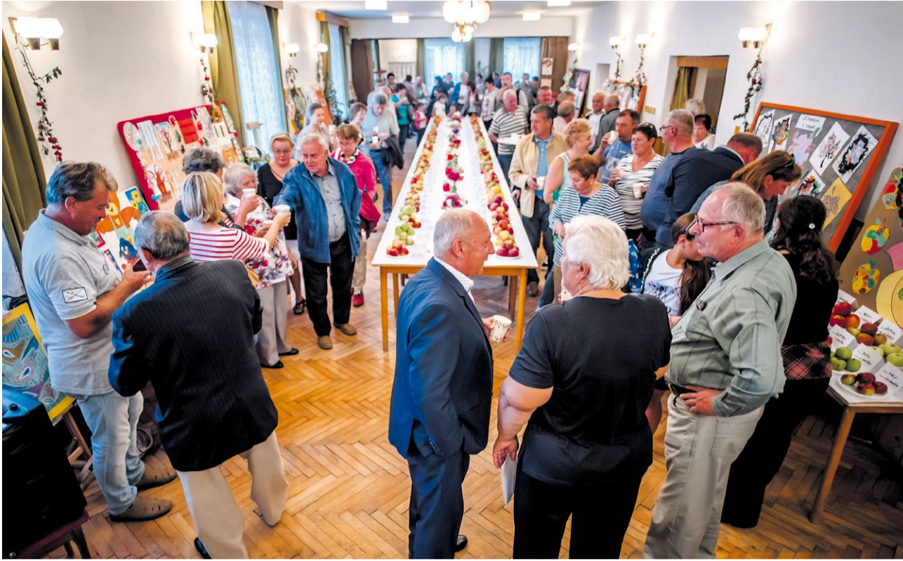
Otvorenie výstavy si prišlo pozrieť veľké množstvo návštevníkov