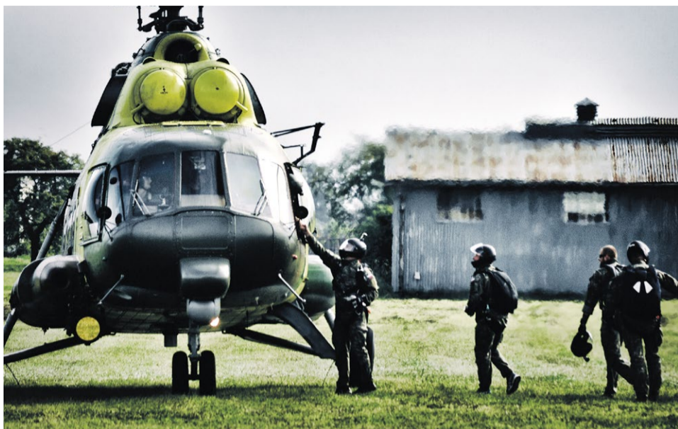
Vrtuľník Mi 17 SAR v akcii

Nemšovský jarmok nemôže byť bez Dňa otvorených dverí vo vojenskom útvere v Nemšovej a opačne to tiež nejde. Tradične sa začal už 16. ročník DOD vo vojenskej základni v Nemšovej výstrelom z kanóna tanku.