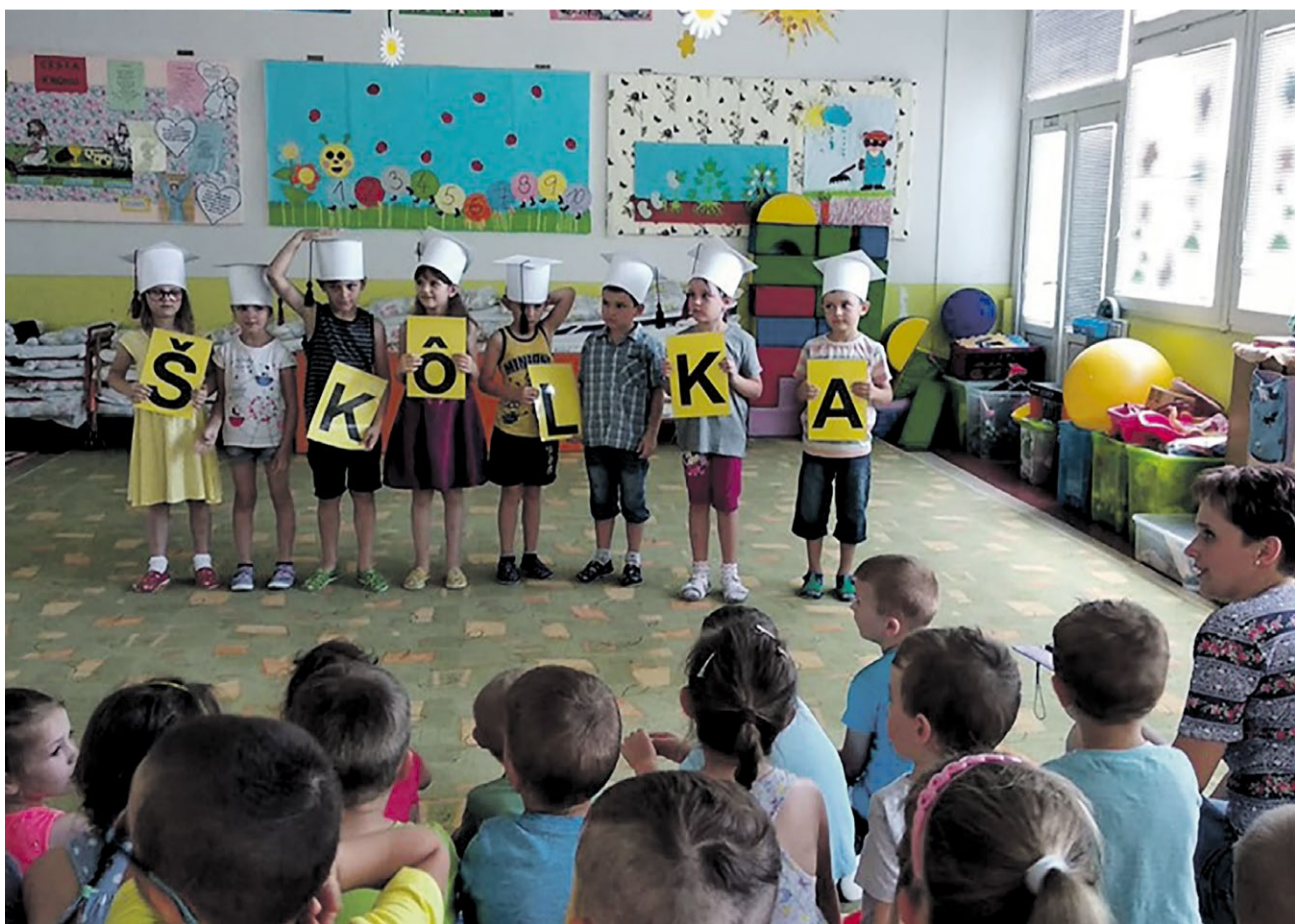
Z aktivít Materskej školy sv. Gabriela