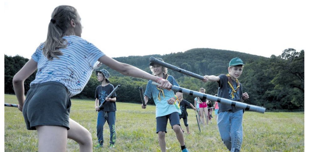
Rytiersku výzbroj z penového materiálu využili deti pri rôznych hrách