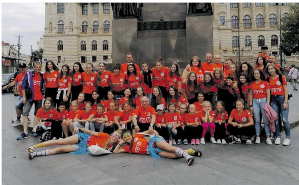
Florbalová výprava na najväčšom mládežníckom turnaji sveta - Prague Games