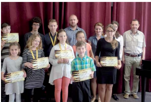
Účastníci súťaže Mozartova klávesa