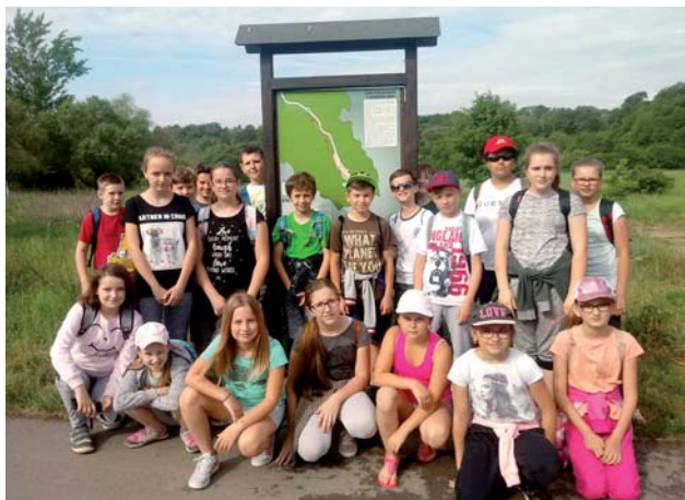
Z účelového cvičenia OZO – piatci