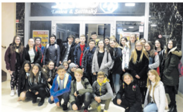
Ôsmaci na predstavení Tajný denník Adriana Mola

Tento školský rok sme stavili na čo najväčšie kultúrne obohatenie našich detí. Vďaka bezplatnej vlakovej doprave sme minimalizovali finančné náklady, a tak sa niektorým triedam podarilo uliať sa zo školy hneď viackrát. Štafetu troch bratislavských divadelných predstavení odštartovali ôsmaci. Tí sa vybrali koncom októbra do Štúdia L + S, v ktorom si pozreli predstavenie Tajný denník Adriana Mola . Bolo o obyčajnom chlapcovi, ktorý na prahu puberty zisťuje, že má niekoľko problémov. Preto si každodenné trápenie aj radosti zaznamenáva do prísne tajného denníka.