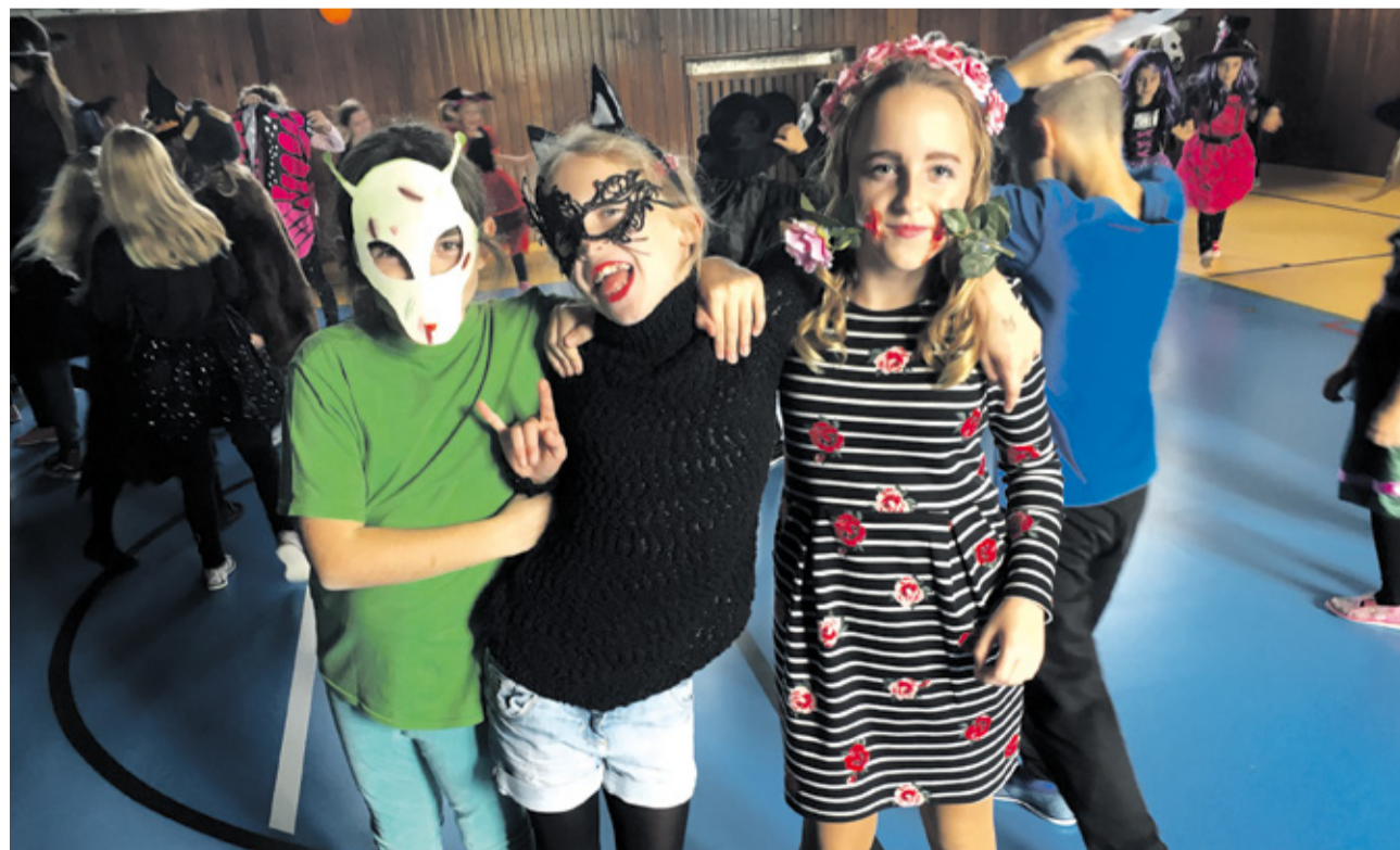
Strašidelné masky žiakov na diskotéke Strašibál

Krásne Vianoce plné zdravia a šťastia v kruhu svojich blízkych Vám želajú žiaci, učiteľia a ostatní zamestnanci zo Základnej školy, Janka Palu 2.