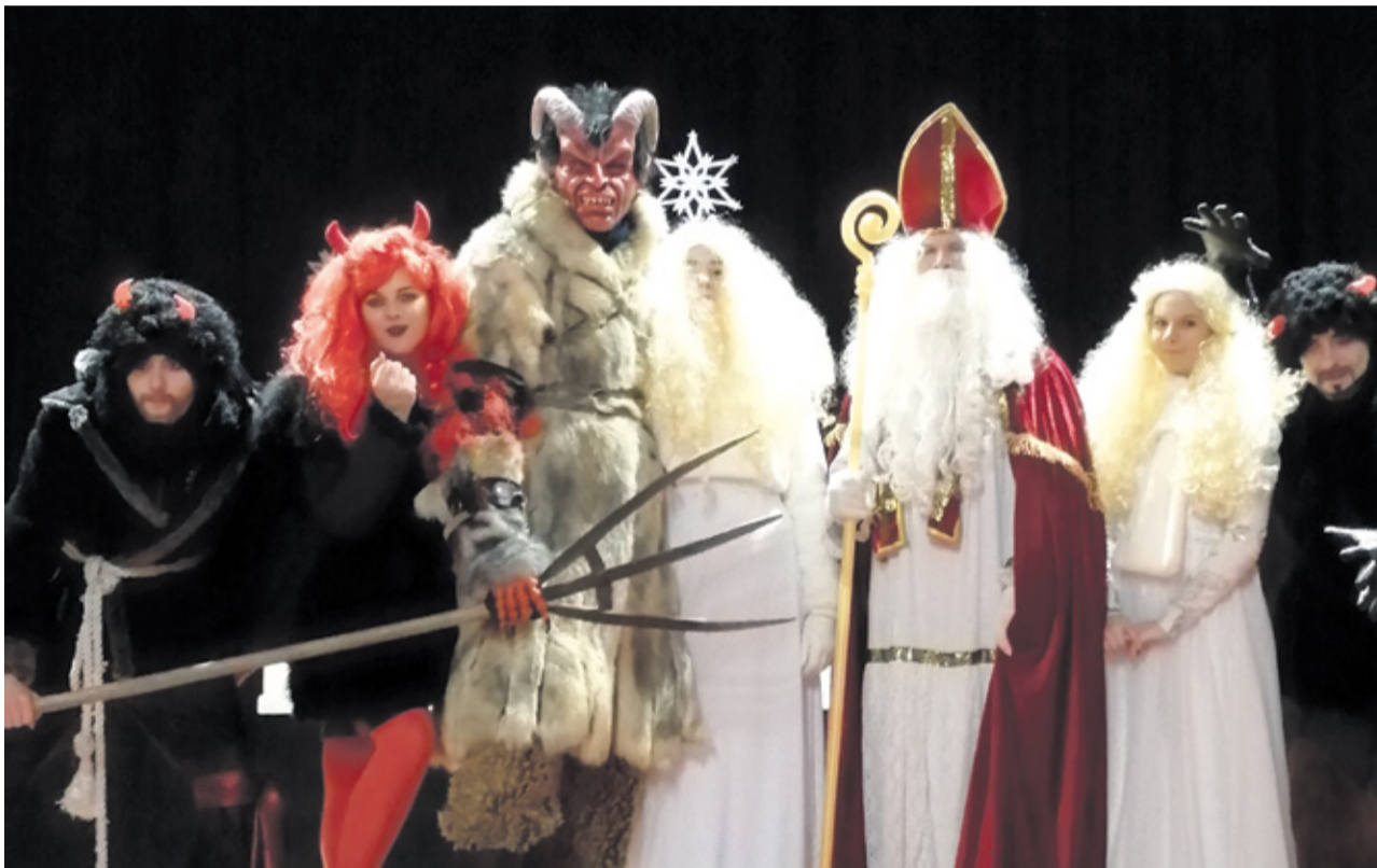
Čert bol sice hrozivý, ale príchod Mikuláša všetkých potešil

Rozsvietenie stromčeka, Mikuláš v sprievode anjela a čerta, darčeky a vianočná atmosféra neobišla naše mesto ani tento rok.