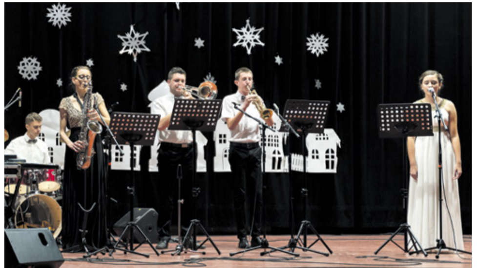
Komorná hra ZUŠ Nemšová na Adventnom koncerte 8. 12. 2019