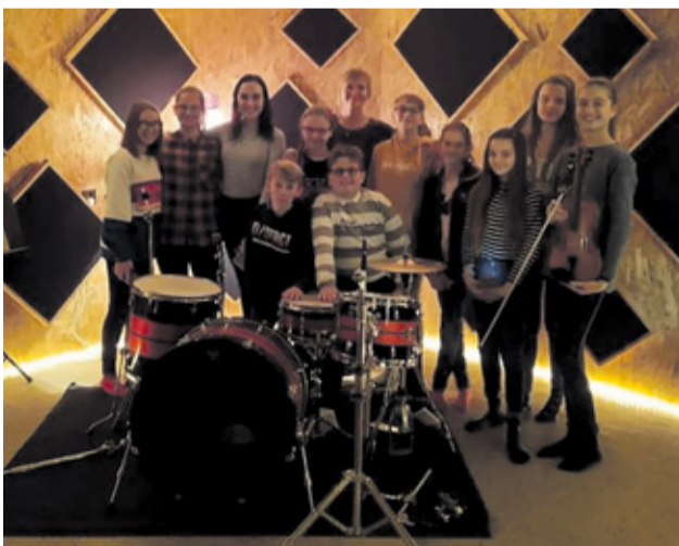
V nahrávacom štúdiu pri nahrávaní vianočných pesničiek

Katolícka spojená škola Nemšová v tomto školskom roku aktívne realizuje projektové aktivity v rámci projektu Renovabis, Centrum otvorenej komunikácie. Vyučujúci absolvovali interaktívny kurz efektívnej a nenásilnej komunikácie. Realizujeme aj kurz proaktívneho správania, ktorý je spojený aj s rediagnostikou rozvojových potrieb školy. Od januára 2020 začína kurz efektívneho rodičovstva. V rámci aktivít Fóra proaktívnych škôl sa v novembri konalo stretnutie a prezentácia vyučovania v Spojenej škole Poprad Letná s názvom „Vstúpte bez klopania“. Tu mali učiteľia našej MŠ a ZŠ možnosť načerpať zo skúsenosti a tvorivých nápadov a realizácií zámeru Škola pre každého – škola na každý deň. Mali možnosť zažiť efektívnu prácu žiakov s textom v rámci viacerých predmetov a tiež premyslenú a napaditú prácu v technickej materskej škole. Škola sa tiež začala aktívne zapájať do aktivít v rámci projektu „Deti nepočkajú“. V rámci podpory tohoto projektu boli žiaci našej školy nahrávať vianočné piesne v profesionálnom hudobnom štúdiu v Žiline, ktoré budú uvedené v rozhlasovom vysielaní počas vianočného obdobia. Ďakujeme zúčastneným deťom a učiteľom za prípravu a úžasný výkon a tiež p. Galkovi za materiálnu a finančnú podporu a pomoc. Partnerom našej školy pri tejto akcii bola Spojená škola Kráľovnej pokoja v Žiline.