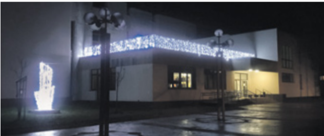
Svetelná fontána a reťaz na budove Kultúrneho centra v hodnote 2790 €