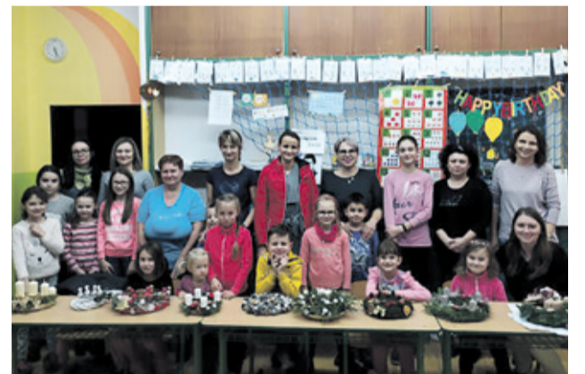
Výroba adventných vencov

V nedeľu 1.decembra začalo adventné obdobie. V 1.A triede si žiaci spolu s rodičmi vyrobili adventné vence, ktoré sa stali inšpiráciou pre nás, všetkých.