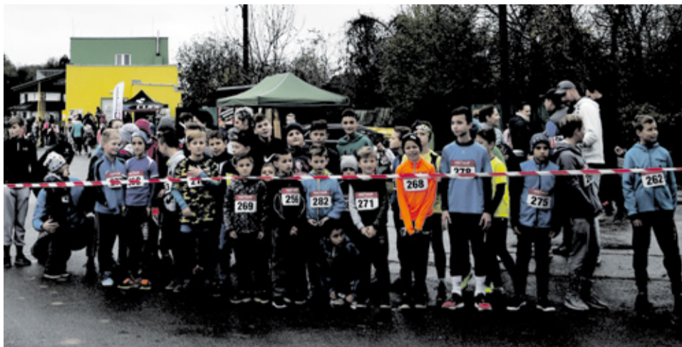
Ani upršané jesenné počasie neodradilo bežcov, aby sa postavili na štart.

DRUHÚ NOVEMBROVÚ SOBOTU SME PRIPRAVILI UŽ 51. ROČNÍK BEHU OKOLO ĽUBORČE.