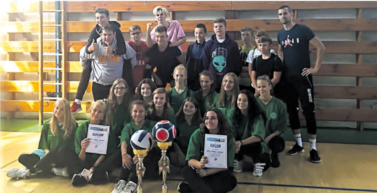
Dvojnásobní víťazi Michalského turnaja

ŽIACI I VYUČUJÚCI KATOLÍCKEJ SPOJENEJ ŠKOLY VSTÚPILI DO ADVENTNÉHO OBDOBIA, KTORÉ JE PRÍPRAVOU NA NARODENIE JEŽIŠA. ZASTAVME SA PRI PREDADVETNÝCH I ADVENTNÝCH AKTIVITÁCH, KTORÉ BOLI SÚČASŤOU ŠKOLY A ZAVRŠENÍM ÚSPEŠNÉHO ŠKOLSKÉHO ŽIVOTA V TOMTO KALENDÁRNOM ROKU.