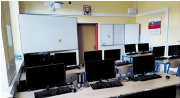
Vynovené učebne výpočtovej techniky