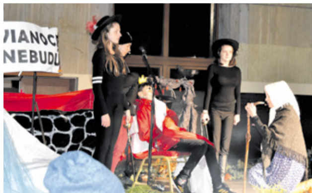
Vystúpenie „Vianoce nebudú“