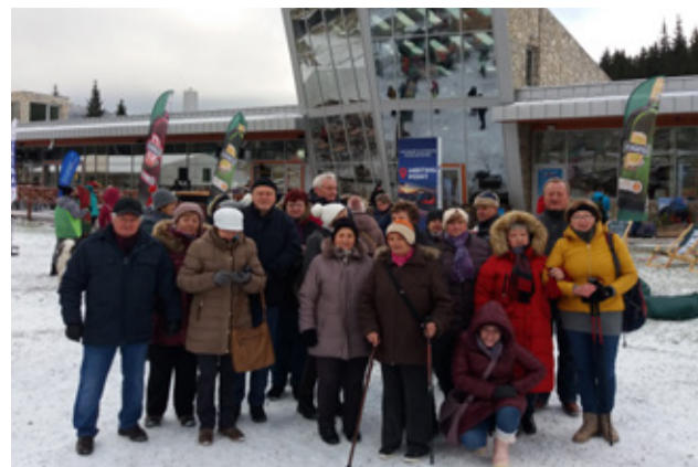
Po návšteve múzea v Liptovskom Mikuláši