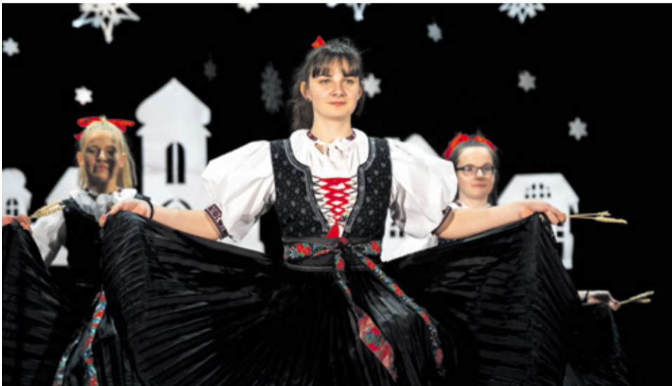
Choreografia Kázala mi mati