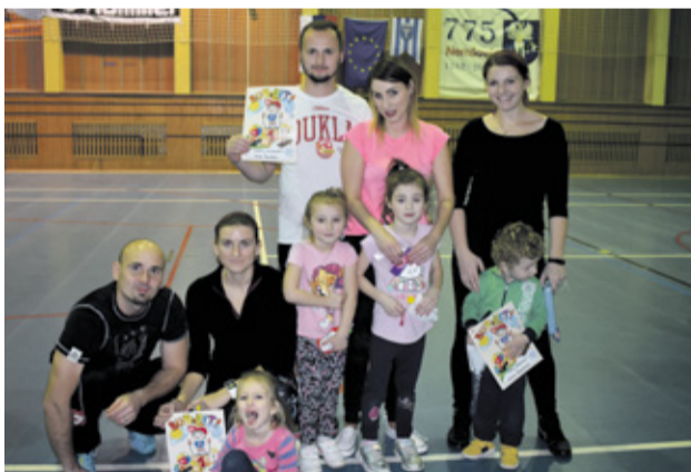
Cvičenie rodičov s deťmi

... je názov projektu Materskej školy, Odbojárův v Nemšovej, ktorý bol podporený nadáciou Dobré srdce spoločnosťou Tatrabanka. V rámci projektu, ktorého cieľom bolo zapojiť do pohybovej aktivity nielen deti, ale aj dospelých, materská škola zorganizovala pravidelné pohybové aktivity, no výnimočnými boli „Branný deň“ a „Cvičenie rodičov s deťmi“, ktoré sa konali v novembri 2019. Oboch aktivít sa zúčastnila veľká skupina cvičencov, preto sa v spolupráci s mestom Nemšová konali tieto aktivity