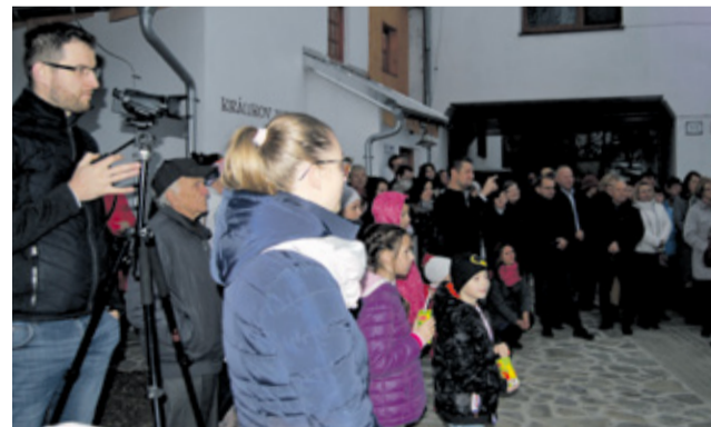
Prehliadka mlyna prilákala širokú verejnosť

Dňa 27. novembra naplnil Mlynskú ulicu v Nemšovej neobvyklý ruch. Ulička, svojím tvarom kopírujúca niekdajší mlynský náhon, sa zaplnila zvedavcami. Po 60 rokoch núteného pokoja tu otvoril svoje „brány“ mlyn, ktorý stojí na svojom mieste minimálne 250 rokov. Svedčia o tom staré mapy a zachovalé listiny, ktoré sú v ňom vystavené. O 15. hodine sa začala prvá verejná prehliadka mlyna s požehnaním a slávnostným programom.