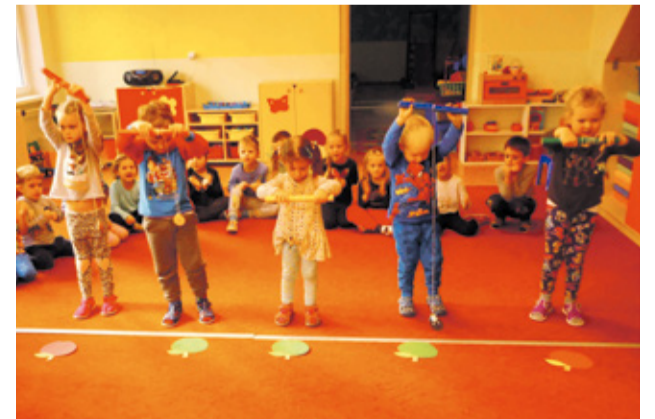
Hravo a zdravo s jablkom

tivita „Hravo a zdravo s jablkom“ venovaná deťom bola plná pohybových a zábavných aktivít. Deti s nadšením súťažili v rôznych netradičných disciplínach. Následne bolo vyhlásené Naj jablko, ktoré si deti vopred priniesli a v priebehu týždňa najkrajším jabĺčkam odovzdávali svoje hlasy. Aktivita sa ukončila jablkovou hostinou, ktorú pripravili deti so svojimi učiteľkami. V jedno októbrevé popoludnie si deti pozvali do priestorův školy svojich rodičov a starých rodičov na tvorivú dielňu pod názvom „Deň zdravej výživy“. Na úvod súťažili vo dvojiciach, ochutnávali zeleninové šaláty pripravené deťmi a následne tvorili zo zeleniny a prírodného materiálu jesenné dekorácie, ktoré sa stali súčasťou výzdoby budovy školy.