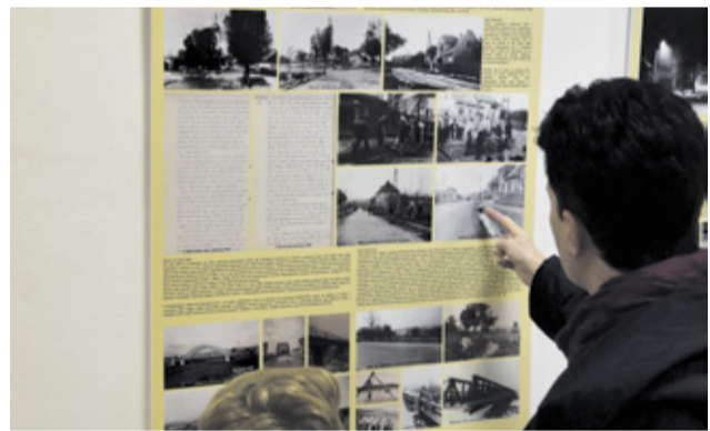
Návštevníci mohli vidieť históriu mesta na 12 informačných paneloch