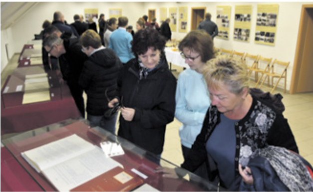
Výstava prebiehala v priestoroch Mestského múzea Nemšová