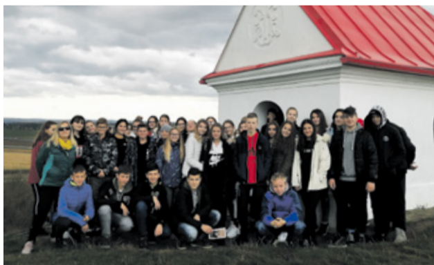
Žiaci na exkurzii v Slavkove bližšie spoznali život Napoleona

Ešte v októbri sa ôsmaci a deviataci dostali na miesto, ktoré sa v roku 1805 zapísalo do dejín ako miesto najväčšieho triumfu Napoleona Bonaparteho – do Slavkova . Vďaka milej sprievodkyni si žiaci prezreli historické sály zámku Slavkov, odkiaľ sa presunuli na tri najdôležitejšie miesta bojiska. Najskôr si vyšliapali na návršie Santon , kde bolo sústredené delostrelectvo francúzskej armády, potom prišli k Žuránu , odkiaľ Napoleon velil svojim jednotkám,