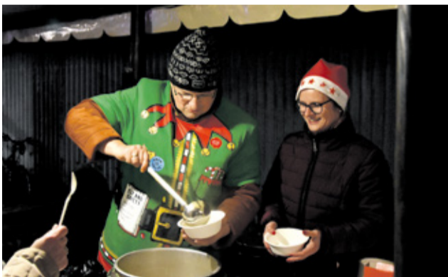
Prítomní si pochutnali na kapustnici od primátora mesta