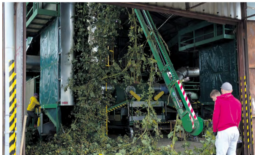
Vkladanie rév chmeľu do česacej linky