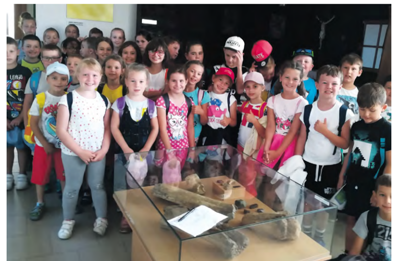
Na exkurzii z letnej školy