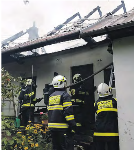
Požiar rodinného domu v Trenčianskej Závade

Dňa 27. 08. 2020 sme v čase 16:38 prijali z KOS správu o požiari RD v Trenčianskej Závade. Veliteľ prostredníctvom zvolávacieho systému vyhlásil poplach členom DHZO a v čase 16:52 na miesto udalosti vyrazila CAS25 RTHP s posádkou 1+9. Po príchode na miesto už zasahovali jednotky z DCA a Trenčína s 3 kusmi techniky. Následne, po zahlásení sa veliteľovi zásahu jednotka vzhľadom na silné zadymenie, vykonávala podľa pokynov asistenciu pri hasiacich a asanačných prácach. Na miesto dorazila aj jednotka z Trenčianskej Teplej s dvoma kusmi techniky. Zhorenisko bolo odovzdané na monitoring v čase 19:00, kedy na mieste ostala časť zasahujúcich hasičov, druhé družstvo ich na mieste vystrieda-