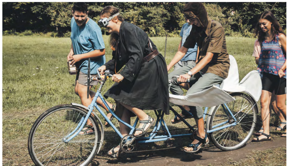
Na letnom tábore sa cestovalo v čase so špeciálnym lietajúcim strojom