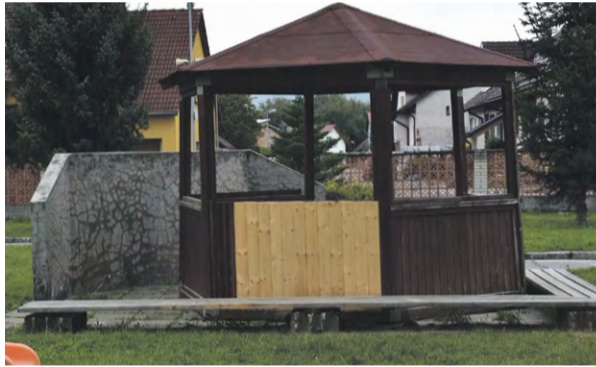
Záhradný altánok na Ulici Kropáčoho v Nemšovej