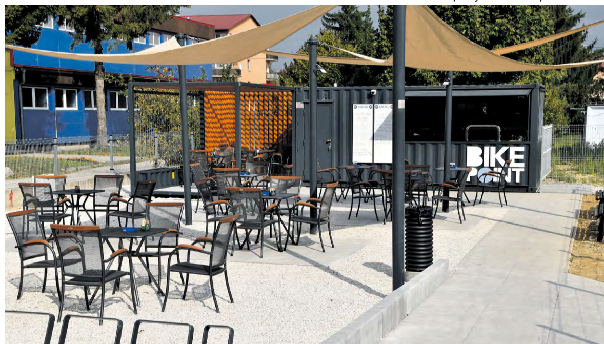
Terasa novootvoreného Bike pointu