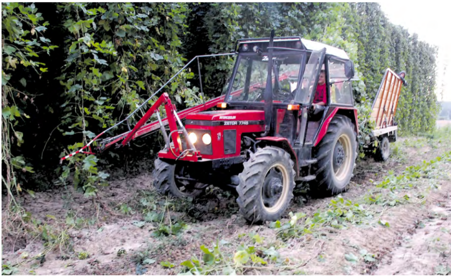
Zber chmeľu v nemšovskej chmeľnici

„Posledná chmeľnica na Slovensku“ titul, ktorý získala chmeľnica v Nemšovej potom, keď zanikli chmeľnice v Soblahove, Trenčianskej Turnej a Čachticiach. Kým v roku 1993 bola výmera chmeľnic asi 1 300 hektárov a jeho pestovaniu sa venovalo 34 pestovateľov, v roku 2020 zostal posledný.