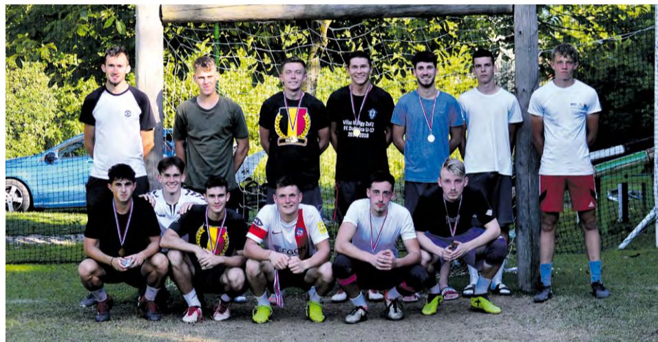
Hráči bojovali o víťazstvo v kategóriách U13, U17 a U21

Už po ôsmokrát sa na ihrisku Nad Cigãňom v Nemšovej – Ľuborči uskutočnila letná mládežnícka futbalová miniliga pod názvom Junior Cigãň Cup. Do turnaja sa v roku 2020 zapojilo rekordných desať tímov, ktoré bojovali v troch vekovo ohraničených kategóriách (U13, U17 a U21) počas šiestich hracích dní v rozmedzí 20. a 30. júla.