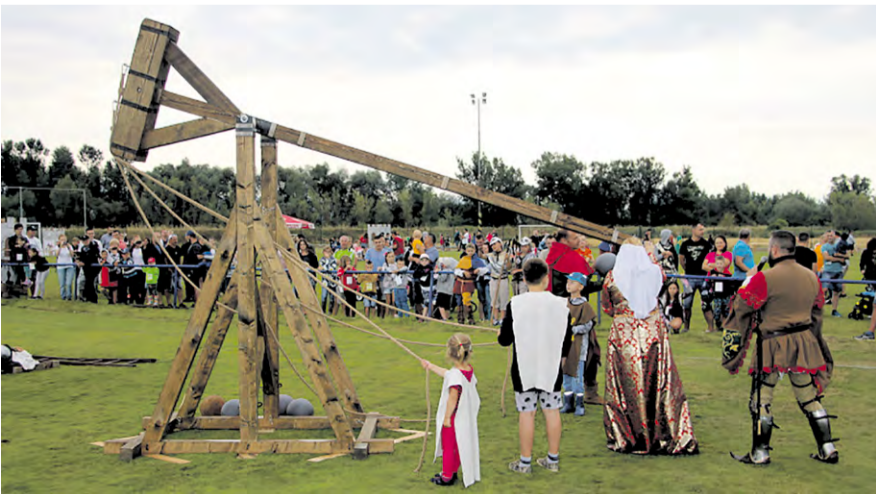
Ukážka dobového katapultu