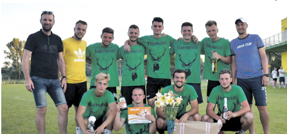
Vitazi 9. ročníka futbalového turnaja Niva Cup