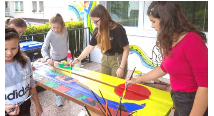
Výtvarníci ZUŠ Nemšová

dzu po kladine a prebojovať sa cez hradnú stráž, vytiahnuť sa po vrkoci k princeznej vo veži, uloviť pre rytierov ryby priamo z „rybárskeho člna“, skákať po dračích stopách a „nakrížiť“, draha, prejsť strašidelným labyrintom a zachrániť princeznú, napojiť smädného koňa z naozajstnej studne, jazdou na netradičnom koni navliecť na meč venčeky, zahrať si zväčšenú logickú hru Camelot a mnoho ďalšieho.