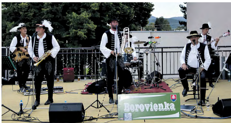
Do Nemšovej zavítala aj dychová hudba Borovienka