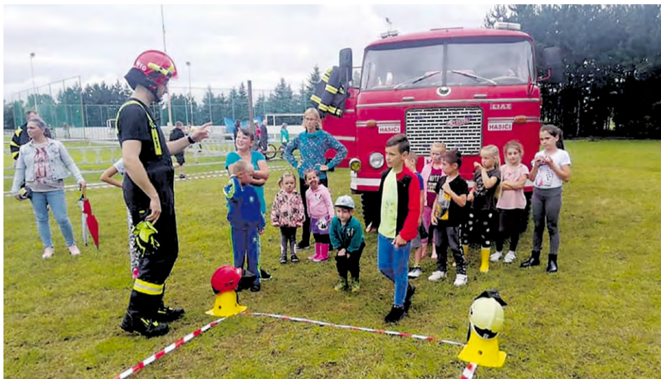
Hasičská prekážková dráha

Dňa 24. 08. 2020 sme boli v čase 9:41 správcom letného kúpaliska požiadaní o výjazd na technický zásah, kedy došlo k poruche na potrubnom systéme vyrov-