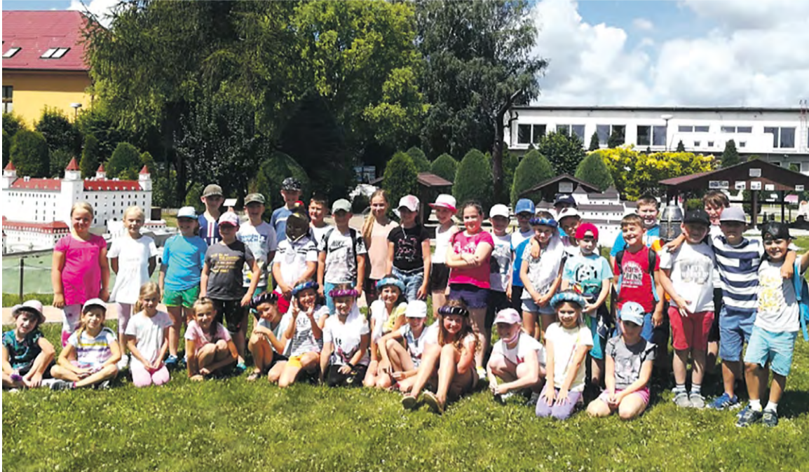
Žiaski sa zúčastnili počas leta denného tábora

Pri príprave školského roka 2020/2021 sme venovali zvýšenú pozornosť odporúčaniam, rozhodnutiam a usmerneniam v čase mimoriadnej situácie z dôvodu výskytu ochorenia COVID-19. Ministerstvo školstva, vedy, výskumu a športu SR (MŠVVaŠ SR) pripravilo špeciálne opatrenia pri výskyte nákazy, tzv. semafor.