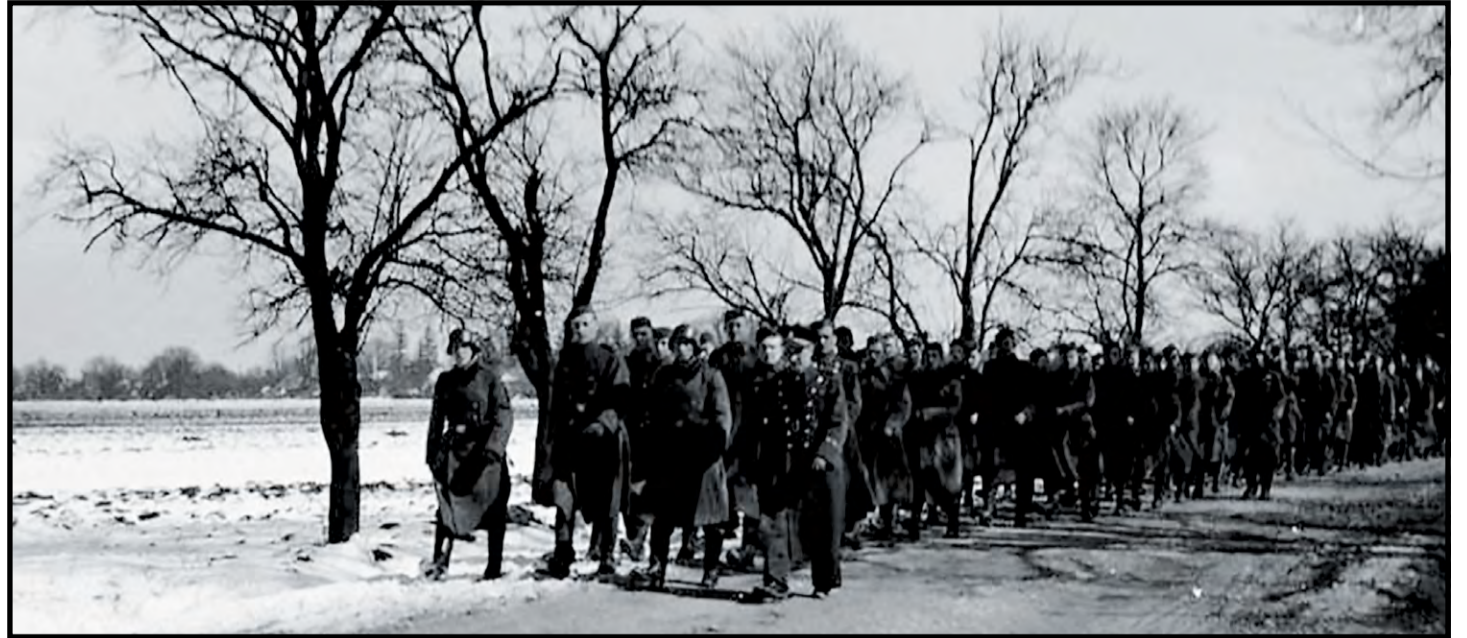
Nemeckí vojaci - marec 1939