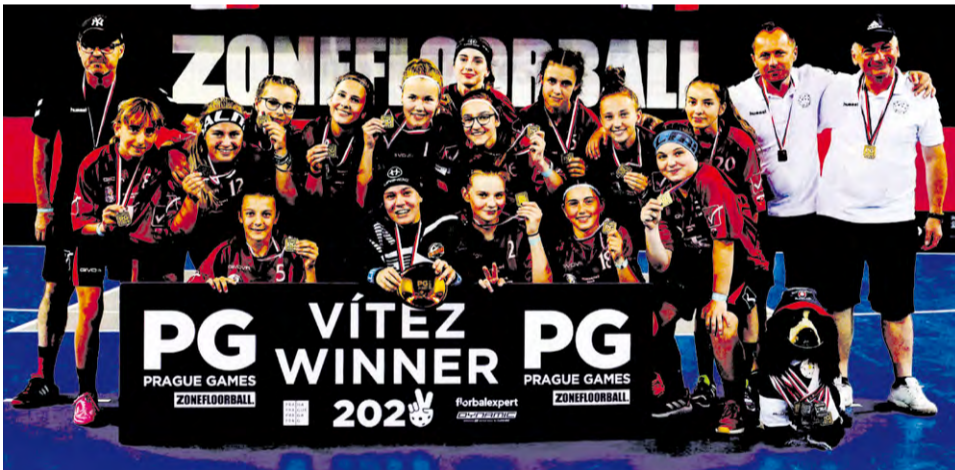
Úspešný turnaj našich florbalistiek v Prahe