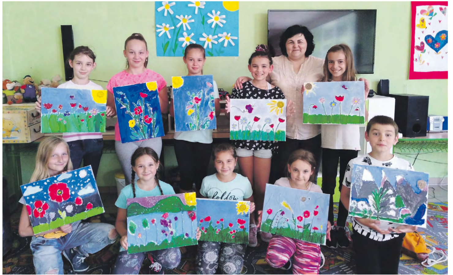
Žiaci si počas výtvarného tábora vyskúšali aj techniku maľby