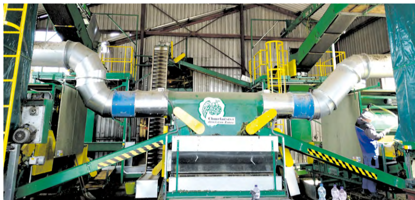
Moderná česacia linka s dvomi česacími stenami