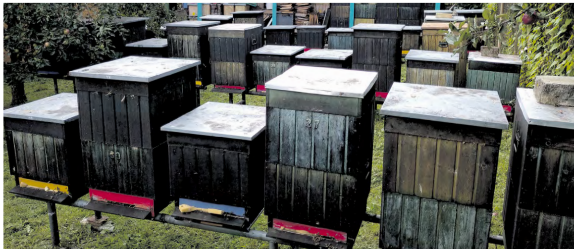
Včelnica pána Chuda z Luborče