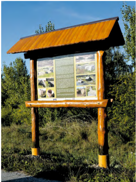
Informačná tabuľa - Z histórie 2. svetovej vojny

Počas 2. svetovej vojny v rokoch 1939- 1945 na vybraných úsekoch v Čechách aj na Morave, v Sliezku, na Slovensku a na južnej hranici Podkarpatskej Rusi boli budované tisíce objektov československého ťažkého aj ľahkého opevnenia.