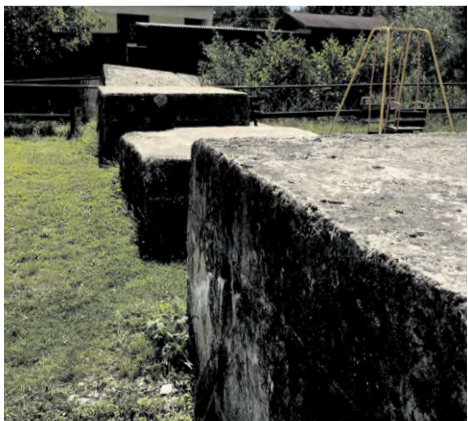
Betónové „penky“ v Luborči