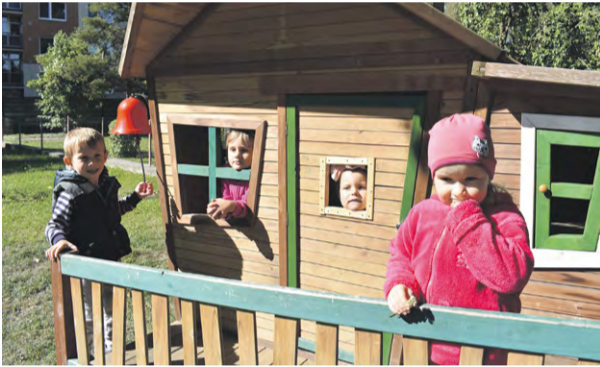
Záhradný domček materskej školy na Ulici Odbojár v Nemšovej