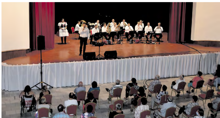
Koncert kapely Stříbrňanka z Južnej Moravy