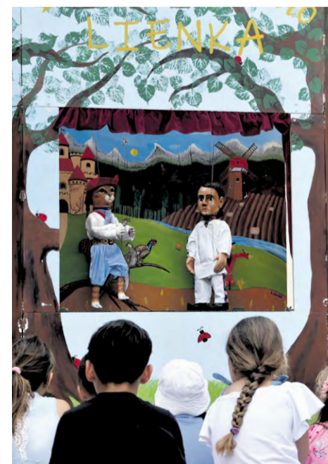
Z detského predstavenia Kocúr v čižmách