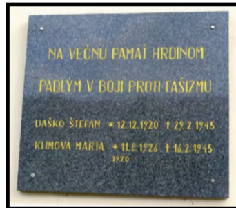
Pamätná tabuľa partizánov