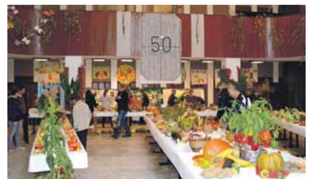
Výstavu ovocia, zeleniny a kvetov navštívilo približne 1680 návštevníkov