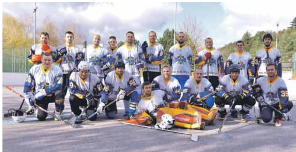
Hráči Heroes Nemšová - sezóna 2016-2017 v Trenčianskej hokejbalovej lige