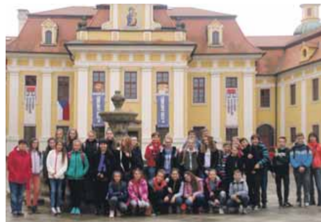
Náštva pútnického miesta Velehrad

Byva zvykom, že tretiaci navštevujú plavecký výcvik . Inak tomu nebolo ani tento rok. Tretiaci sa hravou formou zoznámili s vodným prostredím, skúšali rôzne spôsoby dýchania, ponárali sa, osvojovali si splyvavú polohu. Posledný deň výcviku všetkým ukázali, že voda pre nich nie je strašiacom, ale užívajú si ju plnými dúškami.