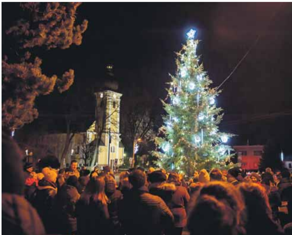
Rozsvietenie vianočného stromu