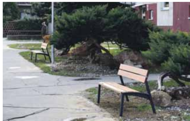
Ondrejčíková, projektový manažér

Pri bytovom dome na Ulici Janka Palu boli osadené dve lavičky a taktiež 2 stĺpy verejného osvetlenia.