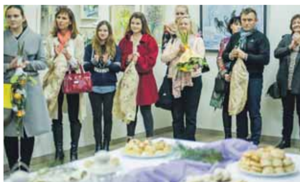
Prítomní hostia na vernisáži Symfónia farieb