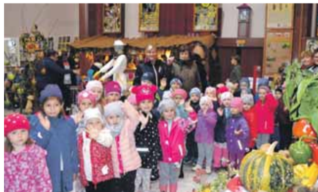
Deti z materskej školy obdivovali výstavu