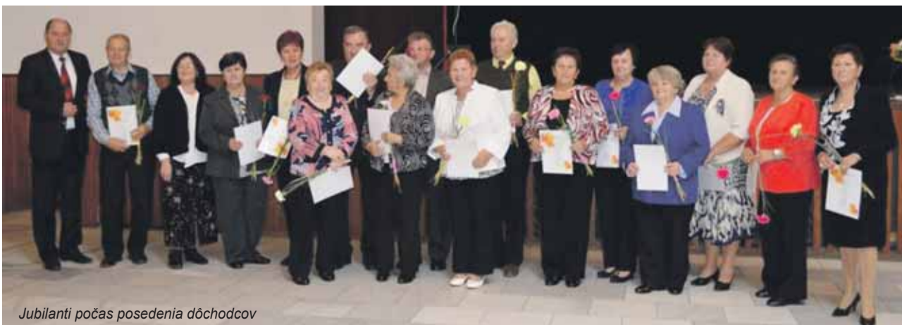
Jubilanti počas posedenia dôchodcov