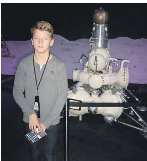
Cosmos Discovery - z výstavy o kozmonautike