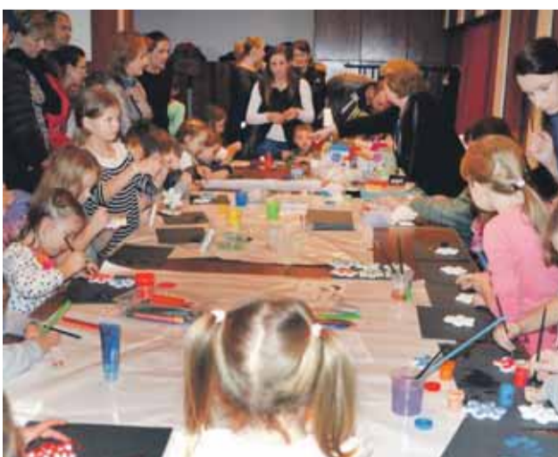
Chvilky plné tvorivosti