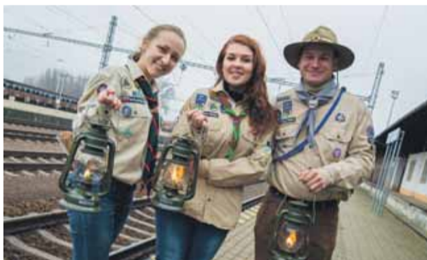
Skautská hliadka po prevzatí svetla v Trenčianskej Teplej