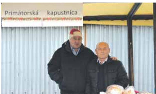
Primátorská kapustnica všetkým chutila