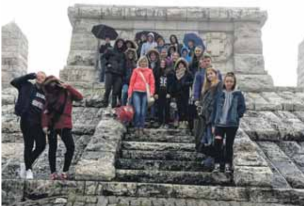
Po stopách Milana Rastislava Štefánika

V októbri sa deviataci vydali po stopách M. R. Štefánika . V Košariskách si prezreli jeho rodný dom, v ktorom obdivovali uniformy, trofeje i model lietadla, v ktorom havaroval. Pútavý výklad im priblížil nielen jeho život a záujmy, ale aj udalosti, ktoré významne ovplyvnili slovenskú históriu. Po zaujímavej prehliadke sa pre-