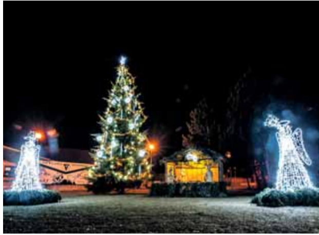
Rozsvietený vianočný strom v areáli mestského múzea