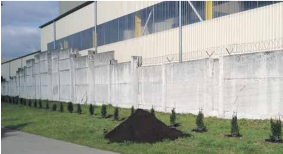
Nové stromy na Ulici Hornov