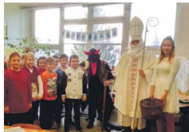
Mikuláš prišiel za deťmi do školy

Neodmysliteľnou súčasťou života detí v predvianočnom období je sv. Mikuláš. Naša škola ho privítala v pondelok 5. 12. 2016. Najmenší v MŠ sv. Gabriela mali pred Mikulášom veľký rešpekt, no niektorí aj strach z čerta. Detičky si pripravili pesničky a básničky. Netajili veľkú radosť z balíčkov, ktoré im nadelil Sv. Mikuláš. Ten sa spolu s anjelom a čertom presunul za žiakov ZŠ, aby sa dozvedel, čo si preňho pripravili a či sa svedomito učia.