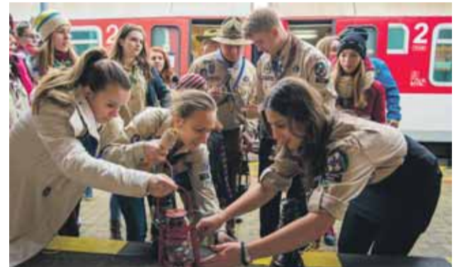
Skauti nesú svetlo vo vlakoch po celom Slovensku