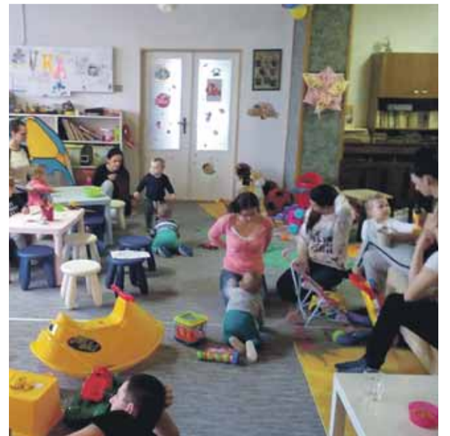
Materské centrum Púpavka