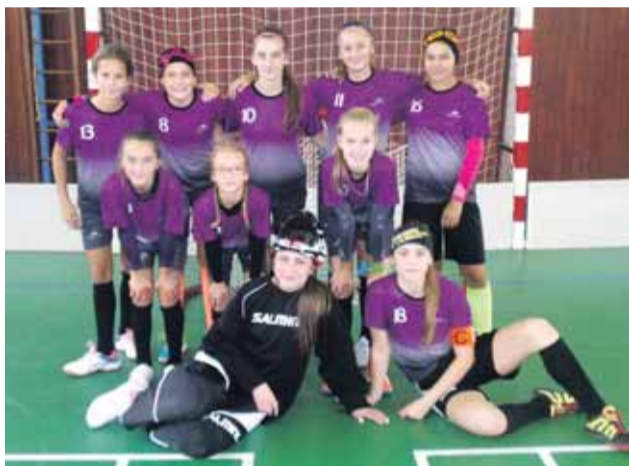
Florbalistky postúpili do krajského kola

Naše florbalistky dokázali svoje úžasné schopnosti na okresnom kole Florbalu žiačok ZŠ , ktoré sa konalo v Omšeni. Po skvele odohraných zápasoch zaslúžene zvíťazili a postúpili do krajského kola, ktoré sa uskutoční 28. 4. 2017 v Partizánskom. Už teraz im držíme palce a všetci dúfame, že dievčatá nadviažu na minuloročný úspech, keď sa dvakrát dostali do celoslovenského finále.