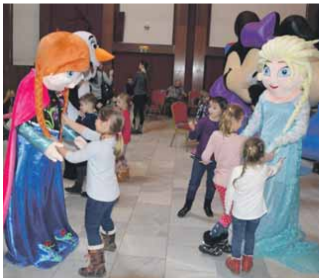
Rozprávkové bytosťi očarili prítomné deti