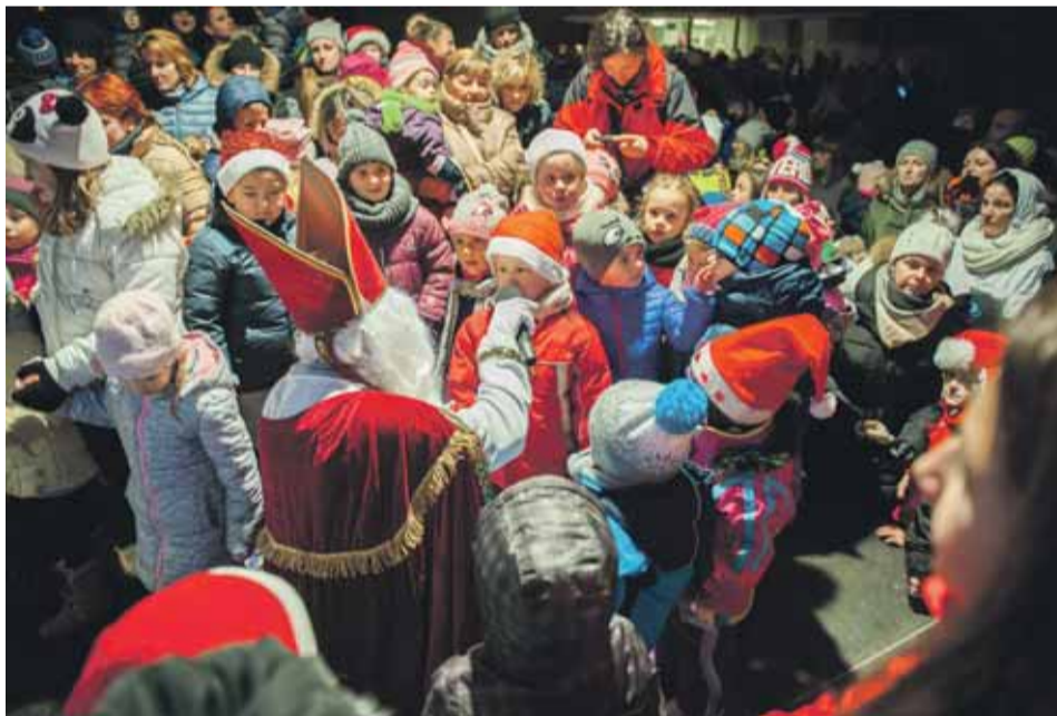
Každé dieťa sa chcelo osobne stretnúť s Mikulášom