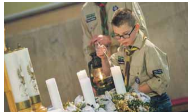
Zapaľovanie adventného venca vo farskom kostole v Nemšovej