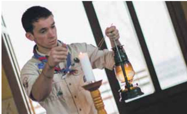
Betlehenské svetlo v Trenčianskej Závade