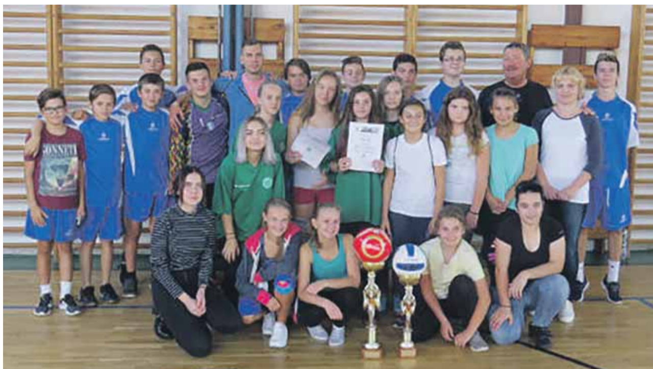
Dvojité turnajové víťazstvo - víťazi vo vybíjanej a v minifutbale