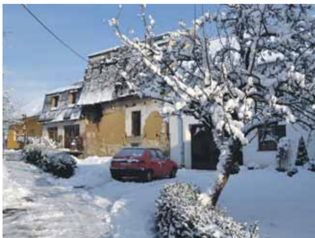
Súčasný stav Králikovho mlynu

Dňa 3. 11. 2016 Ministerstvo pôdohospodárstva a rozvoja vidieka SR zverejnilo na svojej web stránke Výzvu na predkladanie projektových