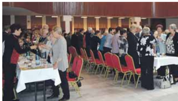
Zaplnená sála počas posedenia dôchodcov