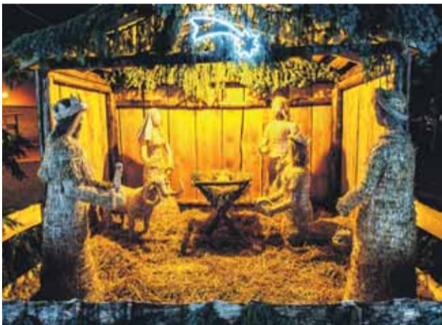
Súčasťou vianočnej výzdoby je aj krásny Betlehem