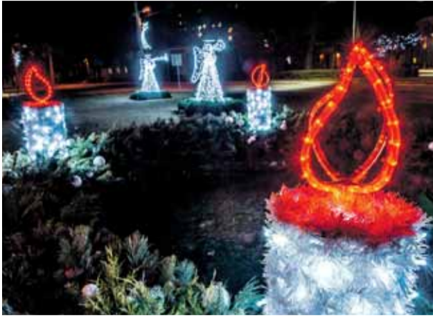
Adventný veniec v centre mesta