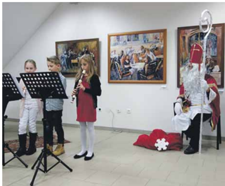
Mikulášsky koncert žiakov hudobného odboru v mestskom múzeu

Základná umelecká škola Nemšová a Mesto Nemšová