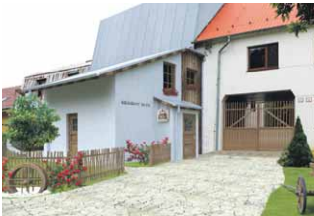
Stav v prípade realizácie projektu