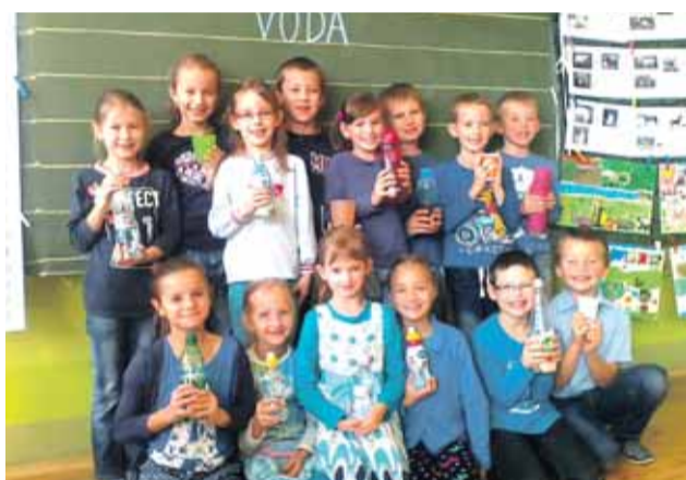
Farebný týždeň zdravia - Modrý pondelok