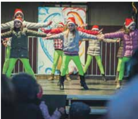
Tanečné vystúpenie detí