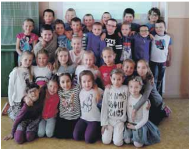
Európsky deň jazykov

Vyučovanie cudzích jazykov zaujíma dôležité postavenie vo výchovno-vzdelávacom procese na našich školách. Už od útleho veku sa deti stretávajú s prvými cudzojazyčnými slovami či už na dovolenke v zahraničí alebo v médiách. I na našej škole sa výučbe anglického jazyka venujeme už od prvého ročníka. Preto sme aj tento školský rok v rámci Európskeho dňa jazykov usku-