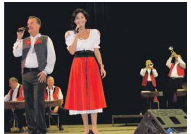
Spevácke duo z kapely Moravanka