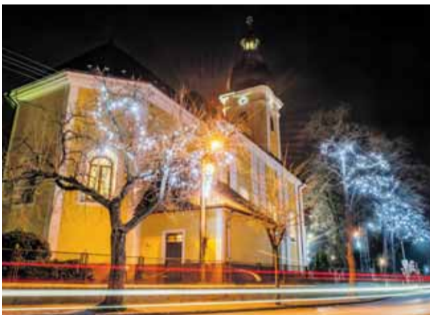
Atmosféru v meste dotvára svetelná výzdoba