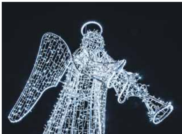
Vianočný anjel na kruhovom objazde