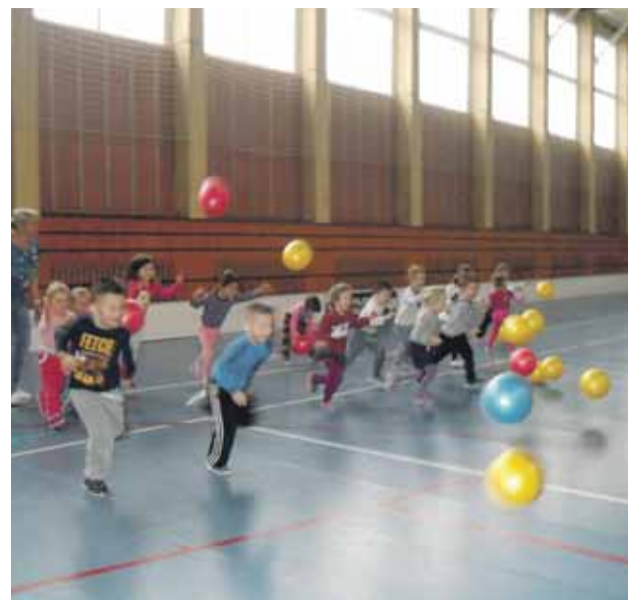
Loptové hry v Športovej hale Nemšová