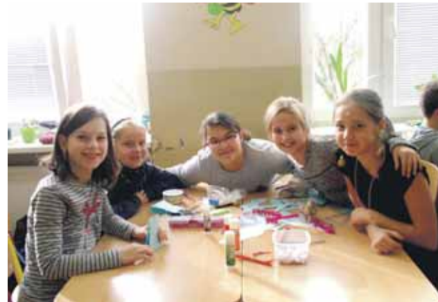
Prijemná atmosféra počas Vianočných tvorivých dielní

Neopakovateľné čaro Vianoc sme odštartovali Vianočnými tvorivými dielňami . Tento rok sme do kreatívnych činností po druhýkrát zapojili aj žiakov druhého stupňa, ktorí nám dokázali, že sa tiež vedú pre niečo nadchnúť. Triedy sa premenili na hniezda rôznych aktivít, vo vzduchu sa niesla radostná nálada. Prijemnú atmosféru umocnila vôňa šíriaca sa po celej škole z čerstvo napečených medovníčkov. Všetci usilovne pracovali, aby výsledok bol čo najlepší. Ich nádherné tvory ste si určite všimli na predajných trhoch v mestskej tržnici.