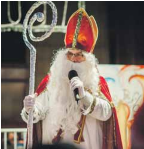
Mikuláš všetkých privítal