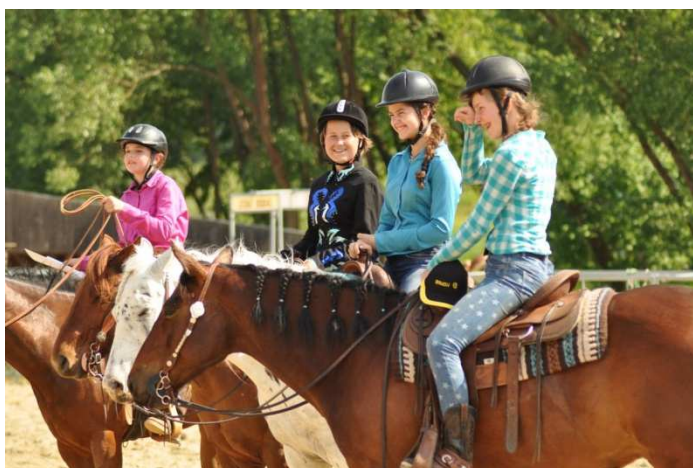
Detské westernové preteky

Majitelia ranča svoje priestory neustále zdokonaľujú. V tomto roku sa začalo z výstavbou veľkej jazdeckej haly, ktorá umožní skvalitniť kurzy, ktorých je každý rok neúrekom. V krásnom prírodnom prostredí poskytnú počas roka svoje priestory nielen kurzom, ale i množstvu súkromných akcií a svadbám a spoločne s Gazdovstvom Uhliská organizoval 20. mája detské westernové preteky.