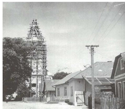
Historická fotografia z opravy kostolnej veže

Svoje 70. výročie oslávila okrem kaplnky v Trenčianskej Závade i veža na farskom Kostole sv. Michala Archanjela. V roku 1915 padla za obeť ničivému požiaru a po opravení v roku 1945 podľahla vojne a bola zostrelená. S jej opravou sa začalo v roku 1947 a odvtedy slúži veriacim