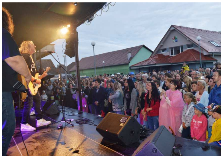
Vystúpenie skupiny Gladiátor

Medzi tradičné sprievodné akcie jarmoku patrili DOD zásobovacej základne I. , otvorenie výstavy gladiol v mestskom múzeu na prízemí, otvorenie spoločnej výstavy profesionálnych výtvarníkov a v sobotu sa v areáli futbalového ihriska v Ľuborči uskutočnil 3. ročník najťažšieho preteku na Považí Champion race . V rámci tvorby prezentačných materiálov bola tento rok vyhlásená súťaž o najkrajší návrh na magnetku s vyobrazeniami mesta. Ocenených