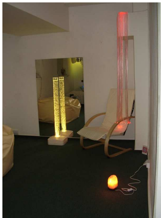
Relaxačná miestnosť SNOEZELEN

V priebehu dňa bola hosťom prezentovaná relaxačná miestnosť SNOEZELEN, ktorá bola dokončená v prvom štvrtroku tohto roka. Prítomní vyjadrili obdiv a uznanie, že zariadenie napreduje míľovými krokmi dopredu, a ocenili, že sa nadviazala spolupráca s úradom práce v Trenčíne.