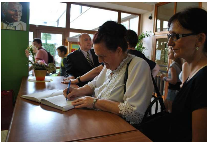
Obrázok 1 Z oslavy 25. výročia založenia školy