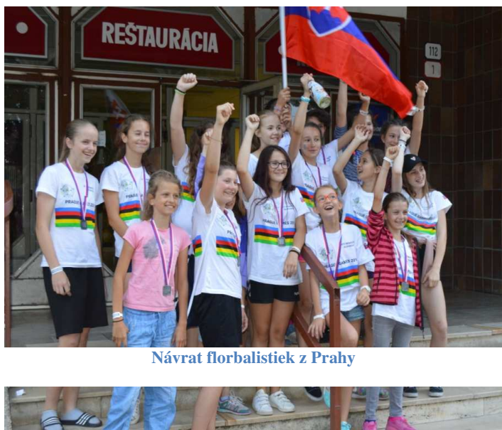
Návrat florbalistiek z Prahy

V kategórii dorasteniek G-16 skončili hráčky Nemšovej v skupine na 3. mieste a v ďalších bojoch porazili Sport Club Klatovy (Česko), ale následne prehrali s tímom Zug zo Švajčiarska.