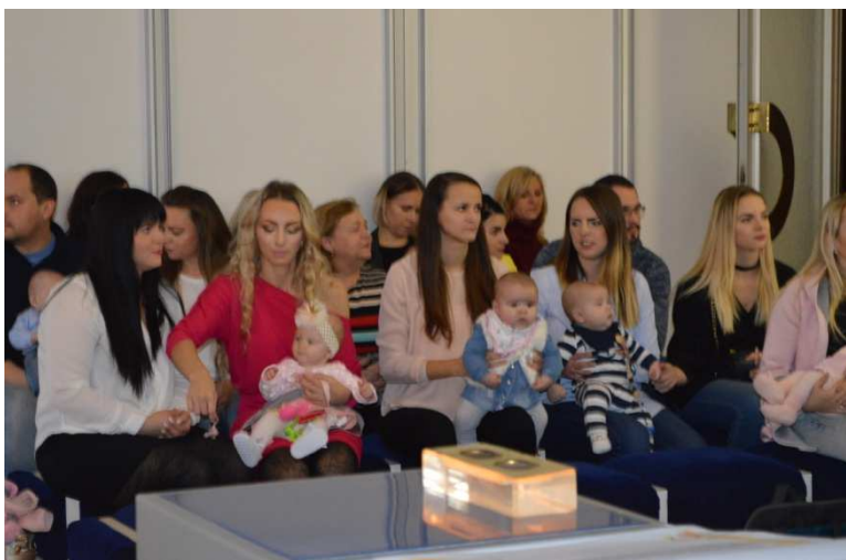
Vítanie detí do života

Zomrelo 73 obyvateľov, 33 žien a 34 mužov. Priemerný dožitý vek bol 71,5. Najstarší obyvateľ sa dožil 91 rokov a najmladší 25. Mestskú časť Nemšová navždy opustilo 51 obyvateľov, m. č. Ľuborča 8, m. č. Klúčové a v m. č. Tr. Závada nezomrel v tomto roku žiaden občan.