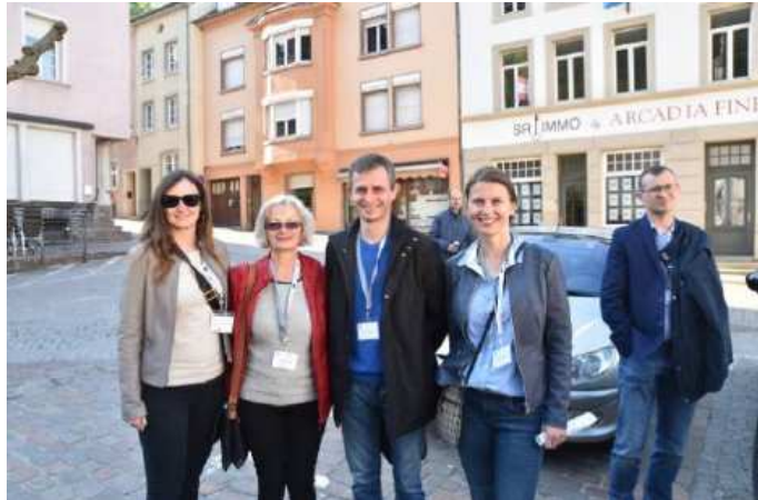
z medzinárodnej konferencie LINC