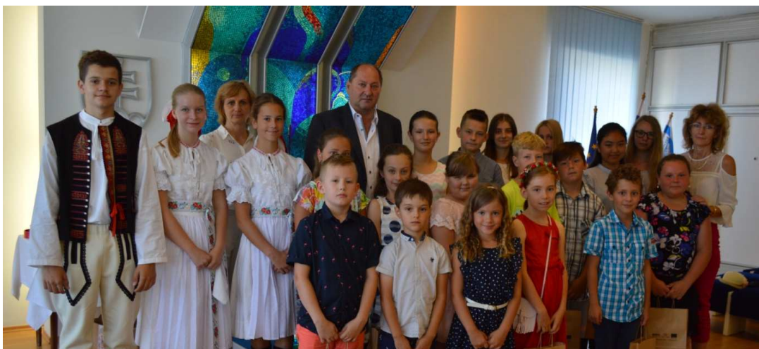
Z oceňovania najlepších žiakov primátorom mesta Nemšová

Mesto Nemšová 27. júna o 9.00 hod. v obradnej sieni Kultúrneho centra Nemšová pripravilo pri príležitosti ukončenia školského roka 2016/2017 slávnostné oceňovanie najúspešnejších žiakov základných škôl pôsobiacich na území mesta.