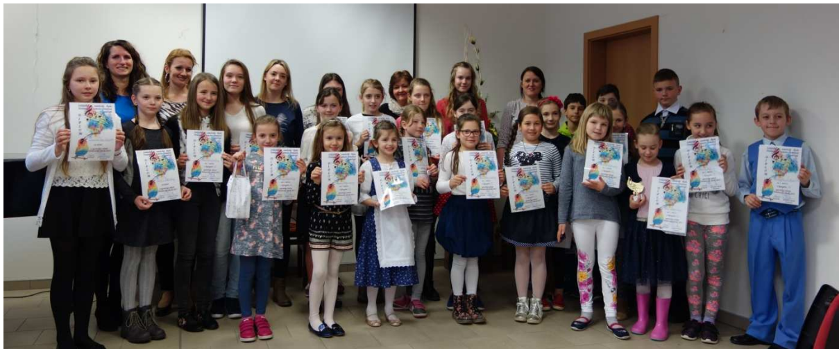
Nemšovský slávik 2017

Máj je pre základnú umeleckú školu charakteristický množstvom podujatí. Úvod patril dvom koncertom pre mamičky, ktoré v Nemšovej zorganizovali 14. a 17. mája učitelia hudobného a tanečného odboru. V dňoch 16., 17. a 19. mája sa realizoval DOD pre MŠ a 18. mája DOD pre verejnosť, následne po DOD 23. - 24. mája sa uskutočnili prijímacie skúšky, 25. mája sa