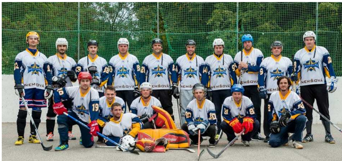
Hokejbalový tím z roku 2015

V Nemšovej sa hokejbalový turnaj uskutočnil 25. februára v športovej hale. Hokejbalisti tímu Heroes Nemšová ukončili tohtoročnú sezónu v Trenčianskej hokejbalovej lige v prvom kole play-off, keď prehrali s tímom Youngsters Dubnica v sérii 1 : 2 na zápasy.