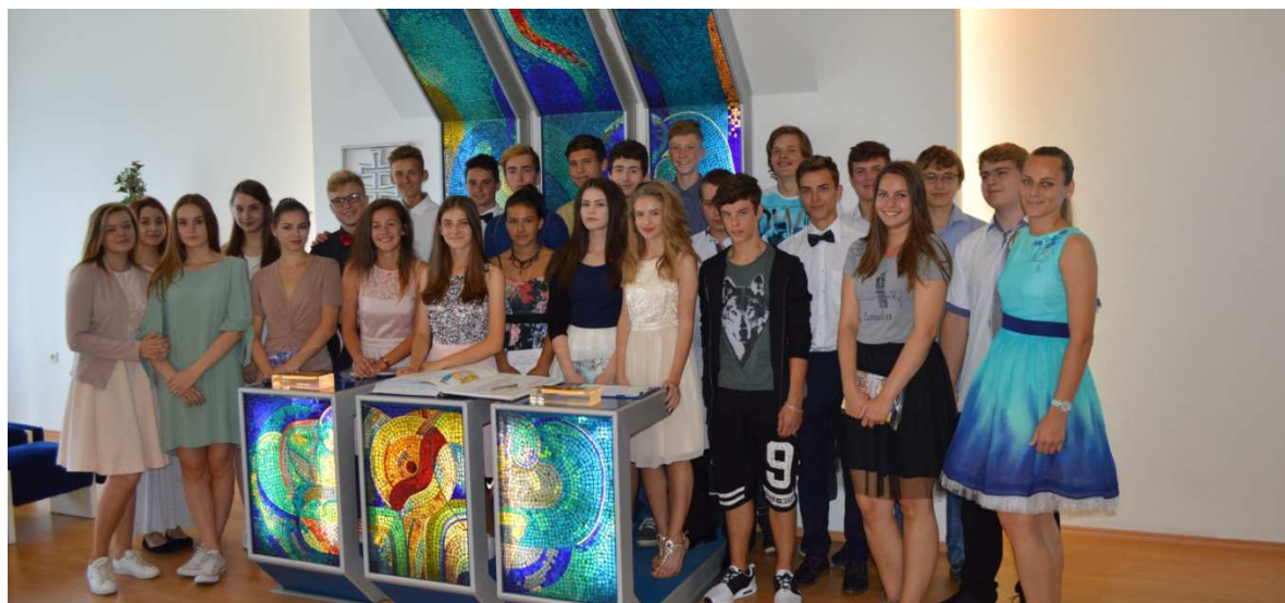
Absolventi ZŠ, Janka Palu 2