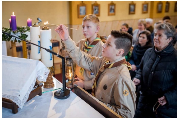
Betlehemske svetlo v kaplnke v Tr. Závade

Každoročne 23. decembra od rána putuje Betlehemske svetlo vo vlakoch po celom Slovensku. Do Trenčianskej Teplej si ho prišli odpáliť aj skautky 117. Zboru Františka z Assisi, priniesli ho včielkam a skautom do Nemšovej a do Horného Srnia. Poobede putovalo svetielko do kostola v Dolnej Súči. Na Štedrý deň ho skauti priniesli do kostolov, na filiálky vo farnosti Nemšová a do mnohých domácností.