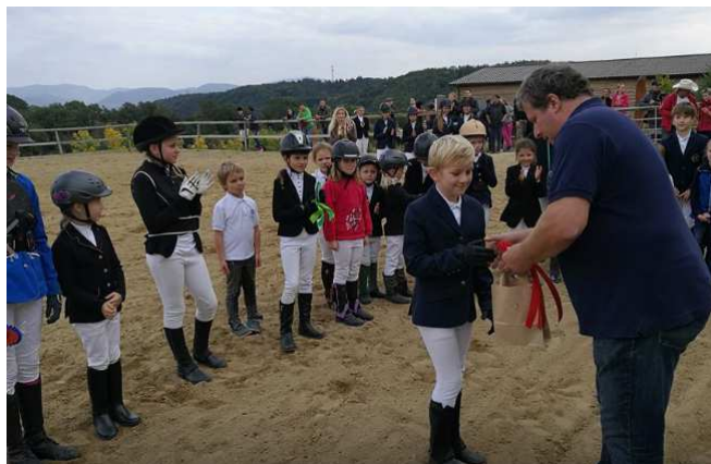
Finále štvorkolovej súťaže Benjamin cup 2017

V priestoroch areálu Gazdovstva Uhliská sa každoročne koná niekoľko súťaží: dňa 6. mája sa konalo prvé kolo Benjamin cupu a 30. septembra jeho finále (preteky pre licencovaných a nelicencovaných jazdcov a kone). Každé kolo sa skladá zo 4 súťaží: 1. Hobby drezúra 2. Parkur kavalety, 3. Parkur krížiky, 4. Parkúr 60 cm (výsledky sú uvedené kapitole Šport).