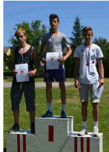
Zo športového dňa detí

Medzinárodný deň detí sa v meste začal oslavovať 28. mája v Ľuborči 4. ročníkom Cesty rozprávkovým lesom . Na trase od Základnej umeleckej školy Nemšová k nemšovskému rybníku a späť bolo pre deti pripravených 10 stanovísk, kde ich čakali rôzne rozprávkové bytosti, ako sú napríklad Bob a Bobek, zbojníci, Snehulienka, Shrek s Fionou či včielka Maja. V areáli ZUŠ Nemšová boli pre deti pripravené i vodné atrakcie a skákanie hrady. Po zábave sa mohli prítomní občerstviť v predajných stánkoch či opieť si pri ohnisku z domu prinesené dobroty. Cestu rozprávkovým lesom absolvovalo približne 220 detí, ktoré sprevádzali ich rodičia a rodinní príbuzní. Vydarený deň zabezpečovalo v spolupráci s mestom Nemšová viac ako 50 detí a dospelých z radov základnej umeleckej školy a 117. zboru sv. Františka z Assisi Horné Srnie – Nemšová. Oslavy MDD pokračovali 1. júna , kedy mesto Nemšová pripravilo atletickú súťaž pre žiakov základných škôl v Nemšovej . Súťažilo sa v kategóriách: beh, hod kriketkou, vrh guľou a skok do diaľky. Najlepší atléti boli odmenení medailou a pamätným diplomom. Oslavy pomyselne ukončilo 8. júna predstavenie pre najmenších v Kultúrnom centre Nemšová, na ktorom si deti zatancovali a zaspievali so známou dvojicou Smejkom a Tanculienkou.