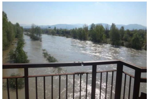
Zdvihnutá hladina Váhu na jar 2017 (pohľad zo železničného mosta)

Počasie vyčíňalo aj 23. júna, kedy počas búrky nevydržala nápor silného vetra veľká lipa na cintoríne v Ľuborči na Ľuborčianskej ulici. V priebehu roka sa na území mesta a v jeho okolí vyskytlo približne 21 búrok.