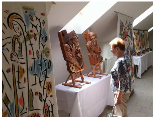
Výstava profesionálnych výtvarníkov z Nemšovej