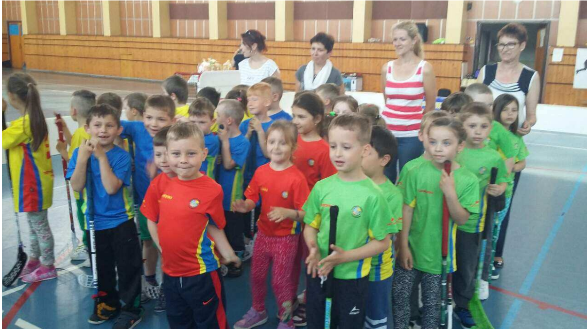
Florbalový turnaj materských škôl