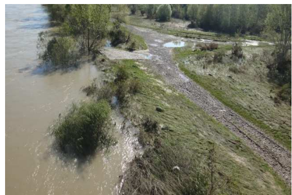
Váh počas klesania vody