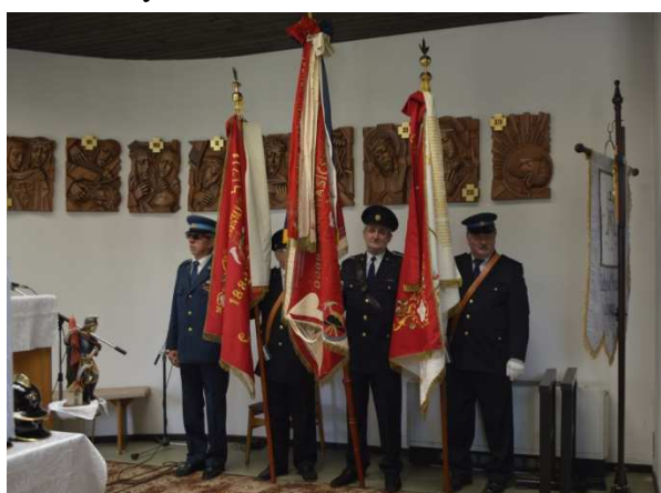
Oslava svätého Floriána v kaplnke Ľuborči

Dobrovoľnícke hasičské zbory z Nemšovej, Ľuborče a Kľúčového si spoločne 6. mája uctili slávnostnou svätou omšou v kaplnke v Ľuborči Svätého Floriána, patróna hasičov . Stretnutie sa organizuje každý rok v inej mestskej Āasti.