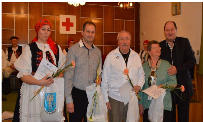
Odovzdávanie plaket dobrovoľným darcom krvi

Na výročnom zhromaždení členov v Kultúrnom stredisku Ľuborča dňa 19.