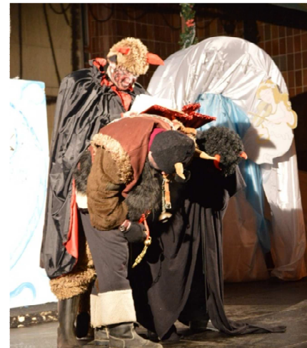
Vítanie sv. Mikuláša