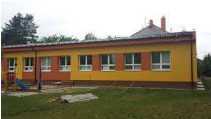
Zrekonštruovaná materská škola v časti Klúčové

Projektu na zníženie energetickej náročnosti objektu MŠ na Trenčianskej ulici bol schválený nenávratný finančný príspevok z fondov Európskej únie a následne bola so Slovenskou inovačnou a energetickou agentúrou minulý rok podpísaná zmluva o jeho poskytnutí. V októbri minulého roka bola odsúhlasená dokumentácia súťaže verejného obstarávania na dodávateľa stavebných prác Slovenskou inovačnou a energetickou agentúrou. Pre nastávajúce zimné obdobie nastal odklad termínu začatia realizácie na apríl tohto roku. Rekonštrukčné práce začali dňa 3. apríla. Práce pozostávali z výmeny všetkých výplní okenných otvorov a otvorov zasklených stien, zateplenia obvodových stien, stropu najvyššieho podlažia, osvetlenie sa vymenilo za energeticky úspornejšie. K 31. máju boli všetky práce ukončené.