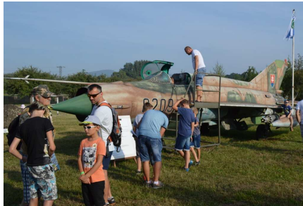
DOD počas nemšovského jarmoku

Základňa pravidelne organizuje dva dni otvorených dverí. Prvý DOD sa konal 2. júna a bol určený pre materské školy. Deti mali možnosť pozrieť si historickú techniku, ukážku strážnych psov a zasúťažili si v hode granátom a v preťahovaní lanom. Najšikovnejšie deti po krátkom nacvičení predviedli vojenský pochod pod velením príslušníčky útvaru a na záver boli odmenené medailou a sladkosťami. Druhý DOD sa pravidelne organizuje v piatok počas nemšovského jarmoku. V tomto roku