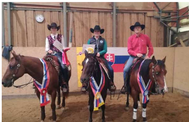
Majstrovstvá Slovenska v reiningu

V dňoch 24. - 25. júna a 5. - 6. augusta sa uskutočnilo medzinárodné westernové preteky – Reining a Cowhorse a dňa 23. – 24. septembra sa na Gazdovstve Uhliská stretli najlepší jazdci na majstrovstvách Slovenska v reiningu. Reining je jedna z najdôležitejších disciplín westernového štýlu jazdenia na koni. Často je popisovaná ako westernová forma drezúry, pretože pre správne vykonanie úlohy je potrebná dokonalá