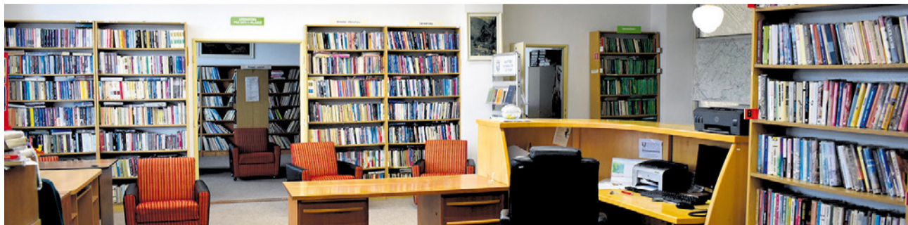
Mestská knižnica Nemšová doplnila svoj knižný fond