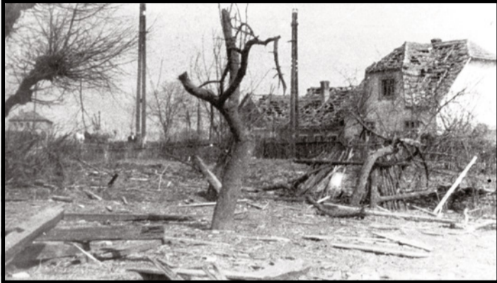
Nemšová po bombardovaní, apríl 1945