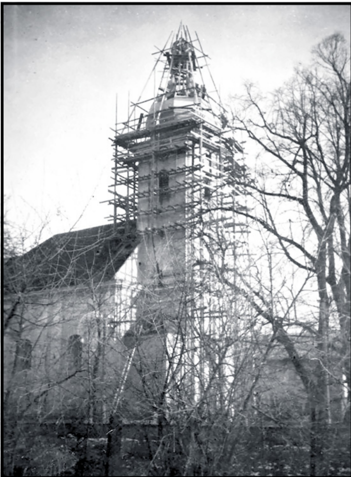
Rekonštrukcia kostolnej veže po 2. svetovej vojne