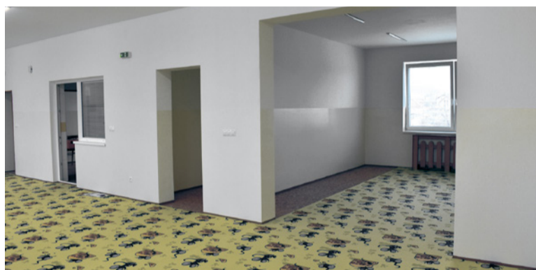
Nadstavba deviatej triedy našej školy