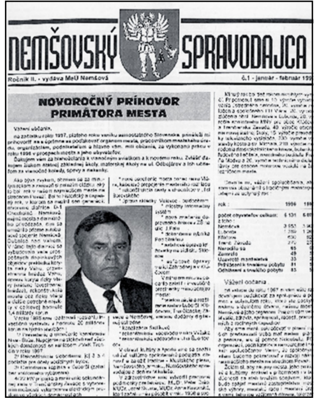
Hlavička Nemšovských novin, 1996