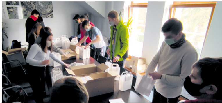
Príprava balíčkov pre seniorov

V čase pandémie sú vysoké dávky vitamínov dôležité na posilnenie imunity, preto v tejto neľahkej situácii plnej neistoty a obmedzení sa mesto Nemšová rozhodlo poskytnúť seniorom nad 65 rokov balíčky, ktoré obsahovali: 2 kusy respirátorov FFP2, vitamín C, vitamín D a citróny. Už v utorok 9. marca 2021 zamestnanci mestského úradu v spolupráci s miestnou skautskou organizáciou 117. zbor sv. Františka z Assisi, Horné Srnie – Nemšová – Dolná Súča začali s doručovaním balíčkov seniorom nad 70 rokov do všetkých mestských častí. V piatok 12. marca 2021 sa úspešne doručili balíčky i seniorom nad 65 rokov. Spolu sa doručilo viac ako 1000 balíčkov obyvateľom s trvalým pobytom v Nemšovej.