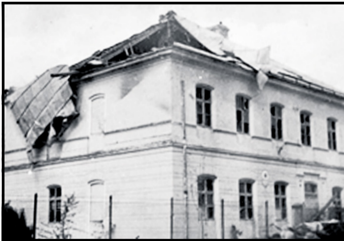
Stará škola (priestor dnešnej pošty) po 13. apríli 1945

Trenčín a okolie až k moravským hraniciam mala brániť 76. nemecká pešia divízia, 8. ľahká divízia a dva špeciálne prapory. Druhé bombardovanie prišlo 10. apríla o 8. hod. Tentokrát bolo mierené na vlársky most pri Luborči a zákopy pri Váhu, kde sa ešte zdržiavali Nemci. Vtedy veľmi utrpel koniec Nemšovej, ktorý bol takmer celý zbombardovaný. Na životoch straty síce neboli, ale niekoľko domov sa zrútilo do základov. Osloboditeľské vojsko bolo už na druhej strane Váhu a Nemci tu na našej strane. Hrozilo im obkolesenie, preto začali ustupovať na Moravu. Naši ostatní vojaci, aby nemuseli s Nemcami bojovať a aby ich niekde neodvliekli, utiahli sa do hôr ako partizáni a tak znemožňovali prácu Nemcom.