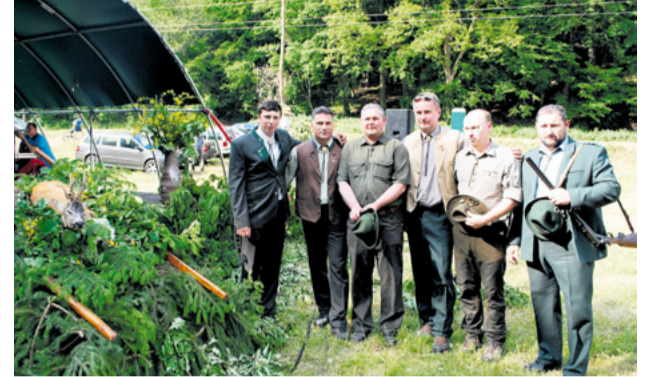
Oslava patróna poľovníkov v Ľuborči sa konala už dvanásťkrát

„Jednou z povinností a vlastností poľovníkov je poznať dobre život zveri, prírodu, staré poľovnícke obyčaje a lásku k prírode a zveri prejavovať ochranou a starostlivosťou o prostredie v ktorom žije. Dôležitým zvykom je svätuhubertska legenda a každoročné oslavy tohto patróna poľovníkov, ktorého odkaz spočíva v zásade, že zver v prvom rade treba chrániť a chovať a až potom loviť.“