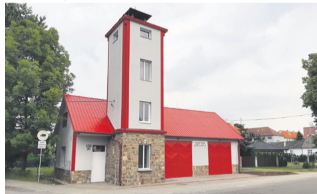
Obnovená požiarňa zbrojnica v Nemšovej

Vynovenú máme aj požiarňu zbrojnicu v Nemšovej. Na jej obnovu boli použité finančné prostriedky z dotácie vo výške 30 000 € poskytnutej Ministerstvom vnútra SR a vlastných zdrojov mesta. Práce realizovala spoločnosť YF Slovakia, s. r. o.