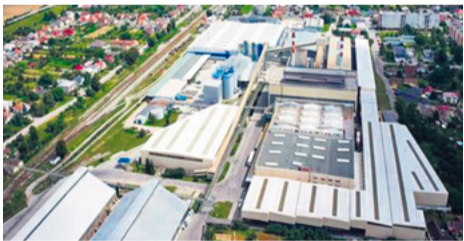
Letecký pohľad na sklárňu

Mnohí z občanov Nemšovej v nej pracovali a pamätajú si časy „starej haly“, rozsiahlej vagónovej dopravy, ručného balenia výrobkov ... Za posledných 15 rokov sa však tvár spoločnosti výrazne zmenila. V súčasnosti disponuje dvoma taviacimi agregátmi s výkonom takmer 700 ton utavenej skloviny za deň, čo predstavuje približne 2,5 milióna vyrobených fliaš denne na siedmich najmodernejších strojoch.