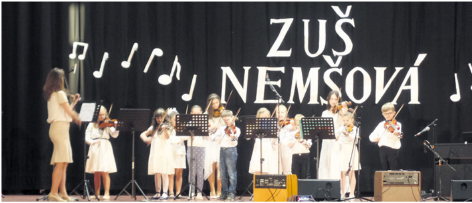
Žiaci Základnej umeleckej školy počas koncertu

Od apríla sa pre našu školu začal kolotoč akcií rôzneho druhu. Naši žiaci súťažili v našich už tradičných interných súťažiach Nemšovský kľúčik, Mozartova klávesa, Tanečná črievička, Dvorecký Dychfest či Kúzlo knihy. Okrem súťaží sme absolvovali množstvo koncertov a vystúpení a to Koncert v Centre sociálnych služieb, výchovné koncerty pre MŠ, vystúpenie v Hornom Srní na literárnej kaviarni, koncert ku Dňu matiek, či Letný koncert v Mestskom múzeu. Výtvarný odbor prezentoval svoje práce v mesiaci jún na vernisáži v mestskom múzeu.