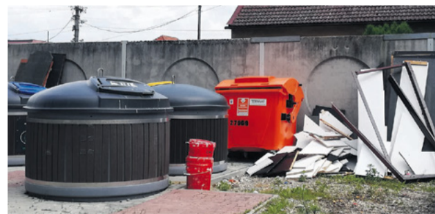
Na odkladanie veľkokapacitného odpadu slúži zberný dvor odpadov