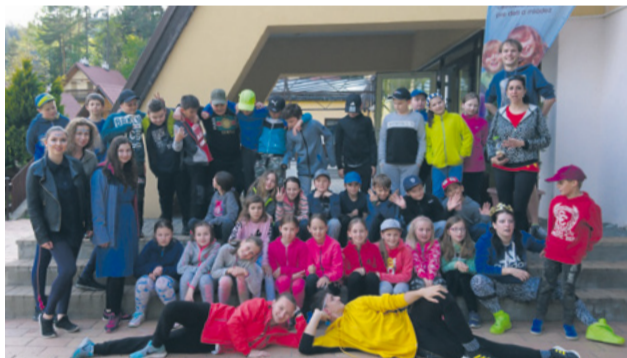
Žiaci strávili 5 dní s bohatým programom

Turistická ubytovňa František v Lazoch pod Makytou – Čertove sa stala na päť dní novým domovom pre našich štvrtákov. Ani zlá predpoveď počasia neodradila deti, ktoré boli plné očakávania a obáv. Hneď po príchode ich privítali skvelí animátori, ktorých animačný program „Záchrana planéty Zem“ upútal nielen žiakov, ale aj pani učiteľky. Pripravené aktivity svojou zaujímavosťou, tvorivosťou a nápaditosťou žiakov priam pohltili a využili tak nevyčerpateľnú detskú energiu. Zábavná a športová činnosť nezostala bokom ani pri jarnom daždi. Deti si odniesli krásne spomienky, spoznali nových priateľov a zažili to, čo by nemali možnosť zažiť doma.