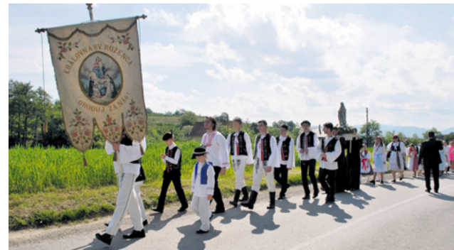
Slávnostný sprievod so sochou Panny Márie putoval do Trenčianskej Závady