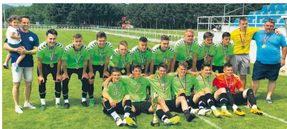
Dorastenci FKS Nemšová - víťazi 4. ligy