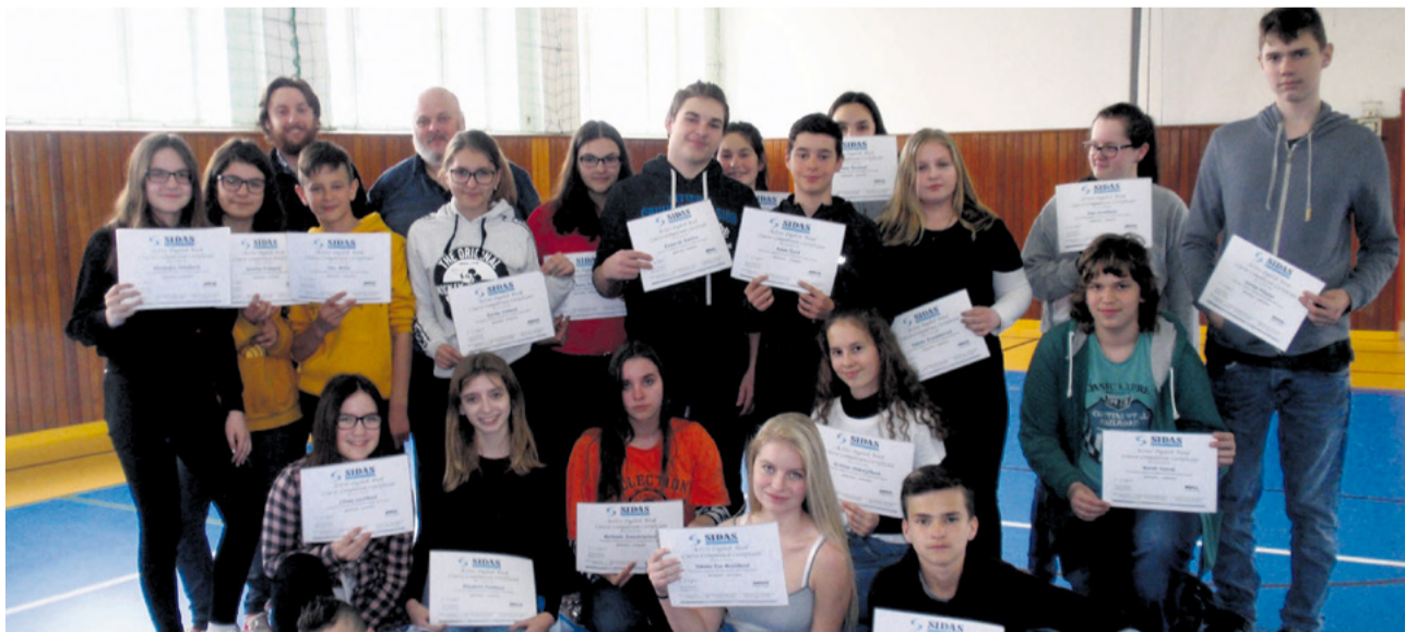
Aktivny anglický týždeň