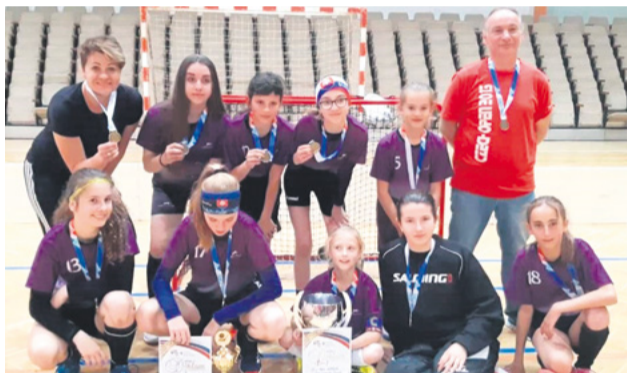
Florbalistky získali prvé miesto