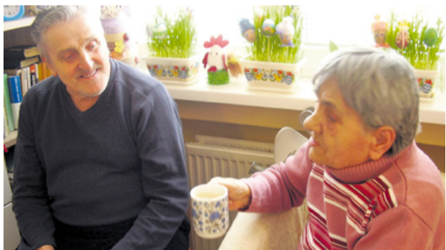
Je dôležité neprehladať a zaujímať sa o skutočné potreby starších ľudí

Aká je vlastne práca pracovníkov v CSS, ktorí pomáhajú prijímateľom sociálnej služby odkázaným na pomoc inej fyzickej osoby.