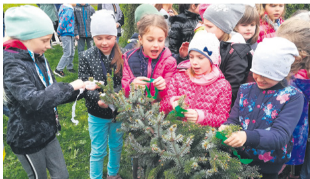
Deti stavením mája oslávili príchod života a lásky

Aj tento rok sme spoločne oslávili narodeniny našej Zeme a uskutočnili sme množstvo zaujímavých aktivít zameraných na zlepšenie stavu zdravia našej planéty. Témou tohto roka boli ohrozené druhy zvierat . Žiaci tretieho ročníka sa zamerali najmä na tie, ktoré žijú na Slovensku a zaujímavým grafickým spôsobom ich predstavili ostatným žiakom školy. Žiaci druhého stupňa si pripomenuli tento významný deň výtvarno-environmentálnymi stvárneniami dverí tried. Veríme, že naša snaha obmedziť alebo pozmeniť svoje doterajšie správanie zanechá v žiakoch aspoň zrnko záujmu a nenechá ich ľahostajných voči miestu, kde žijú. K mesiacu máj neoddeliteľne patrí aj stavenie mája . A tak i deti v ŠKD spolu s pani vychovateľkami oslávili tradičným stavením mája príchod života a lásky. Dievčatá ozdobili máj farebnými stuhami a chlapci ho spolu s pani vychovateľkami postavili pred okná našej školy. Spoločne si v kruhu zapievali piesne, a tak mohli všetci spoločne precítiť silu slovenských tradícií.