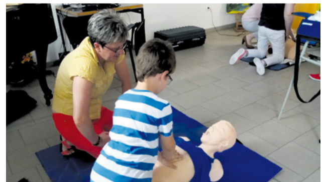
Nácvik resuscitácie na figurine