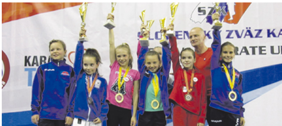
Klub Karate Mugen zaznamenal túto sezónu viacero úspechov