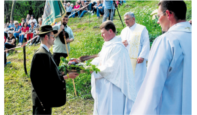
Svätá omša pod Košarmi sa slávila aj so svätuhubertovskými tradíciami