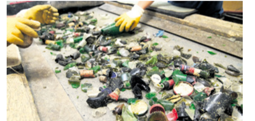
Triedenie črepov na triediacej linke

Sklárňou Vetropack Nemšová získala viaceré certifikáty, ktoré deklarujú kvalitu vyrábaného sortimentu a schopnosť vyrábať bezpečne a hygienicky bezchybné výrobky. V rokoch 2018 a 2019 boli realizované rekonštrukcie oboch taviacich agregátov na biele i zelené sklo, kedy došlo k navýšeniu kapacity na celkovo viac ako 750 ton utavenej skloviny za deň, rozšírenie výrobných hál, vybudovanie štvrtej linky na výrobu sklenených obalov a inštalácia zariadenia na zefektívnenie procesu rekuperácie tepla.