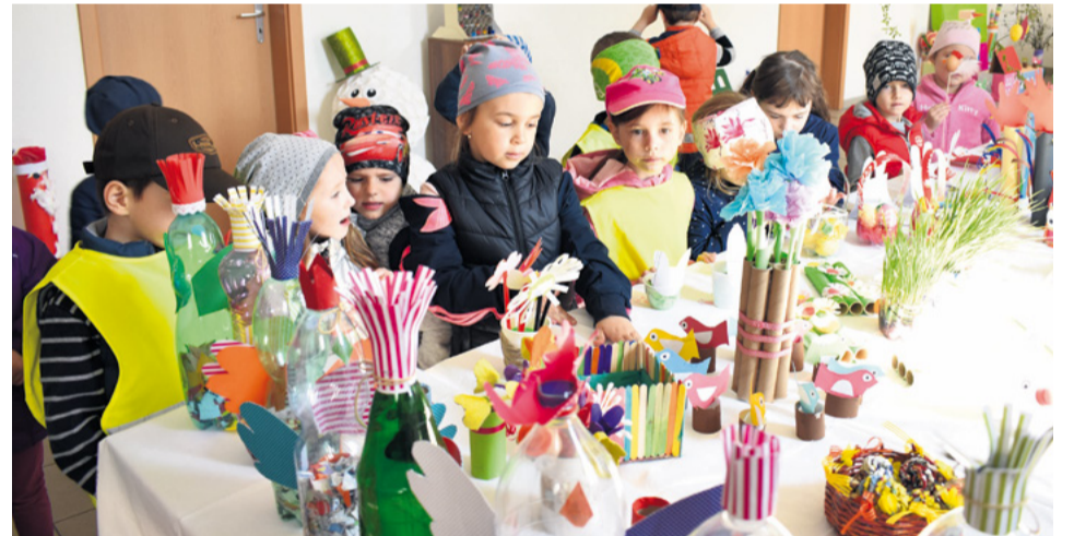
Deti materskej školy na Ekovýstave v mestskom múzeu Nemšová