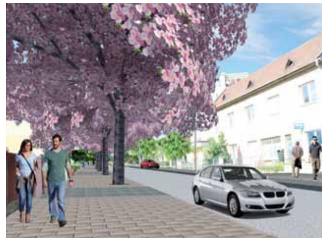
Vizualizácia chodníka na Železničnej ulici v Nemšovej

Pripravovanou investičnou akciou v najbližšej dobe je aj Rekonštrukcia chodníka pre peších na Železničnej ulici v Nemšovej. Aktuálne finišujeme s realizáciou súťaže verejného obstarávania na výber zhotoviteľa.