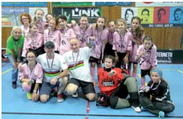
Florbalistky NTS FK-ZŠ Nemšová získali výborné druhé miesto na turnaji Prague Games 2017