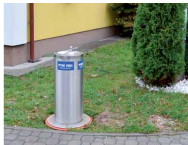
Pitná voda pred budovou Mestského úradu v Nemšovej

Počas horúcich letných dní sa obyvatelia mesta i jeho návštevníci mohli osviežiť vodou z pitnej fontány, ktorú mesto zriadilo pri objekte mestského úradu.