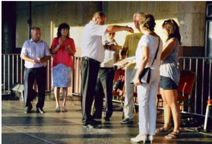
Krst Monografie mesta Nemšová