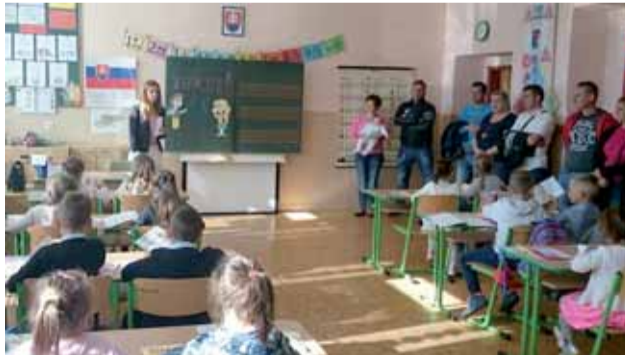
Pani učiteľky privítali nových prváčikov

Zmeny vo vzdelávaní sa tento rok týkajú prvákov, druhákov, tretiačov, piatakov, šiestakov a siedmakov. Už tretí rok sa žiaci vzdelávajú podľa Inovovaného štátneho vzdelávacieho programu, o ktorom rozhodlo Ministerstvo školstva, vedy, výskumu a športu Slovenskej republiky. Štvrtáci, ôsmaci a deviataci sa vzdelávajú podľa pôvodného Štátneho vzdelávacieho programu. Deviatáci majú prvýkrát povinné tri hodiny dejepisu. Každá škola môže určiť povinné predmety v školskom vzdelávacom programe. Naš školský vzdelávací program má názov