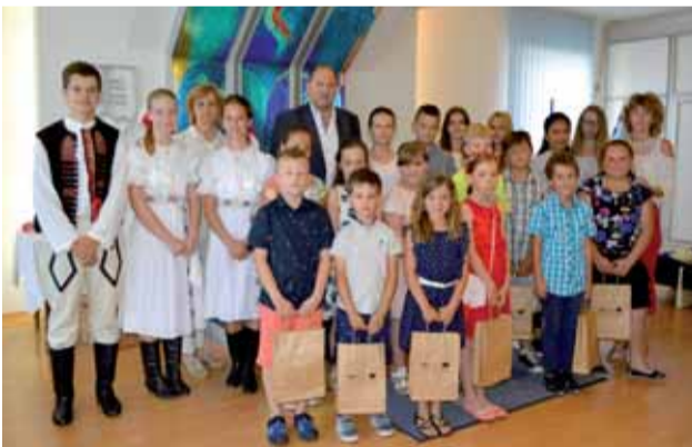
Ocenení žiaci zo Základnej školy na Ulici Janka Palu