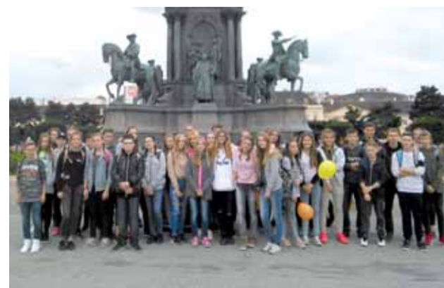
Žiaci navštívili aj historické centrum Viedne