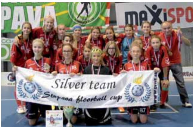
Mladšie žiačky získali v skupine chlapcov výborné 2. miesto