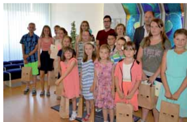
Najúspešnejší žiaci z Katolíckej spojenej školy