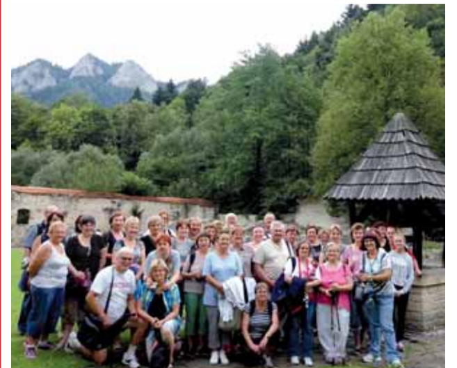
Tri augustové dni na Zamagurí a Spiši