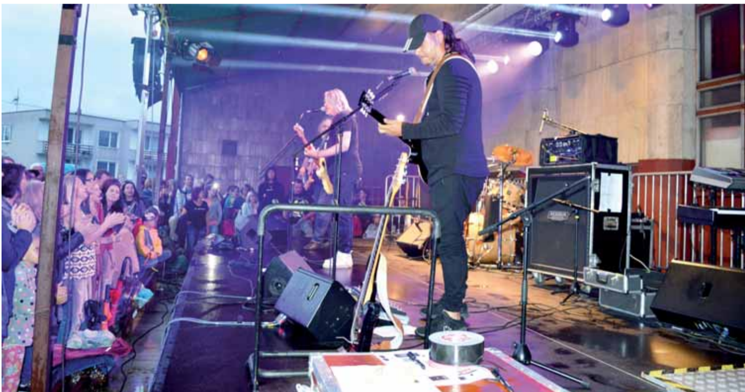
Večerný koncert skupiny Gladiátor