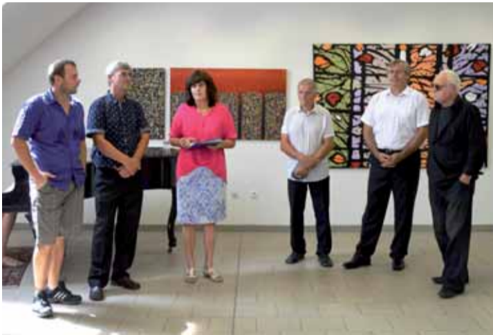
Vernisáž k výstave výtvarníkov z Nemšovej