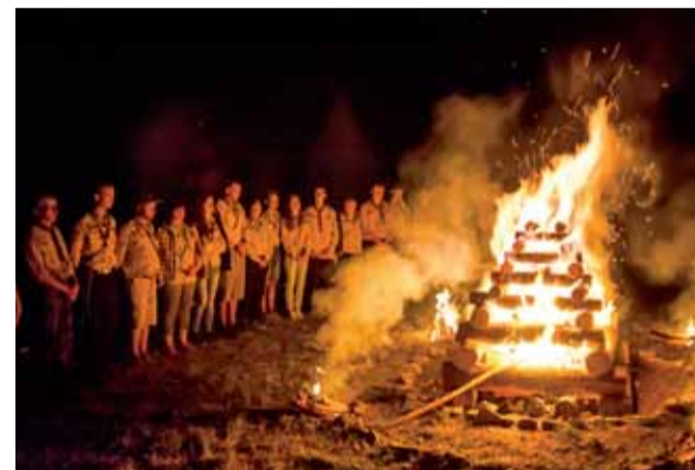
Slávnostný oheň na konci letného tábora