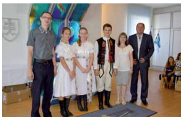
Ocenenie si prevzali žiaci zo Základnej umeleckej školy