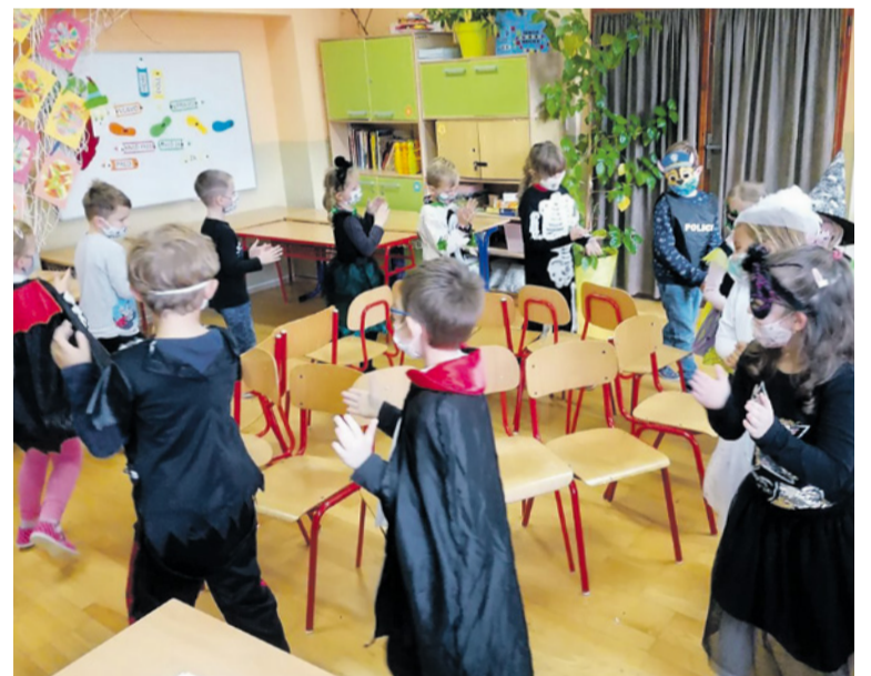
Prváci počas Strašibálu v ŠKD