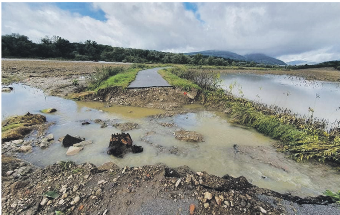
Odklonenie prívlovej vody prerušením cyklotrasy