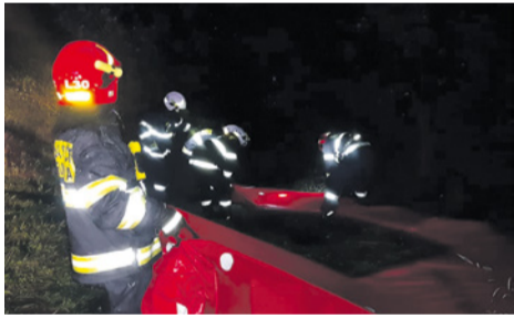
Osádzanie povodňových bariér

Veliteľ vyhlásil poplach a v čase 18:14 na miesto udalosti vyrazila CAS25 RTHP so zásahovou jednotkou 1+5 a protipovodňovým vozikom. Na mieste bolo zistené rozsiahle zatopenie oblasti medzi telesom hrádze (cyklotrasou) a železničným valom, z ktorej sa voda dostávala cez korunu hrádze a hrozila neriadena perforácia. Jediným možným riešením bolo perforovať hrádzu kontrolovane, a to prostredníctvom ťažkej techniky. Do príchodu techniky sme sa na mieste snažili inštalovať povodňovú bariéru, čo sa pre silný prúd v danom mieste čiastočne podarilo a stlmiť tak povodňovú vlnu.