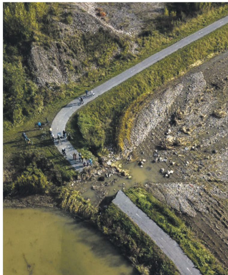
Cyklotrasa Nemšová-Horné Srnie - odvrátenie nebezpečenstva povodne