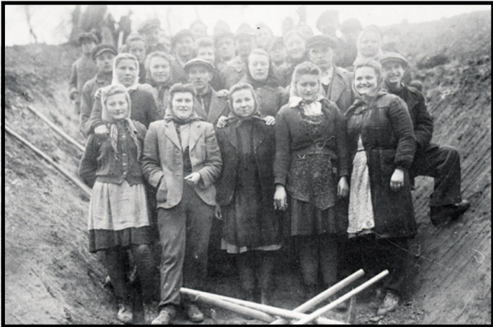
Kopanie zákopov, 1944