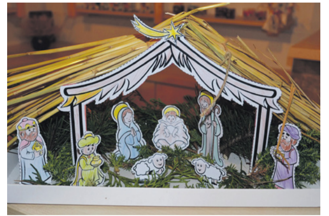
Model Betlehema s papierovými maketami postáv

brodili strmou cestičkou na vrch s fakľami v rukách, sa slúžila slávnostná svätá omša. Po údolí sa niesol spev a občania z okolitých dedín si mysleli, tak ako to zachytil kronikár, že vrch horí. Prežitím príbehu narodenia opísaného v Biblii chcel František upozorniť spolubratov aj miestnych ľudí na maximálnu chudobu, v ktorej sa Boh rozhodol prísť na svet. Tajomná atmosféra svätej omše, okamihu narodenia Ježiša ožiarená stovkami fakieľ, zbožnosť a vrúcnosť na prítomných natoľko zapôsobili, že aj po jeho smrti si slávnosť pri Betleheme rovnako pripomínali. Obyvatelia Greccia si sami pripravovali živé aj umelé betlehemy a podľa Františkova príkladu si rozdávali darčeky, aby napodobnili lásku Boha, ktorý sa nám sám dal ako dar. Táto tradícia sa veľmi rýchlo rozšírila po celom Taliansku, ale aj v Európe a v 13. storočí bol prvý betlehem už aj u nás na Slovensku.