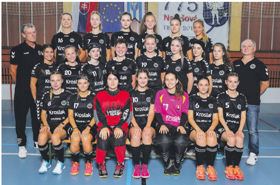
Florbalistky Nemšovej 2020