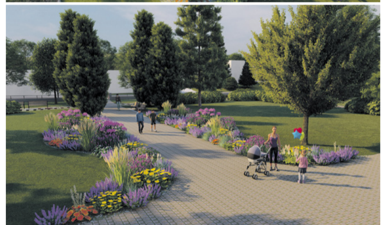
Projekt vodozádržného opatrenia - spracoval ArchArt s.r.o.