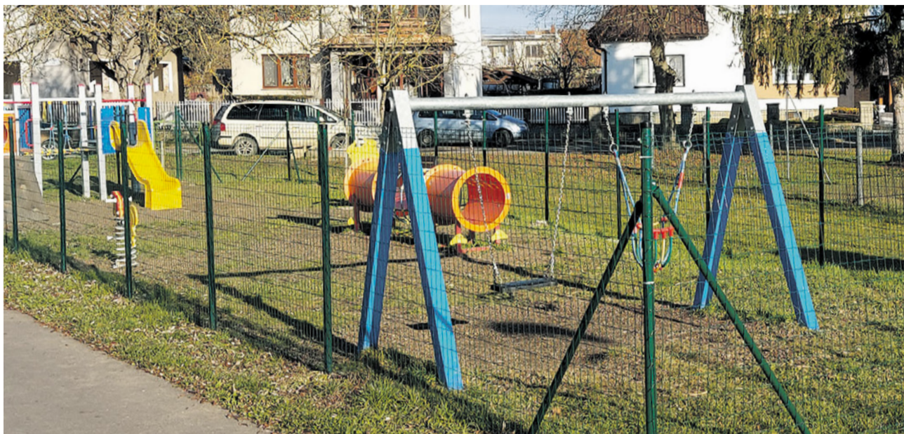
Investícia do detského ihriska na Vlárskiej ulici

Aj napriek tomu, že na tento rok budeme skôr spomínať ako na rok, keď všetky plány a projekty museli ustúpiť, predsa sa život ani napriek obmedzeniam nezastavil a aspoň časť stavebných plánov sa podarilo zrealizovať. Za všetky spomeňme aspoň niektoré.