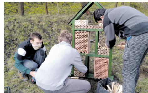
Rangeri sa pustili do výroby hmyzích hotelov