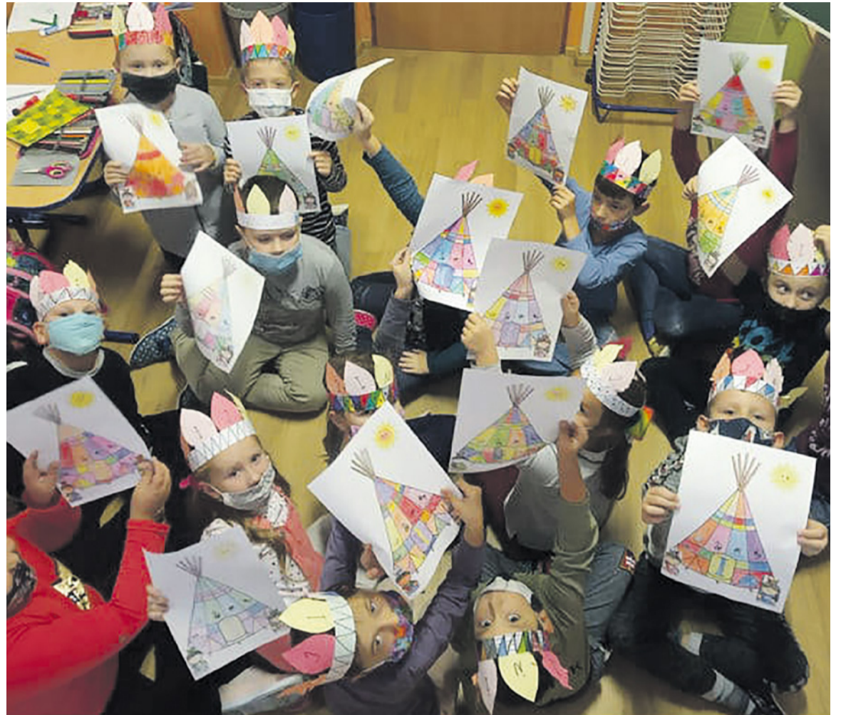
Prváci počas indiánskeho dňa

Nezisková organizácia Centrum Slniečko v spolupráci s Národným koordináčnym strediskom pre riešenie problematiky násilí na deťoch pri MPSVaR SR, pod záštitou prezidentky Slovenskej republiky Zuzany Čaputovej pripravili už siedmy ročník celoslovenskej Bubnovačky – „Aby bolo deti lepšie počuť!“ Do podujatia, ktoré má 19. novembra 2020 symbolicky upozorniť na dôležitosť ochrany detí pred násilím a potrebu včasnej prevencie, sme sa