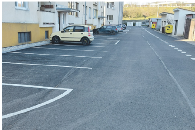
Opravený vnútroblok na Moravskej ulici