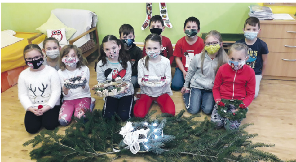
Tvorba adventných venčekov v 2.A