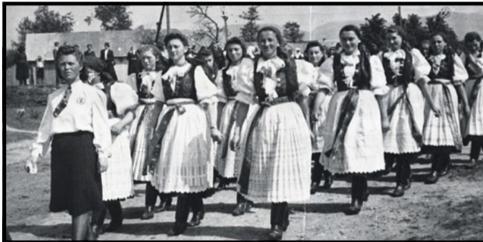
Ženy v krojoch počas Slovenského štátu