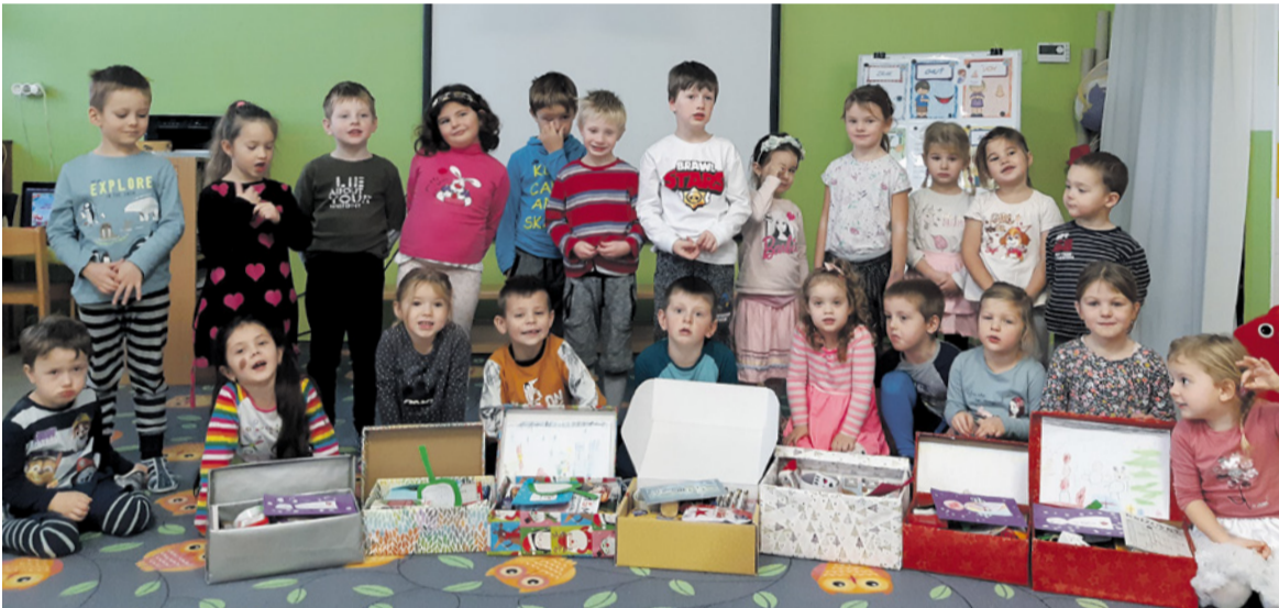
Koľko lásky sa zmestí do krabice