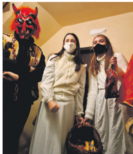
Svätý Mikuláš navštívil aj členov 117. zboru

tivity, ktorými si priblížili život ľudí počas vlády komunizmu. Vyrábali si transparenty, sledovali dokumenty o revolúcii a počúvali hudbu z toho obdobia, zdržiavali sa potravín dovezených z cu-