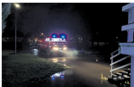
Povodňová situácia pri mestskom kúpalisku

Cyklotrasa na Horné Smrie je teda z uvedeného dôvodu neprejazdná a platí zákaz vstupu pre hroziace pády stromov z podmytých koreňov. Následne nám bol občanmi nahlásený ďalší prípad – silne zatopený priestor pred kúpaliskom, kam sme nasadením 3 dopravných vedení odčerpávali vodu do koryta Vlár. Nakoľko zatopenie spôsobovala vzdutá kanalizácia, komplikácie sme napokon museli riešiť osadením 3 povodňových bariér a na základňu sa vrátili po 6 hodinách o 00:10. Technika bola ošetrená a zaradená do pohotovosti v čase 00:15. Na zásahu sa nikto nezranil.