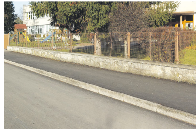
Nový asfaltový povrch chodníka na Školskej ulici