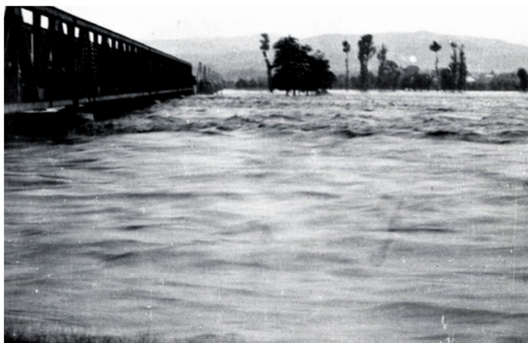
Veľká voda na rieke Váh v roku 1965

Pre obce nachádzajúce sa v sútoku riek Váh a Vlára je pochopiteľné, že sa v minulosti často pasovali s povodňami, nie ako dnes, kedy nás upravené korytá riek a protipovodňový systém často ochraňujú pred nečakanými prívalmi vôd. Z dôvodu opakujúcich sa záplav sa v 30. rokoch začalo pracovať na regulácii tokov. Najstaršia povodeň v miestnych kronikách 20. stor. bola zaznamenaná v roku 1919 a spôsobila ju prietrž mračien na Morave. Strhla so sebou drevený nemšovsko-luborecký most. V roku 1943 následkom nesmierne daždivého dňa z 9. na 10. júla sa vylial Váh a zaplavil obec až k školskej záhrade (dnešná pošta) tak, že bola asi 40 hodín pod vodou. Živelná pohroma potrápila obyvateľov i v roku 1947, kedy mimoriadne suché počasie zapríčinilo veľmi slabú úrodu obilia i krmív a k tomu sa 2. júla spustila veľká búrka spojená s krupobitím a zničila úrodu na nepoznanie. Následkom toho sa musel znížiť stav dobytku, pretože gazdovia nemali dostatok zásob na udržanie doterajšieho stavu.