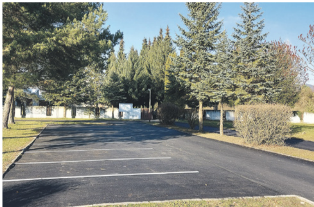
Obnovené parkovacie miesta na cintoríne