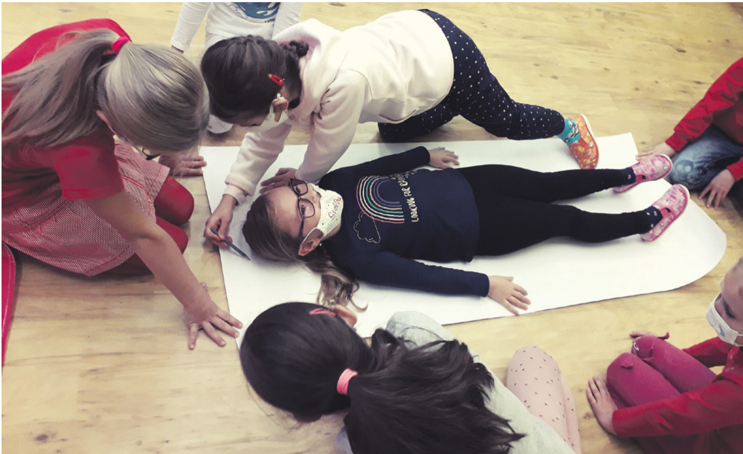
Týždeň zdravia - prvá pomoc

NASTAL ADVENTNÝ ČAS, KEĎ KAŽDÝ Z NÁS BY SA MAL STÍŠIŤ, ZAMYSLEŤ SA NAD PRAVÝMI DUCHOVNÝMI HODNOTAMI A PRIPRAVIŤ SA NA NARODENIE JEŽIŠKA. AKO PREŽÍVAME TOTO OBDOBIE V NAŠEJ ŠKOLE?