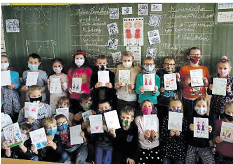
Druháci so svojimi knihami o Danke a Janke