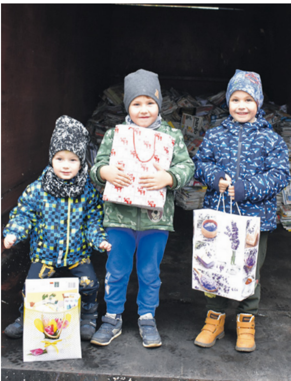
Zberom papiera sme zachránili 24 stromov

Nehádzame všetko do jedného vreca, a preto každoročne organizujeme zber papiera. Vedeť deti k ochrane prírody a vstupujeme im tie najdôležitejšie návyky, ktoré si zo škôlky odnesú do života ako zautomatizované správanie sa zodpovedného človeka.