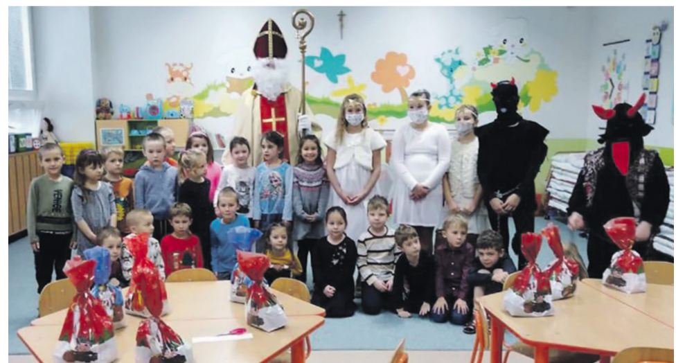
Mikuláš v MŠ sv. Gabriela