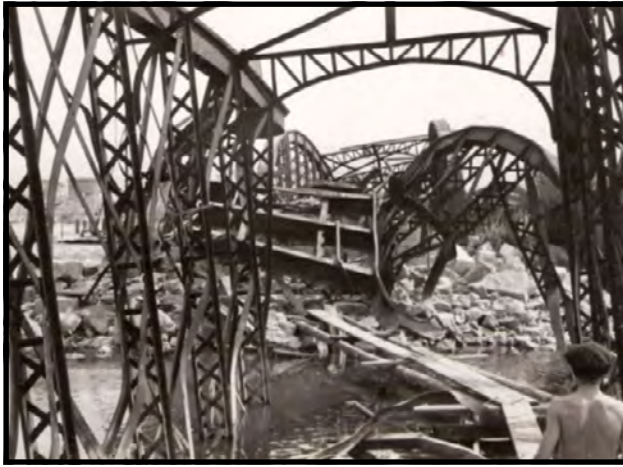
Odstrelený železničný most v roku 1945

„...Nemci prišli aj do domu, ktorý stojí vpravo od školy v Ľuborči. Žil tam taký starší pár, tiež im povedali, aby sa vystaňovali, že im môže zobrať chalupu, ale oni povedali, že ak ich má zabiť, tak nech umrú doma. Zobrali duchny a schovali sa do šopy vzaďu za domom. Stodola tam na tom istom mieste stojí aj dnes, ale druhá. Schovali sa za jeden zo štyroch murovaných stĺpov, ktoré stáli na rohoch stodoly, a keď to buchlo, boli práve tam. Výbuch im zobral chalupu. Stodolu tlaková vlna zobrala od výšky cca 1,5 metra, ale oni vyšli spod trosiek stodoly živí a zdraví.“