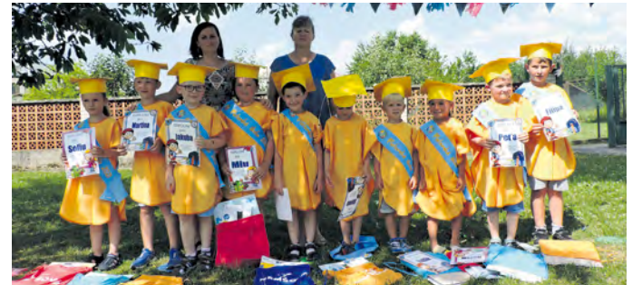
Rozlúčka predškolákov - trieda na Ulici Kropáčihó

Keďže nám nebol dopriať už druhý školský rok prežiť takpovediac plnohodnotne, tohtoročná jar bola v plnom nasadení. Intenzívne sme sa venovali výchovno-vzdelávaciemu procesu bez doplnkových aktivít, ktoré aj tak bolo možné realizovať iba v obmedzenom režime.