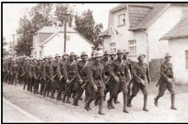
Vojaci rumunskej armády

„Najskôr len pár hliadok. Nikto ich nepristavil, nik sa ich nič nepýtal, nechali ich len tak ísť... Pamätám si, ako išli Rumuni po horách a lúkach, nie po ceste, ale krížom. Ako zvedavé decká sme to pozorovali. Stáli sme obďaleč a hľadeli na príchod rumunskej armády. Rumuni boli chudobnejší, ale boli slušní, nerobili zle. Boli radi, keď im niekto niečo ponúkol.“