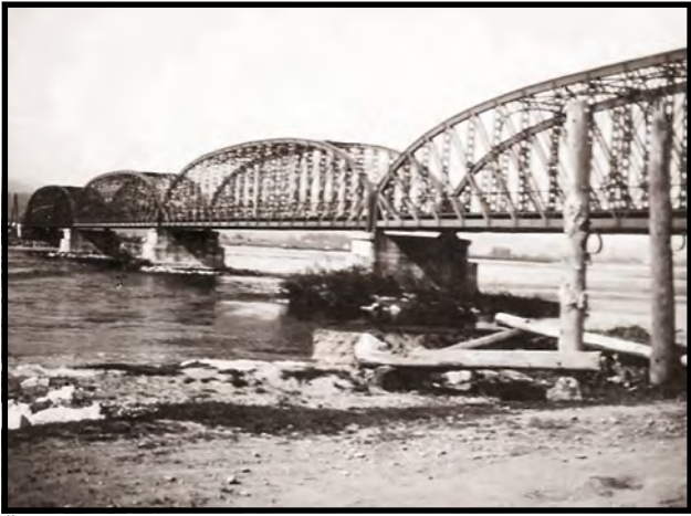
Štvoroblúkový železničný most cez rieku Váh