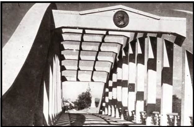
Most T. G. Masaryka cez rieku Vláru, s bronzovým portrétom