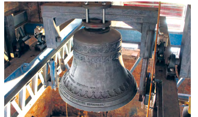
Hlavný zvon svätého Michala archanjela