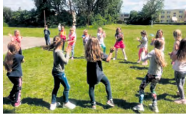
MDD v škole

Prvý jún aj tento rok tradične patril všetkým našim deťom. Tie dostali k MDD od Mestského úradu v Nemšovej sladké prekvapenie a nezabudli na ne ani ich pani učiteľky. Vyučovanie prebiehalo vo veselej nálade, niekde si dokonca mohli vyskúšať učiť samotní žiaci. Aj pani vychovávateľky v ŠKD