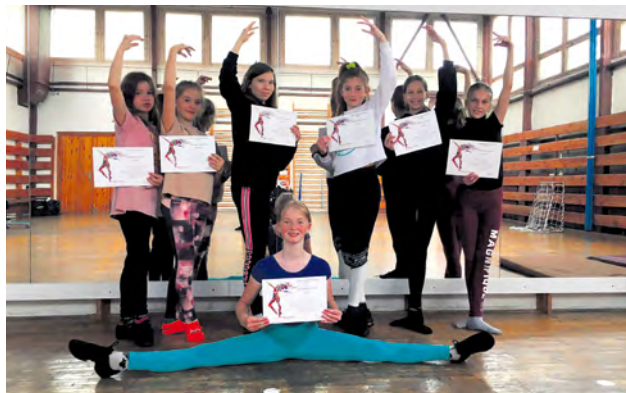
Tanečná skupina ELIS