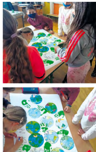
Aktivity na Deň Zeme