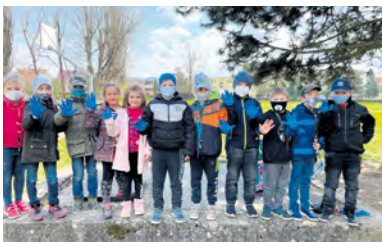
Pripomenuli sme si Deň Zeme

V apríli sme si pripomenuli Deň Zeme . Druháci vytvorili plagát s odkazmi pre našu Zem, žiaci tretích ročníkov vyčistili okolie školy, jedálne a hrádza rieky Váh a nazbierali dve vrecia odpadu rôzneho zloženia. V ŠKD popoludní sadili rôzne semiačka a vytvárali z odpadového materiálu zaujímavé dekorácie, čím prispeli k väčšej čistote našej modrej planéty.